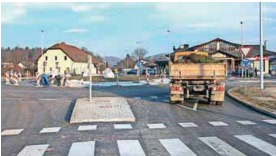
V začetku decembra je stekel promet po novozgrajenem krožišču v Zbiljah.