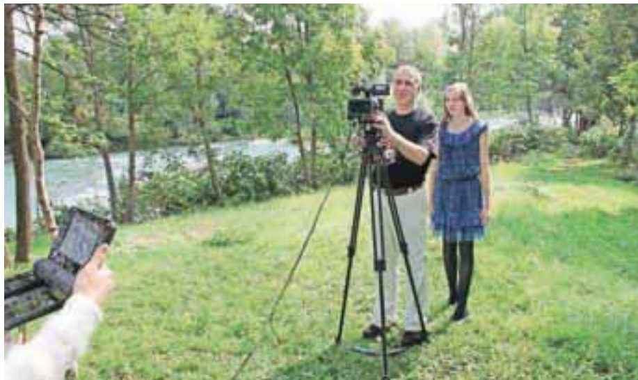
S snemanja eksperimentalnega filma Poezija med vodami KUD JaReM, ki je sicer stalni udeleženec filmskih srečanj.