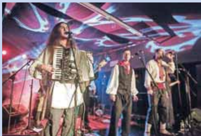
Glasbena daritev 'poganskim' bogovom: Svarica

Na koncu večera je zavel tudi hladen severnjaški veter: z daljne dežele tisočerih jezer, zibeli metal glasbe, je simfonična epska death-metal zasedba Brymir z veličastnimi melodijami, dodelanimi rifi, prečiščenimi solazami in harmoničnimi finesami, ki poslušalca vlečejo v mistične višave, obudila vzdušje skorajda pozabljenih časov, sicer