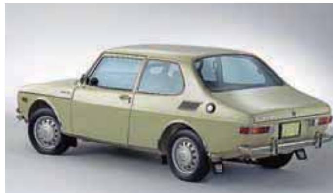
SAAB 99, avto, ki so ga za svojega vzeli visoko izobraženi ljudje.