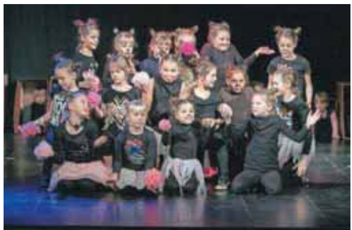
Otroška jazz skupina