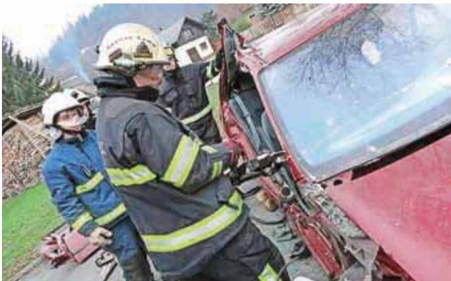
Preški gasilci so se usposabljali na vaji tehničnega reševanja.

Gasilci se bodo v prihodnjih dneh pa do konca leta s koledarji odpravili po domovih. Zato