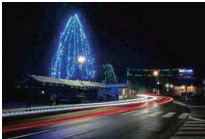
Za okrasitev smreke pri trgovskem centru so porabili štiristo metrov lučk.