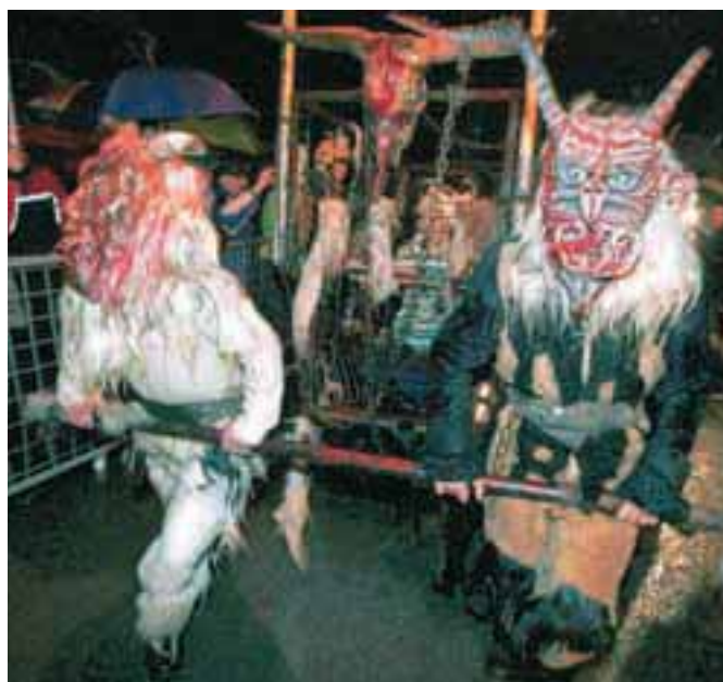
Iz lesene kletke goričanskih parkeljnov so preplašeno gledali ugrabljeni otroci.