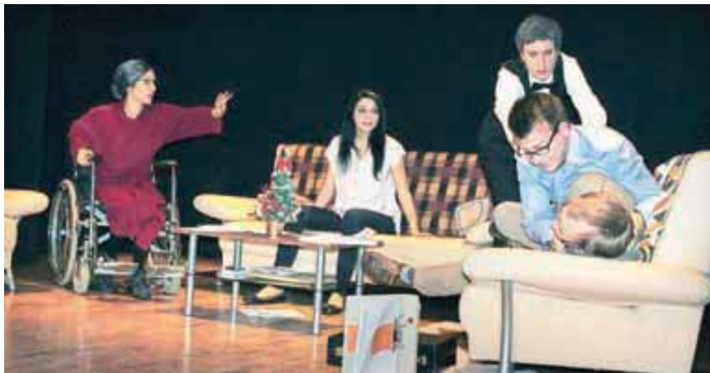
Goljufivi poslovnež se je fizično lotil davčnega inšpektorja, ki je prišel na zasebni obisk ...

Zgodba pripoveduje o uspešnem poslovnežu, kateremu je nekoč davkarja po pomoti pripisala ena ga otroka. Zgrabil je priložnost ... Potem pa se je napovedal davčni inšpektor in vse, kar si je spretni poslovnež pripisal, je bilo treba utemeljiti in dokazati ... Dramatik je očitno dobro poznal psihologijo takih goljufov, saj je vse sodelujoče dobro okarakteriziral z vsem pretiravanjem pri tem početju. Seveda je v dogajanje vpletena tudi ljubezen. V komediji je kar nekaj nepričakovanih preobratov,