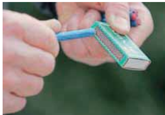
Pirotehnične izdelke z učinkom poka je dovoljeno uporabljati le med 26. decembrom in 2. januarjem, nikakor pa ne petard in druge močne pirotehniko.

Poleg tega da je pokanje za mnoge neprijetno, jim vzbuja strah in nelagodje, se je treba zavedati, da so zaradi uporabe glasnih pirotehničnih izdelkov preplašene tudi živali. »Nepremišljena, neprevidna in objestna uporaba pirotehničnih izdelkov pa lahko povzroči tudi telesne poškodbe, kot so opekline, raztrgane roke, poškodbe oči in podobno, opozarjajo policisti, ki so prve primere poškodb letos že obravnavali. Tako so pred dnevi poročali o 15-letniku iz Pivke, ki je na tla postavil petardo, prižgal vžigalno vrvico, petarda pa mu je počila pred obrazom in ga poškodovala. Zaradi opeklin so ga odpeljali v Univerzitetni klinični center v Ljubljani.