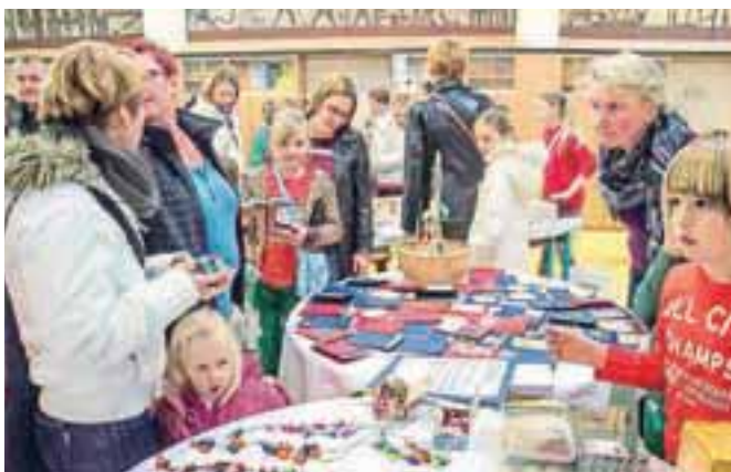
Praznični sejem so pripravili tudi v Osnovni šoli Simona Jenka Smlednik.