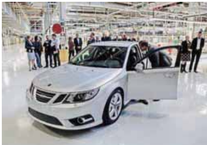
Kitajci, Japonci in Švedi so s skupnimi močmi in denarjem poslali saaba zopet na cesto.