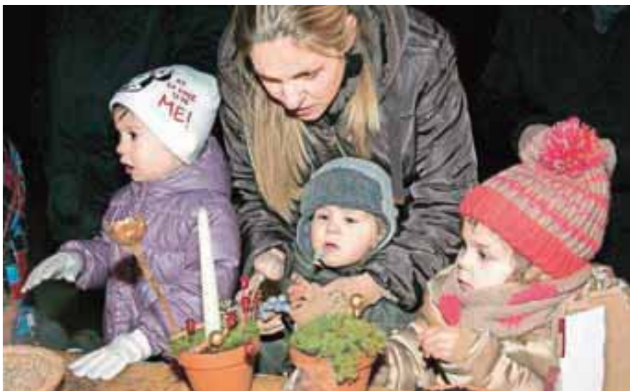
Simbolični prižig lučk so pospremili z ustvarjalnimi delavnicami.