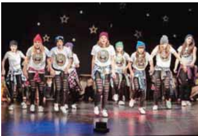
Hip hop mladinska skupina