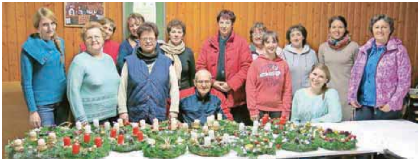
Pod spretnimi prsti vaščanov s Senice so nastali izredno lepi unikatni venčki.

ustvarjalen večer v dobri družbi. »V nedeljo smo izdelane venčke odnesli k blagoslovu k sveti maši in prižgali prvo od štirih sveč, ki tiho naznanjajo rojstvo Jezusa Kristusa,« je končala Mateja Jenko Medar. Mateja Rant