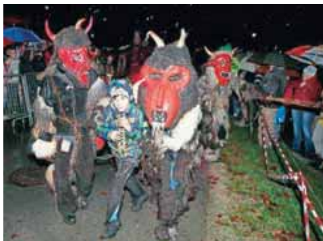
Sorške hudobe so pokazale, kaj se zgodi s porednimi otroki.