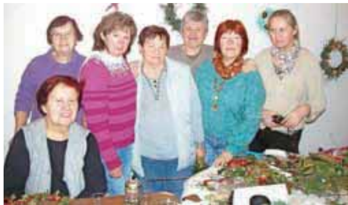
Članice likovne sekcije KUD Pirniče so svoje venčke s ponosom izobesile po stenah.