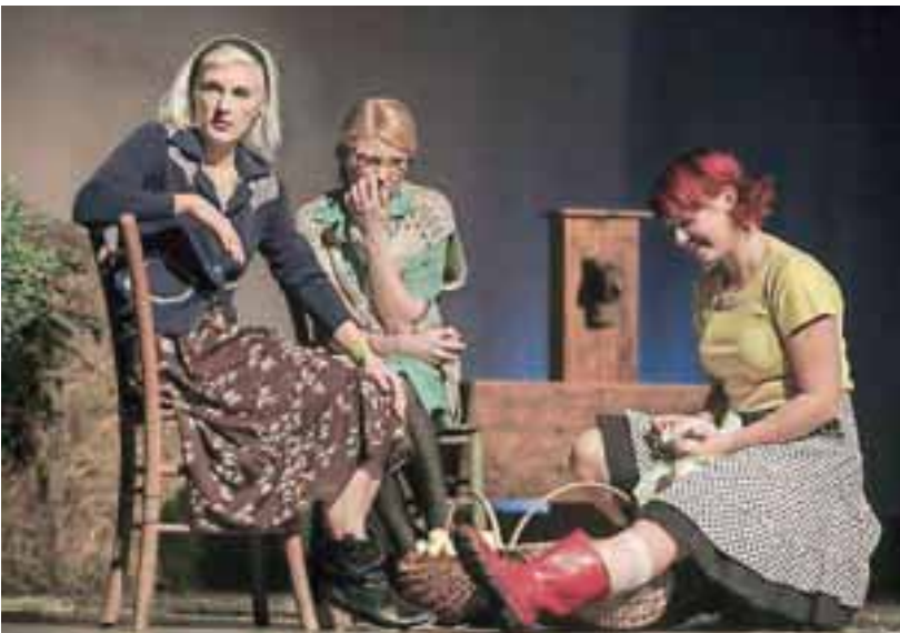
Tak'le 'majo naše punce ...

V KUD Fofite so letos pripravili ljudsko igro Anže an Micka domačega avtorja Simona Goričana. Narod na premier' je bil z'lo zadovol'n.