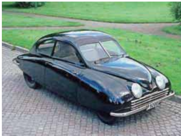
SAAB 92, prvi avtomobil, ki so ga naredili letalski inženirji.