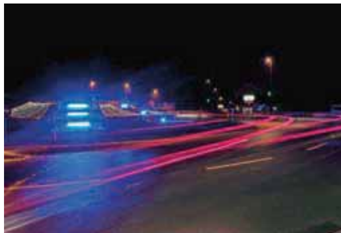
Letos so na novo osvetlili tudi krožišče proti Kranju.