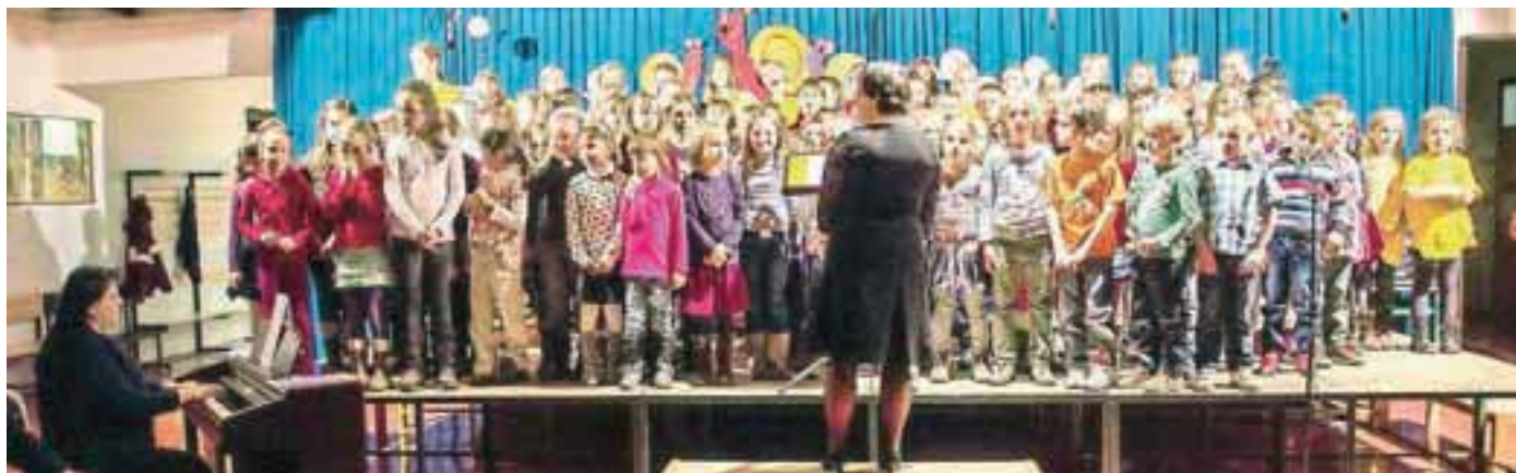
V Osnovni šoli Pirniče so že sedmo leto zapored otroci prepevali Bitenčeve pesmi na Prepevalnici strička Janeza.

V Osnovni šoli Pirniče so konec novembra pripravili sedmi festival otroškega petja, na katerem iz otroških grl donijo pesmi velikega ustvarjalca glasbenih del za najmlajše Janeza Bitenca.