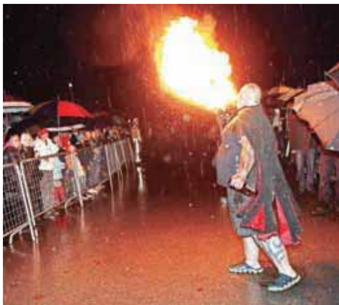
Prireditve v Goričanah je odprl vragec, ki je za to priložnost prišel neposredno iz pekla.