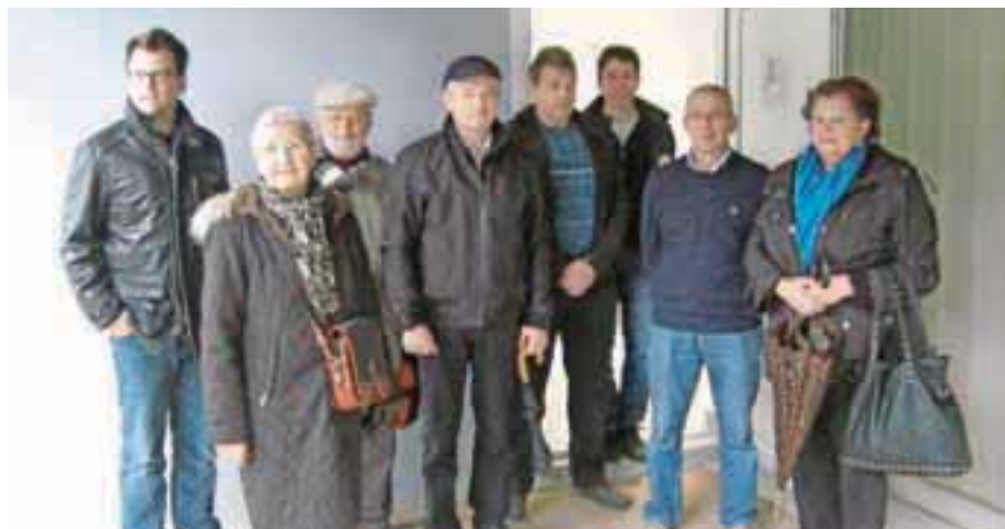
Občinski svetniki pred obnovljenimi prostori krajevne skupnosti

Murnik se je obregnil tudi ob državo, saj so jim pri ministrstvu za kmetijstvo in okolje že pred časom obljubili zadrževalnik vode na začetku vasi, da potok Ločnica ob nalivih ne