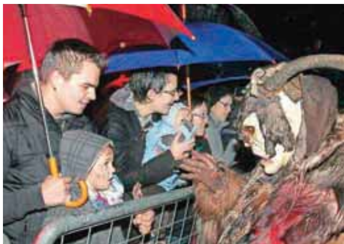
Varovalne ograje so dajale lažni občutek varnosti ...