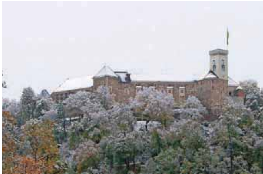
Kdo bo na prvi novoletni dan tekkel od Mestne hiše do Ljubljanskega gradu?

Novoletni tek na Ljubljanski grad bo organiziran v obliki kronometra z začetkom ob 12. uri. Tekaču bo organizator dodelil uro štarta. Prihod na štart je vsaj pet minut prej. Štartni interval bo določili glede na število prijavljenih tekmovalcev. Tekači bodo izpred Mestne hiše štartali v smeri Stritarjeve ulice preko Ciril-Methodovega trga. Po Vodnikovem trgu trasa zavije na Študentsko ulico in se nadaljuje po cesti Za ograjami do Razgledne steze in Ljubljanskega gradu. Slab kilometer dolga proga je tako speljana po zaprtih poteh in se strmo vzpenja v hrib. V primeru ledu bo štart ob vznožju ceste na grad ob rampi, trasa pa bo potekala po cesti na grad. Najboljši tekmovalci v absolutni moški in ženski kategoriji bodo prejeli nagrade, čeprav osnovni namen ni tekmovalen. Namen organizatorja je, da na prvi dan leta združi tekače, ne glede na njihovo sposobnost in čas, da se družijo, storijo nekaj zase in del dneva po najdaljši noči v letu preživijo na drugačen način. To bo priložnost, da