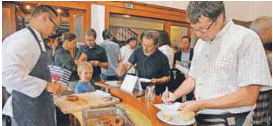
V Sori so letos že deseto leto zapored pripravili ocenjevanje kranjske klobase.