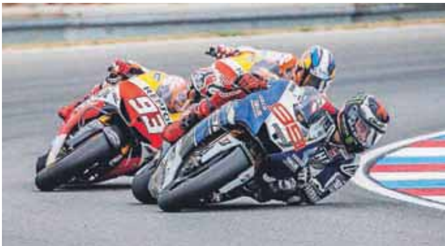
Jorge Lorenzo, Marc Marquez in Dani Pedrosa so se vso dirko borili za zmago. Na koncu je bil najboljši najmlajši - Marc Marquez.

Brno je Slovincem blizu predvsem zaradi cenovne dostopnosti. Najcenejša tridnevna vstopnica je letos stala 82 evrov, s čimer si na italijanskih dirkališčih lahko privoščite le vstopnico za nedeljo, ko je na sporedu dirka. Stroški za gorivo, tri nočitve v kampu, hrano in pijačo so znašali približno 200 evrov, kar pra-