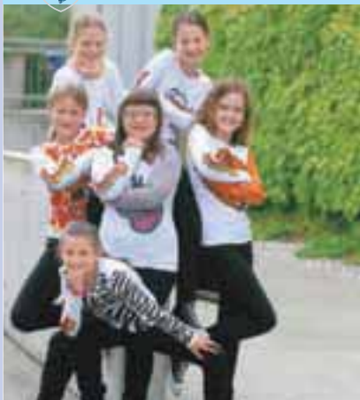
Lokalna novica je kraljica Gorenjski Glas

Na naslovnici: Plesalke Športnega društva Latino