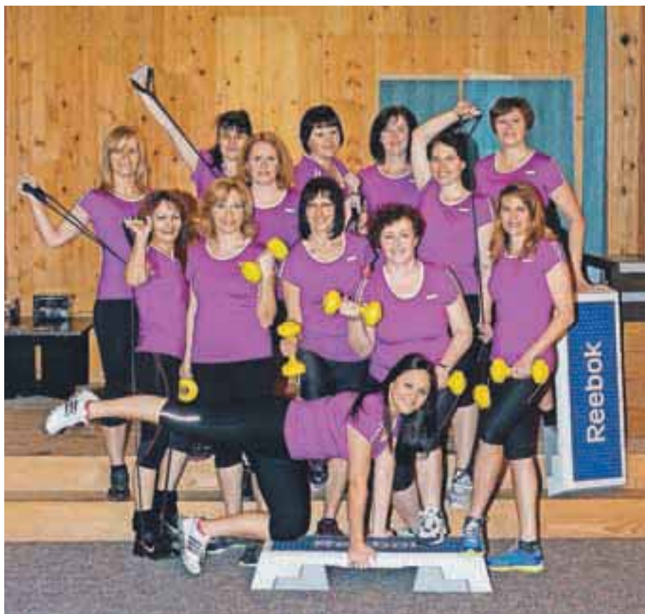
Fotografija z naslovnice biltena, ki so ga izdale ob dvajsetletnici.