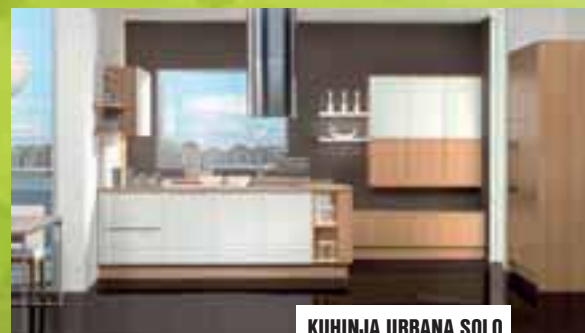
KUHINJA URBANA SOLO