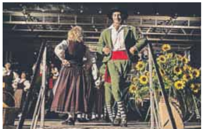
Folklorne skupine iz Slovenije in sosednjih držav so se predstavile na Poskočni špili.