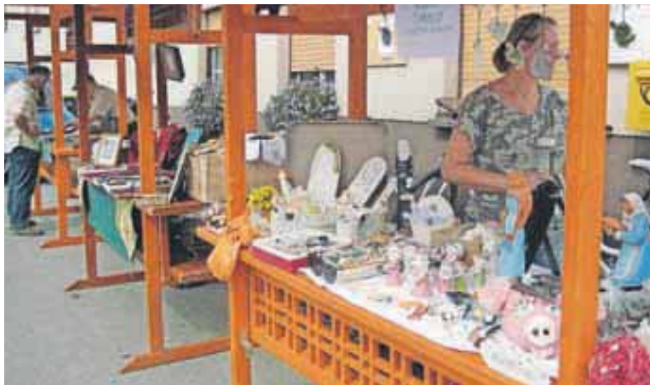
Na semanjem dnevu na Telečjem so se s pridelki in unikatnimi izdelki predstavili številni lokalni ponudniki.