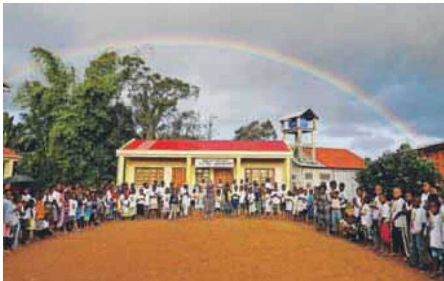
Na oratorijih je sodelovalo od 450 pa do prek 600 otrok.

Mateja Rant