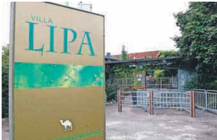
V Lipi v zabavami do jutranjih ur nadaljujejo tudi septembra.