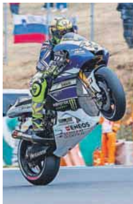
Valentino Rossi rad zabava navijače.