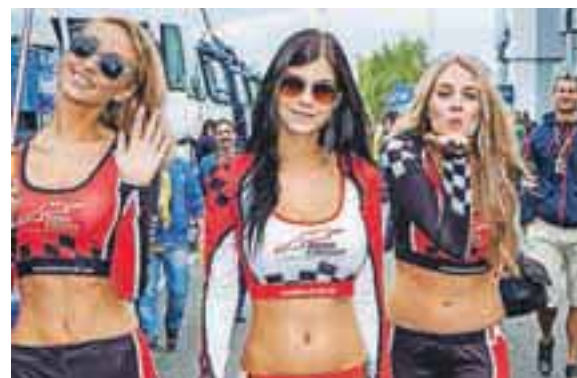
K motociklističnim dirkam sodijo tudi brhka dekleta. V češkem Brnu jih nikoli ne manjka.

Kot že vso sezono so se tudi v Brnu za zmago udarili Marc Marquez, Jorge Lorenzo in Dani Pedrosa. Marquez je zmagal že četrto zaporedno dirko in še povečal bazo svojih navijačev, ki jih je iz tedna v teden več. Dirka v Brnu je že nekaj let najboljše obiskana od vseh, s takimi predstavami najboljših pa ni razloga, da ne bi bilo tako tudi prihodnje leto.