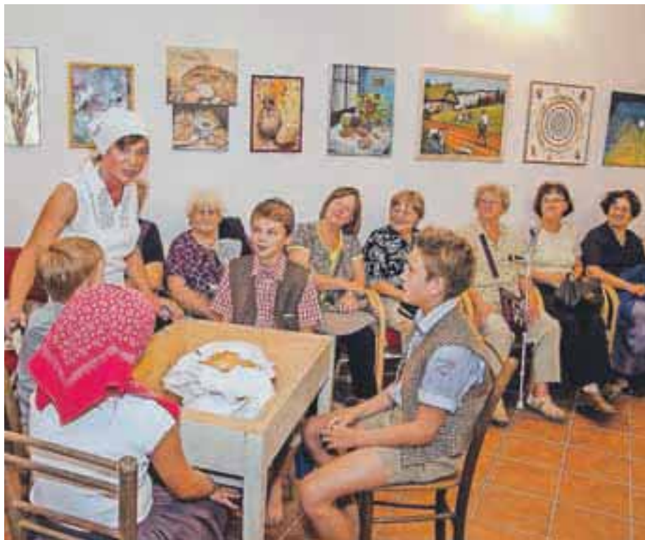
V Domu krajanov Pirniče so minulo soboto odprli razstavo Moj ljubi kruhek.

Likovna sekcija KUD Pirniče je pripravila že tradicionalno likovno in etnografsko razstavo v Domu krajanov Pirniče, ki so jo letos naslovili Moj ljubi kruhek.