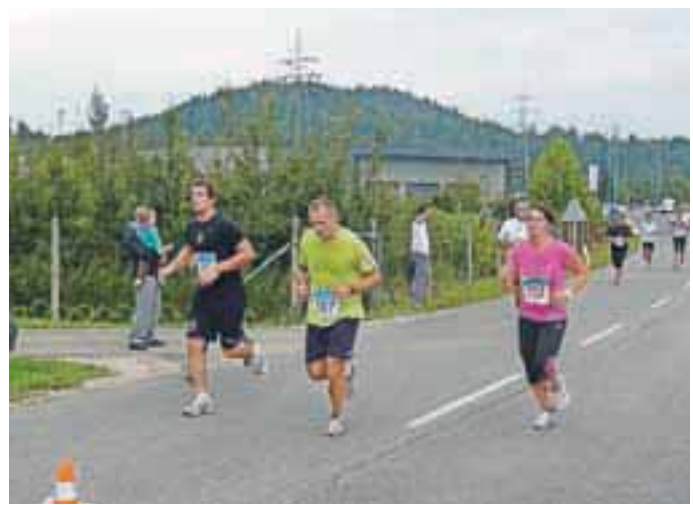
Lani se je na ulicah Medvod zbralo blizu dvesto tekačev in tekačic, letos jih pričakujejo vsaj toliko.

»Ja, trasa proge ostaja ista, krog pa je dolg pet kilometrov. Razlika je v tem, da bo letos moč teči še na dodatni 20-kilometrski razdalji. Tako bo tek organiziran za tiste, ki se bodo želeli preizkušiti v teku na 5 kilometrov, na 10 kilometrov, na 20 kilometrov, dodatno pa smo poskrbeli tudi za najmlajše, saj ob prireditvi pripravljamo tudi vzajemkov tek za otroke, za katerega se bo moč prijavit na dan prireditelje med 15. in 15.20, start tega teka pa bo ob 15.30.«