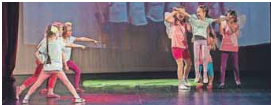
Utrinek s prireditve ob zaključku plesne sezone ŠD Latino v kulturnem domu Medvode

V Športnem društvu Latino so uspešno plesno sezono zaokrožili s prireditvijo v kulturnem domu Medvode.