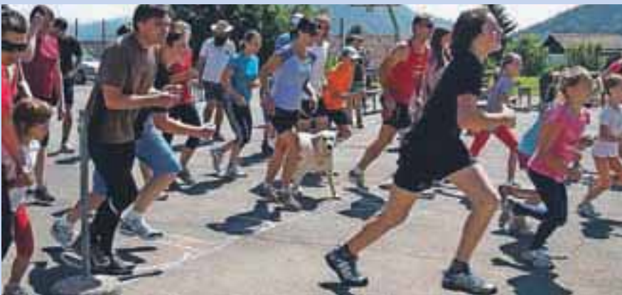
Dobrodelni tek v Preski je združil tekače in tekačice vseh starosti.