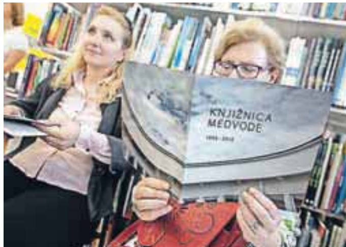
V Knjižnici Medvode so junija zaznamovali dvajsetletnico selitve v nove prostore.