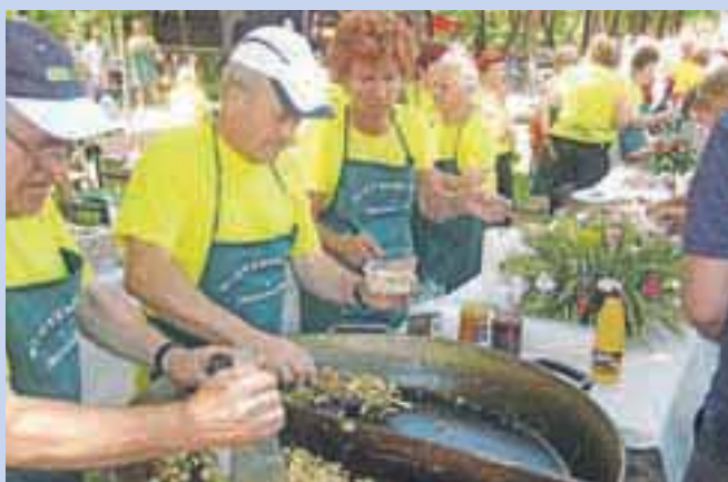
»Šmorn« je šel v slast mladim in starim.