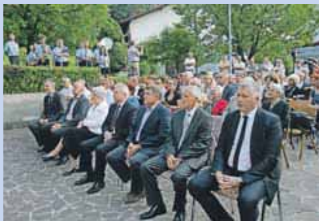
Občinski svetniki so se na predvečer občinskega praznika zbrali na slavnostni seji.