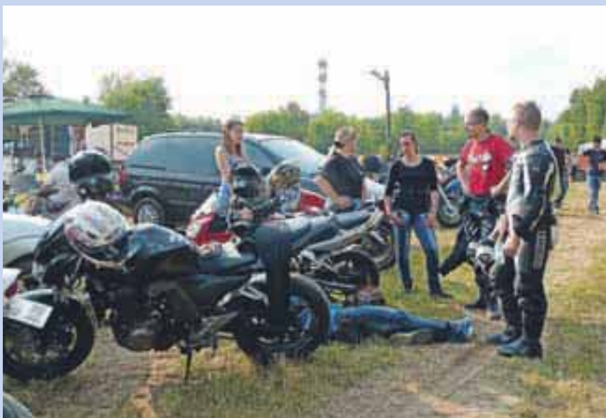
Motoristi in njihovi prijatelji so se tudi letos zbrali na sedaj že tradicionalnem pikniku.