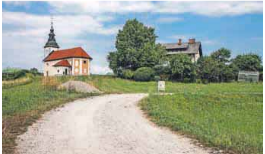
Vzdrževanje makadamskih cest je izredno drago.