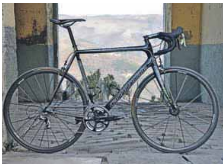
... različica, ki ga vozi uredništvo Sotočja.