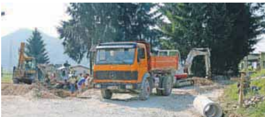
Ob pirniški šoli je vse pripravljeno za začetek gradnje vrtca.

»Čudi me, da je okrog Aljaževe hiše nastal tak zaplet. Mislim, da smo s tem, ko smo ustanovili zavod za mladino in kulturo, ta problem rešili, saj bo zavod prevzel v upravljanje tudi to hišo. Hiša je odprtega tipa, v njej bodo lahko vsa društva izvajala svoje programe. Nobeno pa tu ne bo imelo matičnega sedeža, saj imajo vsa društva enako pravico do Aljaževe hiše. Zaplet pa je nastal predvsem pri opremlitvi hiše, saj nekateri želijo, da bi bila popolnoma sterilna hiša, opremljena le z zgodovinskim pohištvo, večina pa si želi, da bi bila hiša odprta. Izbrati je treba najboljšo pot. Je pa dobro, da je hiša