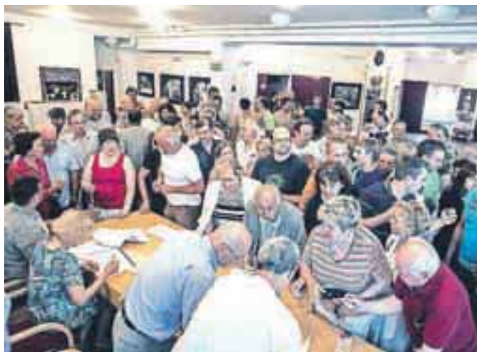
Krajanji Spodnjih Pirnič, Vikrč in Zavrha so se na zboru krajanov izrekli proti ponovnemu odprtju diskoteke Lipa.