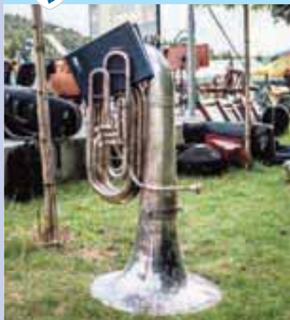
Lokalna novica je kraljica Gorenjski Glas

LEKARSTVO - ISSN 1580-0547 SOTOČJE JULIJ 2013 - Številka 6