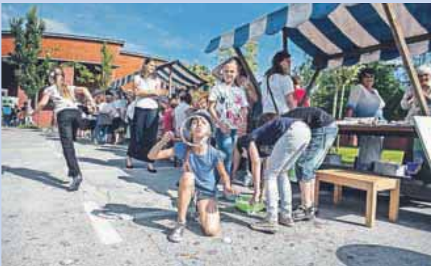
Letošnja tržnica znanj v Medvodah je bila še bolj pisana kot lani.

V Medvodah so se letos že drugo leto pridružili festivalu Teden vseživljenjskega učenja. Osrednji dogodek je predstavljala Tržnica znanj, ki so jo pripravili konec junija.