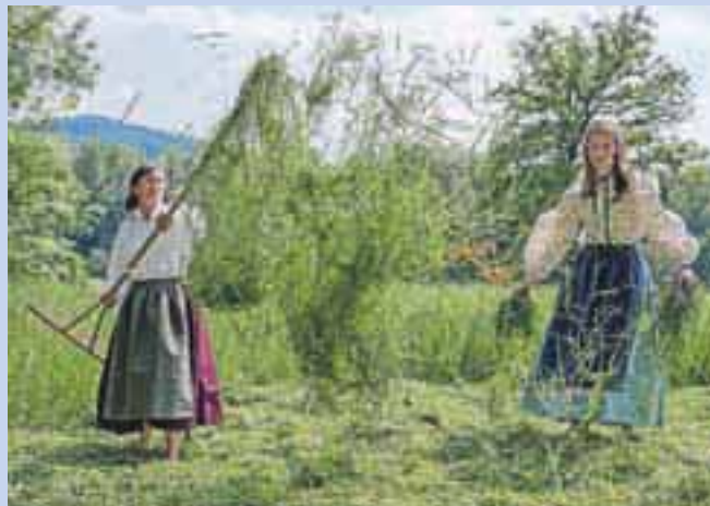
Dekle so prišle k studencu pokazat nove »gvante«.