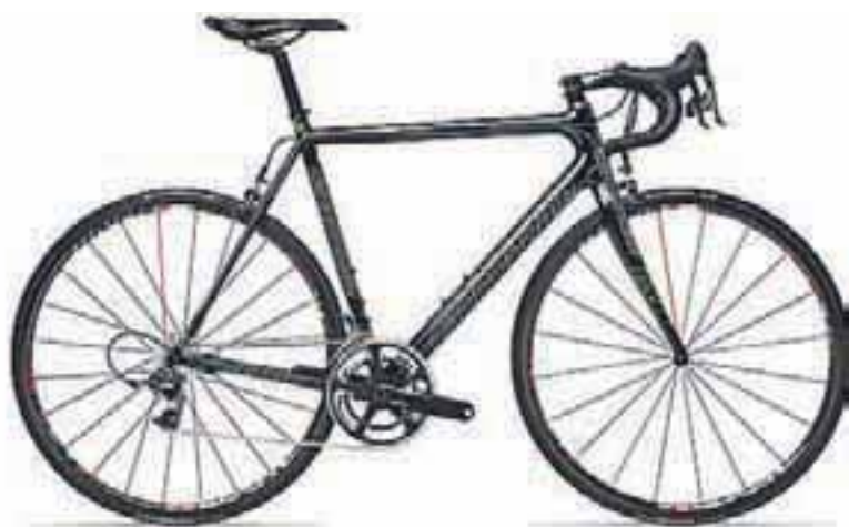
Cannondale Evo Super Six Hi-Mod, najboljša specialka na svetu ...