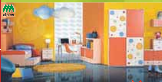
OTROŠKA SOBA PLANET