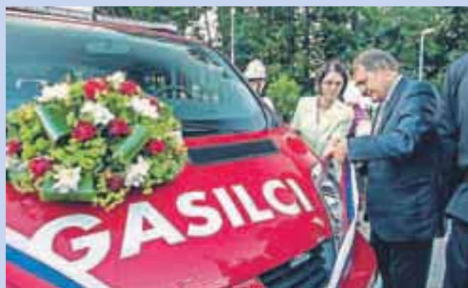
Zbiljski gasilci so bogatejši za novo vozilo za prevoz moštva.