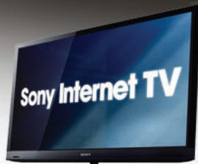
Bravia 3D LCD TV SONY KDL-40HX720

Uživajte 67 ur v polni visoki ločljivosti s 160 GB trdim diskom, širokokotnim objektivom, 30-kratnim optičnim zoomom, fotografijami s 3.3 MP, 7.5 cm/3" LCD, iAUTO.