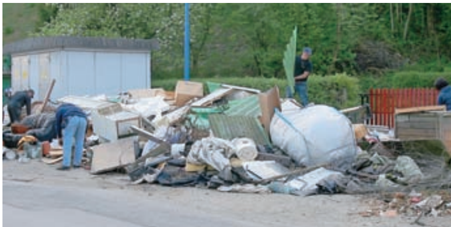
Masovno zbiranje kosovnih odpadkov je že preteklost. Fotografija je bila spomladi posneta v Zbiljah.

Ponekod imate torej poleg sivo-črne posode za ostale odpadke tudi rjavo posodo za biološke odpadke, če ne, pa je obvezno domači kompostnik. Nekateri odpadki se še naprej zbirajo na zbiralnicah. "V občini Medvode je nameščenih 88 zbiralnic. V zadnjem času se zaradi dviga količin predvsem ločeno zbrane embalaže pojavljajo problemi v zvezi s potrebnim volumnom posod za embalažo na zbiralnicah. Zato pripravljamo predlog sprememb načina