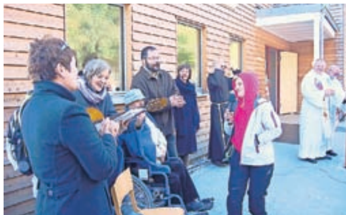
Odprtje so s pesmijo popestrile tudi sprejete osebe. V programu pa so zapele še Sorške kresnice.