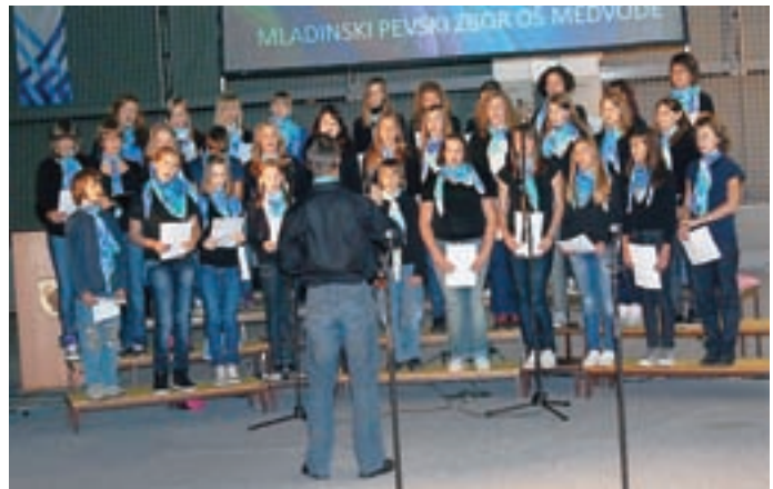
... pa tudi s petjem.