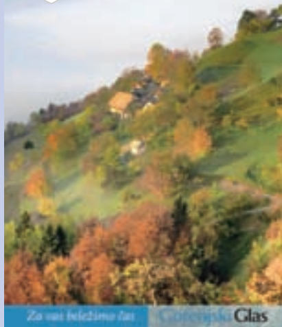
Na naslovnici: Jesen