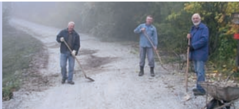
Del krajanov na Belem se je lotilo popravila občinske ceste.