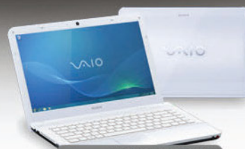
Vaio prenosnik SONY VPC-EA3S1E/W

102 cm/40-palčni 3D-televizor Full HD s tehnologijo Dynamic Edge LED, Motionflow XR 400, storitvijo Internet Video in Skype™.