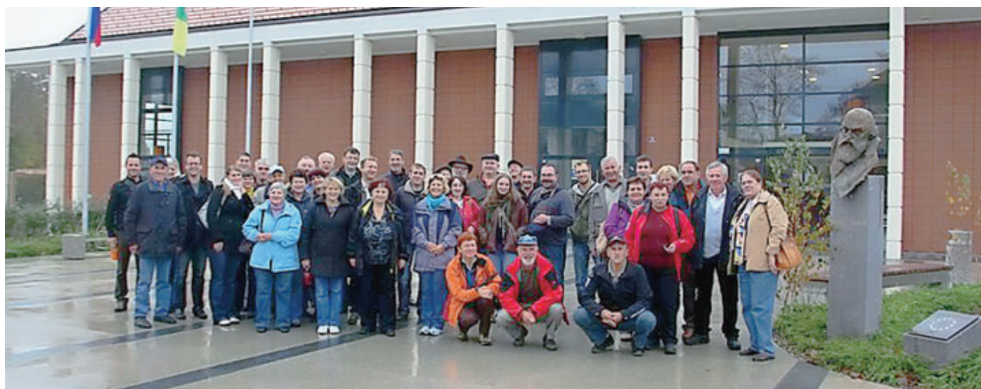
Medvoški kulturniki pred Kulturnim centrom Primoža Trubarja v Šentjerneju