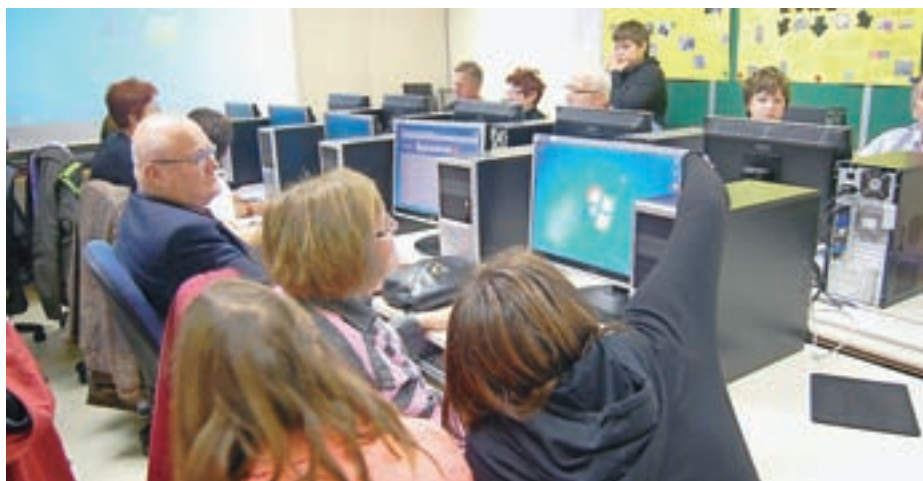
Projekt Simbioz@ e-pismena Slovenija na OŠ Pirniče

Več povpraševanja, kot je bilo prostih mest, so zabeležili tudi v Knjižnici Medvode. Vseh šest prenosnih računalnikov je bilo zasedenih, še enkrat več pa se je pokazalo, kako potrebna