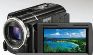
Full HD Kamera SONY HDR-XR160E