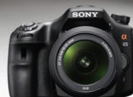
Digitalni fotoaparati SONY SLT-A65VK

Nova serija prenosnika Sony VAIO EA vam nudi več zabave in tehnologije. Poleg hitrih komponent in nove grafike, ima ta model tudi HDMI priključek, zaslon s tehnologijo LED ter izjemen design.