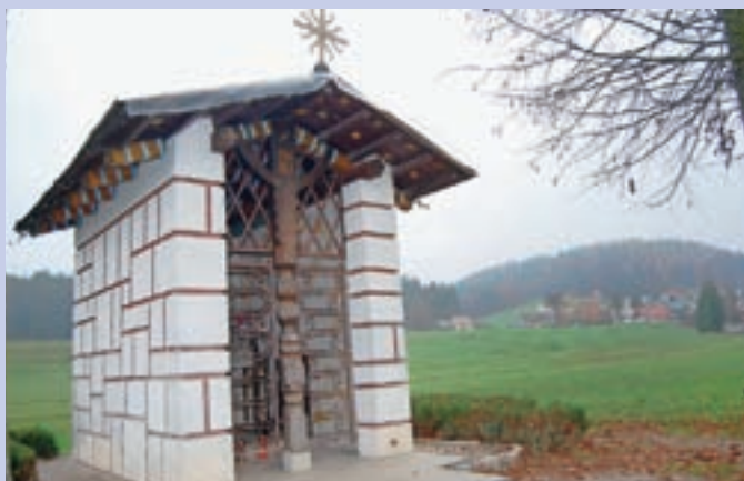
S Plečnikove kapelice so neznan storilci ukradli baker.