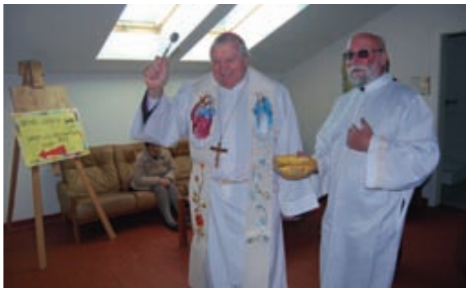
Blagoslovil jih je ljubljanski nadškof v pokoju Alojz Uran. Kot je dejal, bodo novi prostori pomagali utrditi povezanost tudi na mednarodni ravni.