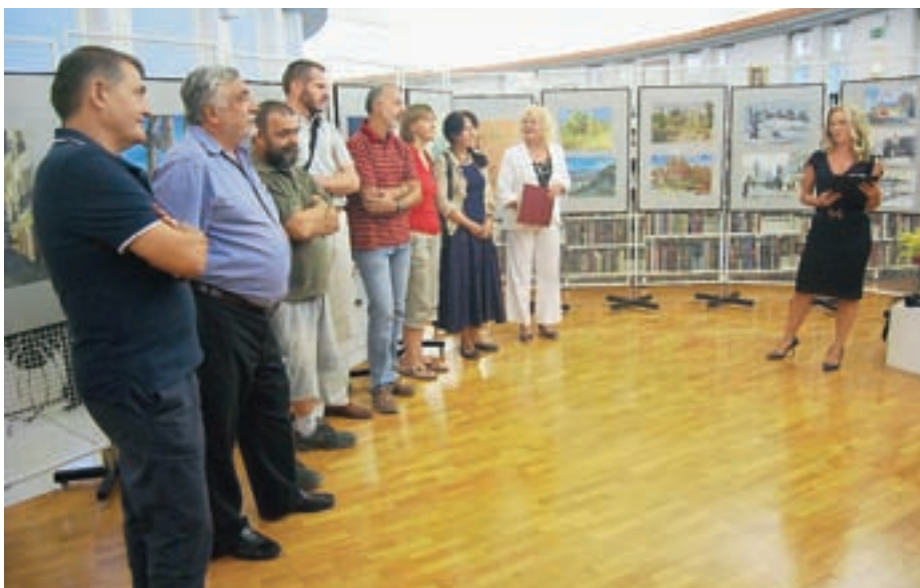
Utrinek z odprtja razstave v Knjižnici Medvode. Na ogled je bila do 7. septembra.

Razstave, ki so načrtovane v naslednjih letih, bodo vključevale likovne centre na Madžarskem, v Rusiji, Ukrajini, Indiji in na Poljskem. Maja Bertonec