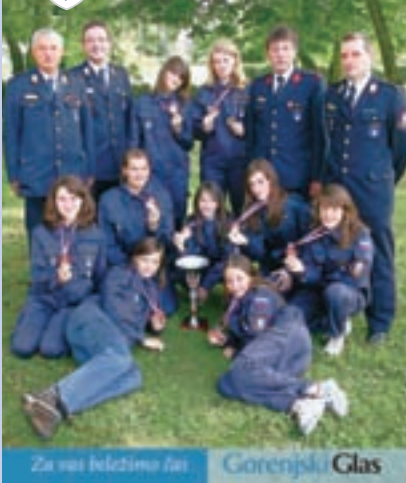
Na naslovnici: Srebrne mladinke PGD Zbilje z mentorji in predsednikom društva

PRILOGA GORENJSKEGA GLASA O OBČINI MEDVODE Ljubljana, 01. 09. 2011. št. 7 SOTOČJE