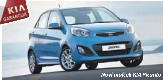
Novi malček KIA Picanto