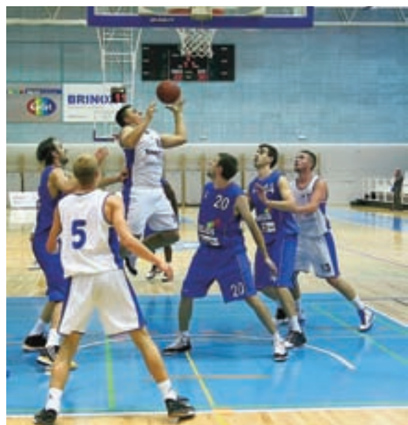
Košarkarji Tinexa Medvod so na močnem mednarodnem turnirju, ki so ga gostili v domači dvorani, po porazu s Heliosom osvojili četrto mesto.

V Medvodah želijo, da bi dobili čim več mladih, domačih fantov, ki bi čez leta tvorili jedro članske ekipe. Korak k temu je