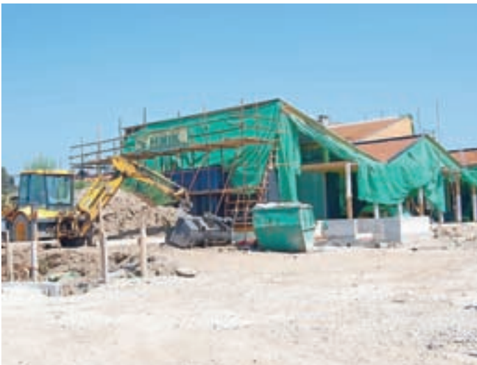
V Smledniku gradnja vrtca ne poteka po načrtih.

Maja Bertonec, foto: M. B., Peter Košenina