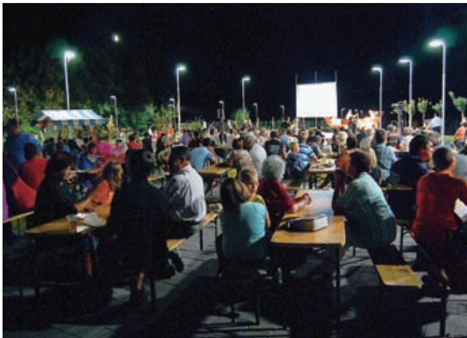
Na novem Vaškem trgu so se zbrali številni krajanje.

Prireditve ob praznovanju sedemstoletnice prve omembe Zbilj so se začele 2. septembra, zaključujejo pa se 9. septembra. Poleg osrednje prireditve so pripravili še uzvočevanje, slikanje v naravi, tržnico domačih in umetniških izdelkov, plein air slikanje, žegnanjsko sv. mašo, blagoslov vaškega trga, otroško predstavo Medvedek Pu, ogledali ste si lahko filme pod zvezdami s predvajanjem arhivskih filmskih zapisov povezanih z Zbiljami, v tem tednu pa prisluhnili Jesenskim serenadam.