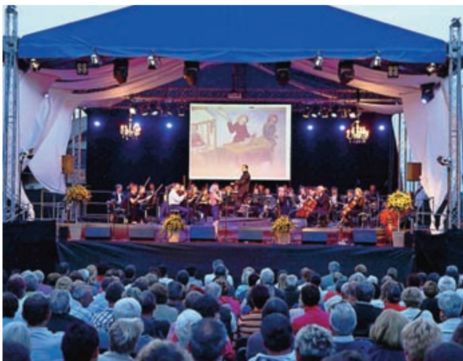
Veliki koncert najlepših Avsenikovih melodij in slovenskih popevk je znova navdušil.