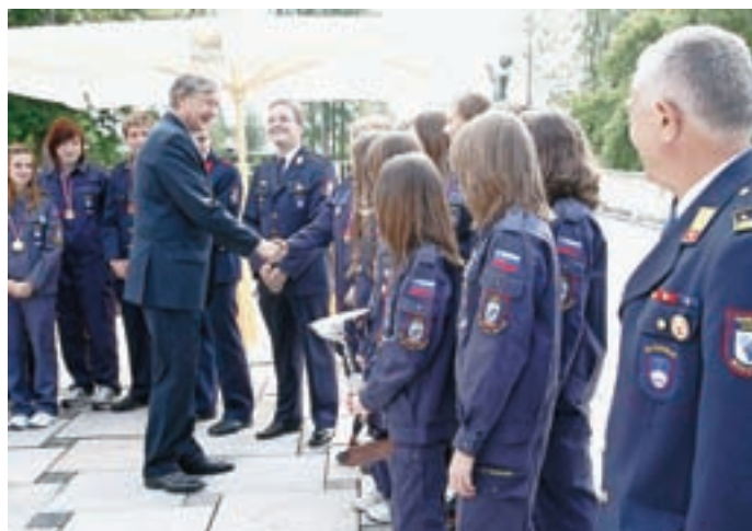
V sredo, 7. septembra, jih je na Brdu pri Kranju sprejel predsednik države dr. Danilo Türk.