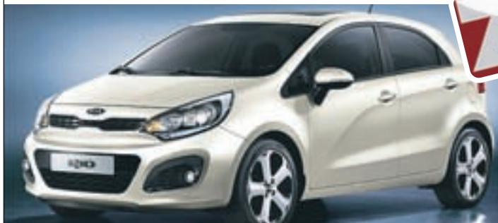
Čisto novi KIA Rio

PRODAJA VOZIL: 051 612 888 TRGOVINA: 01/ 361 22 55 SERVIS: 01/ 361 75 20