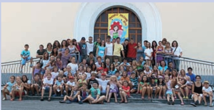
Skupinska fotografija udeležencev oratorija v Smledniku

Oratorij so imeli tudi v Sori, kjer se ga je v tednu od 16. do 21. avgusta udeležilo kakih