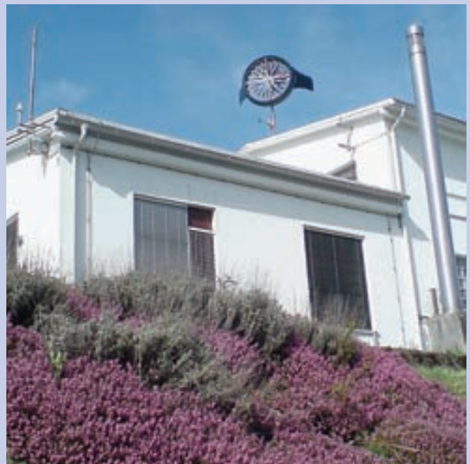
Malo vetrno elektrarno so v Savskih elektrarnah postavili letos maja.