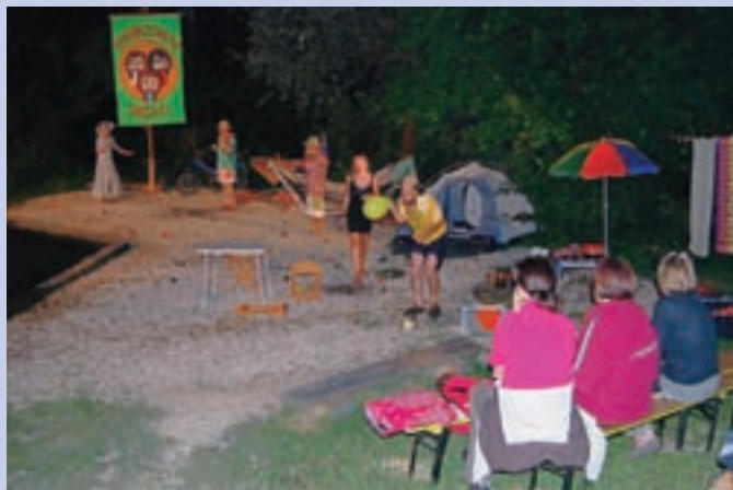
Trije robinzoni in dve ženski v komediji v naravi ob toplem vrelcu Straža