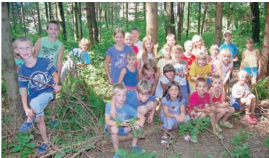
Skupinska fotografija, ki je nastala ob našem obisku, ko so bili otroci v naravi.