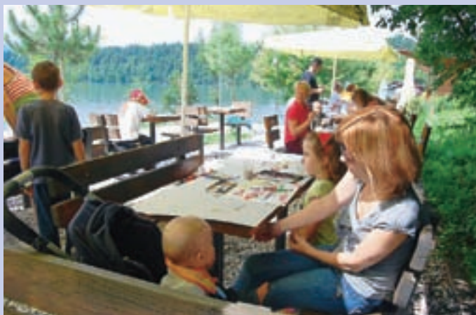
Delavnice so dobro obiskane.