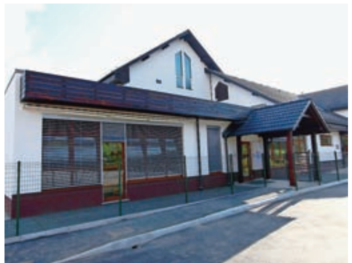
Precej bolj gladko pa je šlo pri vrtcu v Sori, dislociranem oddelku enote Ostržek.