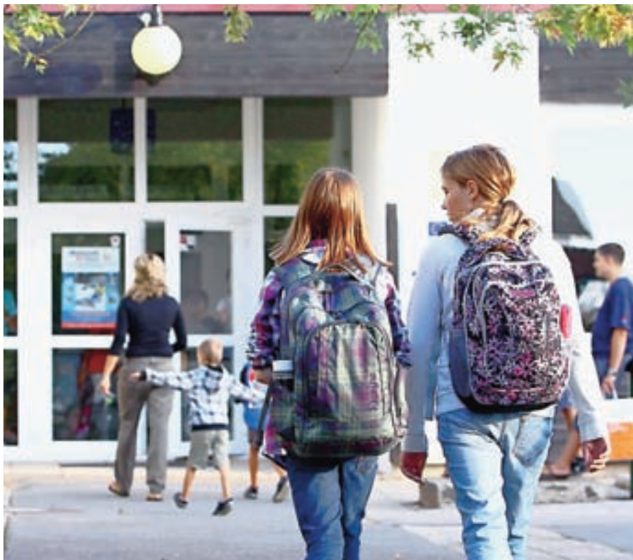
Počitnic je konec. Minuli teden so šolarji znova sedli v šolske klopi.