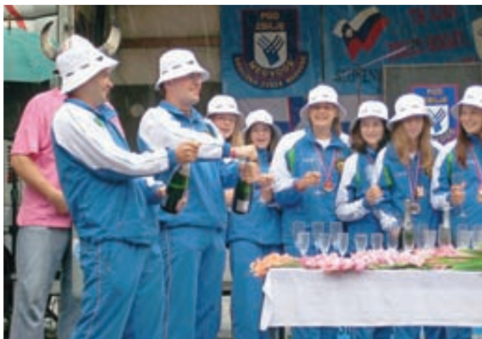
Ob vrnitvi v Zbilje so mlade gasilke sprejeli številni navijači. Sledilo je tudi odpiranje šampanjca. Za dekleta je bila seveda pripravljena brezalkoholna penina.