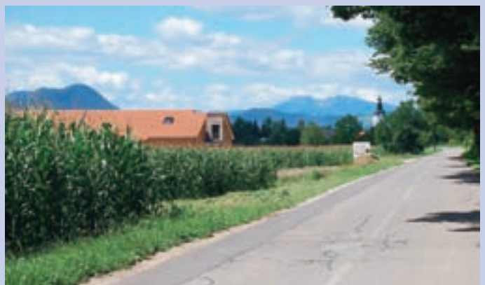
Za poslovno cono Jeprca zbirajo potencialne interesente. Na sliki v ospredju delavnice Društva Barka, ki jih bodo odprli prihodnji mesec.