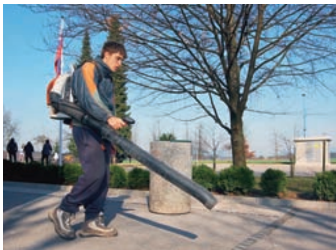
Učenci OŠ Simona Jenka Smlednik so se čiščenja lotili z modernejšo tehnologijo.