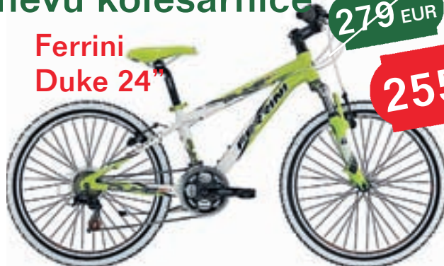
Ferrini Duke 24"