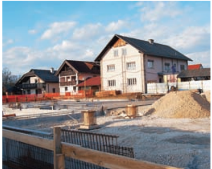
Gradnja novega vrtca v Smledniku se nadaljuje, v uporabi bo ostal tudi še star.

”Prostora bo za okrog osemdeset otrok. Poudariti moram, da za vpis s septembrom računamo le na obstoječi vrtec, v katerega pa na novo