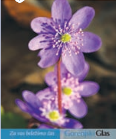
Na naslovnici: Pomlad

PRILOGA GORENJSKEGA GLASA O OBČINI MEDVODE Leta 1911 - ISSN 1580-0547 SOTOČJE April 2011 - Število 3