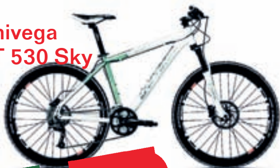
Univega HT 530 Sky