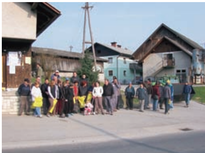
V Hrašah so imeli akcijo 26. marca. Udeležilo se je okrog šestdeset krajanov. Tekst: M. B.