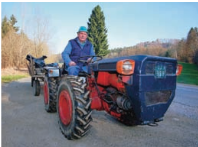
Smeti se vsako leto nabere veliko, zato jih je najlažje odpeljati s traktorjem.