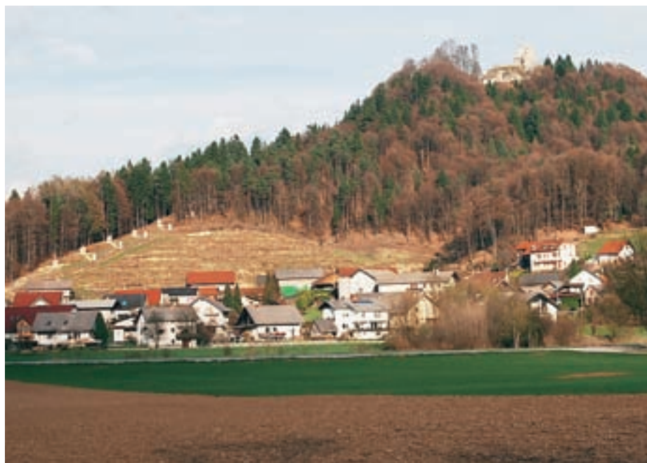
Pogled na Stari grad in Kalvarijo

S posekom dreves je smledniški Stari grad še bolje viden, z deli pa nadaljujejo tudi na ruševinah.