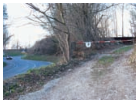
Čistilna naprava v Smledniku je bila predvidena v neposredni bližini ceste iz Zbilj proti Smledniku (na sliki desno za zapornico).

V občini Šenčur pa so nad nenadno odločitvijo občine Medvode presenečeni, še zlasti zato, ker so prav na pobudo Medvod prvotno načrtovano lokacijo čistilne naprave v Trbojeh premetili v Smlednik. "Lokacijo v Trbojeh smo zato izvezli iz občinskega prostorskega načrta, ki smo ga ravnokar sprejeli. Če bi nam v Medvodah svojo odločitev sporočili vsaj pol leta prej, bi