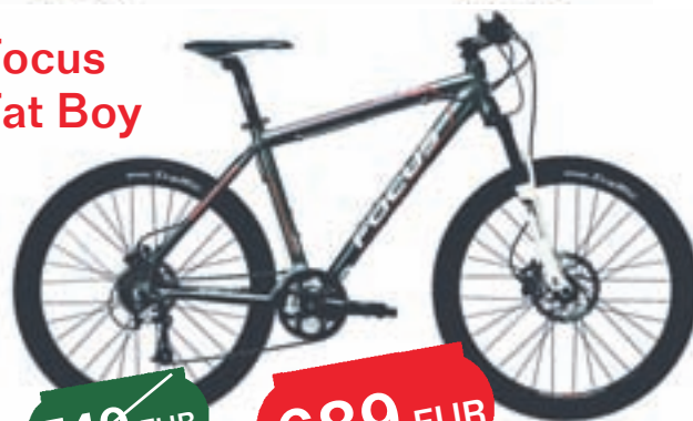
Focus Fat Boy