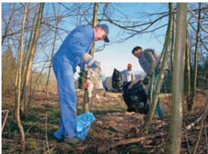
Še posebej veliko odpadkov so prostovoljci našli v gozdovih ob prometnicah.