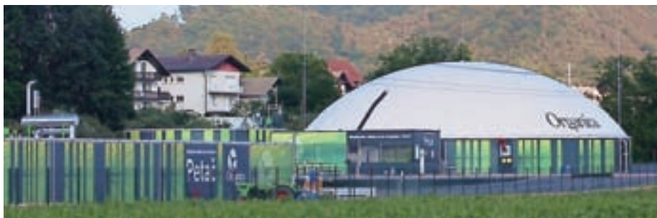
Večina svetnikov se je strinjala, da bioplinarna v Pirničah ne more delovati kot samostojen energetski objekt.