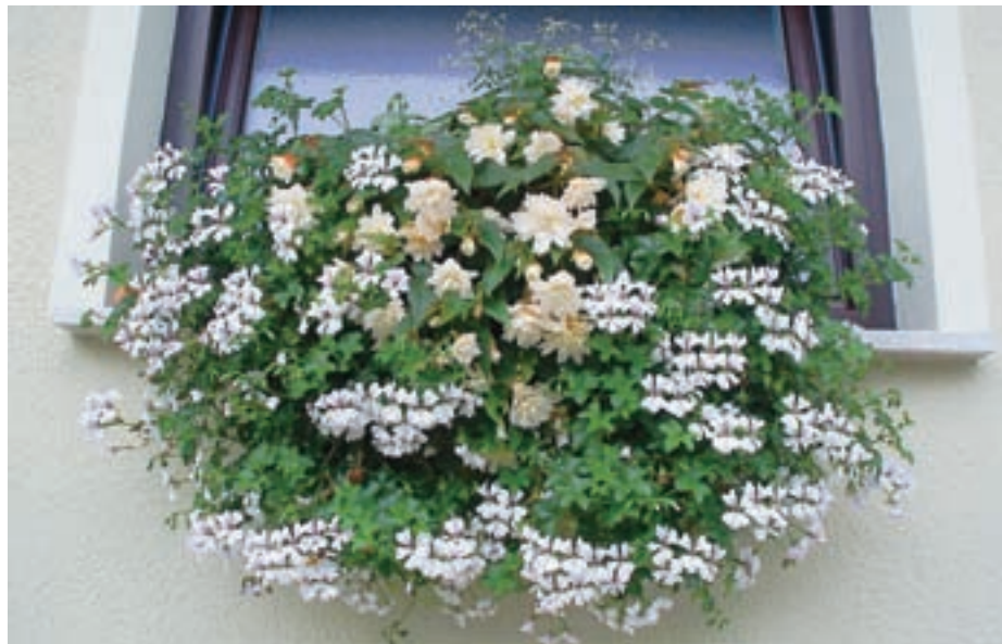
Zasaditev v moderni beli barvi

Pri izbiri belo cvetočih rastlin moramo biti pozorni, kje bodo rastline rasle, saj na legah, izpostavljenih padavinam, večina večjih belih cvetov porjavi. Med najbolj trpežne bele rože za sončne lege zagotovo sodijo begonije z majevimi krila, drobnocvetni mleček in gavra. Priljubljena rastlina je tudi beli grobelnik, a mu moramo za rast nameniti dovolj vode, saj se lahko hitro posuši. Na sončne lege lahko sadimo še bršljanke, bolivijske begonije, novogvinejske vodenke, bakope. V senčnih koticah korita zasadimo s fuksijami, gomoljnimi begonijami, vodenkami. To je le nekaj najbolj pogostih belo cvetočih rastlin, med bogato ponudbo v vrtnarijah.