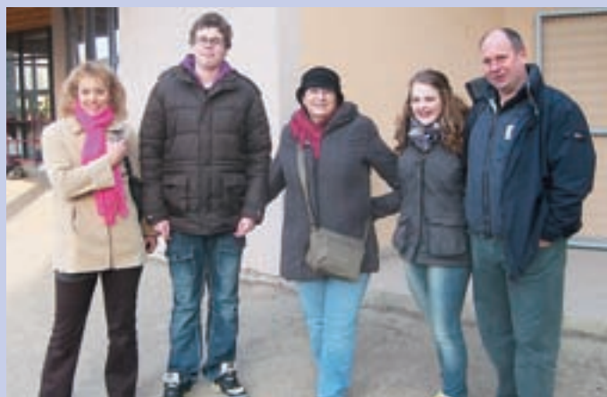
Predstavniki OŠ Preska so v sklopu Comeniusovega projekta obiskali Francijo.

Udeleženci so imeli tudi nekaj časa za ogled. "V mestu Toulouse je bilo zanimivo opazovati mimooidoče, njihov stil in obnašanje. Privoščili smo si francosko sladico crapes, ki je podobna palačinkam, le da je boljša. Zanimivo je bilo v parku znanosti oz. Vesoljskem mestu, kjer smo si ogledali rakete, planete ..., pa tudi 3D film o vesolju," je spomine