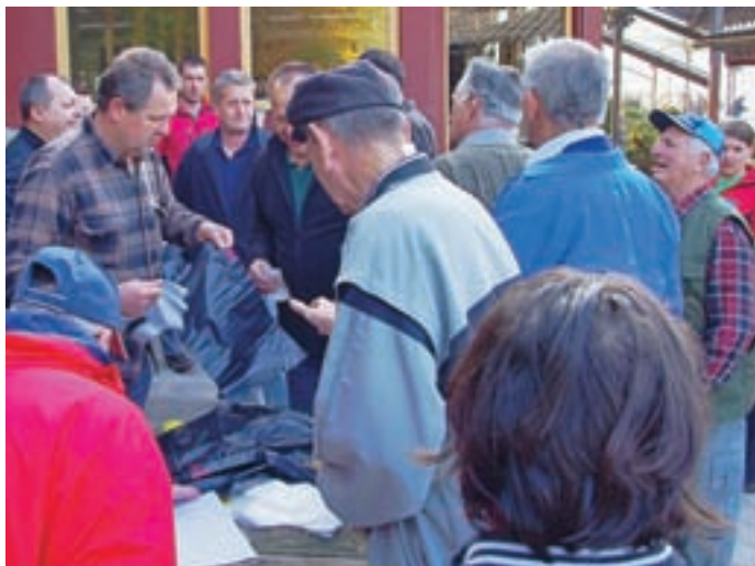
V Zbiljah so zabeležili kar 76 udeležencev akcije, ki so zadovoljni ugotavljali, da je odvzernih odpadkov bistveno manj kot včasih.

Po občini Medvode je 2. aprila potekala čistilna akcija, h kateri so pristopila številna društva. Ozaveščenost ljudi se povečuje.