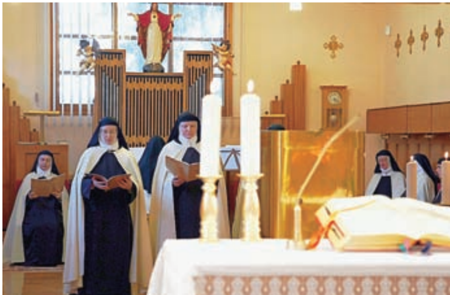
Sestre karmeličanke v Sori so praznovali 25-letnico blagoslovitve samostana.