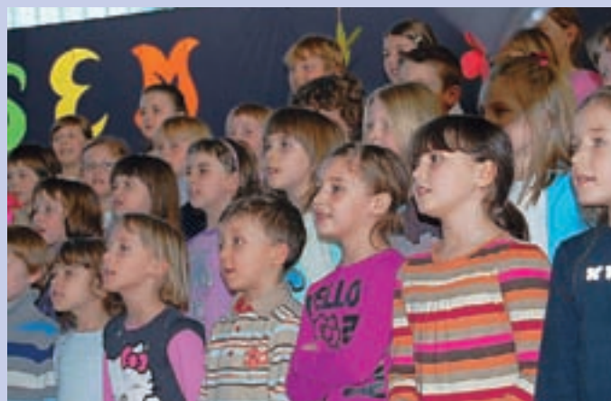
Otroški pevski zbor Prepevalnica OŠ Pirniče