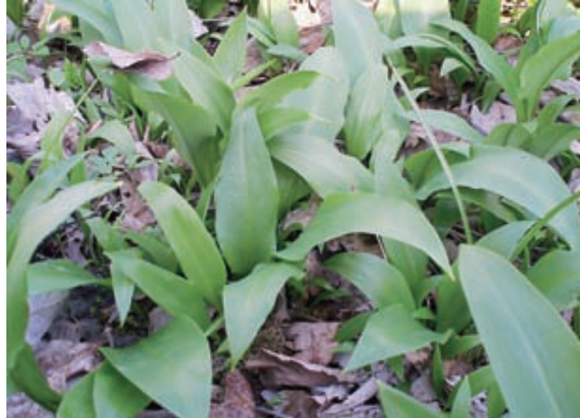
Rok Kogovšek Okusni mladi čemaževi listi v gozdu

Pri nabiranju moramo biti nadvse previdni, da ga ne zamenjamo z dvema strupenima rastlinama; jesenskim podleskom in šmarnico. Temu se izognemo tako, da liste podrgnemo in povohamo, saj ima čemaž izrazit vonj po česnu. Lahko ga gojimo tudi doma. V gozdu izkopljemo nekaj čebulic in jih posadimo v senčni del vrta ali pod krošnje dreves. V vrtu ne bo le uporabna rastlina, temveč tudi prav lep okras v spomladanskem času cvetenja.