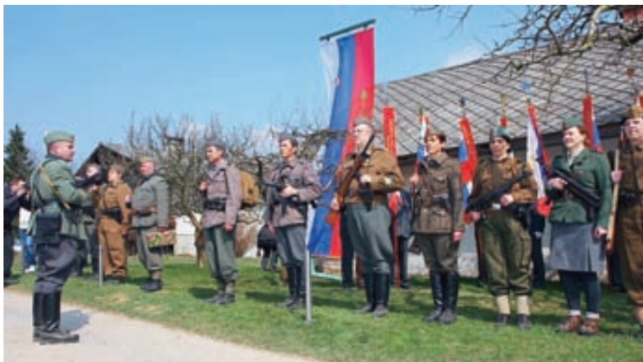
Člani kulturno-zgodovinskega društva Triglav so na prizorišče prišli oblečeni v partizanske uniforme.

Ob obletnici rojstva Komandanta Staneta je Banka Slovenije izdala spominski kovanec za dva evra z njegovo podobo, ki pa je v javnosti dvignil veliko prahu. Izdaji kovanca, ki je zakonito plačilno sredstvo v vseh državah EU, so nasprotovali v Mladi Sloveniji, podmladku N.Si, kjer so poudarili, da je to "žalitev za vse evropske narode, saj se je boril za režim, ki je premnogo Evropejcem povzročil trpljenje in črno prihodnost". Peter Košenina