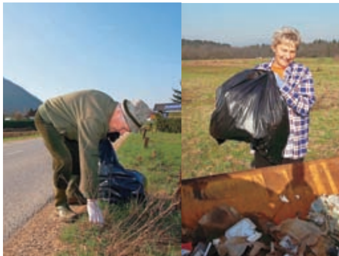
Čiščenju so se pridružili tudi člani Lovske družine Šmarna gora (levo) in številni krajanji. Slika je iz Smlednika.