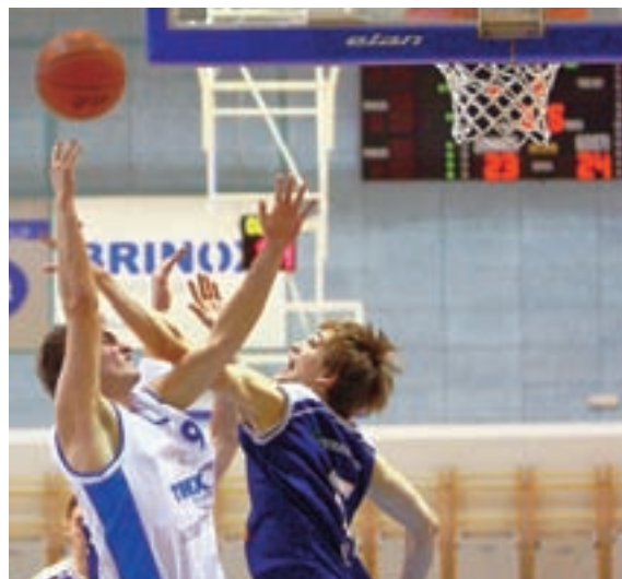
Košarkarji Tinex Medvode so v nedeljo doma izgubili z Litijo.