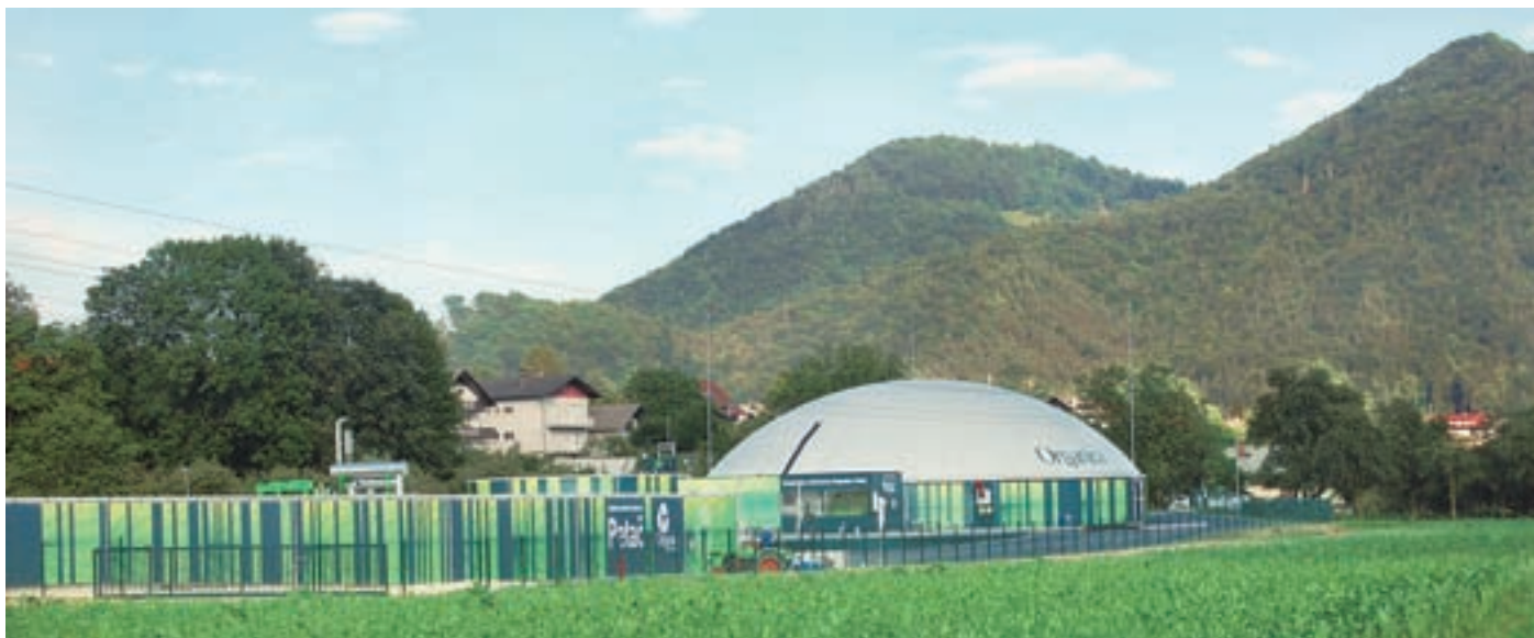
Bioplinska elektrarna Organica - Petač