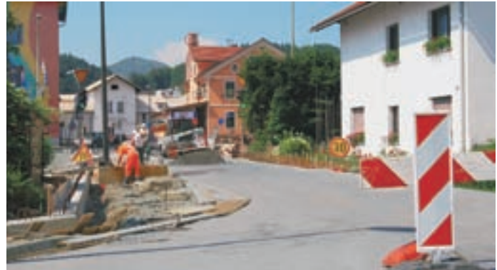
Srečevanje na Cesti komandanta Staneta bo odslej lažje. Vozišče bo nekaj širše, poleg tega so podrli moteče smrečice.