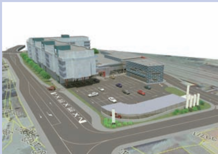
Takšen je pogled na Medvode - city: ob železnici trgovski center, ob Gorenjski cesti pa večstanovanjski objekt in poslovno -stanovanjski objekt.