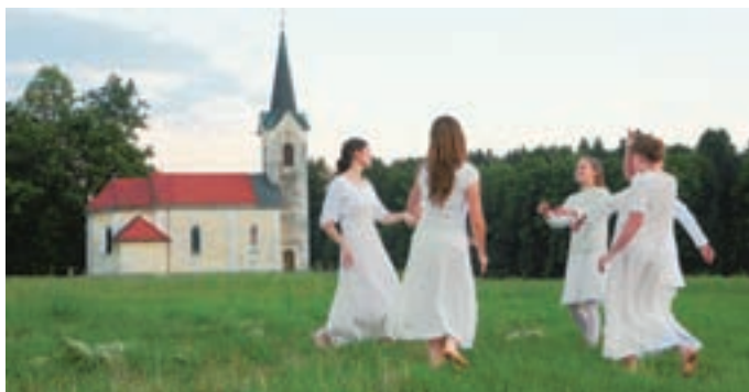
Dogajanje na kresni večer se je začelo z upevanjem kresnic pri cerkvi sv. Janeza Krstnika v Zbiljah.

Program se je začel 21. junija ob 12.57 s prižiganjem sončnega ognja pri cerkvi sv. Janeza Krstnika v Zbiljah. Dan kasneje so ob 4.11 ponoči molili rožni venec, najbolj zanimivo dogajanje pa je bilo 23. junija zvečer, ko so zaznamovali poletni sončev obrat ali solsticij, najskrivnostnejši dan poletnega obdobja, ko je dan najdaljši in noč najkrajša. Ob 20.57 se je začelo z upevanjem kresnic pri cerkvi v Zbiljah, ob 21.57 nadaljevalo s kresovanjem na vodi, ob 22.57 pa je sledilo še kresno rajanje v znamenju glasbene zasedbe Etno HisTrio. Na kresni večer so na plano iz jezera znova zvalili tudi skrivnostno Jago babo. Maja Bertoncej