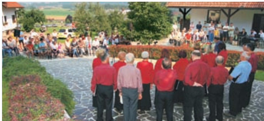
Zbranim planincem in ljubiteljem pesmi je na dvorišču Aljaževe domačije prepeval Mešani pevski zbor KD Jakoba Aljaža iz Medvod.