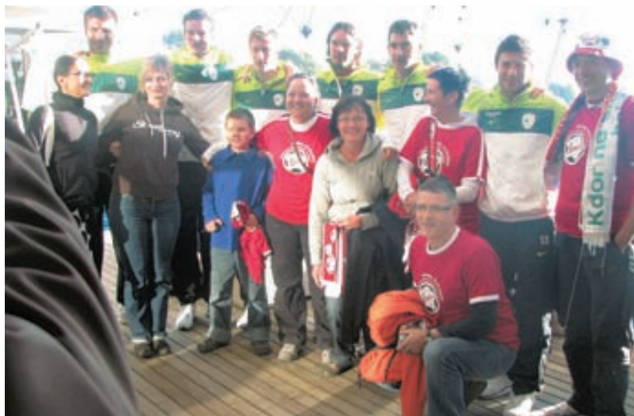
Obiskali so tudi slovenske nogometaše.

”Pred tekmo so pred stadionom dvoboje imeli tudi navijači, ki so se pomerili v različnih igrah. Ne vem sicer, kdo je bil organizator, a potekala je tudi tekma v malem nogometu med slovenskimi in ameriški navijačicami. Mene takrat žal ni bilo tam, so pa iz naše skupine izbrali tri kolegice, ki so potem premagale Ame-