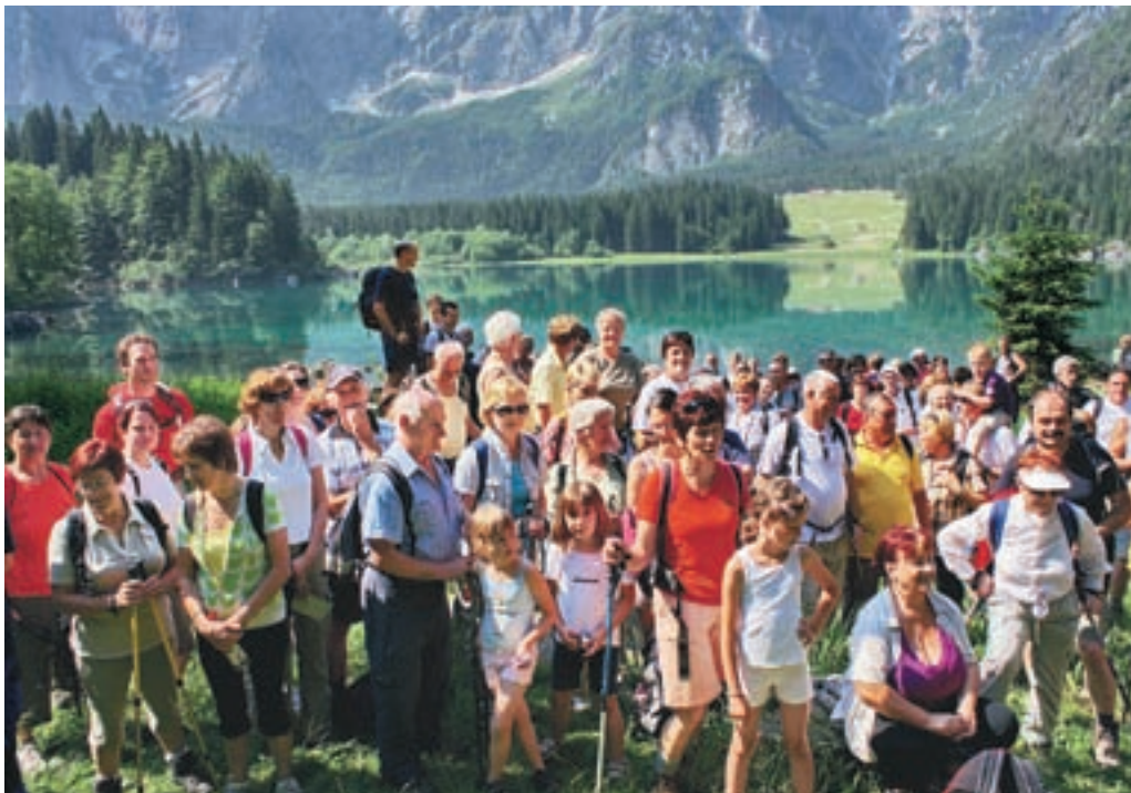
Pohodniki pri Belopeških jezerih.