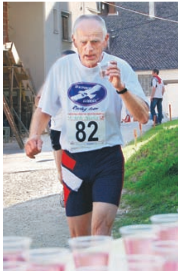
V poletnih mesecih moramo biti še posebej pozorni na zadosten vnos tekočine med športno aktivnostjo. (Slika je simbolična)

”Tudi na dopustu je treba skrbeti za zdravje. Pametno je treba razporediti telesne aktivnosti, pomembno pa je tudi varno sončenje. Pogosto posamezniki v obilici prostega časa, ki se jim ponudi na dopustu, pretiravajo s telesno aktiv-