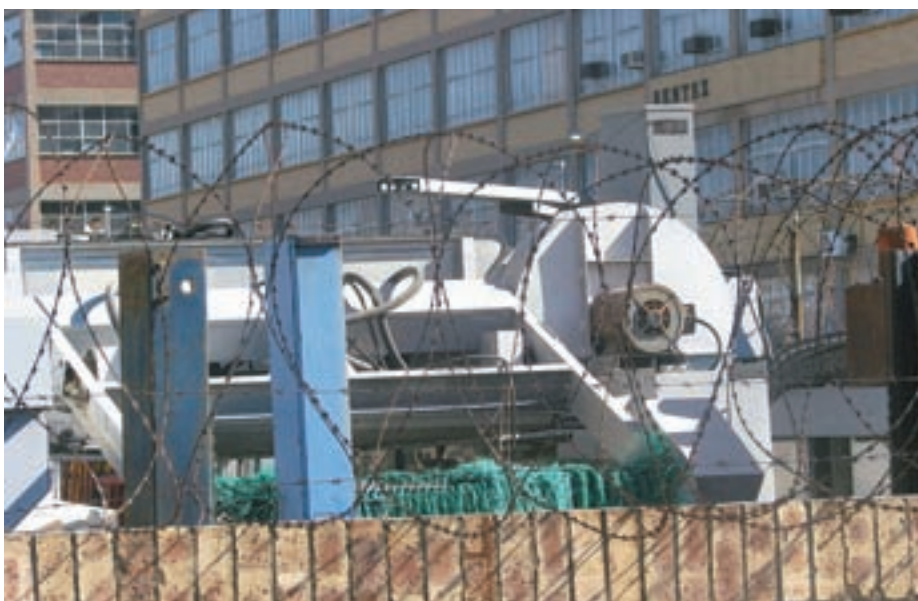
Objekti so ograjeni z žicami.

”Ogled svetovnega nogometnega prvenstva smo združili z ogledom države. Skupaj smo prevozili 3200 kilometrov. Na cestah ni bilo gneče, precej manj kot pri nas. Ceste so dobre, najmanj dvopasovne, vozi pa se po levi, tako kot v Angliji. Iz Port Elizabeth smo šli proti Cape Townu, od koder smo potem leteli domov. V tem delu smo se kopali v Indijskem