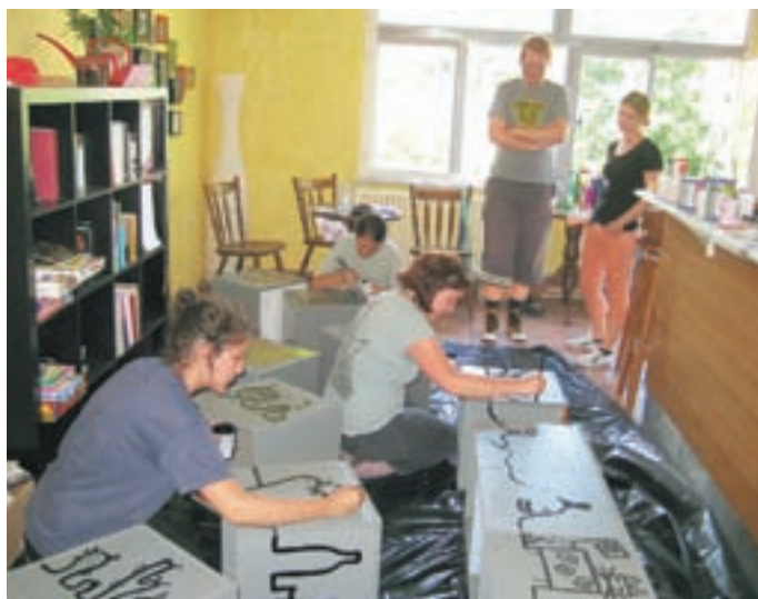
Poslikava lesenih kock, ki jih je možno zložiti v različne uporabne predmete.