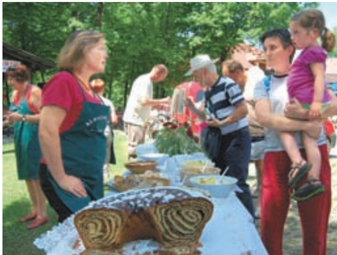
Mize so bile bogato obložene s slovenskimi jedmi.

Slovenski dan v Dragočajni je tudi letos poskrbel za široko ponudbo slovenskih jedi, ki so jih obiskovalci lahko pokusili brezplačno in izvedeli tudi, kako jih pripraviti.