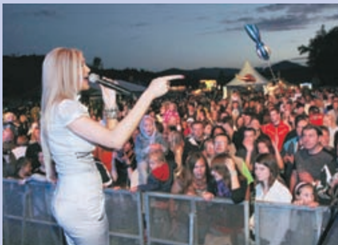
Zbiljska noč je vsako leto privabila veliko obiskovalcev. Te prireditve z dolgoletno tradicijo pa letos ne bo.