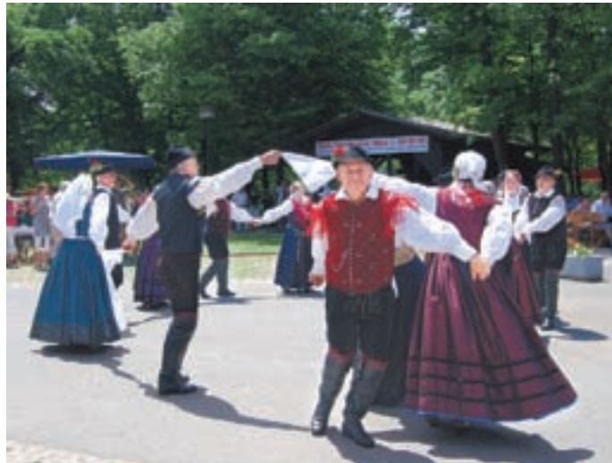
V programu je nastopila tudi Folklorna skupina Naklo.

Dragočajna - V kampu Smlednik je 13. junija v organizaciji TD Dragočajna - Moše potekal četrti Slovenski dan v Dragočajni. Lepa nedelja in dober glas o prireditvi sta privabila številne obiskovalce iz medvoške občine, pa tudi od drugod, ki so imeli priložnost brezplačno pokusiti slovenske jedi in uživati v programu, ki ga je pripravil organizator.