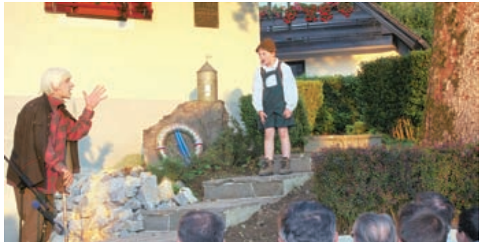
Na slavnostno sejo so prišli "žlahto" v Medvode pozdravit igralci iz gledališča Dovje Mojstrana.