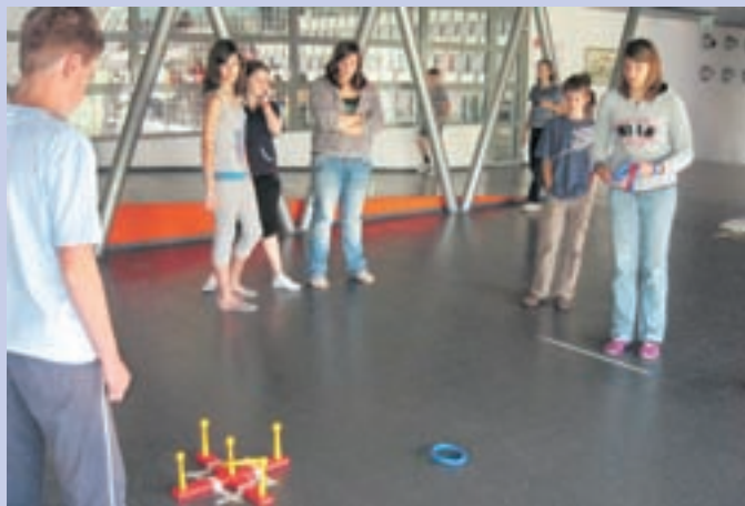
Učenci so se pomerili tudi v metanju balincev.