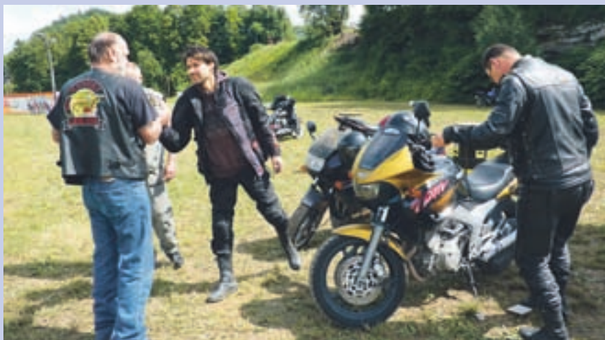
Ker je bila vremenska napoved slaba, v Medvode letos ni prišlo toliko motoristov kot zadnja leta.