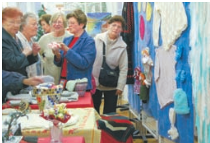
Članice so svoja dela predstavile na razstavi.