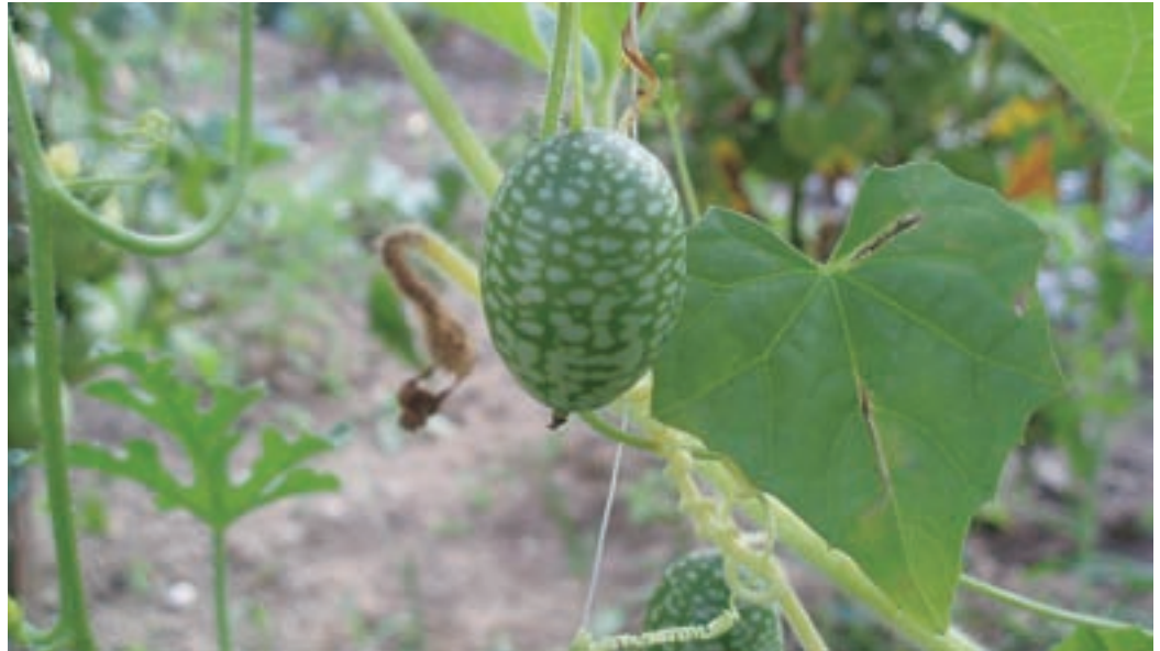
Plodovi mehiške kumarice so odlični za kuhanje, lahko jih vlagamo ali pa jih pojemo surove.

Mehiška kumarica v domovini uspeva kot trajnica, pri nas pa jo gojimo kot enoletnico, podobno kot običajne kumare. Listi so za kumare značilne srčaste oblike, spodnja stran je prekrita z dlačicami. V zalistju se pojavijo majhni rumeni trobentasti cvetovi. Plodovi so zanimivi, spominjajo na miniaturne lubenice. Krasijo jih zelene proge na temno zeleni podlagi. So podolgovati, okroglasti in dolgi do pet centimetrov. Njihov okus spominja na okus kumar, le da je rahlo bolj kiselkast zaradi lupine ploda. Vzgoja mehiških kumaric je popolnoma enaka kot vzgoja naših običajnih kumar. Te kumarice so manj občutljive na nizke temperature, zato jih lahko sadimo na prosto nekoliko prej. Priporočljivo je, da sadike vzgojimo v zaščitenem prostoru in jih nato po nevarnosti pozebe presadimo na prosto. S tem zagotovimo zgodnejši in obilnejši pridelek. Kumarici moramo zagotoviti tudi približno dva metra visoko mreža-