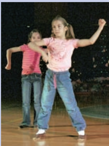
Plesalki iz skupine Hip hop, mala skupina, mladinci