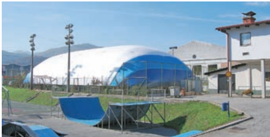
Balon je velika pridobitev za medvoški tenis, v ozadju propadajoča nikoli dokončana športna dvorana.