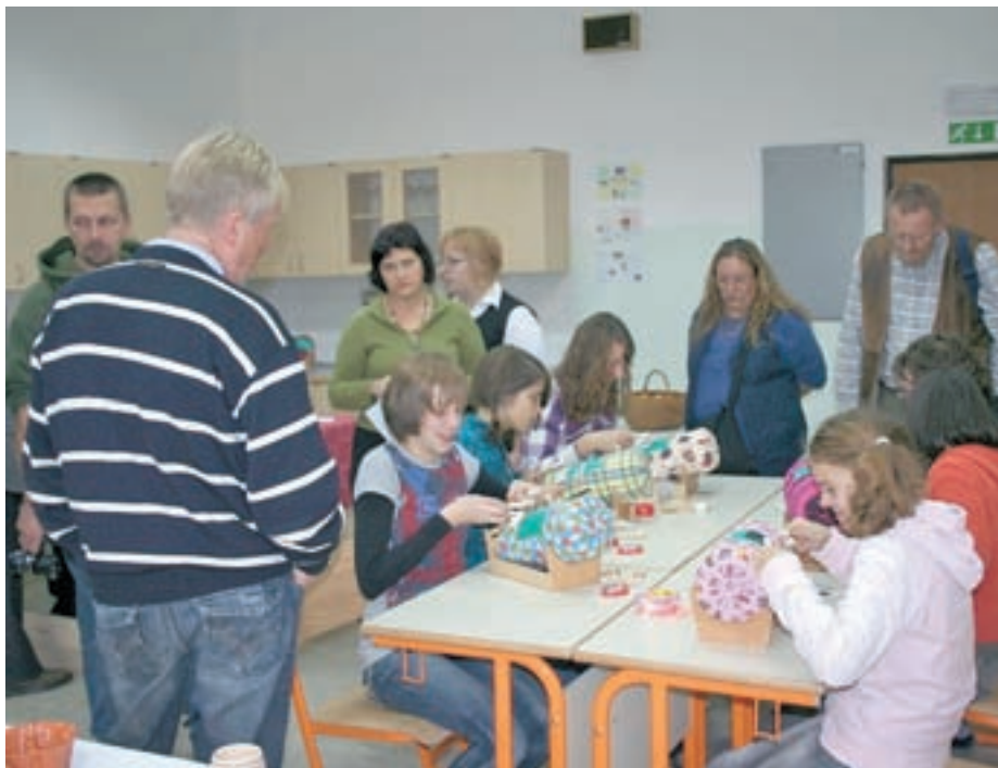
Gostujoči učitelji so z zanimanjem opazovali učenke med klekljanjem.

Tuji učitelji so v sklopu srečanja na OŠ Medvode spoznali tudi nekaj slovenskih znamenitosti. Po prisrčnem sprejemu medvoških učen-