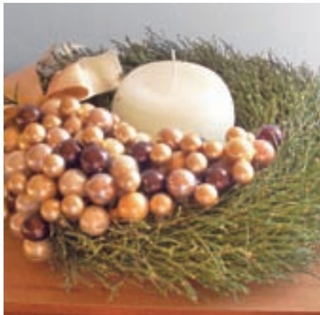
Venček iz borovničevja

Dandanes pa adventni venček poleg tradicionalne nosi tudi dekorativno vlogo in zato postaja vedno bolj priljubljen tudi pri ljudeh, ki ne