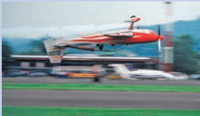
Utrinek z razstave Pločevinasto nebo, ki bo do začetka decembra na ogled v Jedru.

Medvode - V Jedru, klubu Mladinskega centra Medvode, je bilo 15. oktobra odprtje razstave z naslovom Pločevinasto nebo. Gre za multimedijski projekt umetniške skupine Artornado, ki je sestavljen