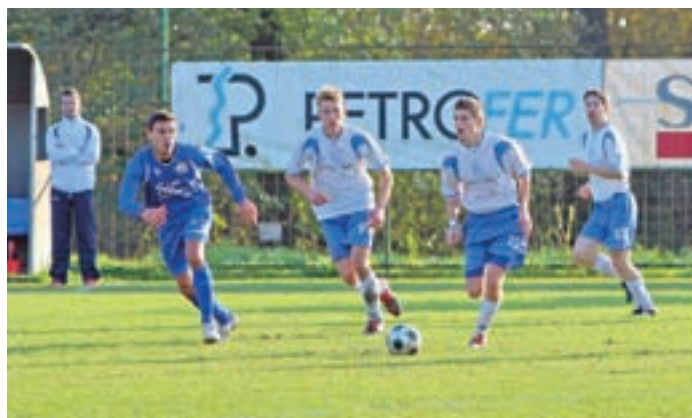
Medvoščani v belo-modrih dresih so proti Adrii izgubili z 0:3.