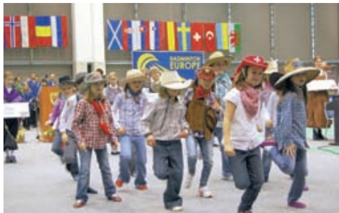
V programu so se s plesno točko predstavili tudi mladi plesalci iz Športnega društva Latino.