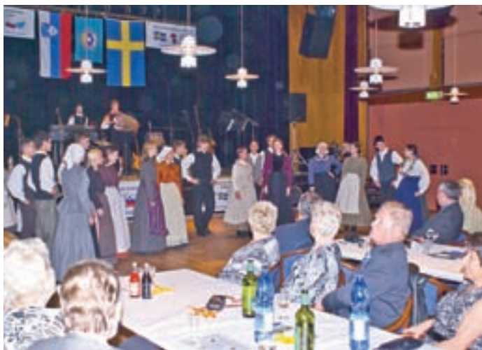
Veliko petja in plesa v ”Finžgarjevih oblekah” na srečanju Slovencev s Švedske. Večina jih pripada prvi generaciji, ki je sem prišla v 60. in 70. letih prejšnjega stoletja.