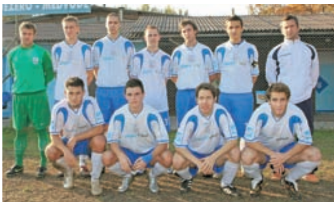
Nogometaši NK Jezero Medvode