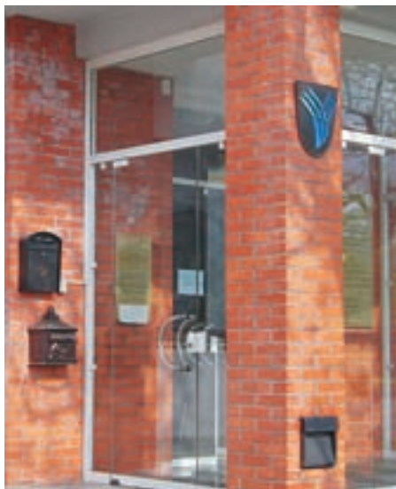
Na pročelju občinske stavbe je nameščen nabiralnik, v katerega lahko vsi zainteresirani pisno oddajo svoje pobude ali pritožbe.

Bodimo konkretni! Neki občan želi opraviti gradbeni poseg, za katerega potrebuje vso gradbeno dokumentacijo, ki jo določa zakon. Začne se postopek pridobivanja zemljiško-