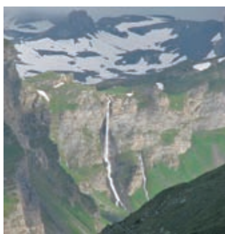
S poti na mali St. Bernhard

Imajo pa Italijani kakšne druge stvari bolje urejene kot mi, na primer ločeno zbiranje odpadkov, otroška igrišča, ohranjanje kulturne dediščine. Na tem področju je pri nas obdobje, ki smo ga preživeli, naredilo svoje. Bistvena razlika med Slovenijo in Italijo pa je predvsem v tem njihovem ponosu.”