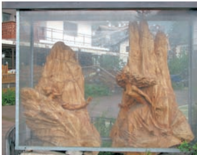
Skulptura pred Cavalesejem