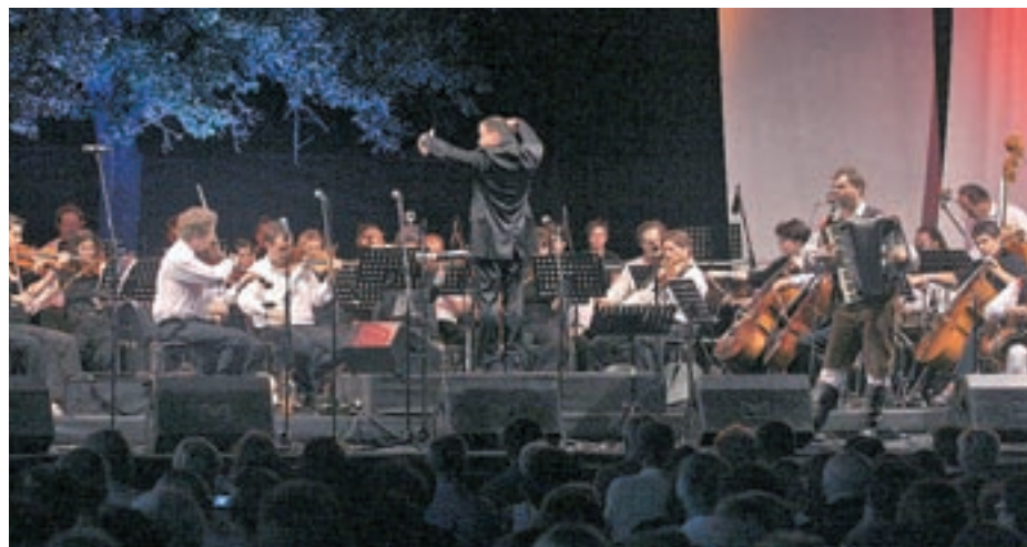
Na koncertu Avsenikove glasbe je bilo več kot tisoč obiskovalcev.