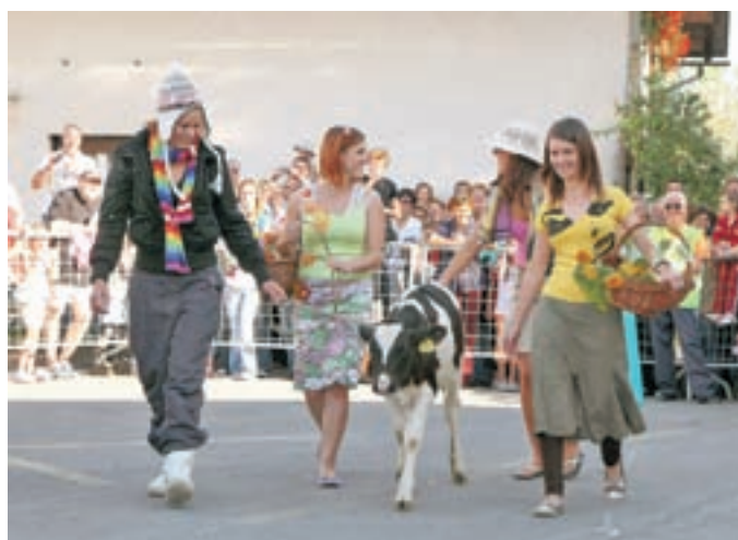
Najuspešnejše so bile članice ekipe Štirje letni časi. Eleganco s parade so nadgradile s hitrostjo v dirki z ovirami in zmagale.