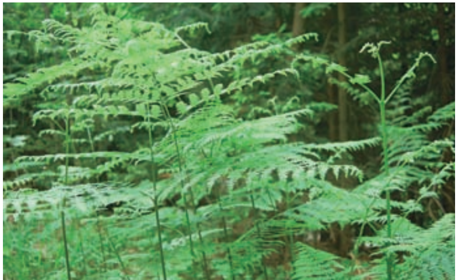
Klopi so tudi na praproti, ne drži pa, da je to njihovo najpogostejše bivalno okolje.