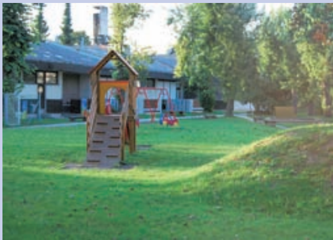
Dva nova oddelka Vrta Medvode bodo oktobra odprli v matični enoti na Svetju.

Medvode - V novo šolsko leto so vstopili tudi v Vrtec Medvode. Takšnih težav s številom vpisanih otrok, kot jih imajo po nekaterih občinah (v sosednji Škofji Loki bodo morali postaviti celo mobilni