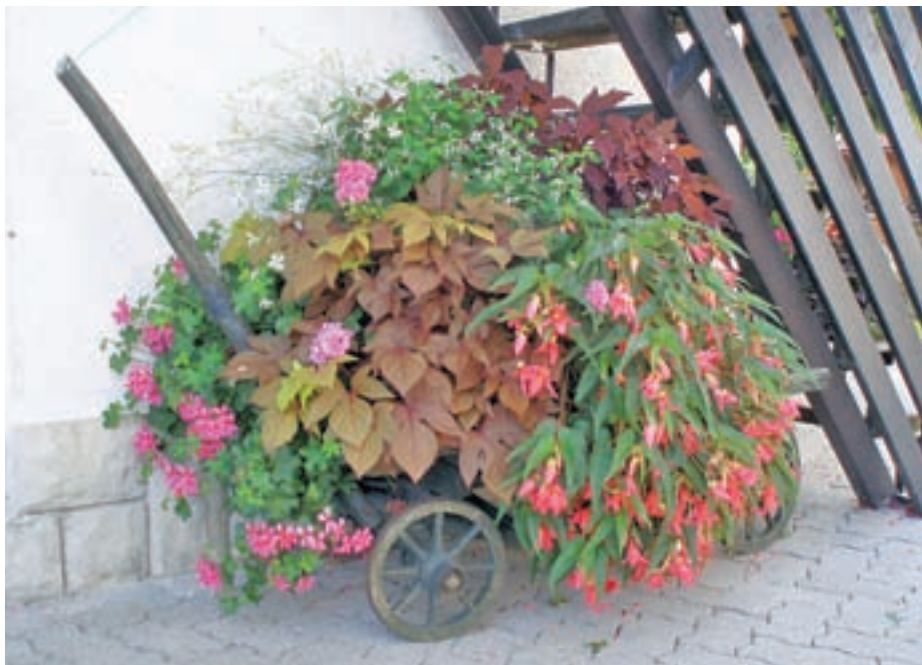
Septembrske zasaditve so kljub nižjim temperaturam še vedno lepe.

Zelo pomembno je, da sedaj še toliko bolj skrbimo za higieno naših rastlin. Zaradi obilice dežja in hladnih noči ter jutranje rose so rastline še bolj dovzetne za napade plesni in gnilobe. Poškodovane dele rastlin sproti temeljito odstranjujemo in se tako izognemo prenosu na druge rastline. Septembra so naše rože najbolj bujne, zato jih moramo izdatno gnojiti z ustreznimi gnojili, ki smo jih uporabljali skozi celotno sezono. Bujne zasaditve sedaj tudi fotografiramo, da bomo prihodnje leto vedeli, katere rastline so nam uspevale dobro in katere ne, ter si tako močno olajšali delo pri načrtovanju novih zasaditev. Izteka pa se tudi čas za pripravo potaknjencev balkonskih in ostalih enoletnih rastlin, ki jih želimo ohraniti za prihodnje leto. Uporabimo zdrave dele rastlin, z največ 3-4 listi. Potaknemo jih v zemljo, namenjeno potaknjencem. Ukoreninjenje lahko pospešimo s hormonskimi pripravki. Sprva mlade rastlinice le pršimo z vodo, nato pa jih po dveh tednih začnemo previdno zalivati. V tem času že razvijejo koreninski sistem.