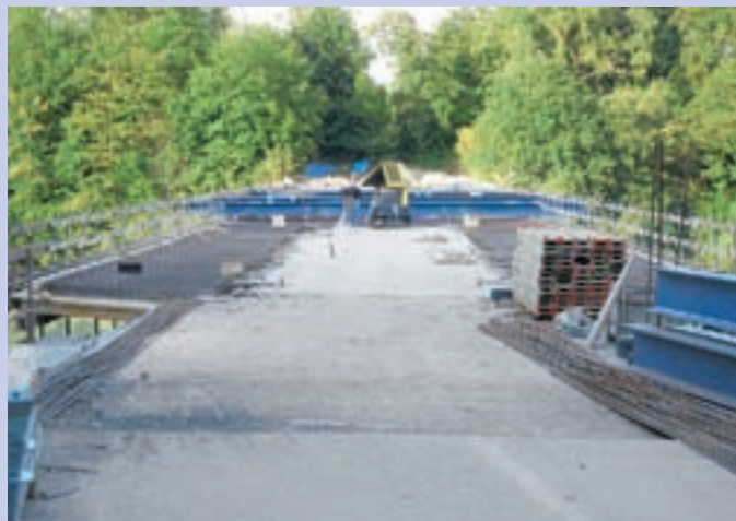
Obnova mostu se nadaljuje.

Smlednik - Od sredine julija je na državni cesti Medvode-Vodice zaradi obnove popolnoma zaprt most čez Savo med Zbiljami in Smlednikom. Prvotno je bilo predvideno, da bo most zaprt do konca avgusta, ker pa obnova še ni končana, so zaporo podaljšali. "Na osnovi predhodnih preiskav smo na Direkciji RS za ceste določili