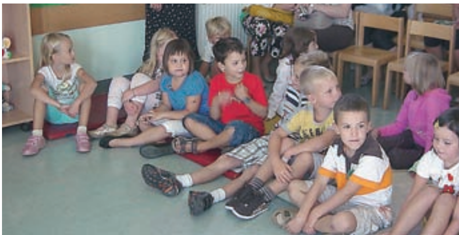
Na OŠ Pirniče so letos sprejeli 22 prvošolcev, kar je trinajst manj kot lani.

Če so na nekaterih slovenskih šolah zaradi premajhnega vpisa ogrožena delovna mesta učiteljev, pa na medvoških šolah učiteljskih vrst za zdaj niso redčili. Zaradi premajhnih gene-