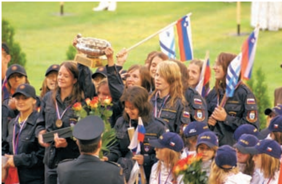
Veselite ob prejemu zlatih medalj

"Vajo z ovirami smo na olimpijadi izvedli s časom 41,4 sekunde. Najboljši čas, ki smo ga dosegli na treningih, pa je bil malo nad 39 sekund. Večina časov na treningih se je gibala med 41 in 44 sekundami, tako da je čas, ki smo ga dosegli pod močnim pritiskom na tako velikem tekmovanju, zelo dober, saj so z njim dekleta konkurirala celo fantom, kar mislim, da pove veliko."