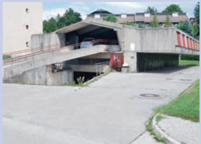
V pokritem objektu je 48 garaž, ki so v zasebni lasti.

Najbolj potrebna obnove je streha, Novak pa dodaja: "Dvakrat je bila sicer že po malem pokrpana, a sedaj je v takem stanju, da jo bo treba v celoti obnoviti. Poleg tega tudi sam zunanji videz objekta ni najlepši, a ker bi bil strošek za celotno ureditev objekta verjetno previsok, smo se odločili, da bi tokrat obnovili le streho. Seveda pa se morajo s tem strinjati vsi lastniki. Z njimi smo že govorili in večina je za to, da gremo v to investicijo." In koliko naj bi vsak lastnik moram prispevati? "Pridobili smo štiri ponudbe, pri najugodnejši je znesek na garažo 160 evrov, vključuje pa obnovo strehe, popravilo strelovoda, obrobe, odtokov, torej le najnujnejša dela," je pojasnil Novak. Če bodo lastniki za, bi, kot pravi, z obnovo lahko začeli že to jesen. Maja Bertoneclj