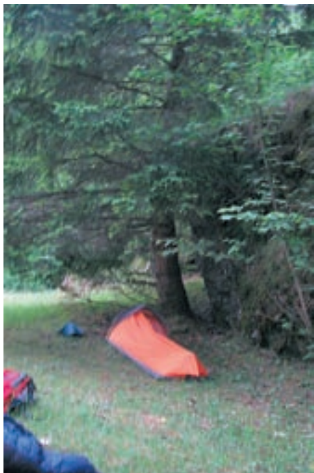
Ko se je začelo temniti, je bil čas za postavitvev prenočišča.

”Vse je bilo super, edini majhen problem je bilo umivanje. V hribih še najdeš potok, v ravnem delu pa ne. Skoraj deset dni se nisem umival. Če si se opraskal s kakšno travo, je peklo, ker je bilo ob cesti veliko umazanije. Paziti je bilo treba na razbito steklo, žblje. Kar se tega tiče, je pri nas mnogo bolj urejeno in lepše.