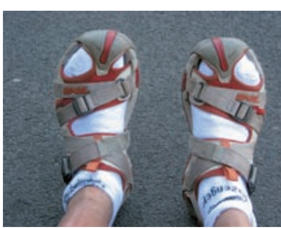
Skoraj celotno pot je prehodil kar v sandalih.