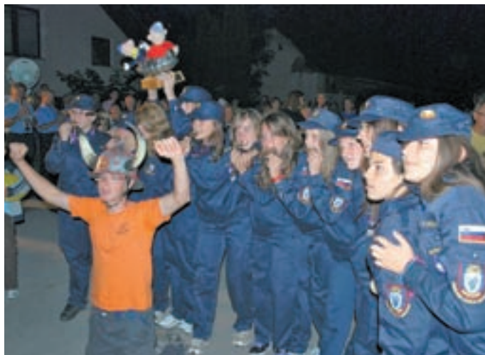
Ob sprejemu v Zbiljah