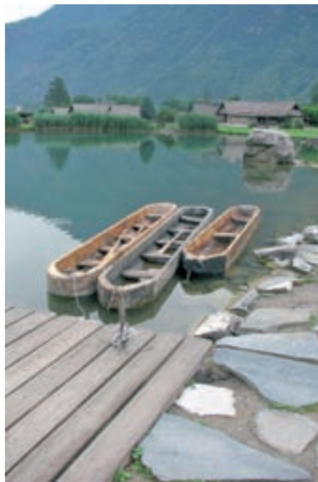
Drevaki v etnološkem parku na začetku doline Val Camonica