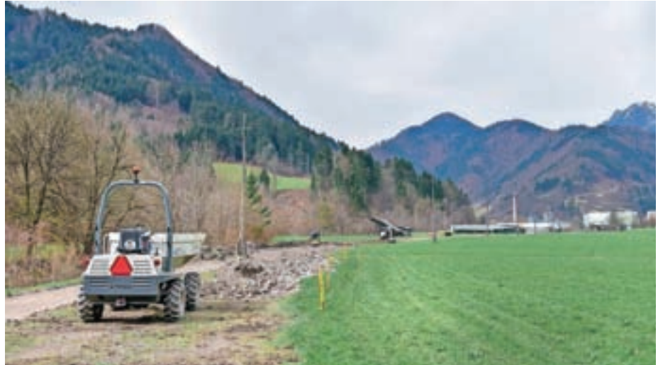
Gradnja tlačnega kanalizacijskega voda in črpališča na Studenem bo stala 99 tisoč evrov.

V prihodnjem tednu se bo začela gradnja infrastrukture v Dašnici, kjer bodo do konca junija zgradili 160 metrov pločnika ter obnovil fekalno in meteorno kanalizacijo in vodovod med hišnima številčkama Dašnica 45 in Dašnica 60. Vrednost del je slabih 230 tisoč evrov. Ureditev Racovnika, kjer bodo položili fini asfalt, je predvidena v poletnih mesecih. Še pred tem pa bodo maja sanirali fasado plavža. "V celoti ga bomo očistili, obnovili vse fuge in tudi očistili kovinske dele. Sanacija bo