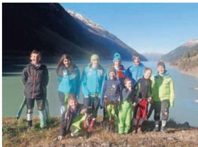
To smo mi – Smučarski klub Domel.