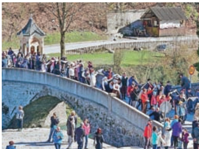
Odziv plesalcev je bil velik, v sprevodu je sodelovalo kar 118 parov.