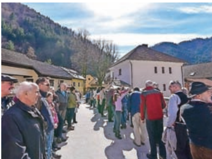
"Šivanje kovtrov" je pritegnilo tudi številne gledalce.