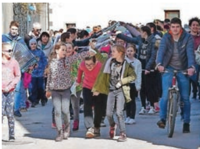
Pri "šivanju kovtrov" so sodelovali tudi številni otroci.