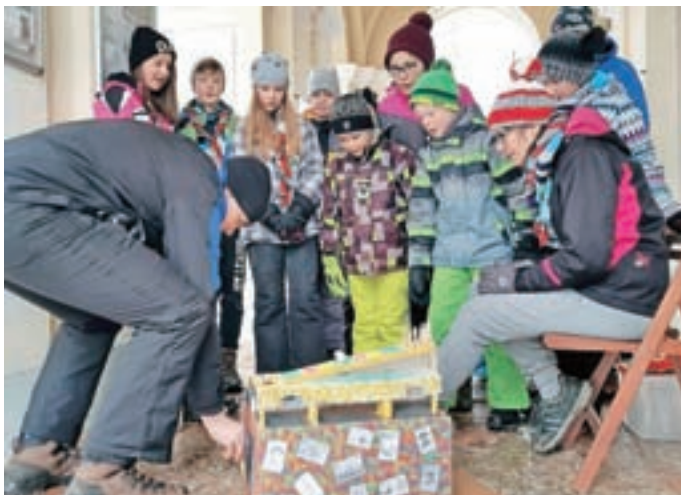
Velika igra Roberta Baden-Powella

so sledili sledem zmedenega profesorja, ki naj bi jih pripeljale do njegovega izuma. Razrešiti so morali različne uganke, da so se dokopali do zemljevida, ki vodi do izuma ter mu nato na orientaciji natančno slediti, da so prišli na cilj. Ob koncu tedna so imeli tudi krst in sprejem novincev v četo. Klan pa se je na zimovanje odpravil od 23. do 25. marca. Tabor so začeli s križevim potom s svečkami v Srednji vasi nad Bohinjem. Naslednji dan so nadaljevali pot na planino Krstenica. Pot je bila dolga in naporena, ker ni bila uhojena in je bilo še veliko snega, ampak je postregla s prekrasnimi razgledi. Domov so se vrnili z lepimi spomini in novimi izkušnjami.