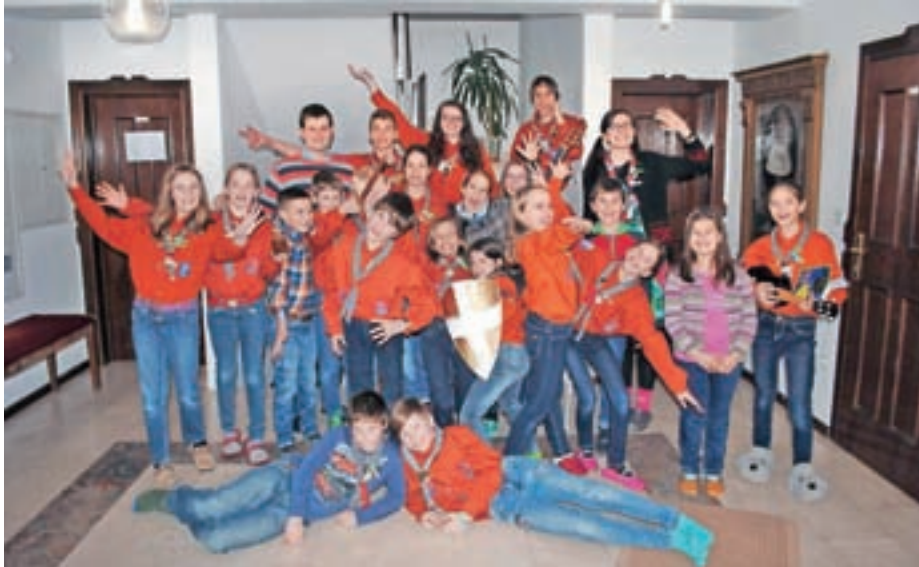
Pripravljene smo na boj z ledeno kraljico

Vsako leto 22. februarja skavti po vsem svetu praznujemo rojstni dan našega ustanovitelja Roberta Baden-Powella (B. P.). Na ta dan skavti še posebno skrbno delamo dobra dela. V soboto, ki je sledila dnevu spomina, smo se vsi skavti iz stega Železniki 1 zbrali skupaj in v spomin na našega ustanovitelja imeli veliko igro. V njej so morali skavti pokazati svoje spretnosti v skavtskih veščinah in znanje o življenju Roberta Baden-Powella. Ključno za hitro napredovanje po igralni plošči pa je bilo tudi sodelovanje v skupini, kar B. P. poudarja tudi v svoji skavtski metodi. Da je bila igra še bolj napeta, pa je poskrbela unikatna igralna plošča, ki je s posebnimi polji skupino lahko popeljala v vodstvo ali pa skoraj na začetek. Ko so vse skupine prišle na cilj, je sledil še drug del igre, ko so si skupine med seboj kradle zasta-