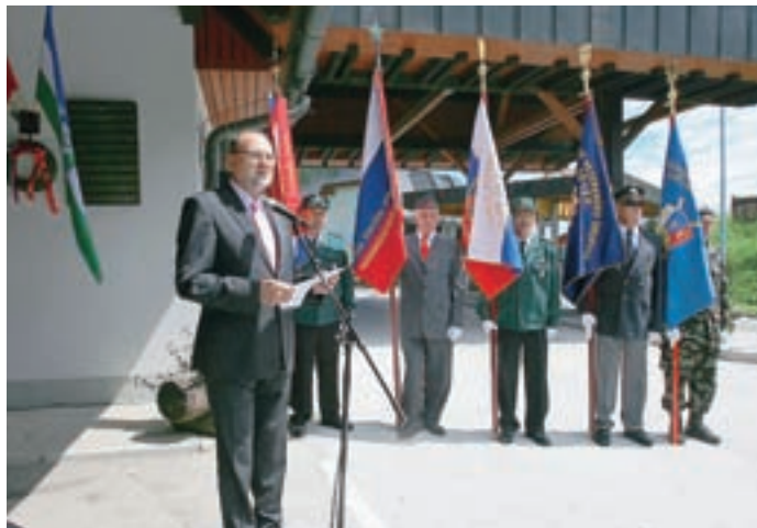
Slavnostni govornik Jelko Kacin

Dan državnosti in dvajseto obletnico osamosvojitve Slovenije so proslavili tudi na Jezerskem vrhu, ki je bil eden prvih mejnih prehodov, osvobojenih v osamosvojitveni vojni leta 1991.