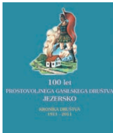
Naslovnica jezerske kronike