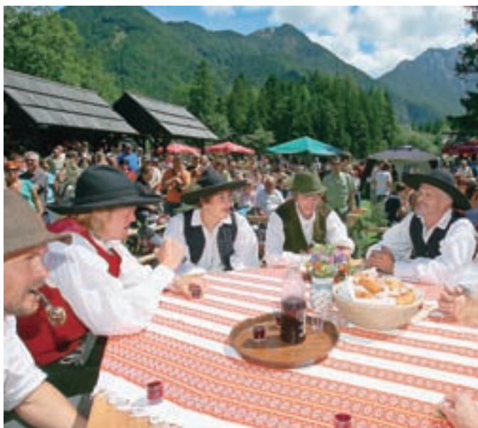
Gospodar je prisluhnil, kaj se je čez poletje dogajalo z ovcami na planšariji.

V nedeljo, 14. avgusta, bodo ob Planšarskem jezeru spet priredili Ovčarski bal. Tradicionalna prireditev je že triinpetdeseta po vrsti, vsako leto pa privabi veliko obiskovalcev od blizu in daleč.