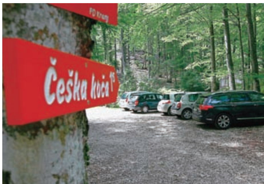
Sedanje parkirišče na Velikem placu

se razmere v gradbeništvu zadnje leto močno spremenile in sta postala funkcija neprofesionalnega župana in moje delovno mesto v Cestnem podjetju Kranj nezdružljivi, sem se po tehtnem premisleku odločil, da ostanem v gospodarstvu, kar posledično pomeni, da bomo Jezerjani predčasno volili novega župana.”