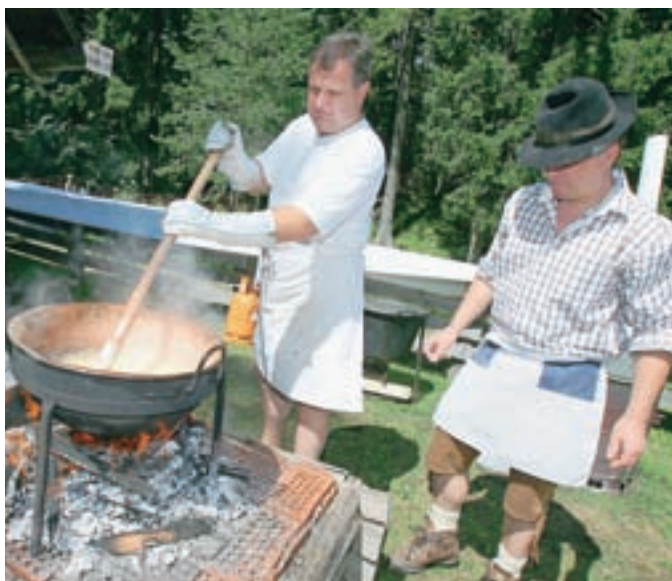
Kuharja sta spretno vihtela kuhalnice pri pripravi masovneka.