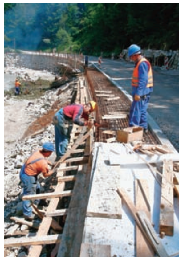
Delovišče na državni cesti Kranj-Jezersko

”Občinski svet je potrdil z zakonom določene nagrade za nepoklicno opravljanje županske in podžupanske funkcije ter sejnine. Ker so