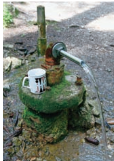
Na zdravje z jezersko slatino.