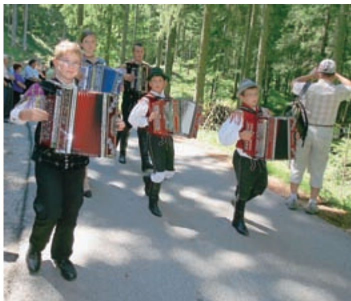
Tudi na lanskem ovčarskem balu so veselo razpoloženi skrbeli harmonikarji.

Tradicionalno etnografsko prireditev Ovčarski bal na Jezerskem tudi letos prirejata Gostišče ob jezeru in Turistično društvo Jezersko, pomagajo pa še druga jezerska društva, med njimi tudi Društvo rejcev ovc jezersko-solčavske pasme.