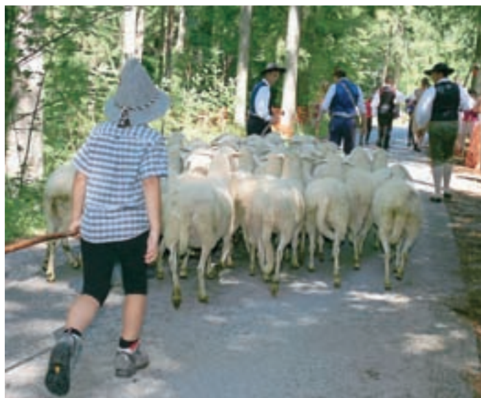
Glavne igralke ovčarskega bala