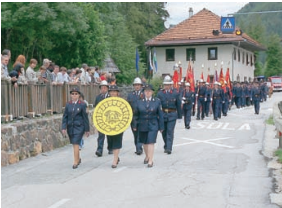
S prazničnega mimohoda gasilcev

Jezerskega praznovanja so se udeležili tudi župani sosednjih občin, Šenčurja, Naklega, Preddvora, Železne Kaple in podžupan Kranja. Preddvorski in kapelski župan sta si nadela tudi gasilski uniformi.