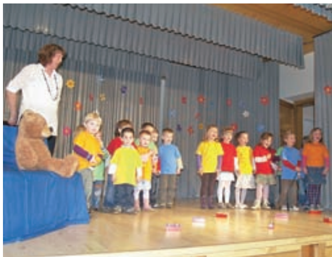
Jezerski šolarji in otroci iz vrtca so ob materinskem dnevu nastopili v Korotanu, aktiv kmečkih žena pa je ob tej priložnosti pripravil razstavo.