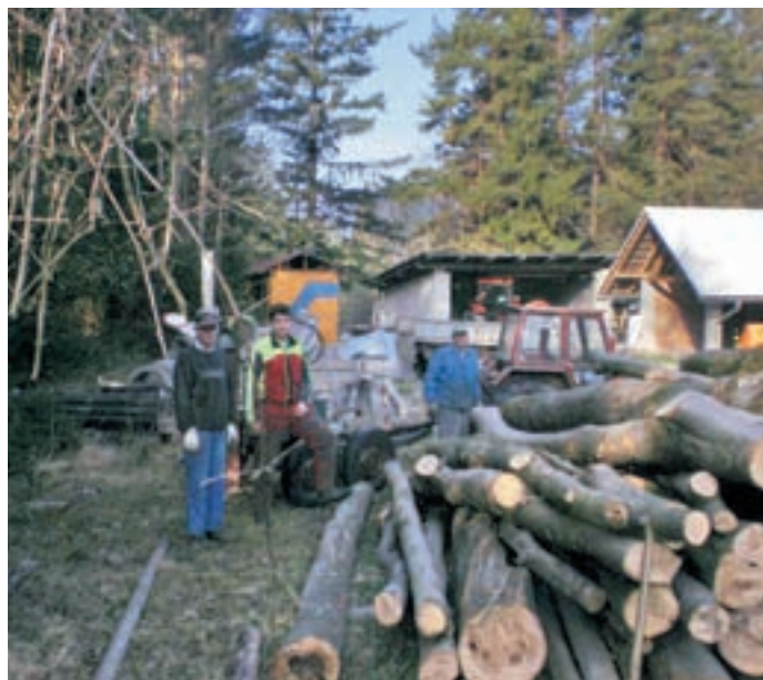
Tudi takole zbiramo sredstva za avtociстерno.