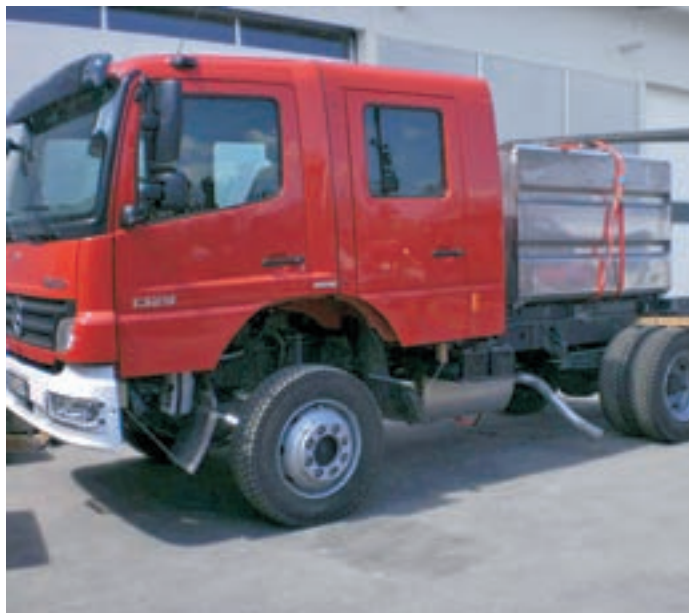
Izdelava nadgradnje v EVRO-GV