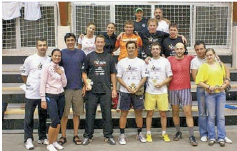
Z mednarodnega turnirja v Beogradu

ske prvenstvo v Beogradu, kjer smo slovenski reprezentanti dosegli izjemen uspeh. Trenutno zasedam prvo mesto na državni in deseto na evropski lestvici, kjer nas je registriranih 425 tekmovalcev. Veliko letošnjih ciljev in želja se mi je že izpolnilo, največji uspeh pa je nedvomno naslov državnega prvaka. Čeprav trenutno čakam na izvide magnetne resonance in na možnost operacije hernije, pa upam, da me ta poškodba ne bo prikrajšala za nadaljnje uspehe.