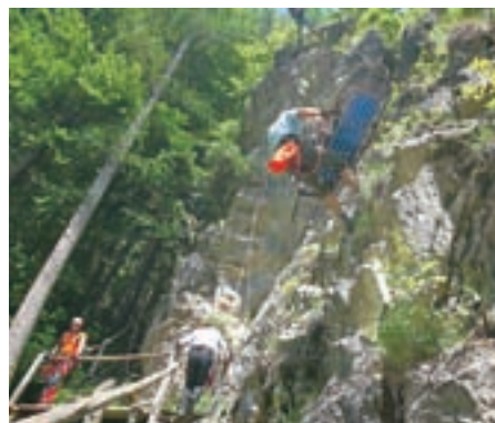
Ob dnevu gorskih reševalcev na Jezerskem so prikazali reševanje iz stene.