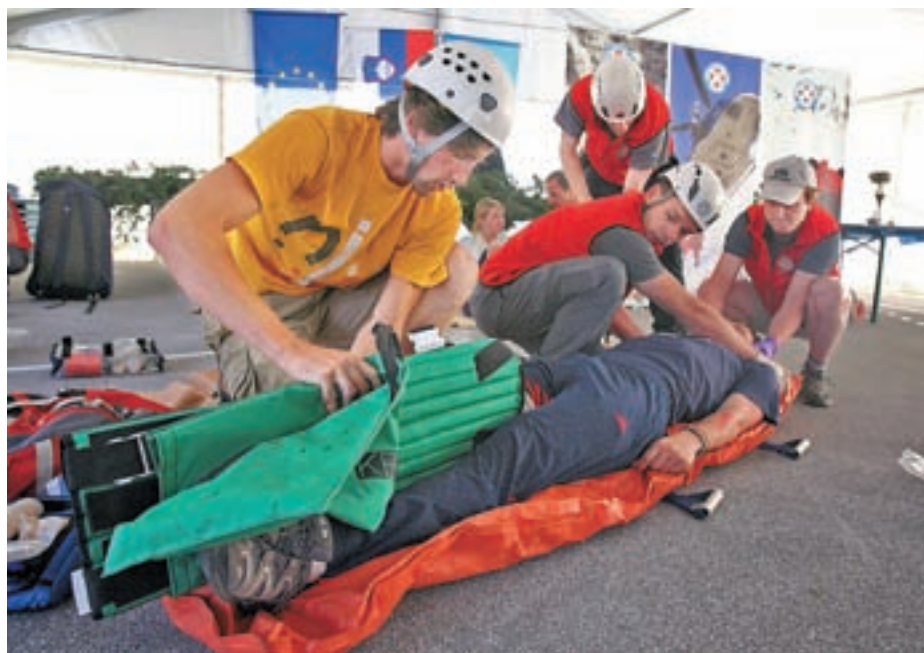
Vsi tekmovalci so se izkazali v tekmovanju iz prve pomoči.