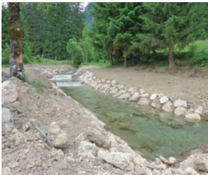
Trenutno potekajo sanacijska dela v strugi Jezernice.