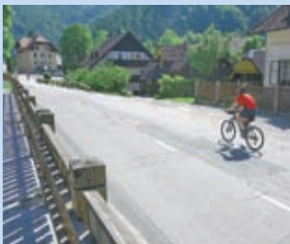
Na Jezersko prihajajo uživati naravo tudi kolesarji.

Jezersko je kandidiralo za čezmejni projekt pod naslovom Brezmejna doživetja narave (Nature Experience), v katerem želijo pridobiti denar za izdelavo strategije razvoja turizma, ureditev tematske poti od vasi do Planšarskega jezera (nekdanja Prešernova pot) in nadgradnjo občinskih spletnih strani s turističnimi vsebinami. Gre za triletni projekt, ki poteka v sodelovanju s sosedi Avstriji, vanj pa je vključenih osemnajst partnerjev. Letos naj bi dobili okoli 44 tisoč evrov. D. Ž.