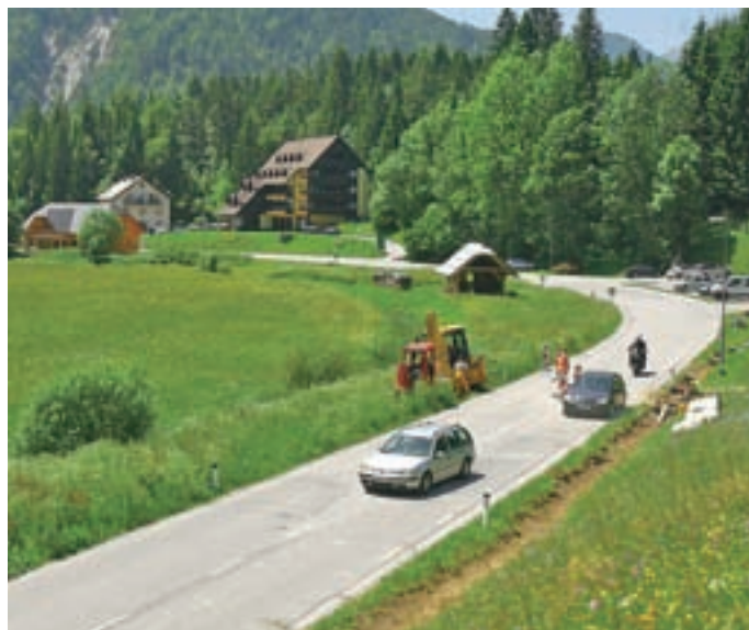
Dela ob regionalni cesti skozi Jezersko

kanalizacije na listo prioritarnih projektov za kandidaturu na 5. javnem razpisu v okviru razvojne prioritete Razvoj regij, prednostne usmeritve Regionalni razvojni program. Predviden skupni znesek sofinanciranja vseh gorenjskih prioritarnih projektov iz Evropskega sklada za regionalni razvoj v obdobju 2010-2012 je približno 18 milijonov evrov, Jezersko pa dobi kakih 860 tisoč evrov. Tako je v sklopu tega projekta predvidena gradnja čistilne naprave za 800 PE in pripadajočega kanalizacijskega omrežja. Investicija bo zaščitila podtalne in talne vode na območju, ki predstavlja enega bolj pomembnih vodnih virov in s tem bodočega vodnega zajetja regijskega pomena.”