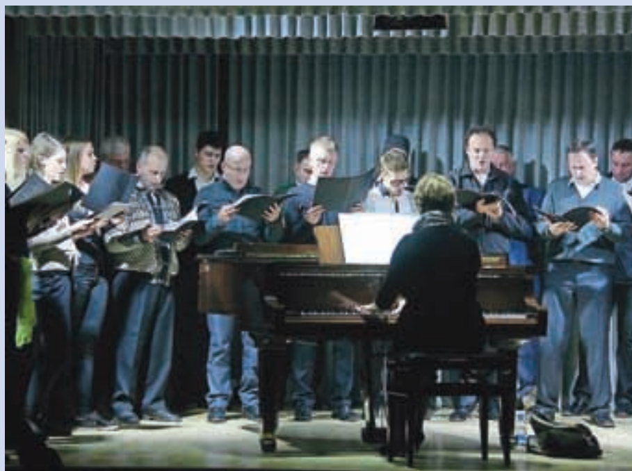
S koncerta Cerkevnege pevskega zbora Jezersko