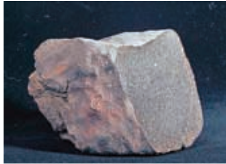
Meteorit Jezersko

Velika večina meteoritov izvira iz glavnega asteroidnega pasu med Marsom in Jupitrom. Stari so okoli 4,6 milijarde let in so edinstvene priče nastanka našega osončja. Če so majhni, ob padcu ne povzročijo večje škode, veliki pa lahko povsem spremenijo podobo Zemlje. Meteoriti so sestavljeni iz mineralov. Za večino meteoritov velja, da imajo višjo gostoto kot kamnine v njegovi okolici. Poleg tega imajo temno rjavo do črno žgalno skorjo, jamice na površini, v notranjosti so svetli, beli ali sivi, in običajno so magnetni.