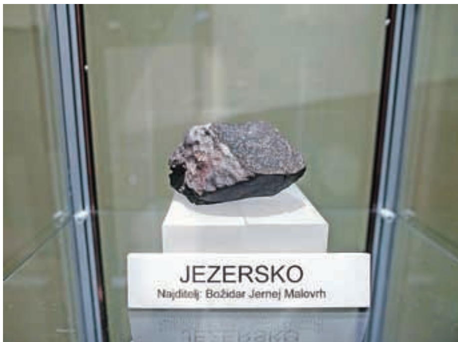
Jezerski meteorit pod steklom v Prirodoslovnem muzeju Slovenije