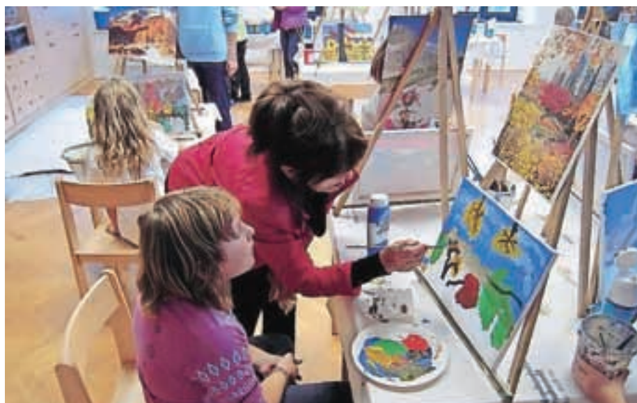
Risarji na srečanju treh šol