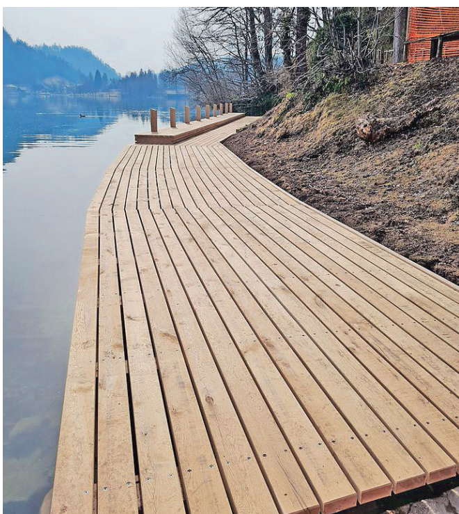
Dela v pristanišču na severni obali Blejskega otoka so zaključena.

Občina Bled je zaključila dela v pristanišču na severni obali Blejskega otoka, ki je z odlomkom razglašen za kulturni spomenik državnega pomena. Vsi sodelujoči so prav zaradi najvišje stopnje varovanja dediščine pri izvedbi del postopali še s posebno stopnjo skrbnosti.