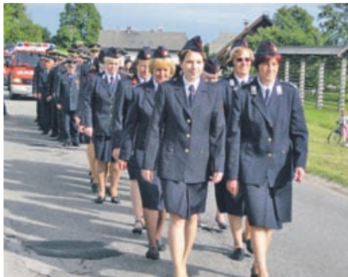
Pripravili so tudi gasilsko parado.

Smokuškim gasilcem so čestitke ob jubileju izrekli še rojak iz njihovih vrst ter poveljnik Gasilske zveze Gorenjske in član upravnega od-