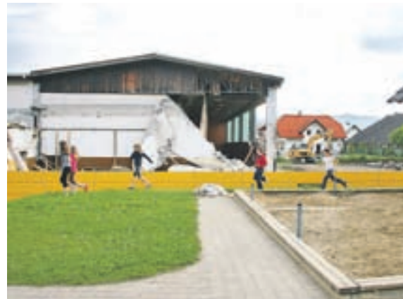
Rušenje dotrajane telovadnice pri OŠ Žirovnica

”Predvidevamo, da po dopustih, saj naj bi direkcija za ceste že izbrala izvajalca, sredstva pa so zagotovljena tako v državnem kot občinskem proračunu.”