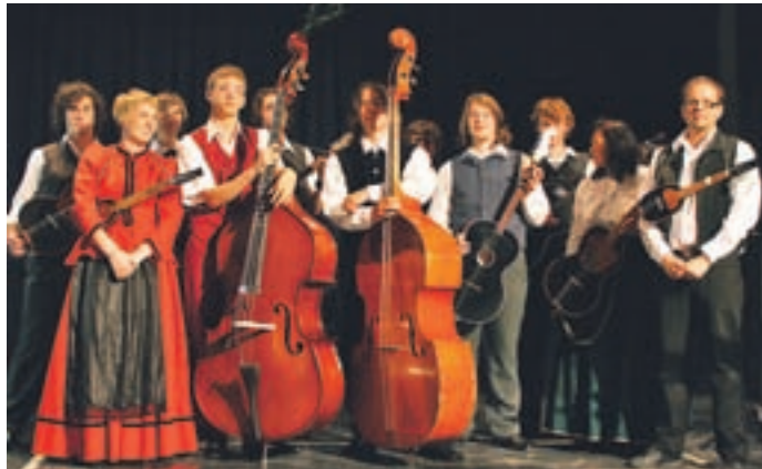
Tamburaška skupina Kašarji bo letos že tretjič nastopila na Krfu.

”Letos gremo že tretjič na Krf v Grčijo, znova smo dobili povabilo tudi iz Banjaluke v Bosni in Hercegovini. Pri tem gre zahvala županu Žirovnice, ki nas bo tudi finančno podprl. Vabila dobivamo tudi za nastope po Evropski uniji in v Ameriki, a je to žal povezano z zelo visokimi stroški. Še naprej si nameravamo prizadevati za kakovost, pisati