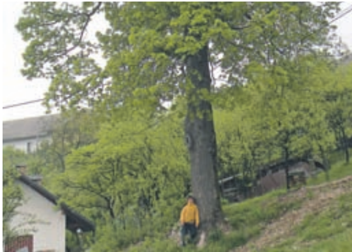
Lipa po že izvedenih delih kopanja za vodovod.