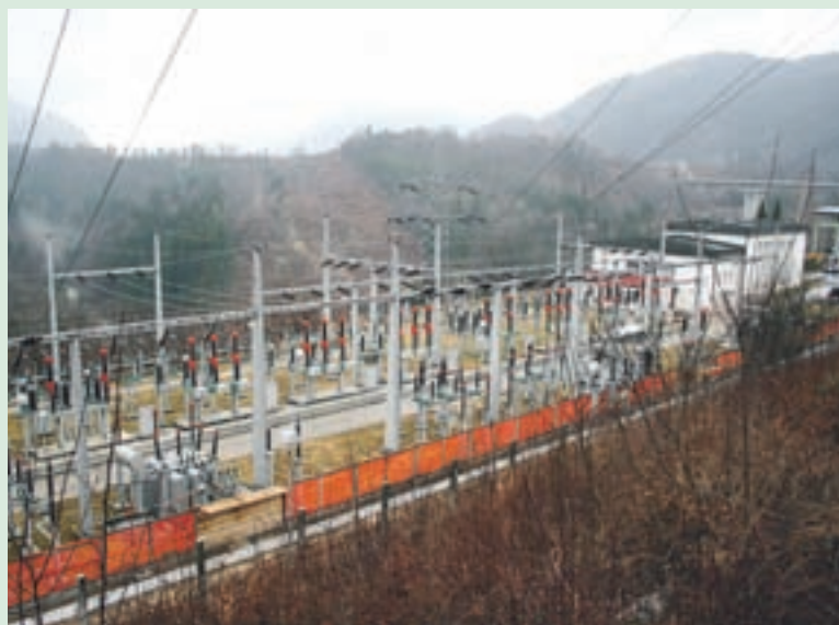
Obnova HE Moste se bo zaključila prihodnje leto.