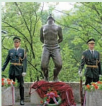
Naslovnica: Nov kip talca v Mostah