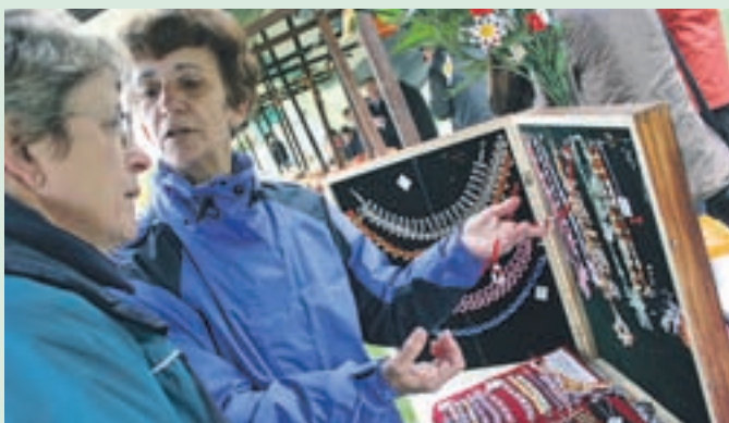
Na Markovem smn'u se je predstavilo 22 razstavljalcev.