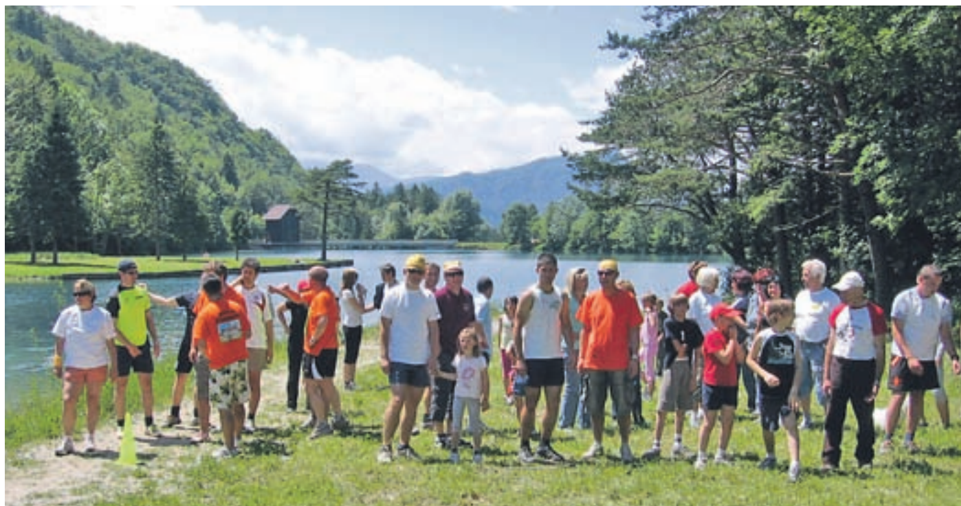
Udeleženci teka okoli jezera v Završnici