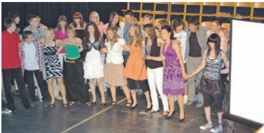
Šolo je v tem letu zaključilo 38 učenec in učencev devetega razreda.

Učenci so bili aktivni tudi na številnih dejavnostih bodisi s kulturnega, naravoslovno tehničnega in športnega področja. V okviru teh dejavnosti - kulturni, naravoslovni, tehniški, športni dnevi ter šole v naravi - je bilo dovolj možnosti, da so znanje dopolnjevali še na drugačen in mogoče zanimivejši način kot pri pouku. Na ekskurzijah so spoznali številna bogastva kulturne, zgodovinske in geografske dediščine novih krajev Slovenije. V 1. razredu so obiskali živalski vrt v Ljubljani, v 2. razredu so bili v Narodni Galeriji v Ljubljani in na glasbeni in likovni delavnici v Sorici, v 3. razredu so si ogledali Prirodoslovni muzej in njegove zbirke ter mesto Ljubljana. Učenci 4. razreda so spoznali Slovenski šolski muzej in staro mestno jedro v Ljubljani, geografske in kulturno-etnografske značilnosti Gornjesavske doline. Peti razred je bil v Kamniku, Postojnski jami in Predjamskem gradu ter Tehniškem muzeju v Bistri. V 6. razredu so bili na Planini v jami in na Planinskem polju, ogledali so si Cerknjsko jezero, na Rašici pa Trubarjevo domačijo, vmes pa tudi zanimivo učno gozdno pot v Rakovem Škocjanu. Jeseni so bili v Kropi, Škofji Loki in na Visokem, na poti pa spoznali Kovaški muzej, Dražgoše, plavž v Železnikih, škofjeloški muzej in spomenik Ivanu Tavčarju. V aprilu pa še arboretum v Volčjem Potoku. Sedmošolci so bili jeseni na Primorskem v Piranu, Portorožu in Sečovljah,