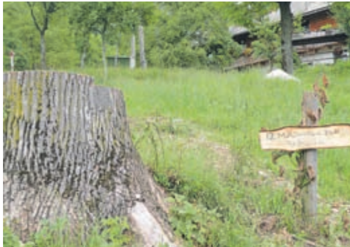
Komentar je najbrž odveč.

Že od leta 2007 se je govorilo, ko je skrbnik posestva posekal lipo na enem koncu naše hiše, da se bo spet našel nekdo, ki bo hotel podreti tudi lipo na drugem koncu hiše. Seveda nisem mogla verjeti, da bi lahko še kdo tako nerazumno razmišljal. Pa sem se kot zgloda zmotila.