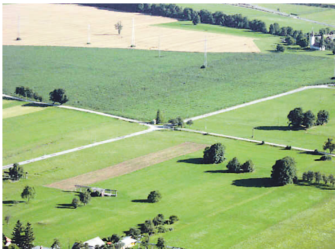
Tretja nagrada: Križišče med Breznico in Vrbo, avtorica Maja Jauh iz Zabreznice