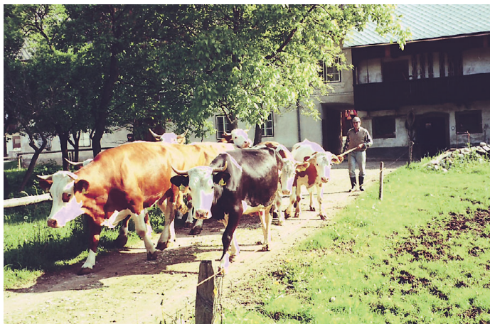
Druga nagrada: Na pašo, avtor Franci Jamar z Breznice