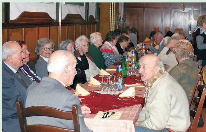
Srečanja se je udeležilo 40 občanov, starejših 80 let.