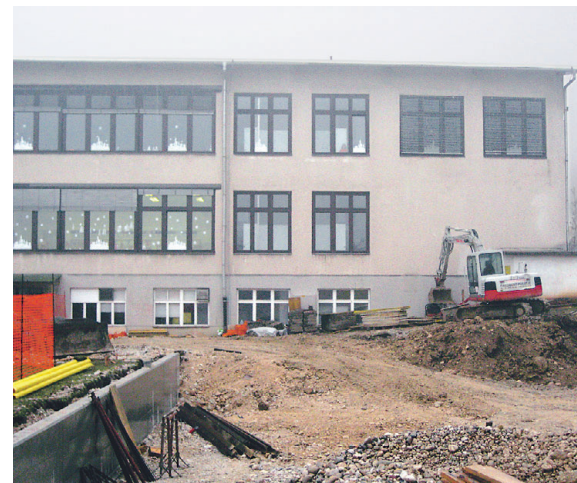
Gradnja parkirišč pri Osnovni šoli Žirovnica

dodatne zobne ambulante za območje naše občine. A na OZG in kranjskem zavodu za zdravstveno zavarovanje so nam odgovorili, da sprejeti Področni dogovor za zdravstvene domove in zasebno zdravniško dejavnost v letu 2008 ne vključuje nobene širitve mreže na področju zobozdravstva za odrasle v občini Žirovnica. Tako smo na ministrstvo za zdravje novembra naslovili prošnjo za pojasnilo, kdaj lahko pričakujemo širitev mreže na področju zobozdravstva, a še nismo prejeli odgovora. Vsekakor si bomo prizadevali za dodatnega zobozdravnika, saj ga nujno potrebujemo.”