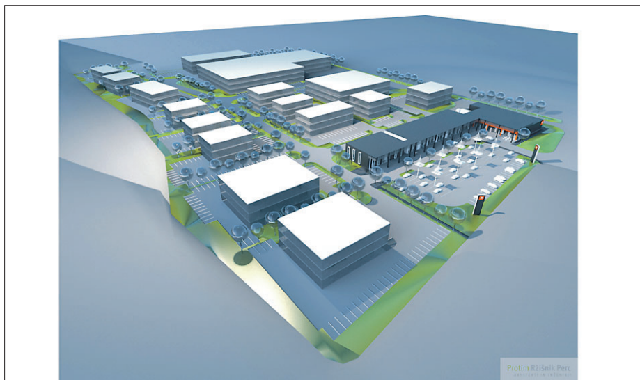
Takole naj bi bila videti obrtna cona v Žirovnici.