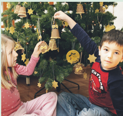
Na naslovnici: Praznično vzdušje v vrtcu

NOVICE OBČINE ŽIROVNICA (ISSN 1854-4932) - Ustanovitelj in izdajatelj: Občina Žirovnica, Breznica 3, 4274 Žirovnica. Pravice izdajatelja izvaja: Gorenjski glas, d. o. o., Kranj, Bleiweisova cesta 4, 4000 Kranj. Odgovorna urednica: Marija Volčjak. Urednica in novinarka: Ana Hartman. Časopis izhaja v nakladi 1.550 izvodov, brezplačno ga prejemajo vsa gospodinjstva v Občini Žirovnica. Tisk: Set, d. d., Ljubljana. Naslov uredništva: Gorenjski glas, d. o. o., Kranj, Bleiweisova cesta 4, 4000 Kranj, tel. 04/201-42-00, fax: 04/201-42-13, e-pošta: ana.hartman@g-glas.si ; trženje oglasov: Aleš Šenk, ales.senk@g-glas.si , tel.: 041/638-980.