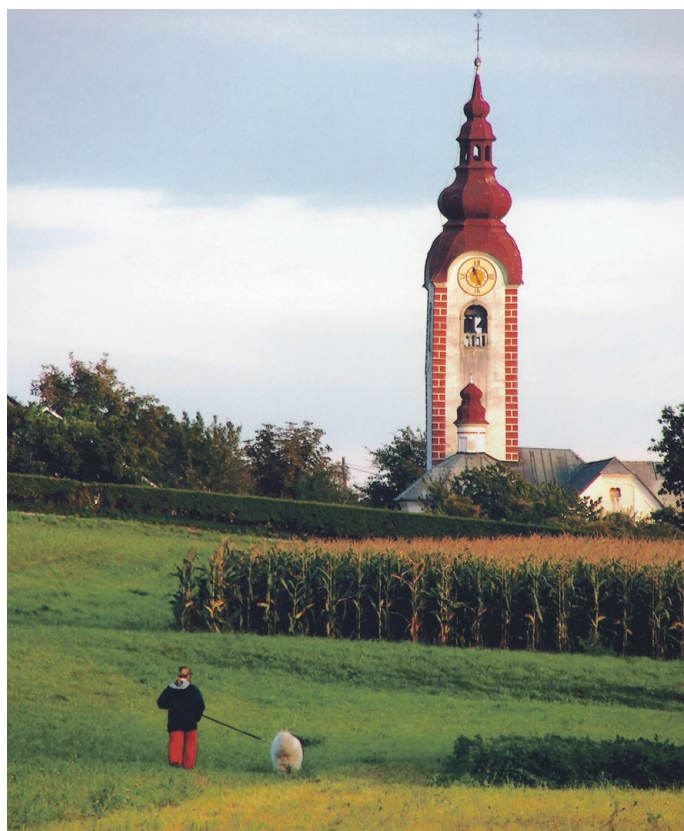
Prva nagrada: Popoldanski sprehod, avtor Bogdan Bricelj z Jesenic