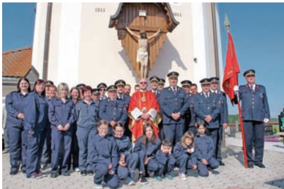
Florjanova nedelja prvič tudi na Spodnjem Brniku

in zbijanju tarče, prva tri mesta pa so osvojile ekipe PGD Cerklje. Mladina do 11 let je tekmovala v prenosu vode; slavila je ekipa PGD Cerklje 1 pred PGD Lahovče 2 in PGD Hotemaže 2. V tekmovanju za največ načrpane vode so bili najboljši PGD Hotemaže 1, PGD Cerklje 2 in PGD Hotemaže 2. Organizatorji so z mislimi že pri jubilejnem, 30. Barletovem memorialu, za katerega obljublajo, da bo nekaj posebnega.