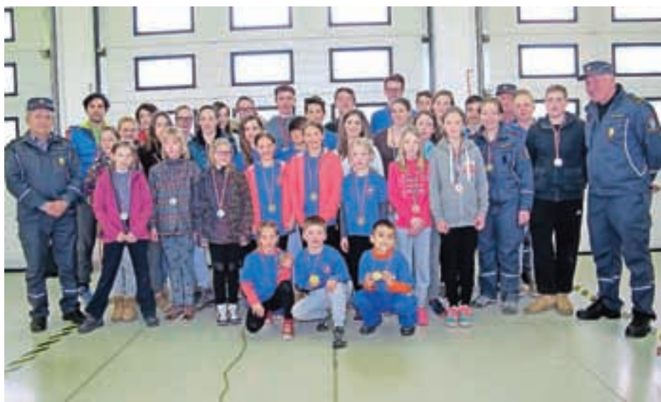
Najboljše ekipe Gasilske zveze Cerklje so se uvrstile na regijsko tekmovanje, ki bo 12. marca v Lescah.

ekipe PGD Zgornji Brnik in PGD Zalog, pri čemer velja posebej omeniti zaloške gasilke, ki so v Cerkljah doživele debi v kategoriji članic, saj je njihova najmlajša tekmovalka prav na dan tekmovanja dopolnila zahtevanih 16 let. Tekmovanja napadalcev, ki so se pomerili v vaji z motorno brizgalno, se je udeležilo 18 ekip članov in šest ekip članic. Prvi mesti so osvojili gasilci PGD Starše in gasilke s Šmartnega na Pohorju.