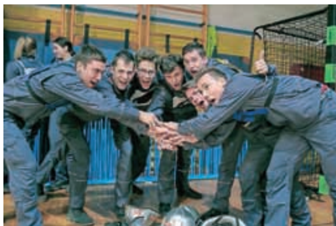
Mlada ekipa Zaloga (na sliki) se je v spajanju sesalnega voda uvrstila na 12. mesto, eno mesto pred njimi pa so bili gasilci PGD Zgornji Brnik.

V spajanju sesalnega voda se je po sistemu izpadanja pomerilo 41 ekip članov, najboljša je bilo PGD Podgorci, in 31 ekip članic, kjer je slavila ekipa PGD Hajdoše A. Uspešno so nastopile tudi