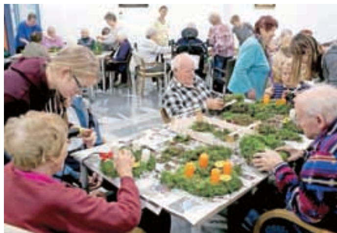
Stanovalci doma so se nedavno razveselili šolarjev, s katerimi so izdelovali adventne venčke.