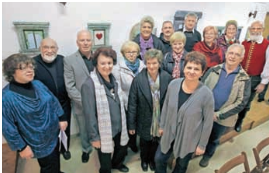
Cerkljanski likovniki na odprtju zadnje razstave

V župnijski dvorani v Cerkljah je bila od 20. do 22. novembra na ogled četrta skupna razstava članov Društva likovnikov Cerklje, Kulturnega društva Dobrava Naklo in Kulturnega društva Tabor Podbrezje z naslovom Narodne v sliki, pesmi, plesu in zgodbi. Cerkljanski likovniki so podobno kot v prejšnjih letih motive večinoma iskali v narodnih in ljudskih pesmih, letos pa so jih navdihovale še zgodbe in njihovi junaki v ljudskem izročilu. Gostje iz Naklega in Podbrezjij so prispe-