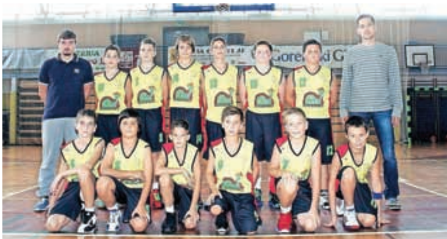
Ekipa U13 Mexicano Tonač Krvavec

Člani ekipe Krvavec Meteor so se po porazu v prvem krogu v Idriji zbrali in nato dosegli pet zaporednih zmag ter na lestvici ujeli drugouvrščeno Hidrio. Na prvem mestu je Vrhnika. Kar pet naših najmlajših ekip se bo 6. decembra udele-