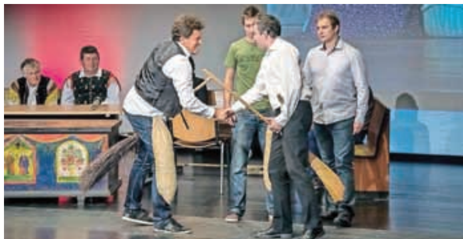
Utrinek s prireditve Veselih 10 Pod Stražo