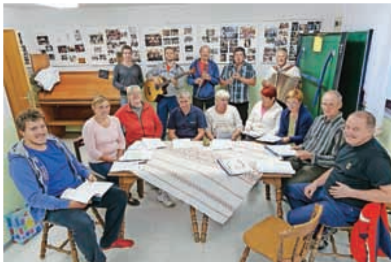
Utrinek z vaje

Na ta dan pred desetimi leti nas je ob ličkanju koruze večina igralsko prvič stopila na odrske deske. To je bilo rojstvo nove dramske skupine, ki pa ni le igralska, temveč mnogo več. Za igralce se je s tem začelo čisto drugačno obdobje: iskanje odrskih del, številne bralne vaje, učenje vlog in vaje na odru, sestanki in dogovarjanja, iskanje ter šivanje oblačil za igralce, izdelava kulis in rekvizitov. Sledila je skrb za promocijo in prepoznavnost, pa dogovarjanja za nastope pred domačo publiko in gostovanja po sosednjih in oddaljenejših odrih. Poleg šestih dramskih uspešnic, ki so doživele po najmanj deset ponovitev, smo obujali še stare običaje in navade. Poiskali smo mnoge stare pesmi in napeve in jih predstavili na celovečernih avtorskih prireditvah Slovenec moj, zapoj z menoj. V spomin nekdanjim krvavškim pastirjem in pastircam ter z namenom ohranjanja kulturne dediščine smo izdali knjižico Sem na Krvavcu kravce pase. Za sovaščane so bile v Domu krajanov Poženik v teh letih organizirane številne prireditve ob različnih praznikih in priložnostih: materinski dnevi, mar-