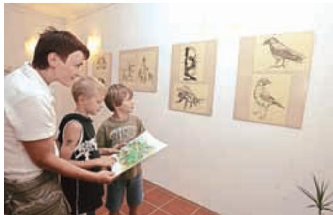
Razstava Pod krošnjami je v Petrovčevi hiši potekala konec avgusta.