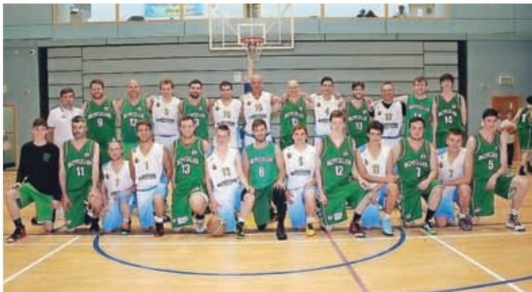
Člani ekip Krvavec Meteor in Moycullen Irska

Pionirji ekipe Europcar Krvavec igrajo najprej 20. septembra v Ljubljani proti Bežigradu, 27. septembra pa gostijo Triglav EGP iz Kranja. Mlajši pionirji Mexicano Tonač Krvavec v pokalu Spar 19. septembra gostujejo na Jesenicah. Fantje U11 Cisterna Krvavec in U9 Domačija Vodnik Krvavec bodo s tekmovanjem začeli novembra.