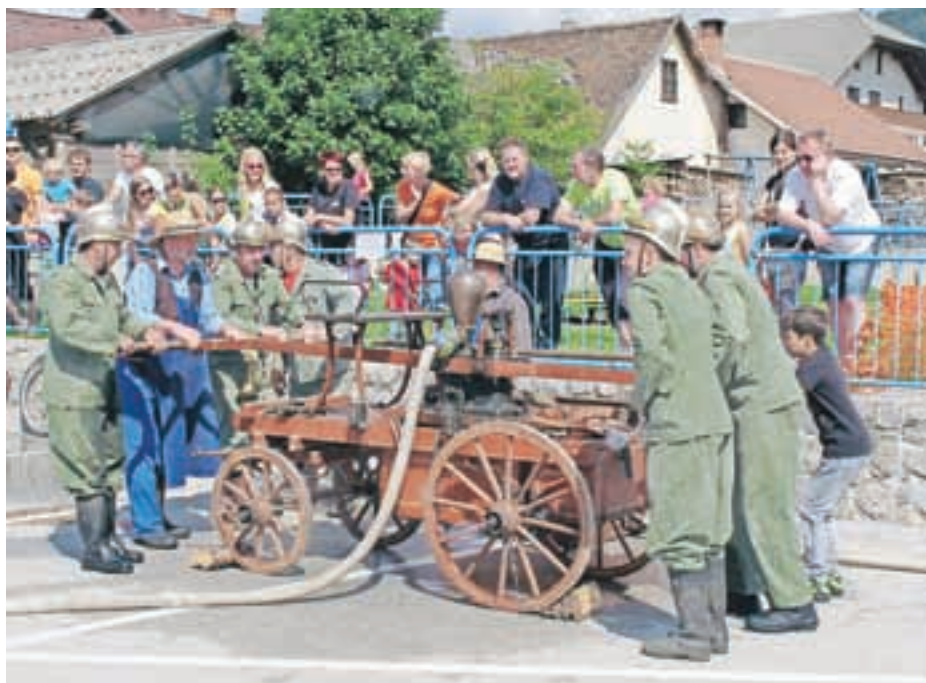
Semenj na rokovo so popestrili tudi gasilci z Zgornjega Brnika s prikazom gašenja nekoč.