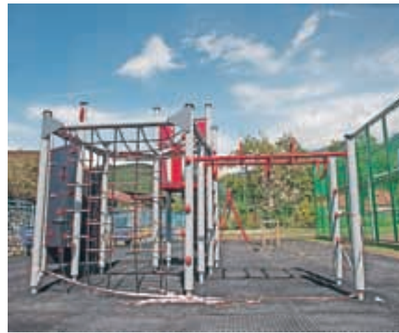
Na šoli v Cerkljah so se ob začetku šolskega leta razveselili novega otroškega igrišča.

Božič - Močnikova starše prosi, naj otroke od 2. razreda dalje osamosvajajo in naj jih ne vozijo več do šolskega vhoda, saj "tako iz otrok delajo invalide pri zdravih telesih. Gibanja je premalo. Otroci naj v šolo hodijo peš ali s kolesom, uporabljajo naj brezplačen šolski prevoz. Tako bo pred šolo bistveno manj gneče". Opozorila je še, da otroci danes preveč časa prebijejo za računalniki in ob telefonih, pogosto nenadzorovano. V Cerkljah so tako ob koncu lanskega šolskega leta obravnavali primer spletnega nasilja, ki ga je ravnateljica prijavila policiji. "Številni otroci imajo računalnike v svojih sobah, kar ni primerno za njihovo starost. Tako se je tudi pri nas pojavil primer spletnega nasilja, ko se otroci iden-