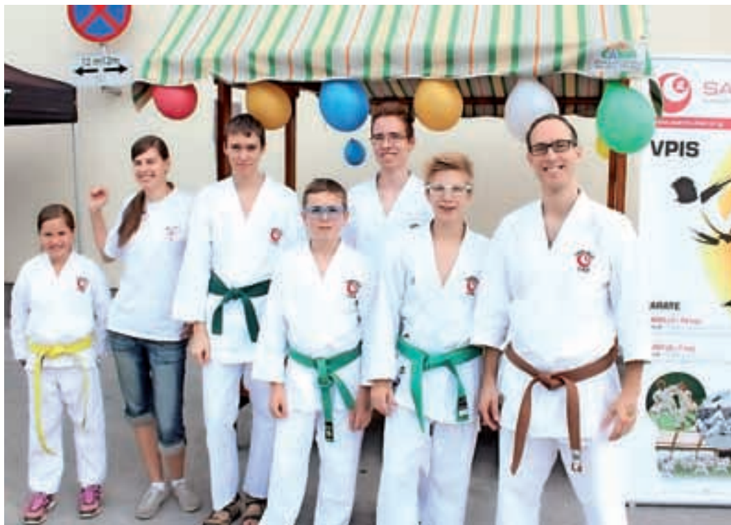
Predstavili smo se tudi na Semnju na rokovo.

Do konca septembra imamo v Karate klubu Cerklje odprta vrata za tiste, ki nas želijo spoznati. Otroci imajo v tem času