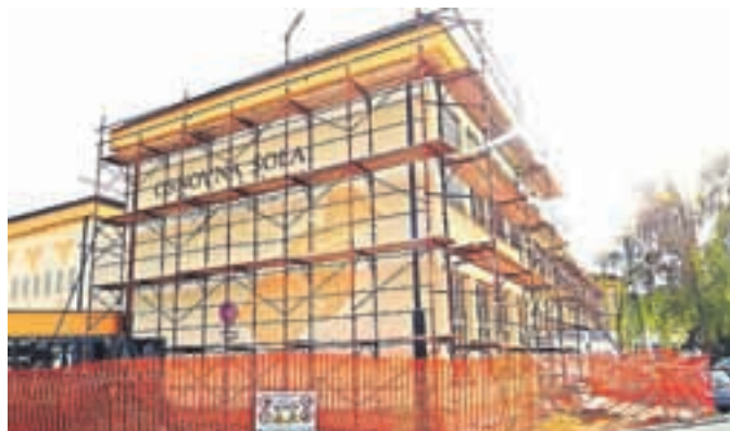
Šola v Cerkljah je učence ob začetku pouka pričakala odeta v gradbene odre – izvaja se namreč energetska sanacija stavbe.

V javnem zavodu, ki poleg šole zajema tudi Vrtec Murenčki, je 121 zaposlenih, od tega so tri delavke, ki svoje delo opravljajo še na drugih šolah. Zaradi varčevanja zaposlovanja novih sodelavcev (razen če gre za nujna nadomeščanja v primerih bolniških in porodniških dopustov oz. upokojevanja) ne predvidevajo, čeprav bi jih potrebovali. »Prav pri oddelkih podaljšanega bivanja se najbolj pozna varčevanje, tudi v letošnjem letu nam ministrstvo ni odobrilo toliko ur, kot smo jih na podlagi vpisanih otrok zaprosili. Vemo, da večina staršev svojih otrok ne utegne priti iskat do 15. ure, zato smo bili primorani po 15.20 organizirati le dežurno varstvo za učence od 1. do 3. razreda,« še pravi ravnateljica, ki učencem tudi v letošnjem šolskem letu obljublja veliko različnih vsebin, ki jih bodo lahko obiskovali v popoldanskem času. Kot nov projekt so si letos zadali aktivno preživljanje odmorov, saj si želijo otroke spodbuditi k skupni igri – »s poudarkom na gibanju, tako kot smo se igrali včasih.«