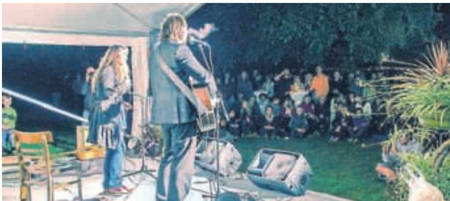
Koncert Severe in Gala Gjurin

Izgovorov za poletno mrtvilo v občini letos ni bilo, saj je konec avgusta dogajanje popestril festival Sanje pod Krvavcem.