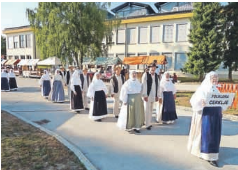
Udeleženci folklornega festivala so se obiskovalcem predstavili tudi na povorki skozi kraj.

Vrhunec dogajanja je bil rezultat uspešnega sodelovanja članov Unesco kluba in KD Folklor Cerklje. Slednji so sejem namreč sklenili obogatiti s folklornim festival Zapojem, zaukam, dekleta zasukam, ki naj bi postal tradicionalen in po načrtih folklornikov vsako leto bogatejši. Domača folklorna skupina je v goste letos privabila skupine iz Grobelj, Komende, Naklega in Šenčurja. Plesalci so se najprej predstavili na povorki od kmetijske zadruge do spominskega parka, nato pa še s plesi in kostumi, ki dokazujejo, da je folklorna dejavnost na območju med Kamnikom in Kranjem precej razvita. Poleg plesalcev so se predstavili tudi ljudski godci Cerkljanski gavnarji in pevke ljudskih pesmi Taščice. Člani KD Folklor Cerklje so se letos prvič znašli v vlogi organizatorjev tako obsežne folklorne prireditve na prostem. Dospel so sicer v dvorani že petkrat uspešno pripravili Večer folklor, ki bo letos