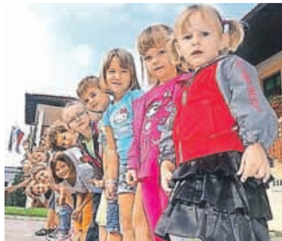
Počitniških delavnic za otroke se je udeležilo okoli trideset najmlajših.

Septembra se v center vrača vrsta dejavnosti za otroke in starejše. Torki bodo tako v znamenju Igralnih uric za najmlajše, ki se bodo začele ob 10. uri. Danes, 10. septembra, ob 20. uri bodo začeli z rednimi mesečnimi srečanji Pogovori o veri za odrasle. Srečanja bodo vsak drugi torek v mesecu. Vsak četrtek od 12. septembra dalje bodo Četrtkove ustvarjalnice,