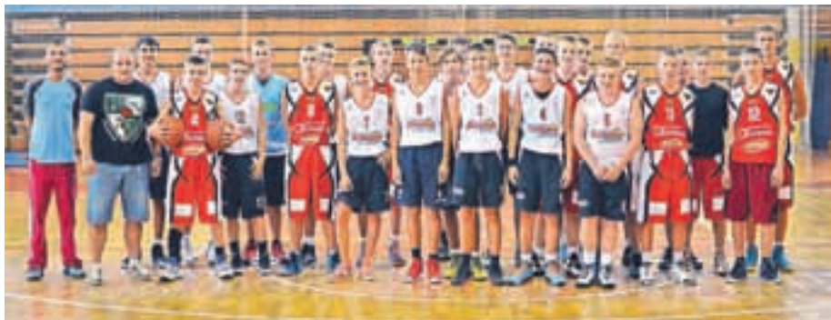
Kadeti obeh ekip na prijateljski tekmi v Cerkljah

Košarkarske ekipe Športnega društva Krvavec: kadeti Krvavec Botana, mladinci Ambrož Krvavec in člani Krvavec Meteor so se za uvod v novo sezono pomerile z ekipami iz Litve. Med 26. avgustom in 5. septembrom so gostili dve ekipi litovskih košarkarjev, ki so si na obisku pri nas ogledali tudi Krvavec, Bled in Ljubljano, ob tem pa še prijateljsko tekmo slovenske in francoske reprezentance v Stožicah.