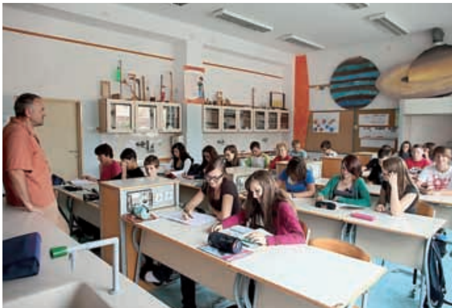
Učenci OŠ Davorina Jenka Cerklje na Gorenjskem na letošnji prvi šolski dan

K sodelovanju vabijo tudi vse starše in druge občane, saj je letos med drugim tudi evropsko leto medgeneracijskega sodelovanja. Na to temo bo življenje v šoli in zunaj nje spremljala in povezovala nova rdeča nit, ki se glasi Mi vam modrost, vi nam radost. »Brez medsebojnega spoštovanja in tesnega medgeneracijskega sodelovanja ne moremo graditi zdrave družbe. Kulturo naših prednikov, ljubezen do domovine in slovenskega jezika ter druge vrednote bomo odrasli mladim posredovali prek svojega znanja, svoje modrosti, zgleda. Če bomo starejši, torej učitelji, vzgojitelji, drugi delavci šole in vrtca, starši, sokrajani in drugi zunanji sodelavci, pripravljeni mlajšemu rodu posredovati svojo modrost, bomo zagotovo v prihodnosti želi njihovo radost nad tem, kar smo jim posredovali. Pri tem nam bodo v veliko pomoč tudi vsa medgeneracijska srečanja, ki jih bomo učenci in učitelji pripravili v letošnjem šolskem letu v sodelovanju z zunanjimi sodelavci, sokrajani, širšo lokalno skupnostjo,« pravi ravnateljica.