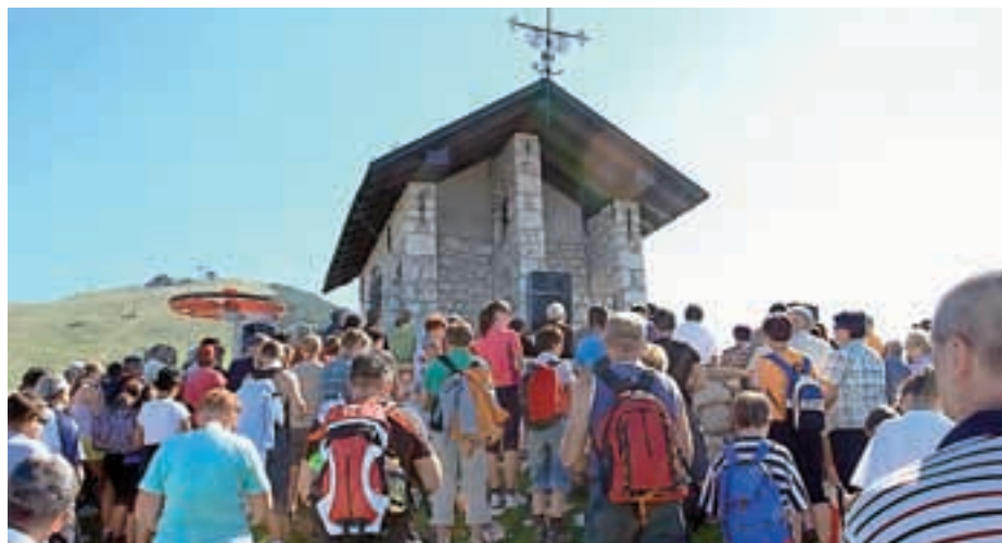
Žegnanjska maša na Krvavcu je bila tudi letos dobro obiskana.

Obe planini, tako Kriška kot Jezerska, sta v teh dneh še polni krav, čeprav se bodo počasi že od-