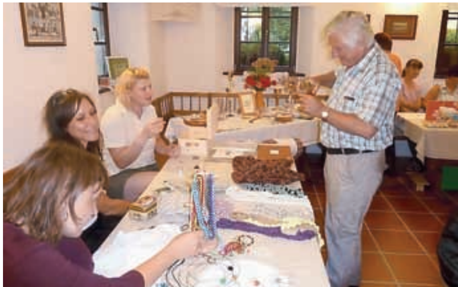
Rokov sejem je zaradi slabega vremena letos potekal kar v Petrovčevi hiši.