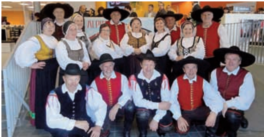
Cerkljanski folklorniki ob nastopu v ljubljanskem BTC marca letos

Med prireditvami in nastopi, kjer nas je mogoče videti in slišati, najbolj izstopa Večer folklore. Vsako leto z njim – letos že petič po vrsti – vstopamo v novo sezono. Letos smo ga poimenovali Zato smo mi semkaj prišli, izve-