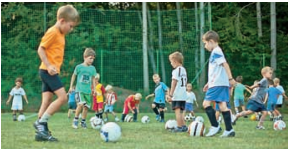
Brezplačne nogometne urice za najmlajše so bile tudi letošnje počitnice dobro obiskane.