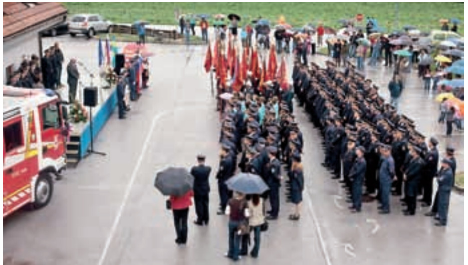
Slovesnost ob 120-letnici je potekala pri gasilskem domu v Cerkljah.

Visok jubilej je bil tudi priložnost za prevzem novega gasilskega vozila GVC 16/25, ki pred-