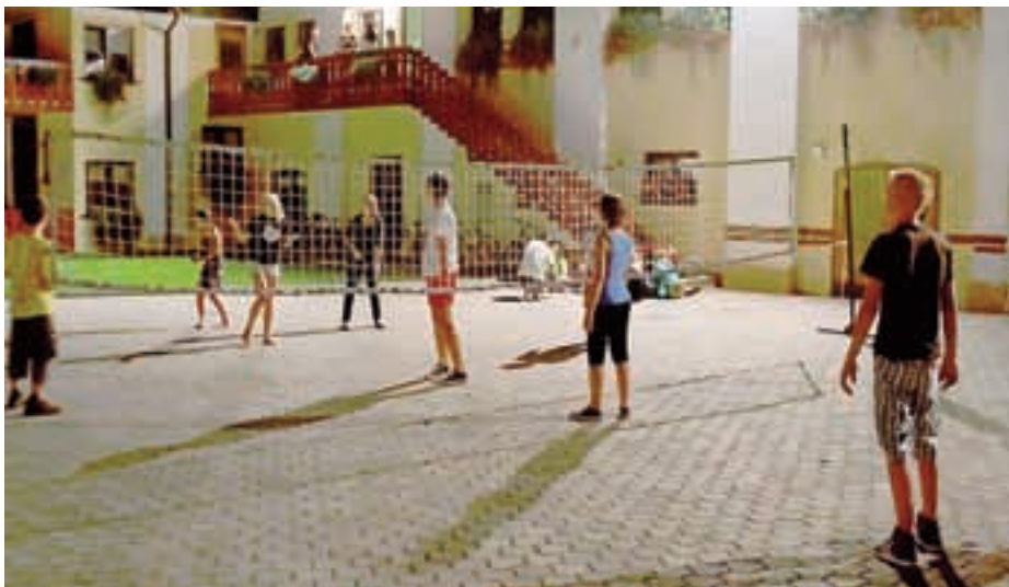
Letošnje poletje je v Družinskem in mladinskem centru Cerklje zaznamovala odbojka, ki so jo mladi ob večerih igrali na župnijskem dvorišču.

Kljub krajšemu predahu med počitnicami center tudi poleti ni miroval. Dvorišče se je večkrat na teden spremenilo v igrišče za odbojko, ki je privabljalo mladino od blizu in daleč. Jeseni bodo nadaljevali z že utečenimi programi in aktivnostmi, med katere sodi tudi praznovanje rojstnega dne centra, ki bo 8. oktobra. Napovedi številnih dogodkov pa bodo odslej objavljali tudi na svoji novi spletni strani. Jasna Paladin