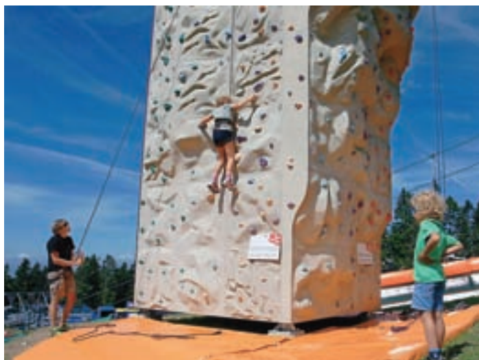
... in plezalni stolp.