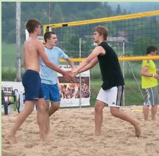
Pokal MaJaRoN je letos potekal na peščenih igriščih v Preddvoru.