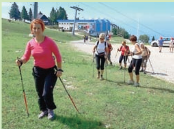
Prvi Dan nordijske hoje na Krvavcu