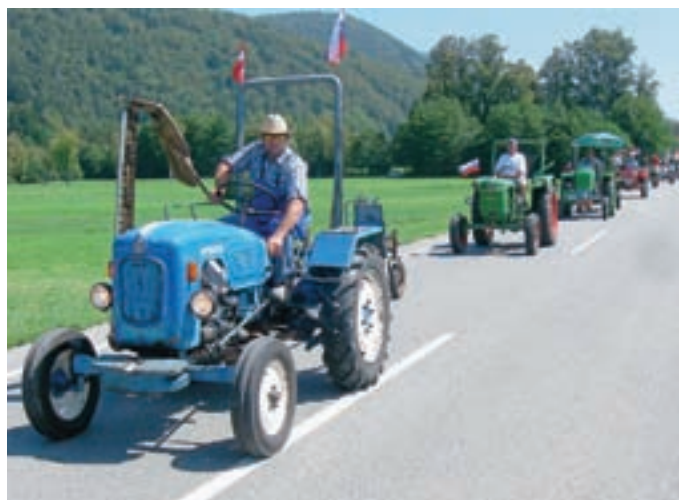
Povorka, v kateri so bili kosci in kosice, konjske vprege, starodobna kmetijska tehnika in vozila ...