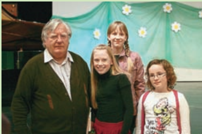
V krožku velik poudarek namenjamo tudi medgeneracijskemu povezovanju.