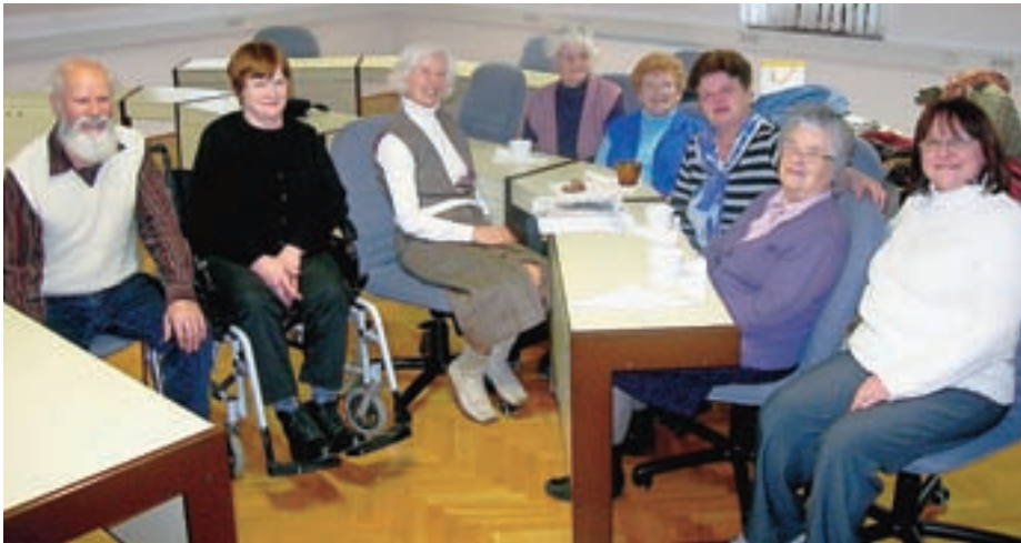
Skupino Zimzelen sestavlja osem članov, v svoje vrste pa vabimo vse, ki si želijo dobre družbe.