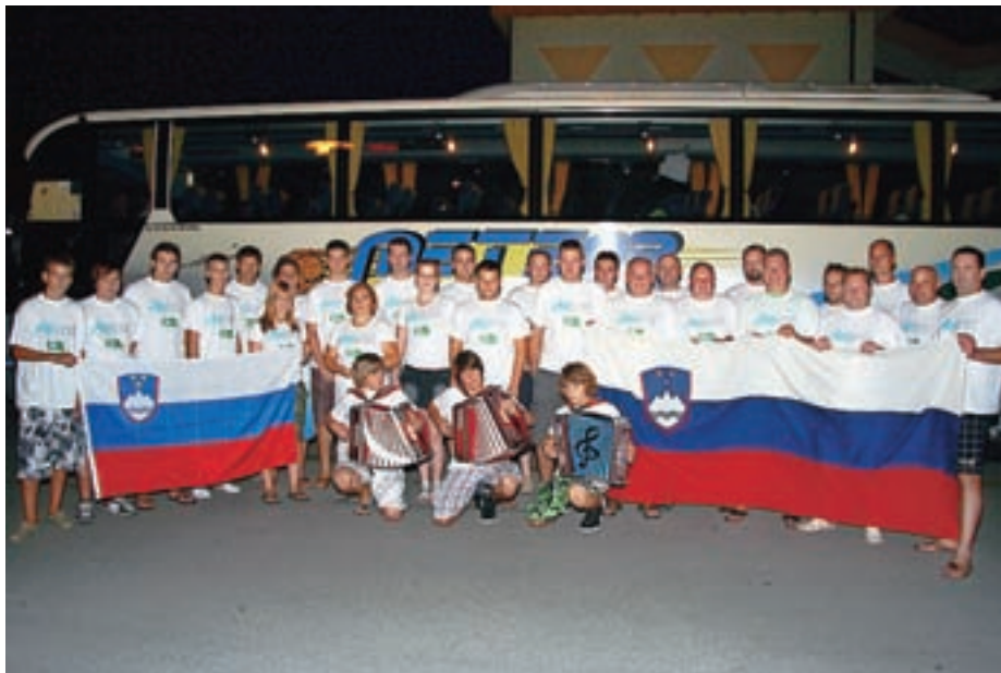
Skupinska fotografija z odhoda košarkarjev KD Krvavec v Litvo / Foto: Ivan Draškič

Košarkarske ekipe, kadeti, mladinci in člani ŠD Krvavec so v času od 24. avgusta do 3. septembra gostovale v Marijampolesu, Kaunasu in Klaipėdi v Litvi. Sicer pa člani Krvavca Meteorja sezono začenejo s tekmama pokala Spar 23. septembra v Postojni in 28. septembra z istim nasprotnikom v Cerkljah. Mladinci Ambrož Krvavec bodo prvo tekmo odigrali v Gorenji vasi 18. septembra, nato pa še z ekipami Jesenic, Stražišča, Triglava, Šenčurja in Radovljice. Kadeti Krvavca Botane najprej igrajo s Kranjskimi Orli, nato pa še z LTH Casting Mercator iz Škofje Loke, Radovljico, Jesenicami in Šenčurjem. Pionirji Europcar Krvavca najprej gostujejo v Šentvidu, Grosupljem in Šenčurju. Mlajši pionirji Krvavca Tonača pa v okviru občinskega praznika v nedeljo, 18. septembra, gostijo Postojno in Geoplin Slovan. Vse osnovnošolske otroke od 3. razreda naprej obveščamo, da bomo v septembru začeli s treningi košarke na OŠ Davorina Jenka. Vse ljubitelje košarke pa lepo vabimo na ogled prihajajočih tekem v športno dvorano v Cerklje. UO ŠD Krvavec