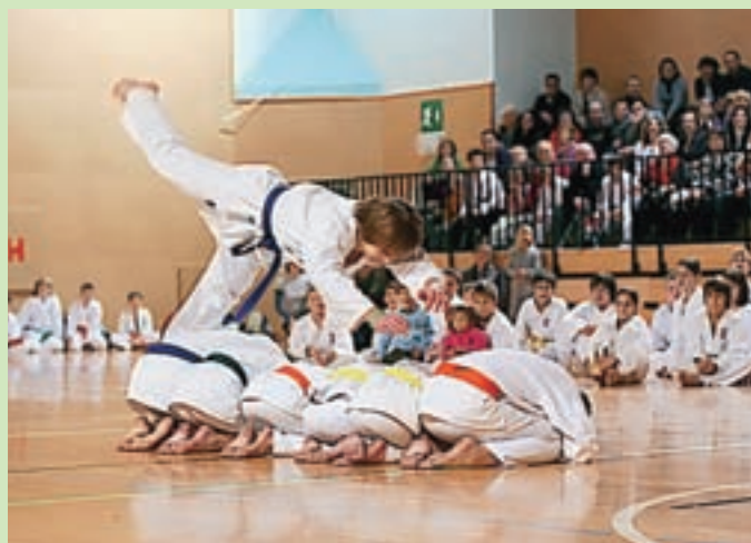
Člani Karate Kluba Cerklje

V čast praznovanju občinskega praznika karateisti Karate Kluba Cerklje pripravljamo gorenjsko regijsko tekmo za dečke v borbah in deklice v katah, ki bo potekala v športni dvorani v Cerkljah v soboto, 15. oktobra 2011, med 10. in 13. uro. Uspehi naših karateistov privabljajo vedno več novih članic in članov. Razvoju te veščine se v Cerkljah obeta lepa prihodnost, zato naj na koncu dodamo še vabilo k vpisu: brezplačnim treningom se lahko pridružite 13. in 15. septembra 2011 v športni dvorani v Cerkljah. Alenka Pintar