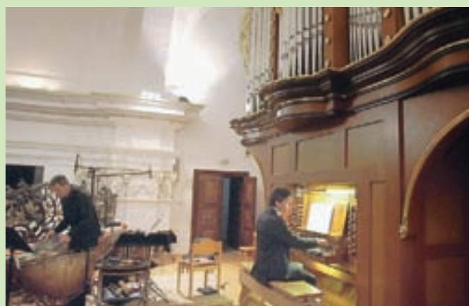
Festival Radovljica je letos že tretjič gostoval v Adergasu.