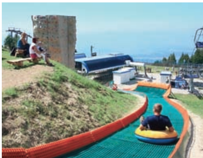
Med adrenalinskimi aktivnostmi so najbolj priljubljeni spusti s tubo ...