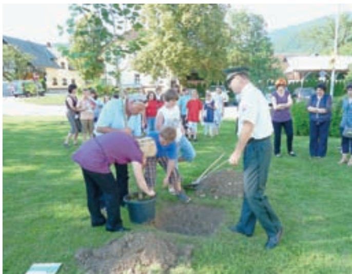
Lipa bo v čast 20-letnice samostojnosti rasla tudi pred cerkljansko osnovno šolo.