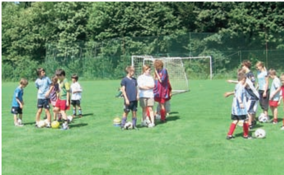
Letošnjega nogometnega tabora se je udeležilo 28 otrok.

Naše klubske sanje se uresničujejo. V soboto, 17. septembra, bo za vse člane in ljubitelje nogometa velik dan. Skupaj z občino pripravljamo uradno odprtje Nogometnega centra Velesovo. Celotni klub se veseli tega sanjskega dogodka, zato vse občane in občanke vabimo, da se poveselite z nami in se prepričate, da je ta