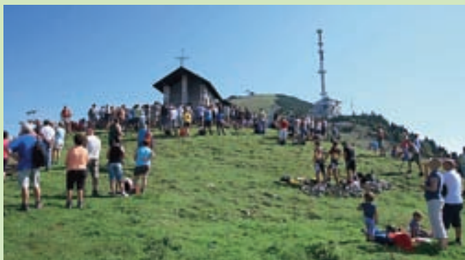
Tradicionalne maše pri Mariji Snežni na Krvavcu se je tudi letos udeležilo veliko planincev iz vse Slovenije.

Sončno vreme je v nedeljo, 21. avgusta, na Krvavec privabilo več tisoč obiskovalcev, ki so se udeležili tradicionalne žegnanjske maše, ki jo v Plečnikovi kapelici Marije Snežne pri Domu na Krvavcu vsako