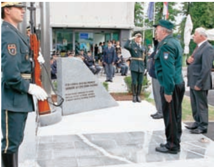
Slovesnost na brniškem letališču

Dan državnosti je letos tudi v občini Cerklje minil v znamenju 20. obletnice samostojnosti Slovenije in številnih temu posvečenih prireditev.