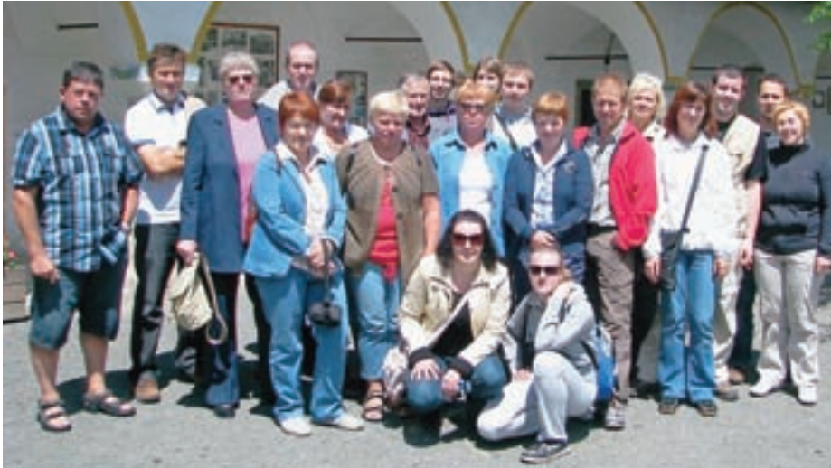
Na dan državnosti smo obiskali Koroško.

Trenutno izbiramo novo dramsko delo, se pripravljamo na večer petja in plesa v septembru in pripravljamo ustvarjalne delavnice, ki bodo potekale v jesenskem času.