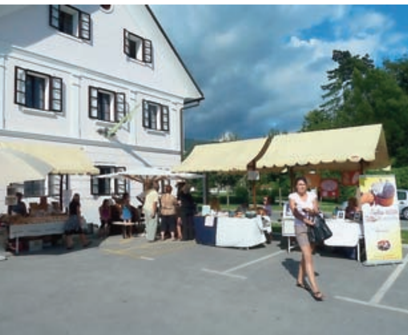
Rokov sejem je bil včasih največji sejem v Cerkljah.