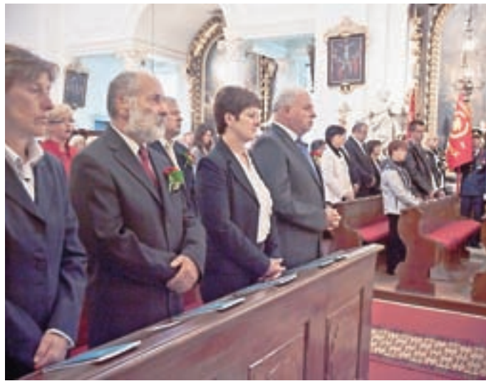
Osrednja občinska proslava je potekala v cerkvi v Adergasu.