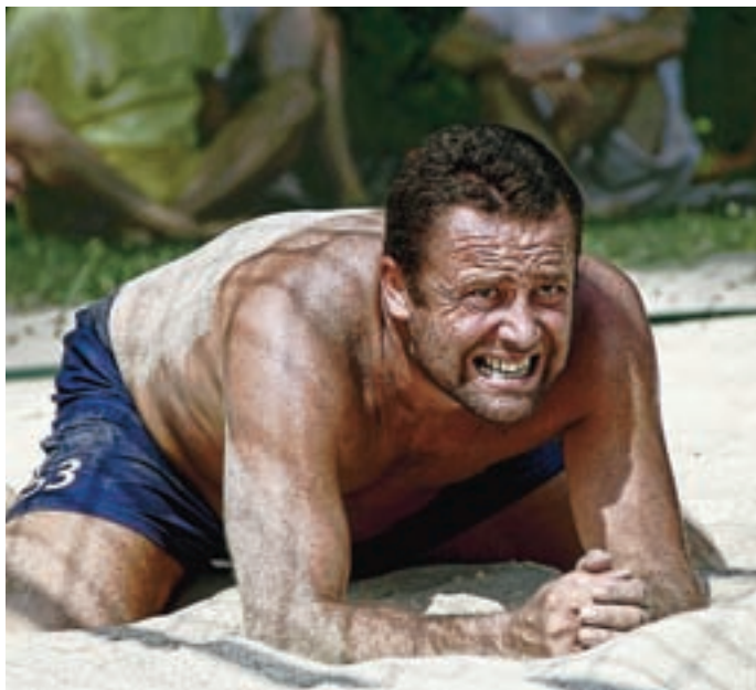
Ena od razstavljenih fotografij

Čeprav je bila tokratna razstava fotografij njegova prva, so ga občani že imeli možnost spoznati na letnih razstavah KUD-a Pod lipo Adergas. Zaradi dobrih odzivov že pripravlja svojo naslednjo razstavo, ki bo na ogled morda že v tem letu. Jasna Paladin