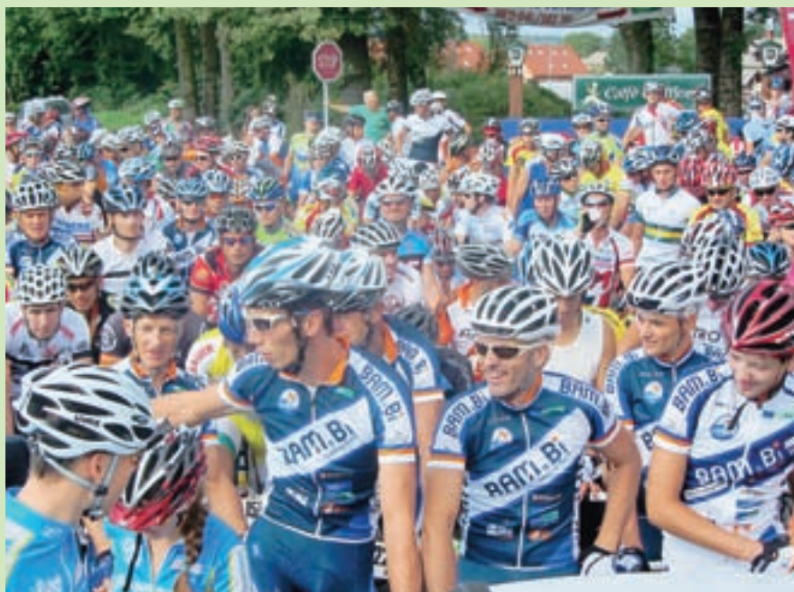
Kolesarski vzpon sta društvi Bam.bi iz Trboj in Strmol iz Dvorij skupaj z občino Cerklje izkoristili tudi za turistično promocijo Cerklj z okolico.