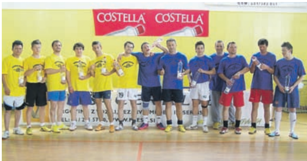
Takole so se rokometnaši Cerklj po lanski sezoni veselili uvrstitve v ligo višje.

Omenili ste pripravljalne tekme. Kaj so pokazale?