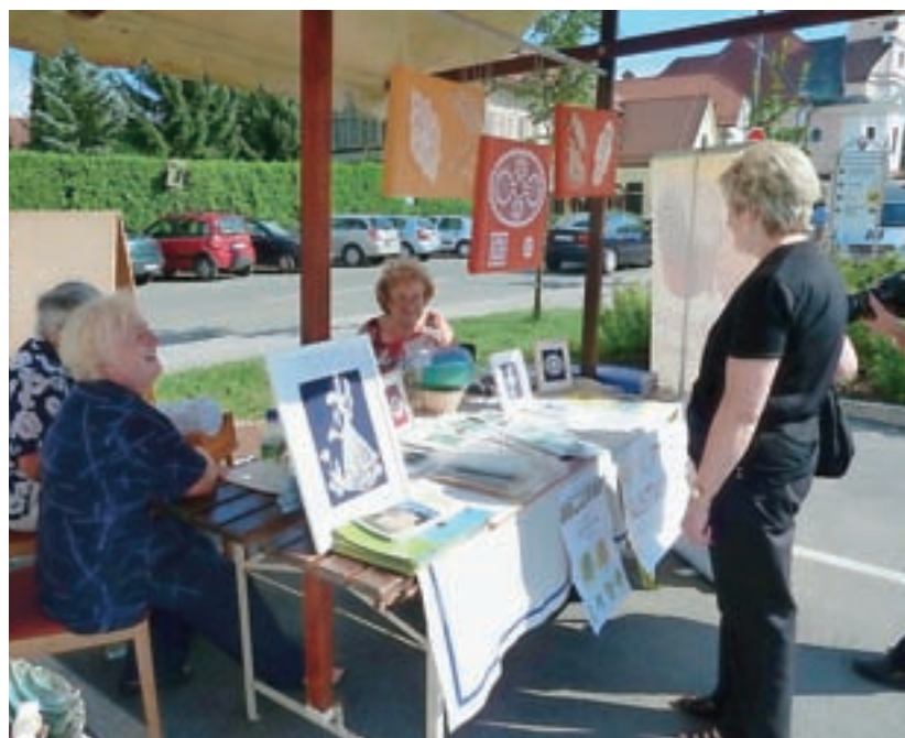
Svoje dejavnosti in izdelke je letos predstavilo osem razstavljalcev.