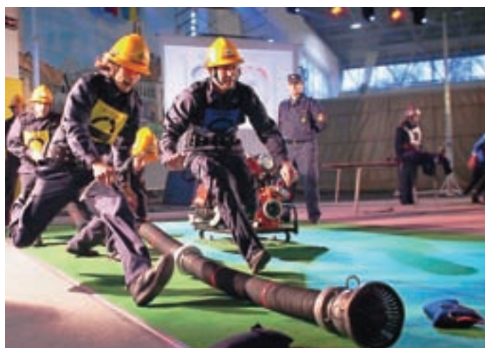
Ekipa iz PGD Zalog je na tekmovanju dosegla odlično peto mesto.