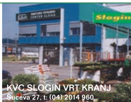
KVC SLOGIN VRT KRANJ Šuceva 27, t: (04) 2014 960