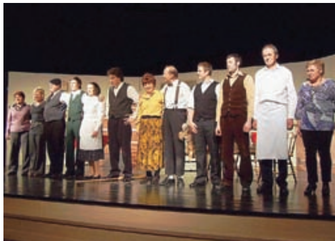
Ob zaključku predstave v Borštnikovem hramu v Cerkljah so bili igralci deležni gromkega aplavza.