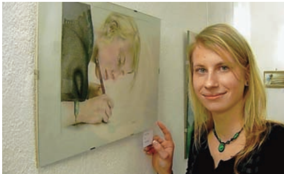
Slikarka pred avtoportretom, ki ga je naslikala lani.