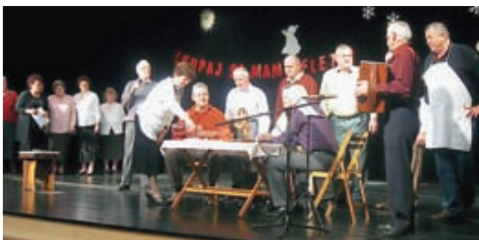
Zaplesali so tudi člani folklorne skupine Strmol DU Cerklje.