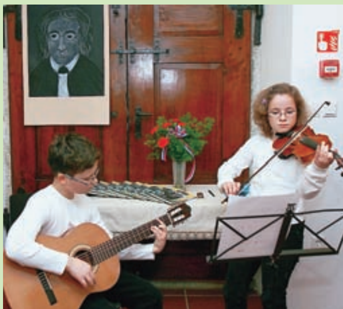
Mladi ustvarjalci OŠ Davorina Jenka Cerklje