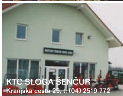
KTC SLOGA ŠENČUR Kranjska cesta 29, t: (04) 2519 772