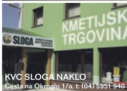
KVC SLOGA NAKLO Cesta na Okroglo 1/a, t: (04) 5951 940