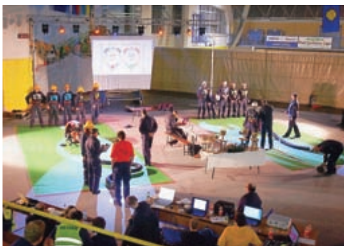
Tekmovanje je bil pravi spektakel in eden bolj atraktivnih gasilskih dogodkov.