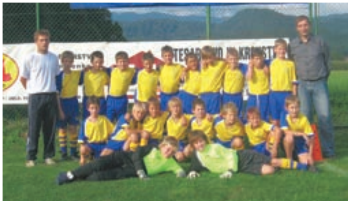
Ekipa U 10 je napredovala v prvo gorenjsko ligo.

Posebna zgodba pa je selekcija U-14, kjer smo sodelovali s sosednjim klubom Šenčur ter naredili dve ekipi ter z boljšo ekipo tudi osvojili pri-