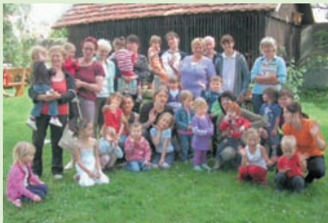
Z zaključka igralnih uric

V zadnjih mesecih je dogajanje v mladinskem centru najbolj zaznamovala učna pomoč. "S tistimi, ki imajo popravne izpite, pa se v teh