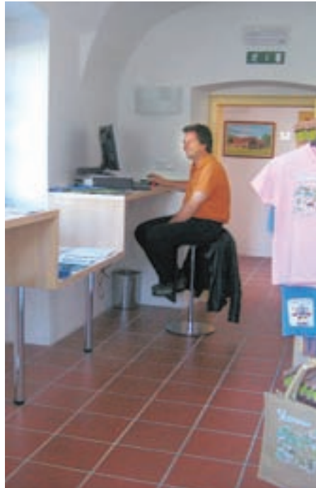
Za goste imajo v TIC-u urejen tudi brezplačen internetni kotichek.

Prav za potrebe vseh vrst promocije bomo kmalu objavili fotonatečaj, preko katerega želimo zbrati čim več atraktivnih fotografij s področja narave, prireditev, aktivnosti doma-