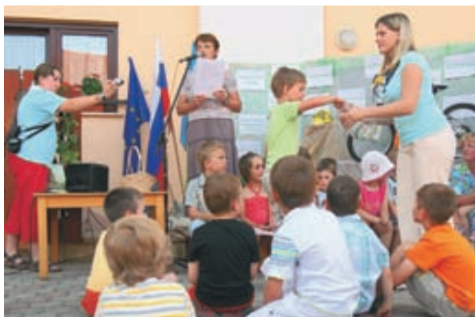
Na sklepnih prireditvi so nagradili družine, ki so varčevale pri vožnji.