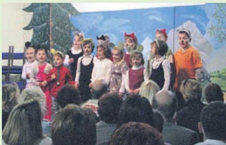
Najmlajši so pogumno stopili na oder in predstavili miške in mucke. / Foto: David Luskovec

Zadnji sklop prireditve so pripravili mladinci. Najprej so zaigrali kratko enodejanko Brezplačni servis, v katerem je na šaljiv način prikazana moška lahkovernost, sledila je priredba enodejanke Moški k otroku, v kateri se izkaže, kaj vse smo pripravljene narediti za dodatni zaslužek. Sledili so trije skeči o življenju na vasi Iz naših krajev, Zaljubljeni sosedi in Pohlevni mož.