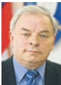
Župan Franc Čebulj

”Zaenkrat te potrebe ne zaznavamo. Na Zgornjem Brniku se tako gradi po vsej vasi - od kanalizacije in vodovoda do pločnikov, plinovoda in širokopasovnega telekomunikacijskega omrežja. Na državni cesti na Spodnjem Brniku