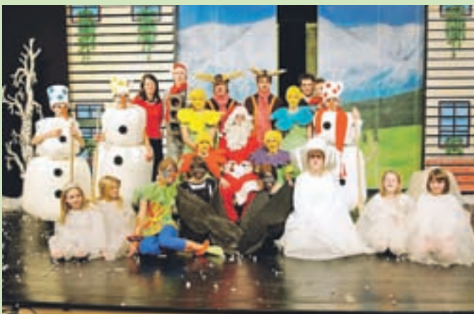
Z igro Semafor in zima so se predstavili tudi na Jesenicah.