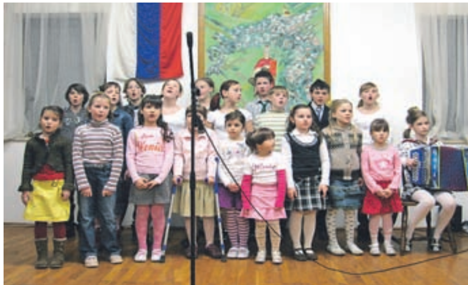
Najmlajši so ob harmoniki zapeli Jaz pa pojdem na Gorenjsko.