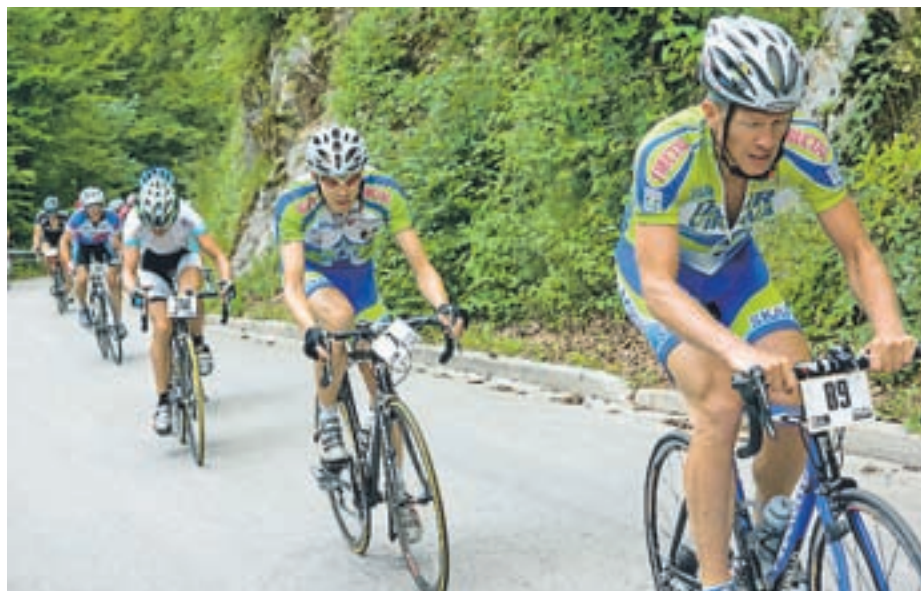
Rekreativni kolesarji bodo že četrto osvajali Krvavec.

Organizatorji ob tej priložnosti vse občane in obiskovalce Krvavca prosijo za strpnost v času kolesarskih prireditev in da se ob trasi ravnajo po navodilih redarjev.