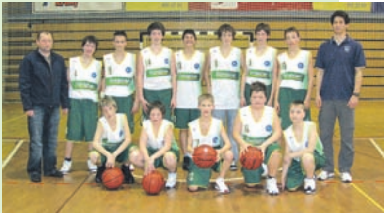
Pionirji Europcar Krvavec

Mešana ekipa Češnar Krvavec (člani in mladinci) igra v gorenjski košarkarski ligi. Po dveh kolih zaseda četrto mesto v svoji skupini. Premagali so Pizzerijo Bolero (75:57) in izgubili s Storžičem (67:86). Ekipa igra ob torkih in petkih, ob lepem vremenu na novem zunanjem igrišču ob OŠ, ob slabem pa v športni dvorani.