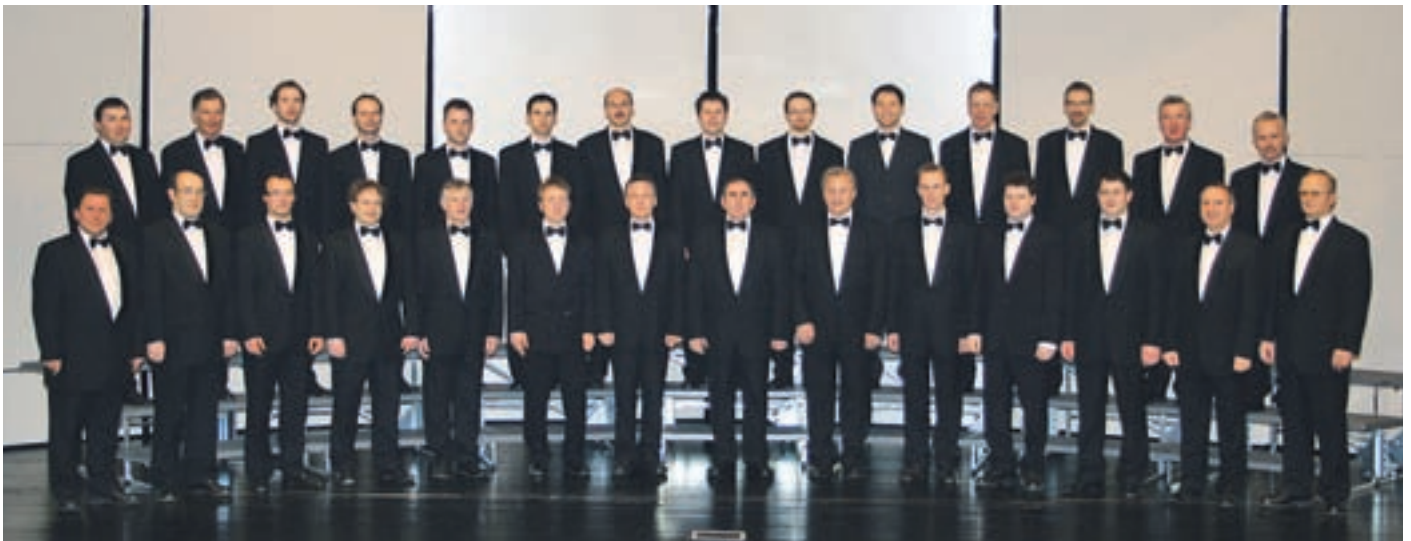
Komorni moški pevski zbor Davorina Jenka praznuje petdesetletnico delovanja.