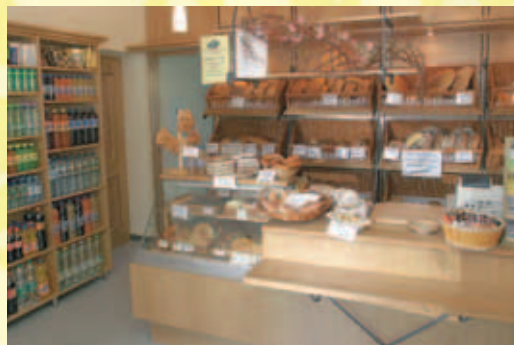
Dnevno sveži domači kruh in pecivo brez aditivov