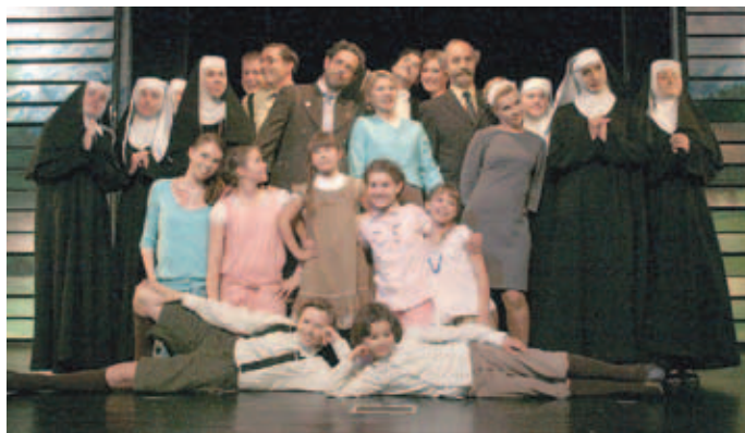
Odlična ekipa muzikala Moje pesmi moje sanje navdušuje tudi v Cerkljah