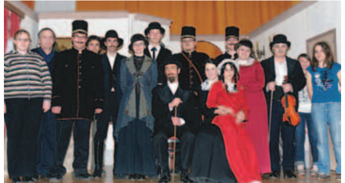
Z igro Učiteljica je adergaška dramska sekcija nastopila na festivalu gorenjskih komedijantov.

Kulturno umetniško društvo Pod lipo Adergas letos praznuje 70-letnico delovanja, ki jo bodo praznovali skupaj z velikim slovenskim igralcem Ignacijem Borštnikom, saj bodo ob 150-letnici njegovega rojstva uprizorili njegovo izvorno ljudsko igro v treh dejanjih Stari Ilija. V igri, ki jo je režiral