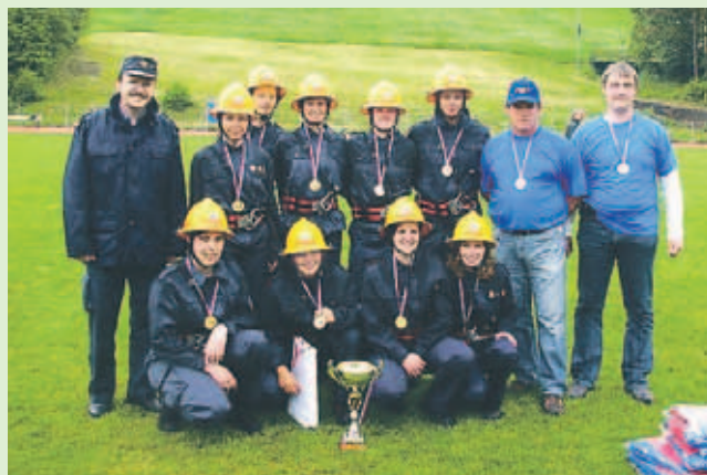
Cerkljanske gasilke so že drugič zmagale na državnem gasilskem tekmovanju.

Kmalu zatem je Gasilska zveza Cerklje na Štefanji Gori pripravila tudi orientacijsko tekmovanje za mlajše in starejše pionirje in mladince. Udeležilo se ga je kar 52 ekip. Zmagale so ekipe Šenturška Gora 2 (mlajši pionirji), Cerklje 1 (mlajše pionirke), Zgornji Brnik 1 (starejši pionirji), Cerklje 2 (starejše pionirke) in Spodnji Brnik-Vopovlje (mladinci).