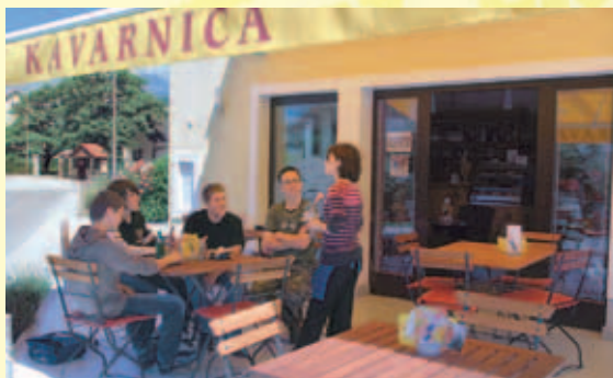
Na letni terasi si lahko privoščite dobrote iz lastne pekarnice (rogličček, burek, zavitki,...)

V poletnem času je kavarnica za vas odprta do 23. ure.