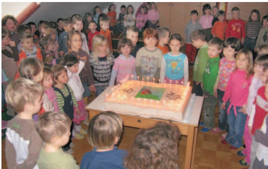
Za 40. rojstni dan so se otroci posladkali z velikansko torto.

Na slovesnosti ob štiridesetletnici cerkljanskega vrtca so nastopili otroci iz vseh šestih oddel-