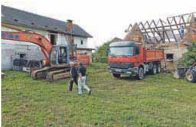
Podiranje zapuščenega objekta pri Premuzarjevi hiši

Občina Cerklje tudi letos sodeluje v vseslovenskem projektu Turistične zveze Slovenije Moja dežela – lepa in gostoljubna, v okviru katerega bodo pripravili občinsko ocenjevanje urejenosti vasi, ulic in posameznih objektov, vse z namenom spodbuditi skrb za čisto in urejeno okolje, za katero je bila lani občina na tekmovanju Entente Florale že nagrajena s srebrnim priznanjem. Posebna komisija se bo prvič na teren podala prav v teh dneh, še enkrat pa nato v začetku septembra. Na državno tekmovanje v urejenosti je občina letos prijavila Cerklje in Šenturško Goro, saj si k projektu želijo vključiti vse, tudi višje ležeče vasi. Za urejeno okolje pa na svojih zemljiščih skrbi tudi Občina. Tako so nedavno podrli zapuščene garaže v neposredni bližini Premuzarjeve hiše, ki tako ne kazijo več okolice. J. P.