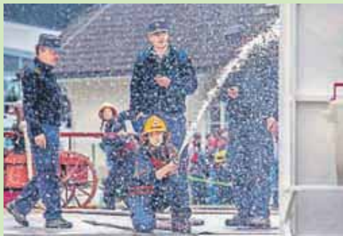
Vaja gasilcev je bila omejena na 90 sekund, zmagala pa je ekipa, ki je prejela najmanj kazenskih točk in načrpala največ vode v tarčo.