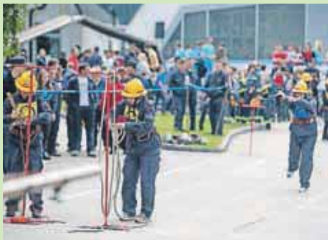
Gasilsko tekmovanje je zaradi svoje dinamičnosti zanimivo tudi za gledalce, ki so se tudi letos pred športno dvorano zbrali v velikem številu.