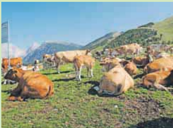
Na Krvavcu se pase okoli 380 glav živine.

Na Kriško planino in Jezerca so kmetje iz vasi pod Krvavcem svojo živino letos prignali in pripeljali 12. junija. Na paši na Krvavcu je letos tako okoli 380 glav živine. Pašna sezona se je začela približno ob enakem času kot lani, tudi krave bodo na sočnih pašnikih uživale v skorajda enakem številu. Približno 160 se jih pase na Jezercih, še