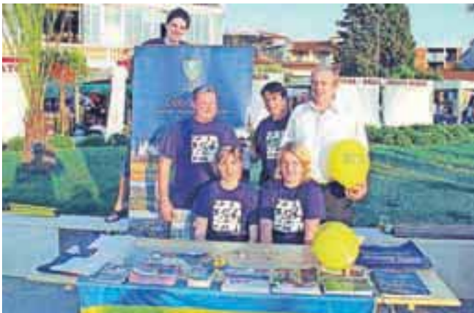
Obisk je bil tudi deloven, saj so občino predstavljali turistom na medulinski rivi.