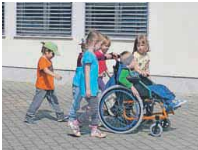
Otroci so spoznavali, da vožnja z invalidskim vozičkom sploh ni preprosta.