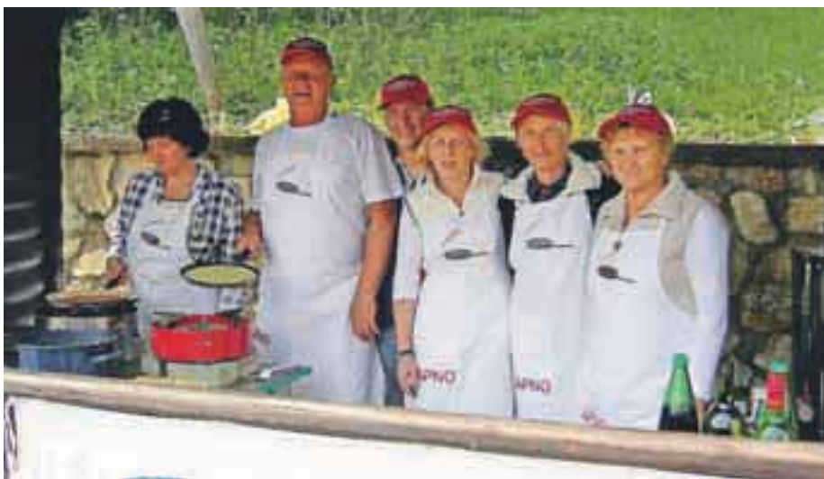
Glavnina organizatorjev prijetne prireditve, za katero je po svojih močeh skrbela večina krajanov vasi Apno