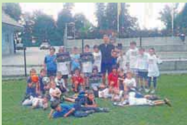
Najmlajši nogometaši tudi med počitnicami radi brcajo žogo.

V Nogometnem klubu Velesovo so letošnjo uspešno sezono zaključili s skupnim piknikom za vse selekcije, a tudi med sezonama nogometaši ne počivajo, saj je vodstvo kluba za najmlajše znova organiziralo Nogometne počitnice. V tednu od 24. do 28. junija so vsak dan poskrbeli za varstvo otrok, ki so bili, prav tako kot njihovi starši, zadovoljni z zelo zanimivim programom. »Obiskali smo adrenalinski park na Krvavcu, igrali nogomet kot Brazilci na mivki, se sladkali ob sladoledu ... Za veliko presenečenje otrok smo povabili tudi dva gosta. Prvi