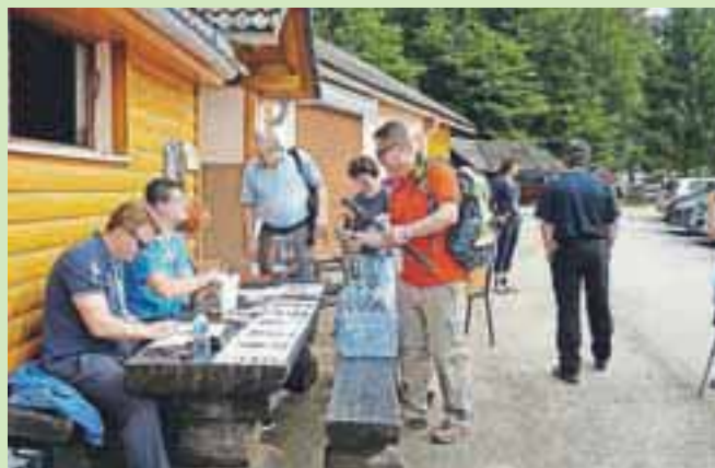
Dobredelna prireditev Lions kluba Brnik se je med pohodniki že dobro prijela, saj je odziv vsako leto velik.