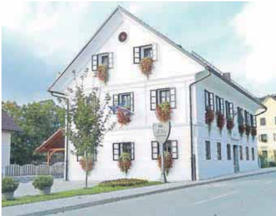
Petrovčeva hiša, na katero so Cerkljani danes lahko upravičeno ponosni, na svojem portalu nosi letnico 1863, zato se spodobí, da ob 150-letnici hiše predstavimo del njene pestre zgodovine.