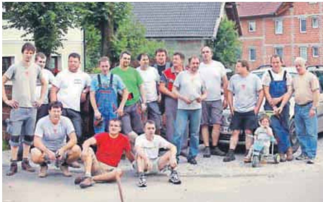
Večina sodelujočih pri zamenjavi strehe na gasilskem domu v Spodnjem Brniku