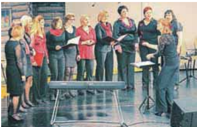
Pevke iz preddvorske skupine Plamenke

Člani Komornega moškega pevskega zbora Davorin Jenko so v začetku junija pripravili koncert z naslovom Naša sopotja, katerega rdeča nit je bilo slovensko ljudsko izročilo v glasbi – od klasike pa vse do ljudskih pesmi.