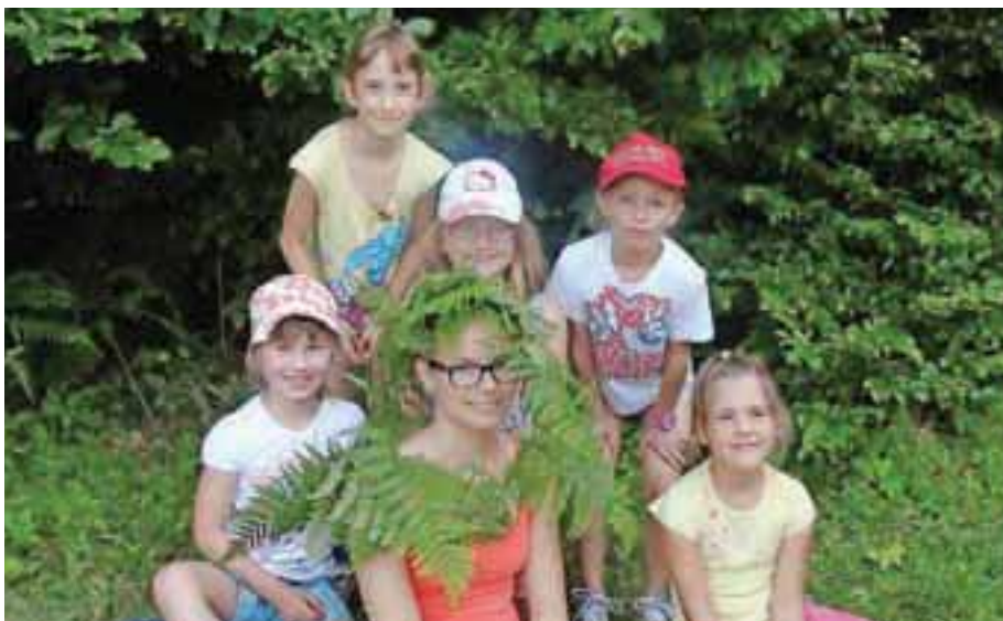
V Družinskem in mladinskem centru Cerklje tudi poleti skrbijo, da mladim ni dolgčas.

V centru bo kljub počitnicam pestro tudi poletje. Julija in avgusta bodo vsak drugi torek ob 19. uri vaje iz konverzacije v angleščini za staro in