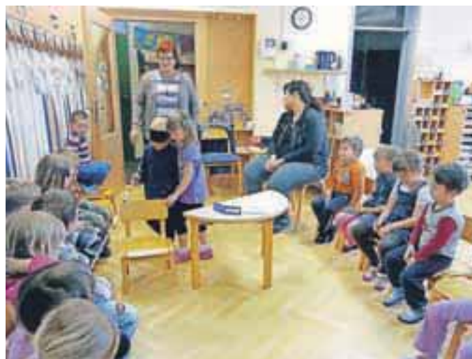
Na svojih srečanjih so spoznavali tudi življenje slepih in slabovidnih oseb.