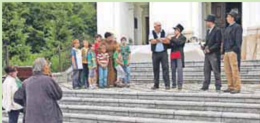
Vaje za predstavo že aktivno potekajo