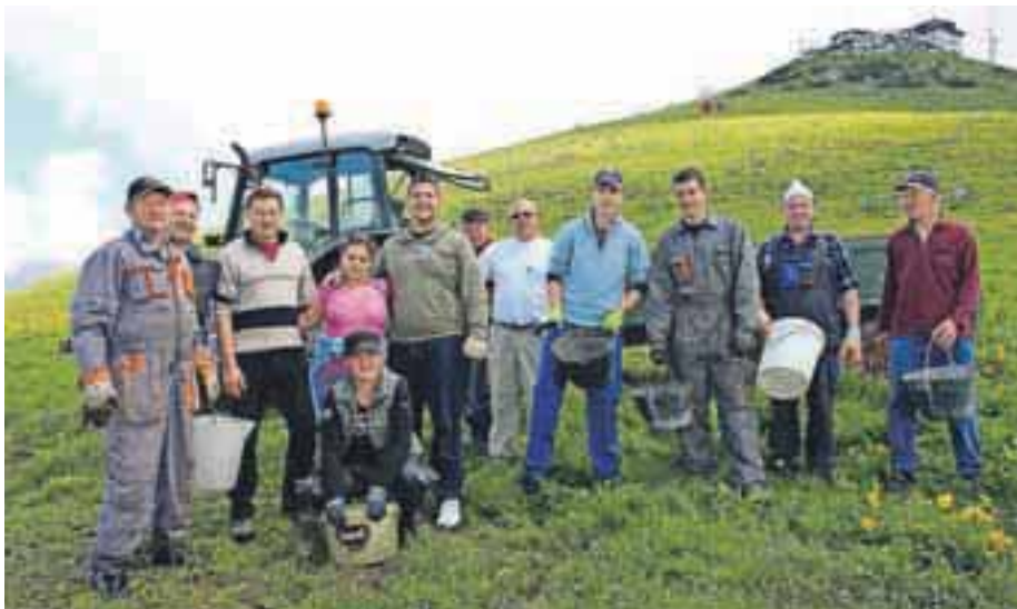
Kamenje je letos pobiralo okoli sto prostovoljcev, tudi člani pašne skupnosti Kriška planina.

Približno sto udeležencev – članov pašnih skupnosti, zaposlenih na Krvavcu, domačinov, imetnikov sezonskih smučarskih kart in drugih ljubiteljev Krvavca, se je zbralo že malo pred 8. uro zjutraj. Razdelili so se v osem skupin in celo dopoldne po vsej planini pobirali kamenje, da bo Krvavec urejen tudi poleti, da bo kravam manj škripalo med zobmi in da bo pozimi smuka boljša. Zbrani so se kljub napor-