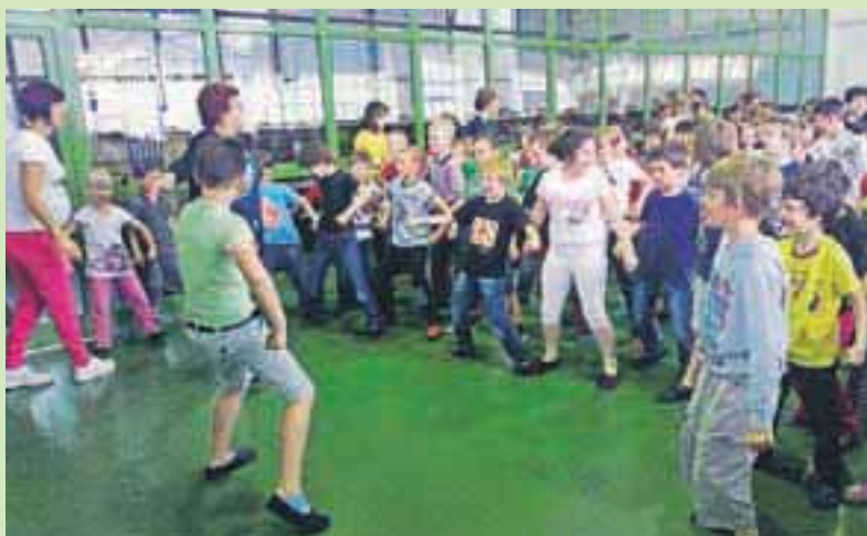
Med učenci je bil najbolj priljubljen skupinski ples.