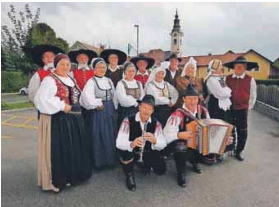
K organizaciji 4. Semnja na rokovo so letos pristopili tudi člani KD Folklorja Cerklje.

Semenj na rokovo ostaja zvest tradicionalnemu datumu, tako bodo člani Unesco kluba Cerklje že v petek, 16. avgusta, pripravili razstavo in s tem odprto prireditve, glavna dogajanja pa se bo odvila v soboto, 17. avgusta, in sicer na ploščadi pred osnovno šolo, kjer bodo svoj prostor dobili razstavljavci na stojnicah, letos prvič pa tudi folklorni plesalci. »V okviru Semnja na rokovo bomo letos pripravili pravi mali folklorni praznik z naslovom Zapojem in zaukam, dekleta zasukam, s katerim želimo bolj povezati folklorne ustvarjalce z območja med Kamnikom, Kranjem in Domžalami, ter spodbuditi močnejši interes za kulturno dediščino na področju plesa, glasbe, oblačenja in spoznavanja šeg. Želimo si, da bi prireditve sčasoma postala pravi etnološki praznik s prikazom starih kmečkih obrti. Svoje videnje sejma in celotne prireditve smo predstavili članom Unesco kluba Cerklje, saj smo prepričani, da oboji s tem lahko le pridobimo. Naš folklorni del se bo začel v popoldanskih urah s povorko folklornih plesalcev od kmetijske zadruge do šole, nadaljeval pa zvečer z nastopi posameznih plesnih skupin, ljudskih pevk in