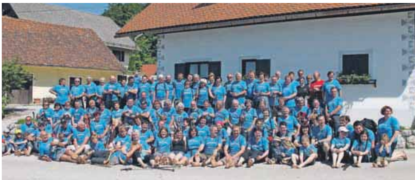
Spominski skupinski posnetek bosih na Šenturški Gori