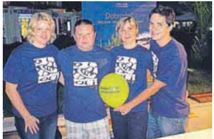
Del delegacije iz občine Cerklje, ki se je odzvala povabilu pobratene občine Medulin.