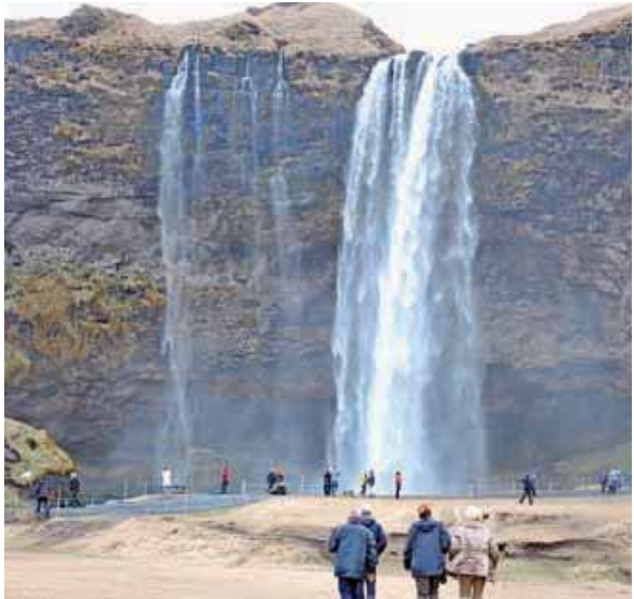
Slap Seljalandsfoss se spušča 60 metrov v globino.

Lahko rečem, da so mi bili na Islandiji všeč narava, ljudje, način življenja, kulinarika, državna ureditev, izjemno lepo oblikovani izdelki ... Skratka, vse, razen vremena, zlasti mrzlega vetra. Veliko sveta sem že videla, doslej sem samo v Jeruzalemu rekla, da ga bom še obiskala, ker je tako nabit z zgodovino. Islandiji sem prav tako rekla nasvidenje. In nisem bila edina, tudi drugi so ob vrnitvi ugotavljali, kaj vse bi si še lahko ogledali. Upam, da bom prihodnjič ujela lepše vreme in bodo nastale lepše fotografije, kajti Islandija je zaradi svoje slikovitosti in razgledov raj za fotografe.