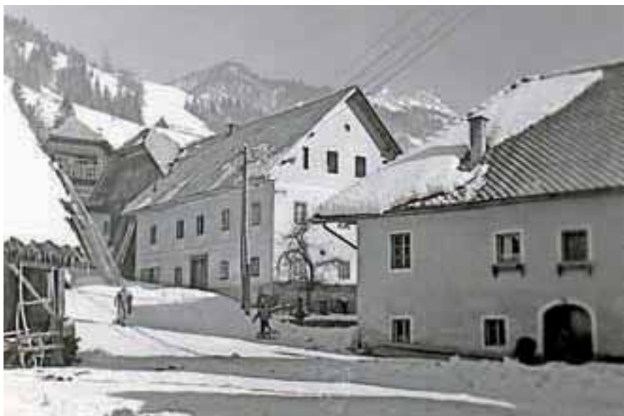
Kmečke hiše sredi vasi na Dovjem

spostva med Krko in Mirnom, kar se odraža v dovškem dialektu, ki se razlikuje od dialekta drugih vasi v Zgornjesavski dolini. Znana sta dolenska refleksa sredi gorenjskega dialektičnega ozemlja, široki e in o: tj ei in ou. Še danes so značne besede v pogovoru med domačini: sneih, breih, gneizd, mleik, streiha, keiha, breiza, sveiča, ceista, veitr, želeiz, leis, deiža, leit, leita, z leitmi, medveid, peite, prteipat, deivat, podeivat, skreigat, jeidu, veidu, seiku, nouč, snouč, mouč, bouh, stouh, lepou, grdou. Zelo zanimiva bi bila primerjava izvora in izgovora posameznih besed, ki se ohranjajo v naših krajih in odstopajo od besed sosednjih vasi v Dolini ali knjižnega jezika.