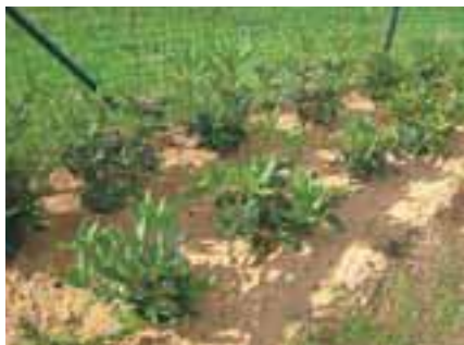
Kisloljubne rastline