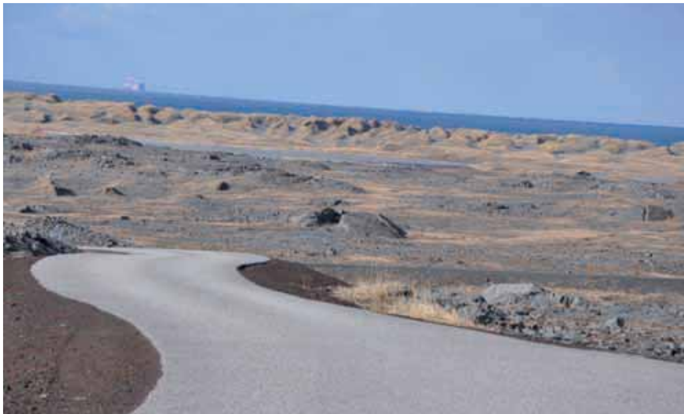
Polja črne lave

Za prvomajsko potovanje na Islandijo sem se odločila na hitro, ko sem prejela Kompasovo elektronsko obvestilo. Priložnost je bila odlična, saj je direktni letal-