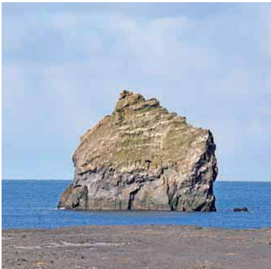
Islandija je raj za fotografe.

Islandijo sem pred leti videla z letala na poti v Ameriko. Leteli smo podnevi, vreme je bilo lepo, otok snega in ledu se je bleščal v soncu kot nevesta pred oltarjem. Vožnja od letališča Keflavik proti glavnemu mestu Reykjavik je ponujala povsem drugačno pokrajino – črno morje lave, ki je še najbolj spominjala na Lunino površino. Nič čudnega, da so Američanom očitali, kako so pristanek na Luni uprizorili kar na Islandiji. Občutek nenavadnosti pokrajine je še okrepil