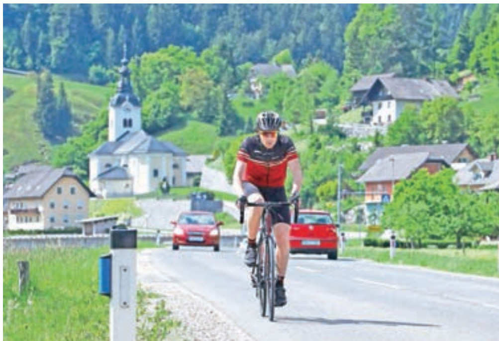
Kolesarsko povezavo sedaj načrtujejo tudi med Selci in Dolenjo vasjo.

Trasa je razdeljena na dva odseka: od Jesenovca do Železnikov (4,3 km) in od