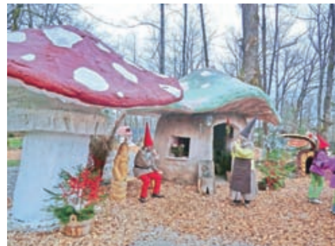
Škratova vas v pravljčni deželi

Kordež, ki od začetka vodi ta projekt. "Pravljčni gozdček se bo za pol ure spremenil v živo pravljico, v kateri bodo otroci burili domišljijo in doživljali pravljice v družbi svojih najljubših junakov. Polurna predstava bo vsebovala izsek različnih pravljic. Skozi simpatično predstavo jih bo vodil animator in poskrbel, da bo to pravljčno doživetje otroku ostalo v nepozabnem spominu. Otroke