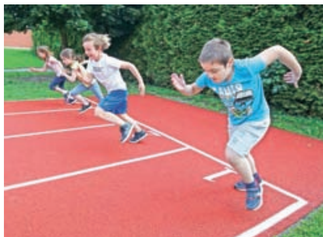
Start na obnovljeni atletski stezi