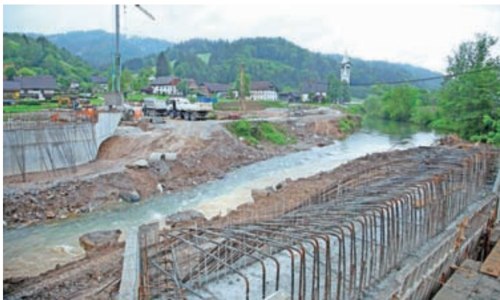
V Poljanah se nadaljujejo dela v okviru projekta za povečanje poplavalne varnosti Poljanske Sore.

Na delu je tako več gradbenih ekip, ki vsaka na svojem delu skrbi za izvedbo potrebnih ukrepov za izboljša-