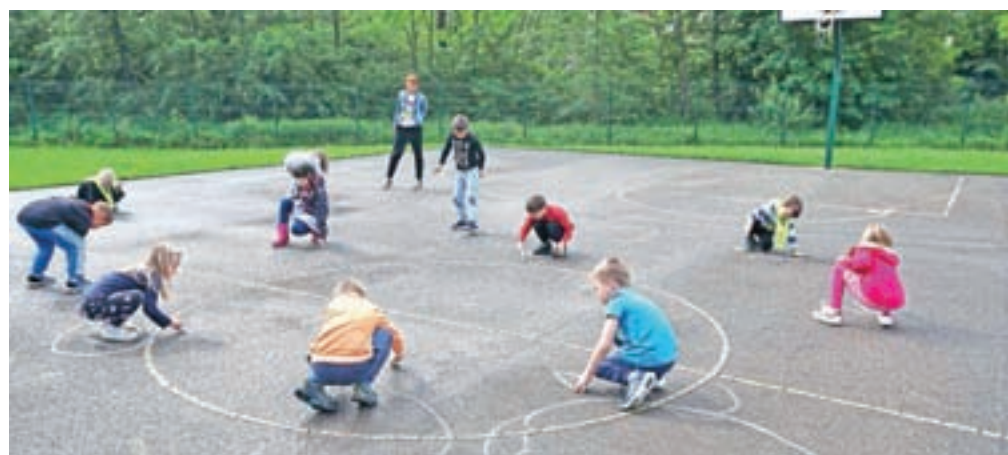
Učenci med igro na prostem

"Največ je organizacijskih izzivov, da smo zagotovili razredne učitelje za vse skupine in razporedili ostale zadolžitve (dežurstvo, dostava malice v učilnice, sprotno razkuževanje) med druge zaposlene. Izrekam pa pohvalo starejšim učencem, ki so dobro pripravili svoje otroke za ponoven vstop v šolo in da razumejo, da so ob vrnitvi učenci razdeljeni v manjše skupine, saj so nekateri učenci dobili druge sošolce, kar pa je tudi priložnost za navezovanje novih stikov. Učenci tudi razumejo, da učiteljica mora imeti masko. Delo pa poteka zaradi manjših skupin lahko bolj učinkovito in prijetno in lažje zagotavljamo zdravstveno-higienska priporočila NIJZ," sobesednik opozarja na nekatere aktualne izzive. In še dobra novica: "V začetku maja smo obnovili stezi za tek in skok v daljino z novim tartanom, ker sta bili dosedanji močno poškodovani. Tako smo še izboljšali možnosti za pouk zunaj, kar v tem času pride še kako prav."