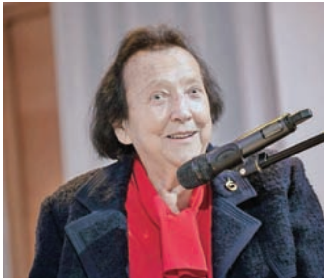
Januarja 2019 je Škofja Loka gostila dr. Aleksandro Kornhauser Frazer ob izidu njene knjige Poti in srečanja .

vojni je končala učiteljske, poučevala na osnovnih in srednjih šolah ter leta 1963 diplomirala na Fakulteti za naravoslovje in tehnologijo v Ljubljani, kjer je dve leti pozneje tudi doktorirala. Kasneje se je izpopolnjevala v Švici, Veliki Britaniji in ZDA. Poučevala je na pedagoški akademiji v Ljubljani, bila nekaj časa njena dekanja, zatem je postala redna profesorica za kemijo na Fakulteti za naravoslovje in tehnologijo, kjer je že v letu 1971 začela voditi program kemijskega izobraževanja in od leta 1982 program kemijske informatike. Leta 1981 je postala direktorica Mednarodnega centra Unesca za kemijske študije, na strokovnem področju pa je opravljala številne funkcije v domačih in tujih institucijah in organizacijah. Med drugim je bila med letoma 1974 in 1980 predsednica Raziskovalne skupnosti Slovenije in v letih med 1979 in 1990 predsednica jugoslovskega odbora za znanost pri Unescu. Bila je predse-