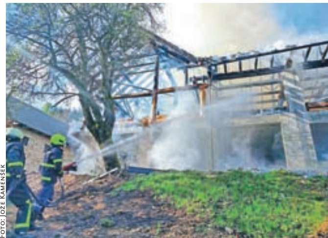
Zgorela sta ostrešje in stanovanjski del objekta.