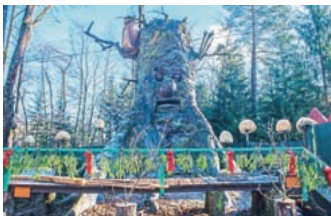
Hrast modrec bo pozdravil otroke tudi ob poletnih doživetjih Pravljčne dežele Gorajte

na pravljčni poti lahko spremljajo starši. Pravljčni junaki bodo poskrbeli za posebno vzdušje, ob dodani vrednosti unikatne glasbene spremljave in prelepe pravljčne scenске postavitve."