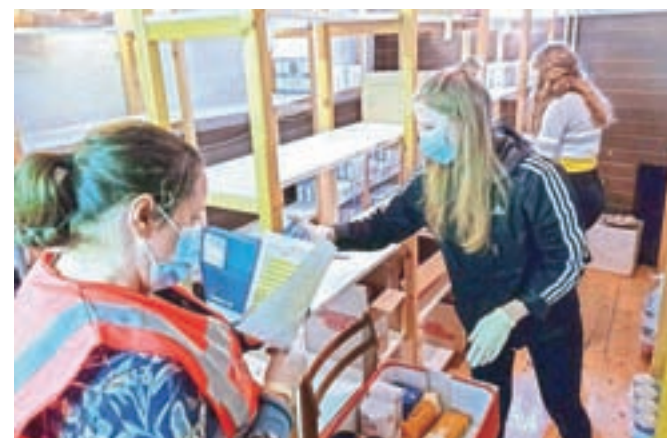
Maske pri svojem delu z ljudmi nosijo tudi prostovoljci Karitasa.

upoštevanju ostalih higienskih ukrepov, kot so pravilno kašljanje, kihanje, pravilno umivanje rok ter izogibanje dotikanju obraza in sluznic, še dodatno zmanjšujejo nevarnost prenosa okužbe. Pri tem je zelo pomembno, da masko pravilno namestimo, nosimo in tudi odstranimo. Ves čas nošenja maske se oseba ne sme dotikati osrednjega dela maske, saj bi na ta način lahko prišlo do onesnaženja rok in nevarnosti prenosa okužbe na druge osebe. Poleg nošenja maske pa je treba upoštevati tudi razdaljo med ljudmi.