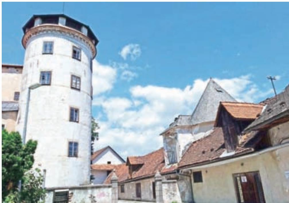
Pozabljeni starec iz Stare Loke, kot ga označujejo njegovi upravljavci, se trudi, da bi zdržal breme svojih let. Mu bodo uspeli pomagati?

Današnji Center slepih, slabovidnih in starejših (CSS) Škofja Loka se je leta 1935 naselil v 700 let starem Strahlovem gradu v Stari Loki. Leta 1979, ko je bil zgrajen nov center, so se izselili, nato pa je grad začel svojo osamljeno, zapuščeno pot, ta kulturni spomenik državnega pomena pa zdaj nezadržno propada.