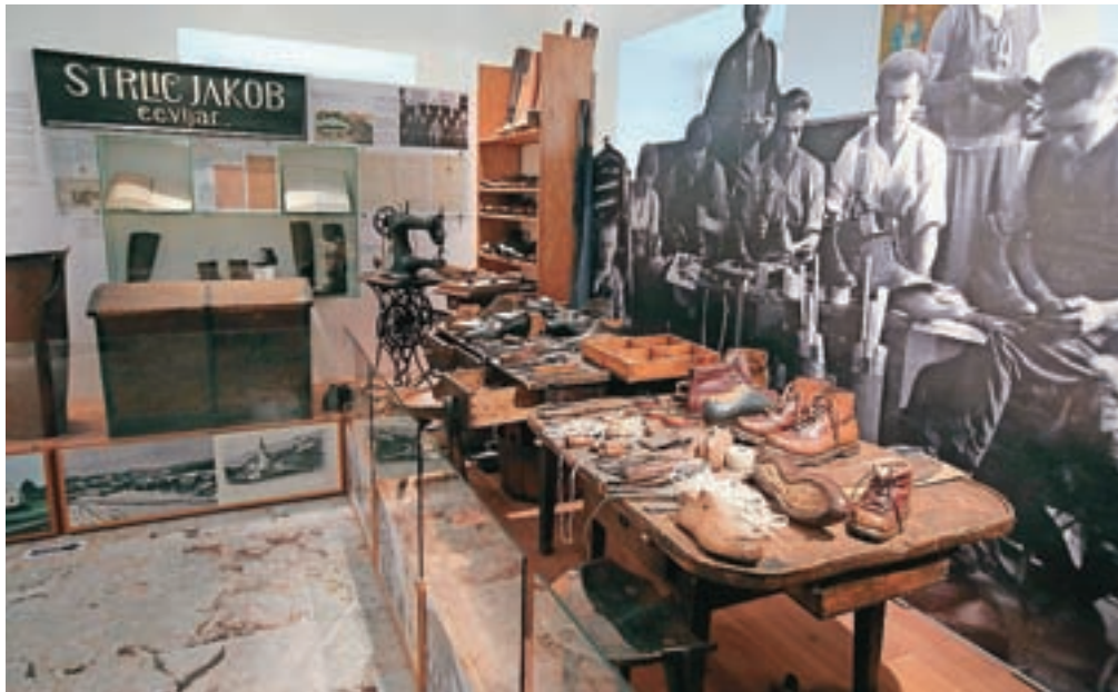
Glavno dejavnost Muzejskega društva Žiri predstavlja vodenje Muzeja Žiri.