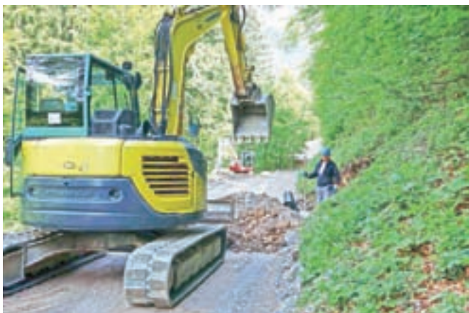
Ureditev odseka Ravne–Šurk sodi med večje letošnje občinske investicije v ceste.

Železniki – Občina Železniki tudi letos načrtuje nekaj večjih investicij v občinske ceste. Ta mesec so že začeli urejati odsek Ravne–Šurk, na katerem so s tem tednom vzpostavili popolno zaporo, ki naj bi trajala predvidoma do petka, 29. maja. Obvoz je mogoč po cesti skozi Sorico. Gradnja, ki jo izvaja podjetje Euro grad, naj bi trajala štiri mesece. Gre za utrditev in ponekod razširitev vozišča in vgradnjo objektov za odvodnjavanje cestnih in zalednih voda (drenaže, cevni prepusi) na dveh odsekih ceste v skupni dolžini 1,5 kilometra in asfaltiranje vozišča v dolžini 867 metrov. Investicija je vredna 152 tisoč evrov. Občina se že pripravlja tudi na ureditev cestnega odseka Štulc–Jurež v Davči, kjer bodo utrdili in razširili vozišče, zgradili podporne zidove, poskrbeli za odvodnjavanje in asfaltirali vozišče v dolžini 862 metrov. Postopek izbire izvajalca še ni končan, sicer pa je na razpis prispelo devet ponudb. V zaključni fazi je tudi razpis za izvedbo programa asfaltiranja občinskih cest. Občina je med dvema ponudnikoma že izbrala izvajalca, sklep o izbiri pa naj bi postal pravno moč v teh dneh.