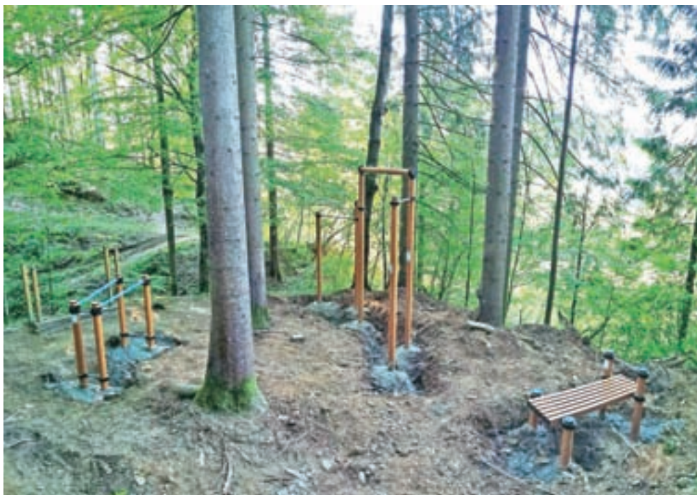
V preteklem tednu so končali obnovo trim steze Golava.

Na novi trim stezi so tri postaje, je razložil Klinec. Na prvi postaji so postavili bradljo, drogove in klop za izvajanje trebušnjakov, druga postaja je namenjena vajam za ravnotežje, na tretji postaji pa je obiskovalcem na voljo lestev in druga orodja za raztezanje. "Urejanje trim steze smo začeli dober mesec nazaj in končali v preteklem tednu," je razložil Klinec in dodal, da so stara orodja, ki so bila dotrajana in zato nevarna, odstranili že prej, zato so jih mnogi pogrešali, zlasti ker so bili