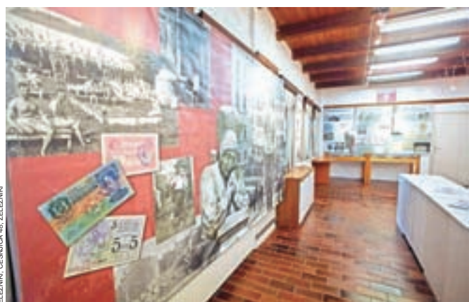
Razstava bo na ogled do 12. junija.