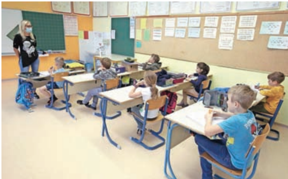
Prejšnji teden so se najmlajši šolarji vrnili v šolske klopi.

Kako se je po prekinitvi ponovno začelo šolsko delo v Osnovni šoli Ivana Groharja, smo vprašali ravnatelja