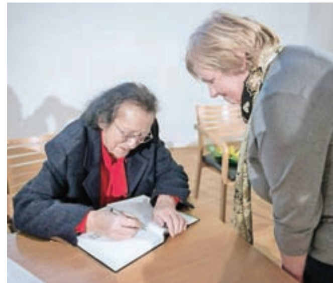
Ugledna znanstvenica se je svojim rojakom z veseljem podpisala v knjigo.

akademije in v Svetovno akademijo znanosti in umetnosti v Stockholmu. V sedemdesetih letih je bila aktivna v politiki, bila je podpredsednica Izvršnega sveta Skupščine SRS v času, ko ga je vodil Stane Kavčič. Ostala je v stiku z znanostjo, po treh letih pa se je iz politike polno vrnila na univerzo. Njeno temeljno raziskovalno področje je bila kemija naravnih spojin. V osemdesetih letih je poučevala zlasti informacijsko metodologijo z aplikacijami v raziskovanju, izobraževanju in razvoju v industriji. Vodila je tudi mednarodne projekte Unesca UNIDO, UNDB in Svetovne banke ter bilateralne projekte, zlasti z ZDA in Italiji. Kot ugledna znanstvenica in pedagoginja je predavala na plenarnih zasedanjih in kongresih. Njeni dosežki so zapisani v tridesetih knjigah, objavila je več sto strokovnih in znanstvenih člankov za domače in tuje stro-