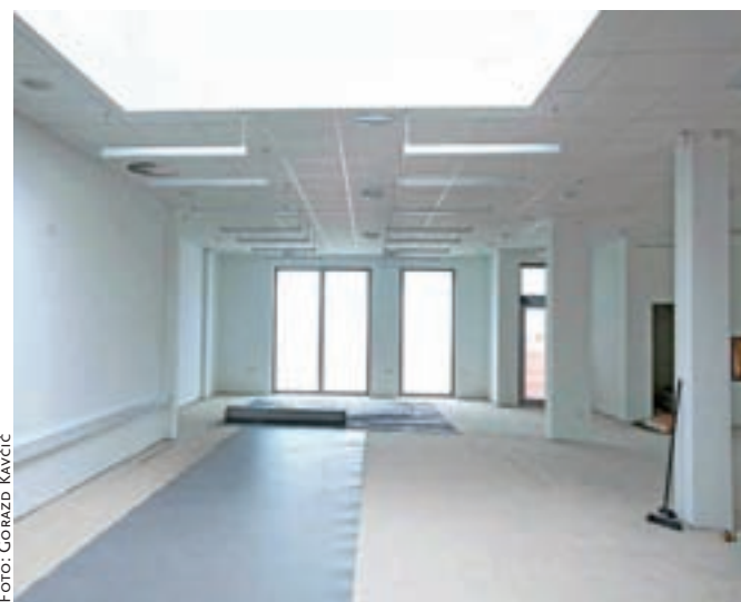
Nov velik in svetel prostor bo prihodnja knjižnica na Trati.

Velikih novih prostorov se že zelo veselijo, saj so bili v dosedanjih precej na tsnem. Imeli so 114 kvadratnih metrov površine, šlo pa je za prostore dveh nekdanjih stanovanj, ki za takšno dejavnost niso bili najbolj