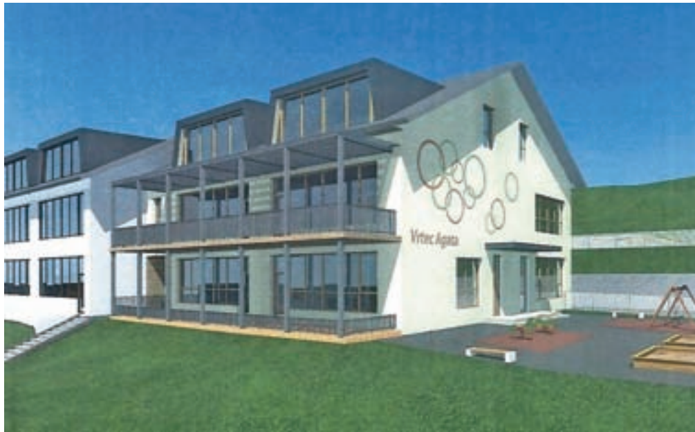
V Poljanah se je začela gradnja prizidka pri vrtcu Agata.

Novi vrtec je zasnovan kot skoraj ničenergijski objekt po sistemu energetske varčne oziroma pasivne gradnje. V maju so že začeli obnovo šolske kuhinje. Odstranili so tehnološko kuhinjsko opremo in izvedli odklop inštalacij ter obenem uredili nadomestno kuhinjo. Začeli so tudi priprave na gradnjo prizidka, ki se bo navezoval na prostore obstoječega vrtca in bo z njim oblikoval zaključeno celoto. Tako so že posekali drevesa na obmo-