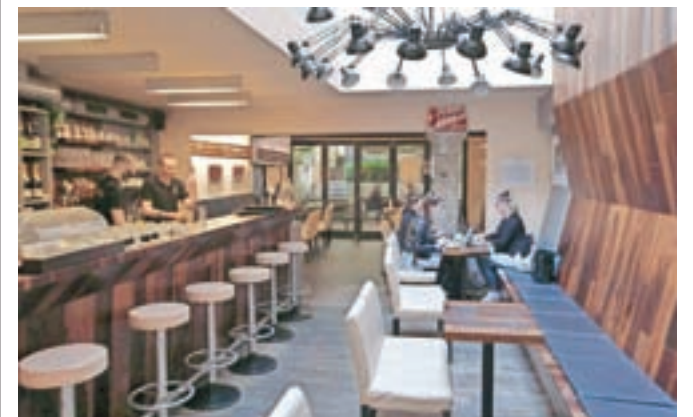
Gostinci zdaj lahko strežejo gostom tudi v notranjih prostorih, ne več samo na terasah.

mesecih zaprtja zaradi epidemije novega koronavirusa so lahko začele delovati vse trgovine, tudi večje in tiste v trgovskih središčih. Gostinci lahko znova strežejo v notranjosti lokalov, in ne samo na terasah, odprte so tudi planinske kočice in manjši turistični namestitveni obrati. Prejšnji teden so se tudi športniki razveselili odloka, ki jim dovoljuje športne vadbe. Odlok se izvaja v skladu z zakonom o športu na ali v športnih objektih in površinah za šport v naravi. Mogo-