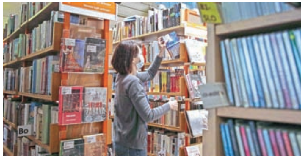
Med police smejo za zdaj samo knjižničarji.