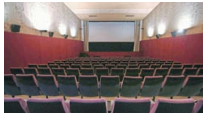
Dva meseca in pol je bil Kino Sora zaprt, zdaj pa dvorana spet pričakuje obiskovalce.

Škofja Loka – Kino Sora je bil zaradi koronavirusa zaprt dva meseca in pol. V tem obdobju bi sicer predvajali približno trideset filmov oziroma sedemdeset projekcij. Tea Oblak potrjuje, da to za kino pomeni zelo velik izpad prihodka, saj je to ravno obdobje, ko je v kinu največji obisk. "Kino bo ponovno odprlo svoja vrata konec maja oziroma na začetku junija. Upoštevali bomo vsa navodila NIJZ, ki določajo varnostno razdaljo med sedeži in vrstami ter maksimalno število petdeset gledalcev," dodaja Oblakova.