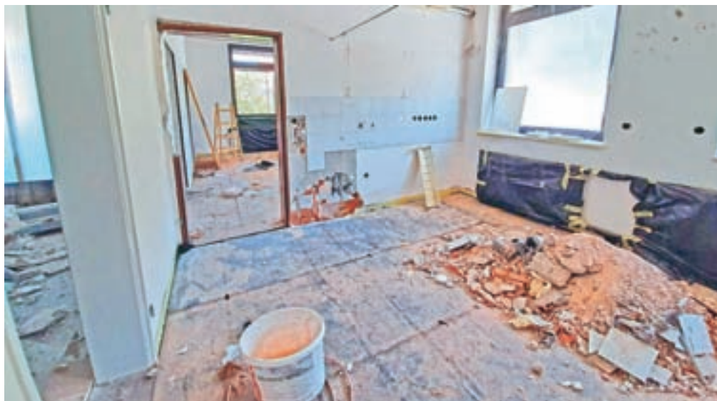
V zdravstvenem domu obnavljajo prostore v prvem nadstropju.

Občina bo kot lastnica stavbe poskrbela za obnovo prostorov, zdravniki pa bodo zagotovili potrebno opremo, je pojasnil župan. "Gre za adaptacijo prostorov, ki so potrebni zaradi novih standardov in storitev, ki jih uvajajo zdravniki." Dela, ki naj bi jih končali do konca meseca, potekajo v prvem