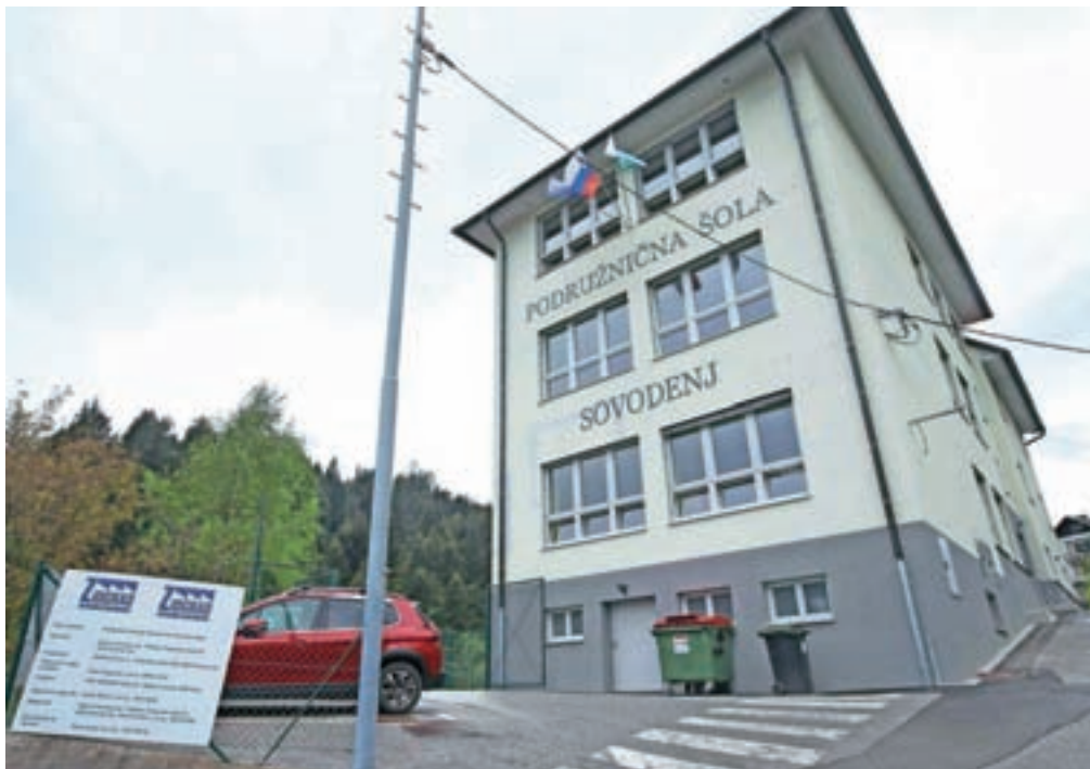
Popolnoma prenovljena šola na Sovodnju

Ta čas so tako po besedah župana Milana Čadeža zaključena vsa dela v notranjosti objekta, kjer so prenovili sanitarije in garderobe v vseh nadstropjih, novo podoba ima tudi mansarda. Popolnoma so prenovili centralno ogrevanje in uredili novo kotlovnico na toplotno