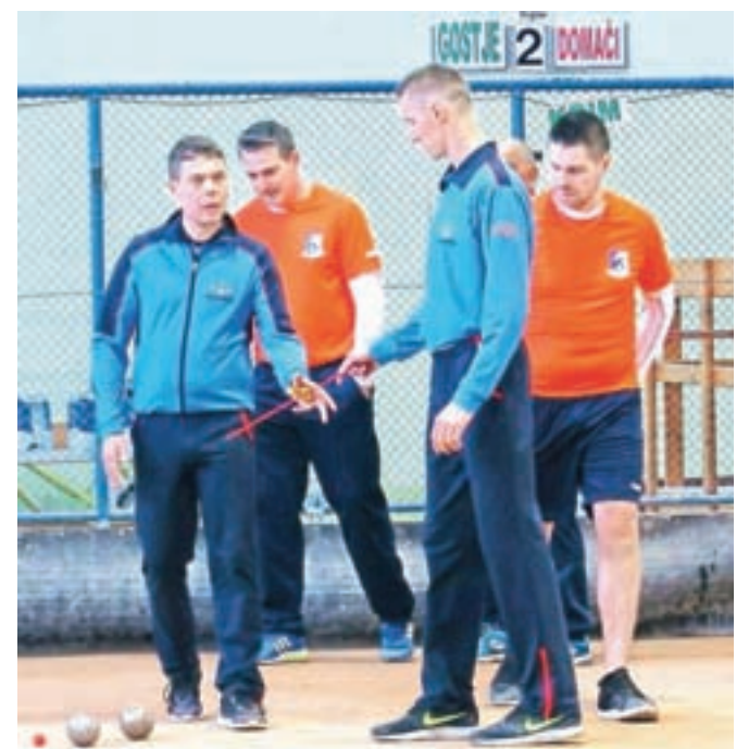
Ekipa Trate bo v zaključku sezone branila naslov prvakov.