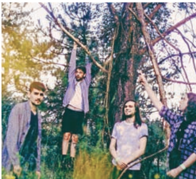
Haiku Garden na Trnje Festu

Po nastopu na Valu 202 se boste predstavili na skupnem dogodku Radia Študent in Hafnerjevega memoriala.