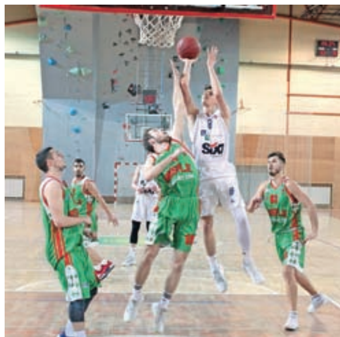
Članska ekipa LTH Castings si je zagotovila obstanek v drugi ligi.

šno zastopate klub in naše mesto,« je dejal župan Radinja in mladim upom škofjeloške košarke izročil priložnostna darila.