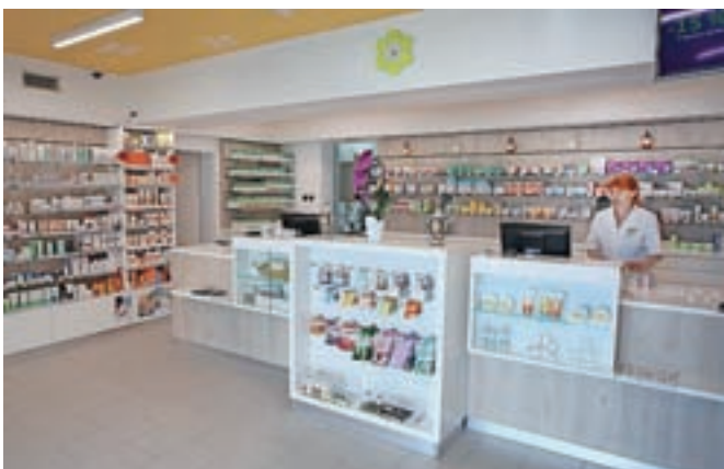
Novi prostori lekarne v Gorenji vasi

Dela, ki so obsegala tudi gradnjo novega vhoda v lekarno neposredno z novega parkirišča, so se začela lani oktobra. Novi prostori, poudarjajo na občini, omogočajo optimalne pogoje za lekarniško delo. "V lokalni skupnosti smo tako pridobili najsodobnejše opremljeno lekarno, ki je dostopnejša in prijaznejša tudi mamam z vozički in gibalno oviranim," so še dodali na občini.