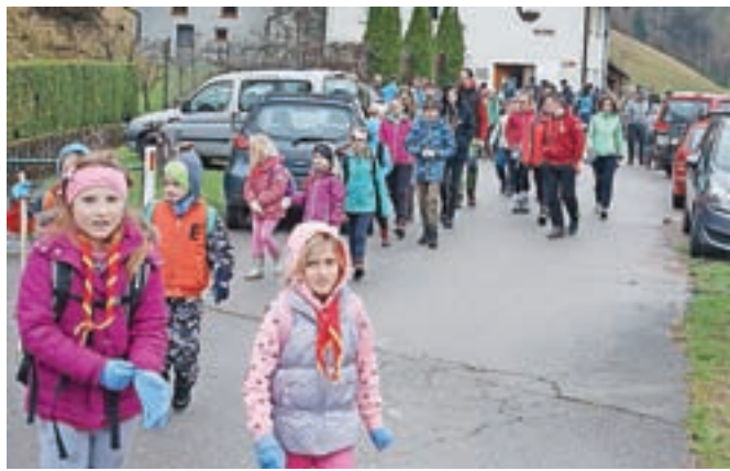
Letošnji čistilni akciji se je pridružila množica prostovoljcev. / FOTO: GORAZD KAVČIČ

padkov. Veseli ga tudi, da se je močno zmanjšala količina smeti v vodotokih, v katerih jih je bilo včasih polno. "Se pa še najde kakšen nelegalen prostor za piknik, kjer ljudje ne pospravijo za sabo." Ozaveščenost pa se je kljub temu po njegovem prepričanju bistveno povečala, saj so včasih po čistilnih akcijah smeti odvažali z avtomobilskimi prikolicami, zdaj pa je bilo na posameznih zbirnih mestih mogoče najti po največ dve do tri majhne vreče smeti.