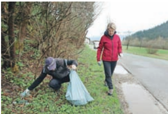
Pri čiščenju so letos posebno pozornost namenili glavnim vpadnicam v Žiri.

ničevih besedah letos posebno pozornost namenili še glavnim vpadnicam v Žiri. "Izkazalo se je, da je smetnje ob cestah v zadnjem času še večji problem kot ob vodotokih," je opozoril Mahnič in poudaril, da so največja težava lončki za kavo, ki jo ljudje pijejo na poti, saj se je prav teh med odpadki nabralo največ. Obenem pa je z zadovoljstvom ugotavljal, da se je skupna količina odpadkov v primerjavi s preteklimi leti zmanjšala, pa čeprav se je čiščenje lotilo precej več ljudi. "Včasih smo v