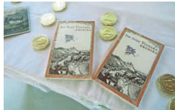
V občini Gorenja vas - Poljane bodo z različnimi dogodki zaznamovali stoto obletnico prve objave Visoške kronike.