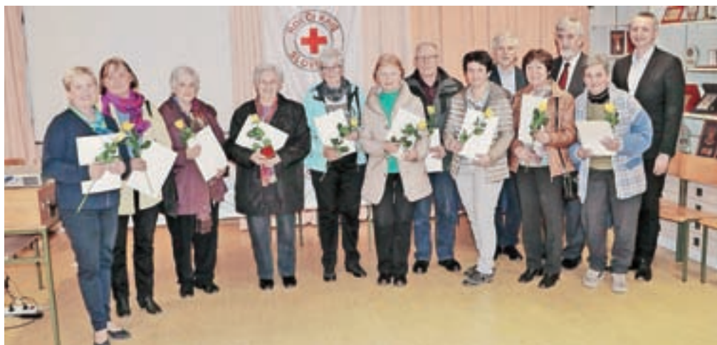
Nekateri od dobitnikov priznanj Rdečega križa