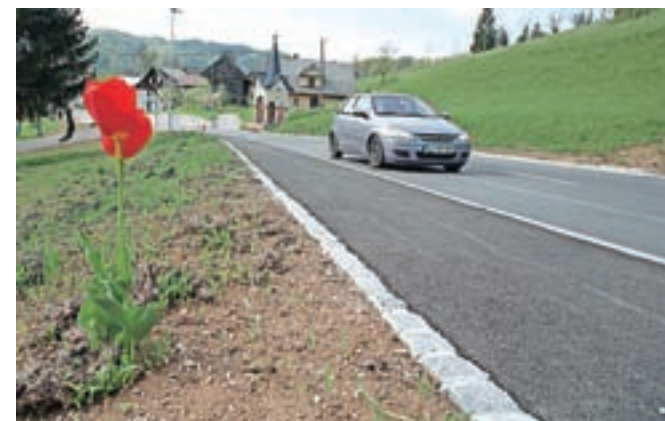
Nova cesta skozi Selo / FOTO: GORAZD KAVČIČ