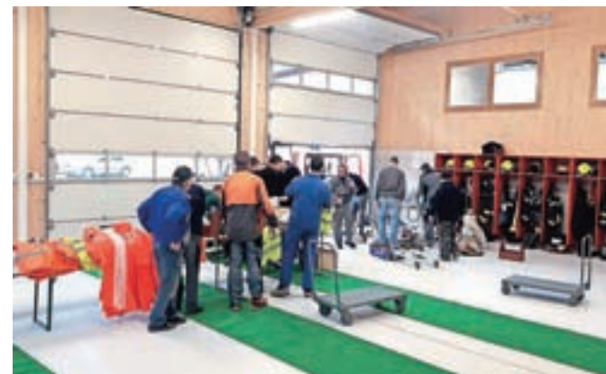
Selitev opreme v novi gasilski dom v Selcih

v prvem nadstropju, kjer je večnamenska dvorana. Septembra naj bi dom dobil še fasado, ob koncu poletja pa načrtujejo še asfaltiranje okolice. Uradno odprtje doma predvidevajo v naslednjem letu. V nov gasilski dom so po podatkih Nastrana doslej vložili okoli 412 tisoč evrov. Občina je prispevala dvesto tisoč evrov, preostalo so zbrali sami, tudi s pomočjo donatorjev in prispevkov krajanov. Ob gradnji doma so gasilci opravili tudi več kot 5500 prostovoljnih ur dela. Nastran je še povedal, da bodo star gasilski dom podrli: "Na njegovem mestu bo verjetno nastal manjši park, kolikor bo mogoče, se bo razširila lokalna cesta. Stari dom smo odstopili Krajevni skupnosti Selca, ki nam bo v zameno plačala asfaltirano dvorišče z dovozno cesto. Pri asfaltaciji bo pomagala tudi občina."