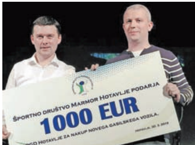
Namesto nagrad članom društva so se odločili, da za to namenjen denar ob jubileju poklonijo hotaveljskim gasilcem za lažji nakup novega vozila.