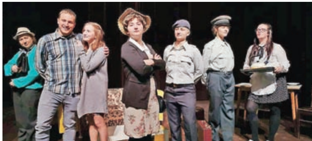
Ponovno obujena dramska sekcija TD Gorenja vas je navdušila že s svojo prvo predstavo z naslovom Sovražnica mož.