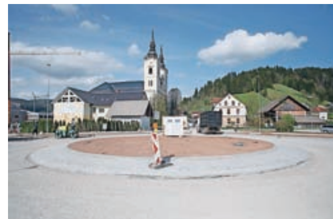
Končuje se gradnja krožišča.

Ta čas pa so že končali še en pomemben projekt v občini, to je gradnjo pločnikov na Selu, kjer jih prav tako čaka še en zahteven zalogaj, to je odprava še zadnjega ozkega grla na tem odseku. "Za to bo potrebna rušitev hiše pri Cenetu, kar bo predvidoma izvedeno še letos," je pojasnil župan.