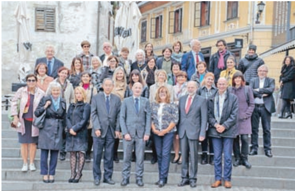
Udeleženci mednarodnega posveta so si ogledali Škofjo Loko.