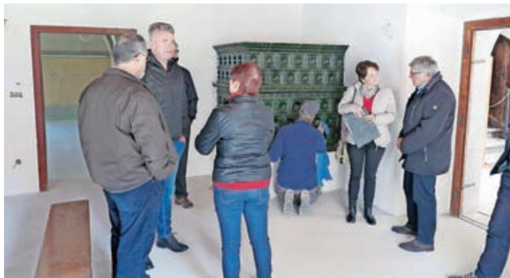
V dvorcu Visoko nadaljujejo obnovo. V pritličju bodo v maju odprli novo kavarno.