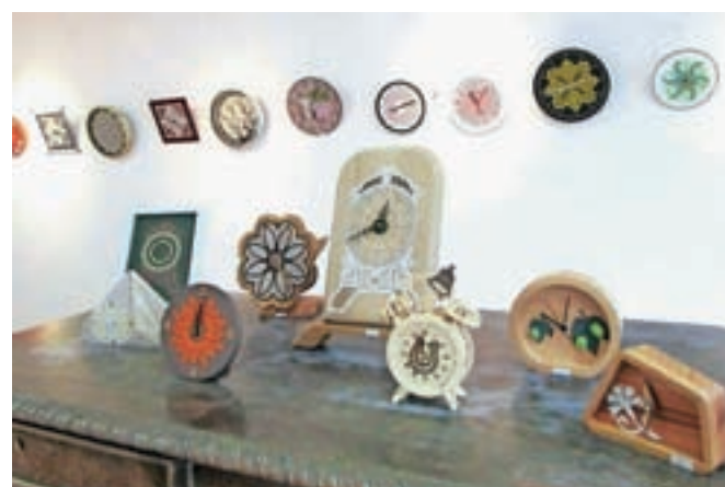
Letošnji natečaj so pripravili pod naslovom Moja najljubša ura.

Žiri – Tradicionalni klekljarski dnevi v Žireh bodo tudi letos še vse do 2. maja na ogled ponudili številne razstave klekljanih izdelkov. Osrednja razstava v veliki sobi Galerije Svoboda je v znamenju okroglih čipk, in sicer so poleg slovenskih na ogled tudi ruske, nemške, italijanske in hrvaške čipke. V mali sobi pa si je mogoče ogledati izdelke, ki so nastali v okviru letošnjega natečaja pod naslovom Moja najljubša ura. Na natečaj je po besedah Tanje Mlinar iz klekljarskega društva Cvetke prispele 44 ur, v katere je na različne načine vpeta tudi čipka. Poleg osrednje razstave v Galeriji Svoboda so klekljani izdelki na ogled še v drugih