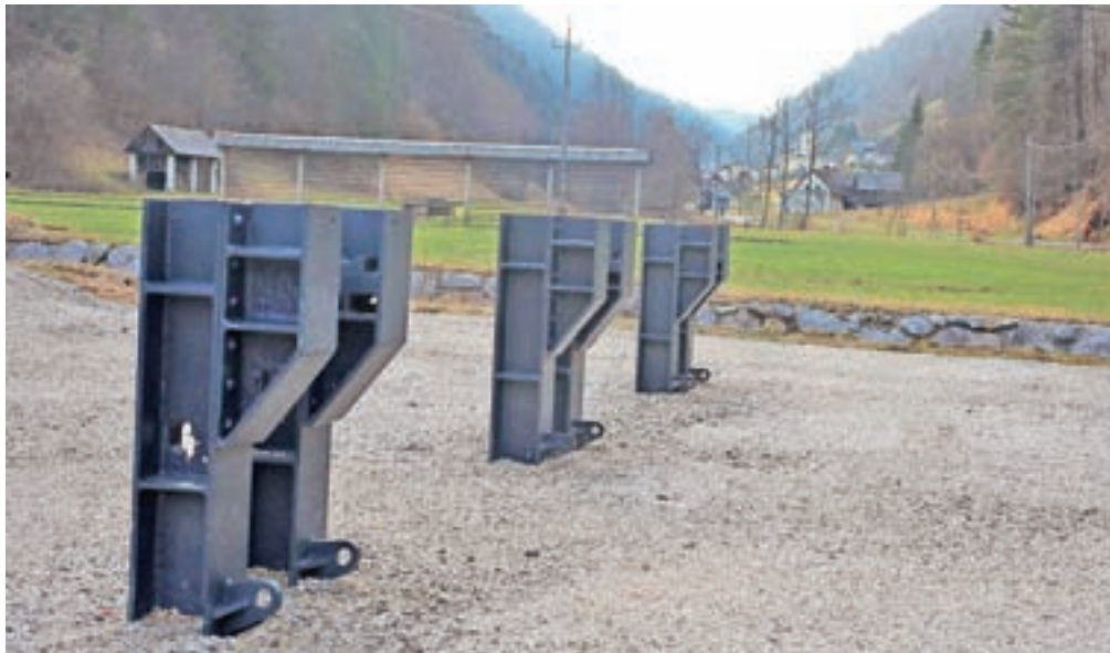
Park s protitankovskimi ovirami želijo v prihodnje nadgrajevati – najprej s postavitvijo informativne table.