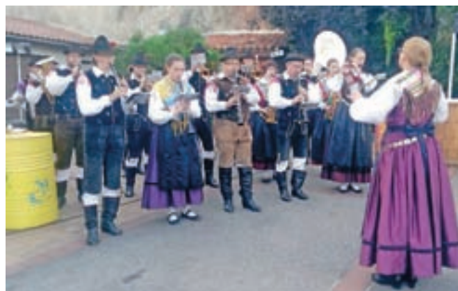
Člani Pihalnega orkestra Alples si bodo letošnje leto zapomnili tudi po gostovanju v Franciji.