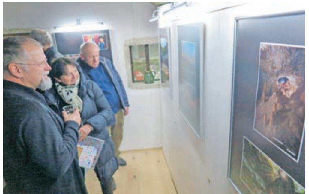
Prvo razstavo v novi galeriji si je ogledalo veliko fotografov in ljubiteljev fotografije.