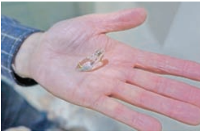
Steklen čevljevček iz kristala Swarovski

ko počasi začel dopolnjevati." Tako se je začelo, danes pa ima v svoji zbirki že vsaj okrog štiristo malih čevljev, ocenjuje Temelj. Glede na to, da razstavo v knjižnici gostijo v prazničnem decembru, je Temelj tokrat poudarek namenil predvsem prazničnim čevljevkom. Med njimi imajo posebno mesto Miklavževi čevlji, lahko pa so tudi Božičkovi ali od dedka Mraza, se namuzne. Najmanjši med njimi, ki pa je kljub temu med najdragocenejšimi, je steklen čevljevček iz