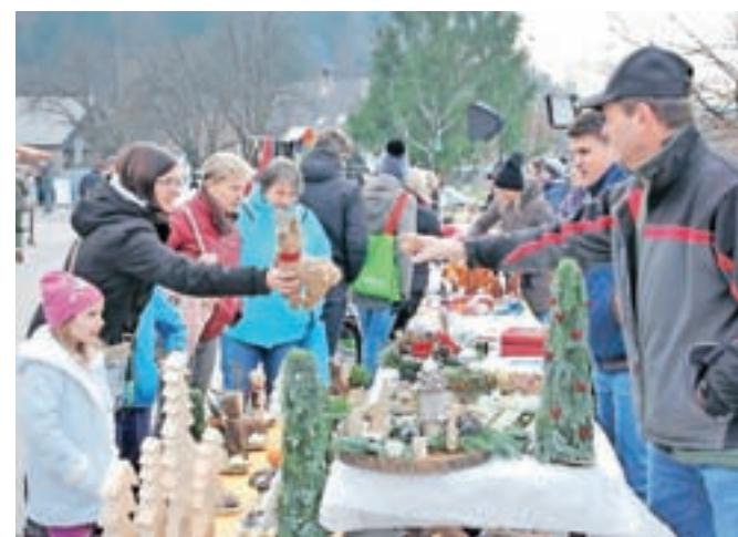
V KŽŠ so tudi letos pripravili adventni bazar.

Na brucovanju, ki so ga pripravili konec novembra, pa so žirovski študentje simbolično s krstom brucev izrekli dobrodošlico novim članom in jih sprejeli medse. Pred tem so morali bruci, ki so se zbrali v središču Žirov in se do dvorane Partizan odpravili v spremstvu v črno oblečenega rablja, opraviti številne zabavne naloge. Sledila je zabava s Kingstoni, brucovanje pa so popestrili še Nipke in Trkaj, Joker out ter Pero Martič.