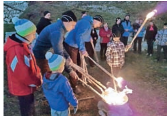
V Dražgošah so pripravili četrti romarski pohod od delno obnovljenih ruševin stare cerkve do nove cerkve sv. Lucije.