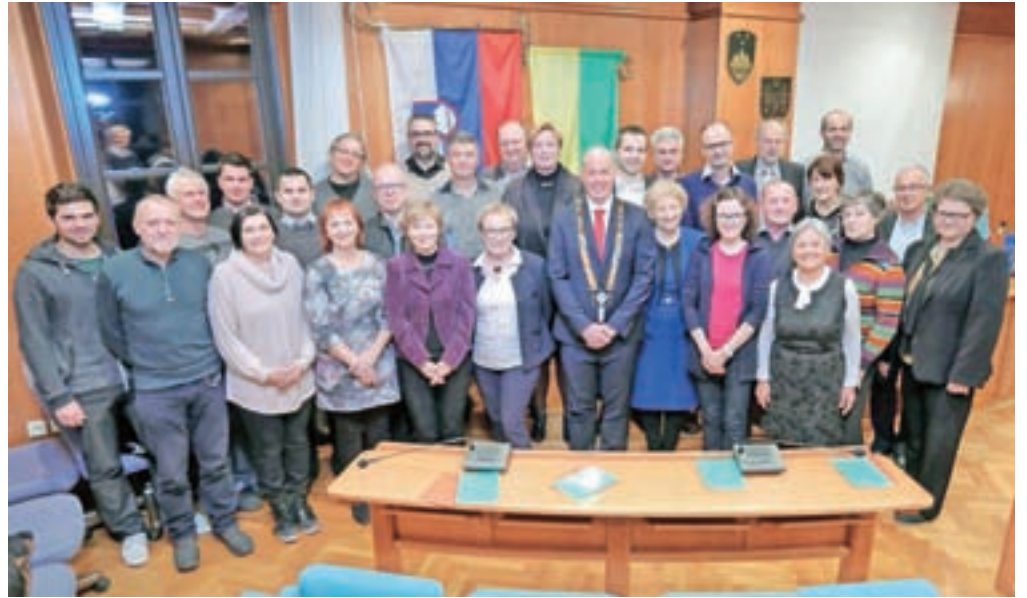
Članice in člani občinskega sveta Škofja Loka v mandatu 2018–2022