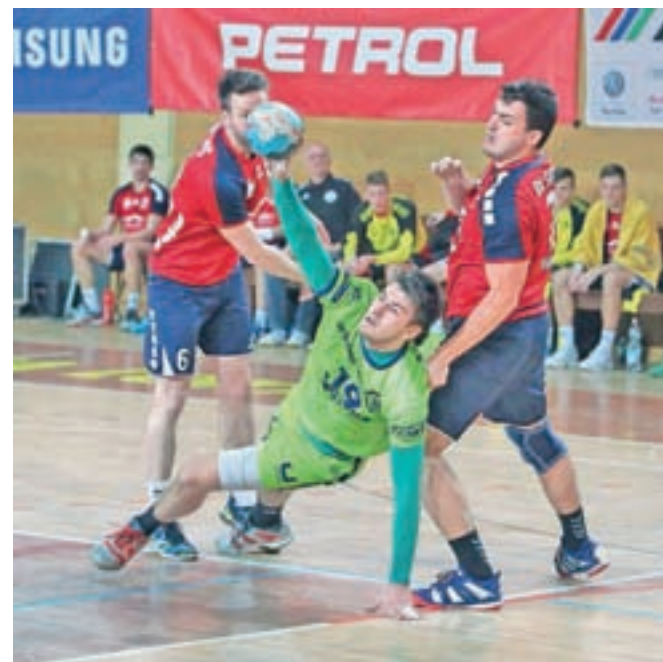
Loški rokometiški so na zadnji letošnji tekmi premagali ekipo Sviša iz Ivančne Gorice.