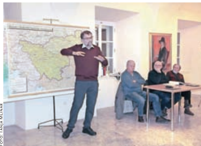
S predstavitev Žirovskega občasnika v Muzeju Žiri