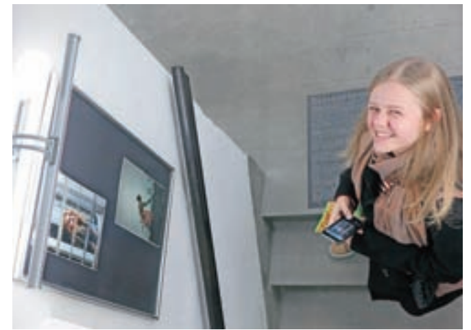
Ujeti trenutek ali fotografija za naslednjo razstavo