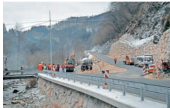
Nazadnje so preuredili križišče v Področju in rekonstruirali cesto od Področja naprej.

"Gradnja zadnjega odseka ceste je po zahtevnosti podobna prejšnjim fazam. Seveda je gradnja takšne ceste zahtevna zaradi konfiguracije terena in vseh potrebnih