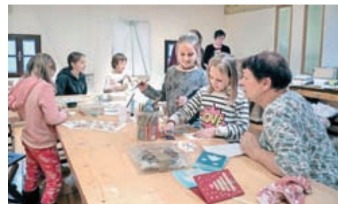
Nadvse živahno vzdušje je vladalo na podstrešju, kjer so otroci izdelovali voščilnice. / FOTO: TINA DOKL