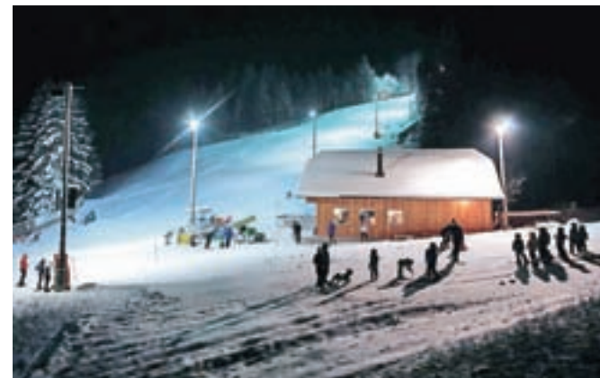
Na smučišču Rudno jim je po večletnih prizadevanjih uspelo postaviti brunarico.