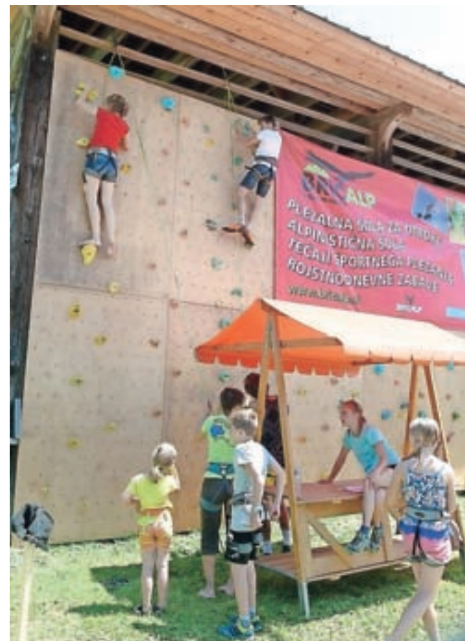
Svoje spretnosti so lahko tako otroci kot odrasli preizkusili na plezalni steni.

Najbolj pester program so pripravili v nedeljo, ki je bila v znamenju mednarodnega dneva očetov. Igor Vovk je kot zanimivost ob tem nave-