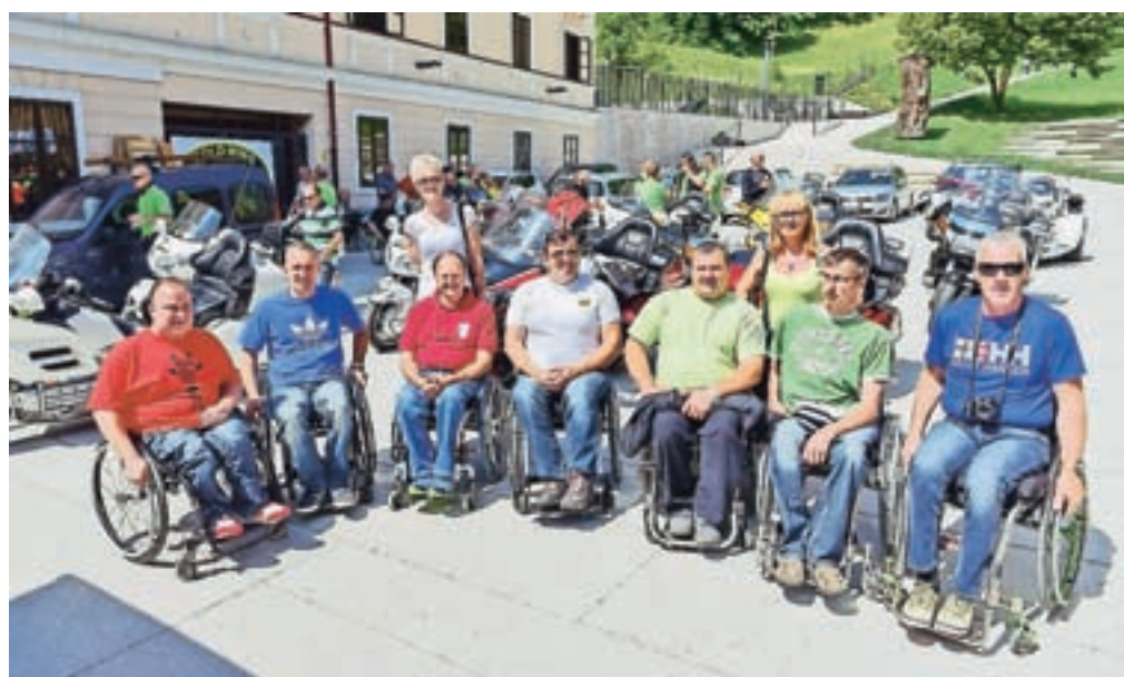
Pred potovanjem od Škofje Loke do Bleda