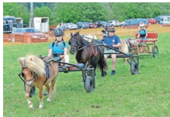
Kasaške dirke s poniji so pritegnile veliko zanimanja.