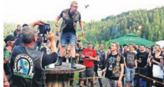
Tudi letos ob druženju niso manjkale motoristične igre.

severnih evropskih držav. Ob spoznavanju okolice na tradicionalni turistični vožnji so jim gostitelji pripravili tudi tradicionalen program z motorističnimi igrami in zanimivim glasbenim programom, tako da nikogar niso motile niti občasne plohe.