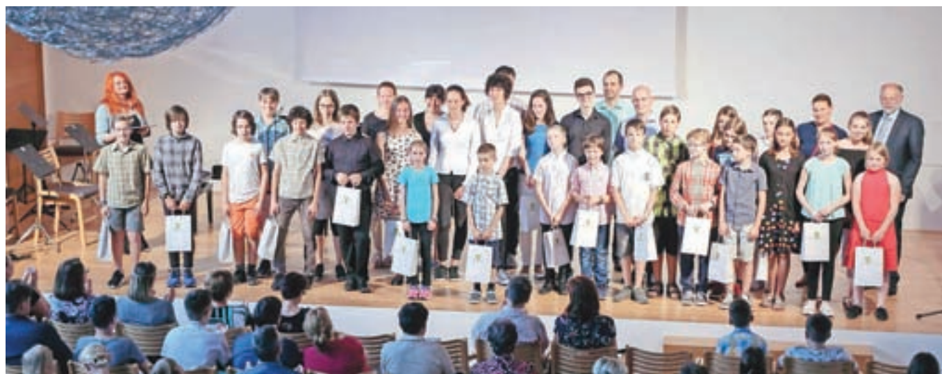
Izvrstno so se odrezali na glasbenem področju.