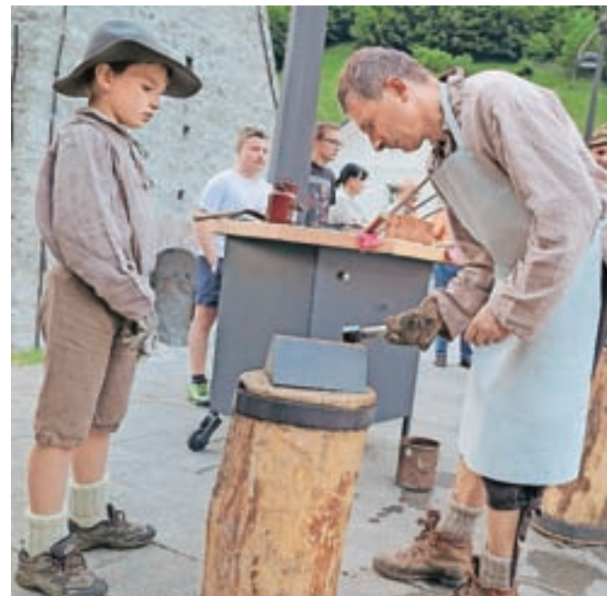
Na noč muzejev so prikazali tudi kovanje žebeljev in prvič preizkusili novo kovaško ognjišče.