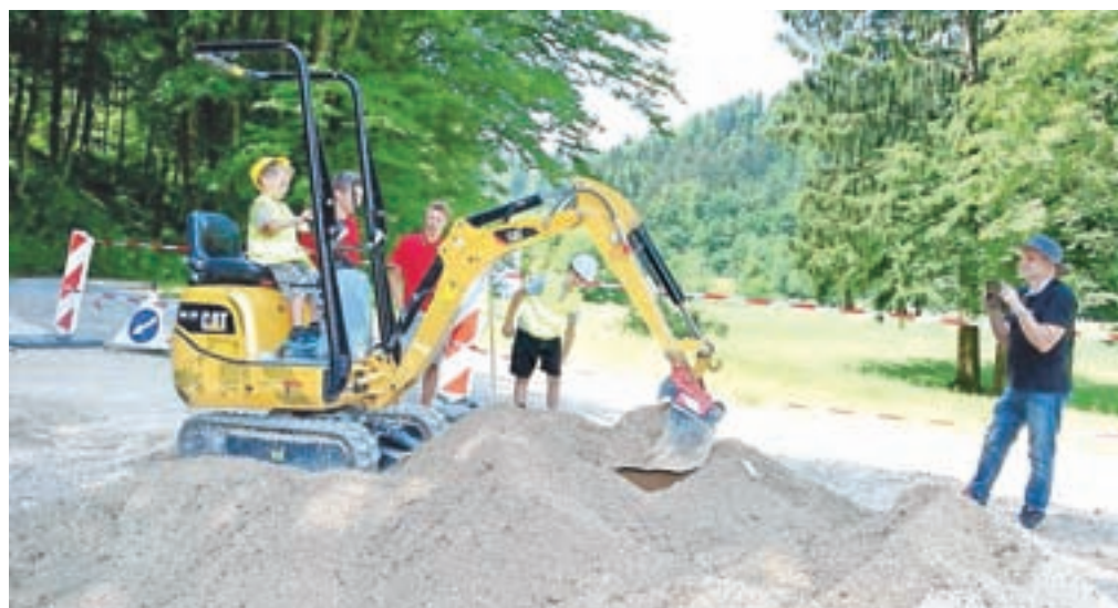
Otroci so lahko poskusili upravljati čisto pravi bager.

del, da dan očetov izvira iz Združenih držav Amerike, danes pa ga praznujejo v skoraj sto državah po vsem svetu. V Sloveniji je po ocenah statističnega urada Slovenije iz leta 2015 več kot pol milijona očetov, od tega jih 313 tisoč živi v družinah s svojimi otroki, nekaj manj kot 27 tisoč pa jih živi samih z otroki.