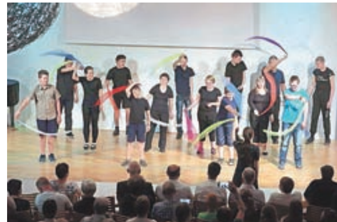
Nastopila je tudi plesna skupina OŠ Jela Janežiča.

Društvo Sožitje Škofja Loka, ki skrbi za osebe z motnjami v duševnem razvoju, praznuje petdeset let. Proslavili so z izdajo knjige in prireditvijo.