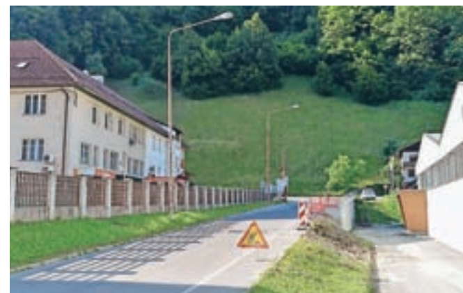
Gradnja opornega zidu pri Alplesu

ter Košir. Skoraj pol milijona evrov vredna investicija, za katero je občina pridobila 368 tisoč evrov nepovratnih državnih sredstev, naj bi potekala do konca septembra. Preuredili bodo slabo pregledno križišče, pri čemer bodo odstranili oporni zid med dovoznima cestama, ki se vzporedno navezujeta na regionalno cesto. Ob uvozu v cono bodo z "otokom" ločili vozna pasova in obnovili še približno sto metrov ceste (malo dlje od odcepa za prvo ulico stanovanjskih hiš). V križišču bodo sanirali celotno komunalno infrastrukturo in preplastili regionalno cesto, zgradili bodo tudi pločnike pred trgovino Tuš, bencinskim servisom in mimo gostinskega lokala.