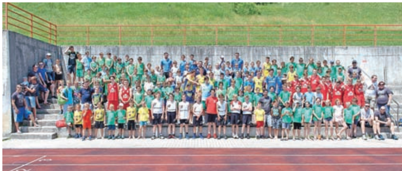
Udeleženci letošnjega Festivala košarke v Poljanah