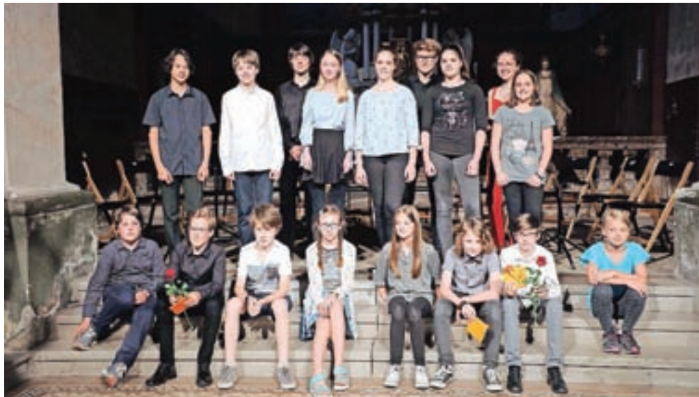
Odlični mladi kitaristi, ki so nas s kitarsko glasbo povedli v letošnje poletje