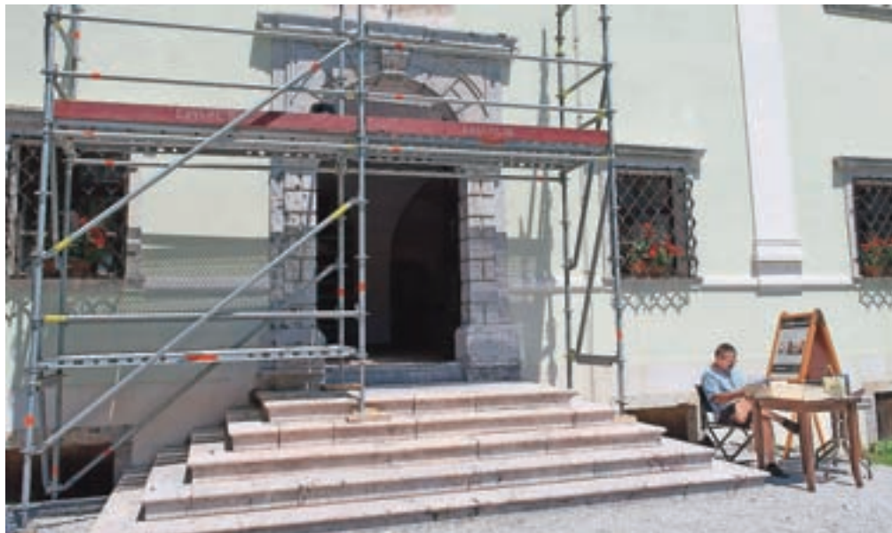
Na dvorcu Visoko restavrirajo vhodni portal.

Izkop za ureditev sanitarij so po besedah župana Milana Čadeža začeli že v februarju in naj bi jih tudi že končali, a so številni nepredvideni dogodki nekoliko zamaknili gradnjo in naj bi bile tako obiskovalcem na voljo od sredine julija dalje. "Po zaključku grobnih gradbenih del je namreč v prostore vdrla vlaga, tako da je bilo treba tla in zidove pred polaganjem ploščic izsušiti. V dogovoru z zavodom za varstvo kulturne dediščine smo se odločili tudi za zamenjavo vhodnih vrat v sanitarije, da bodo v skladu z ostalo stavbno opre-