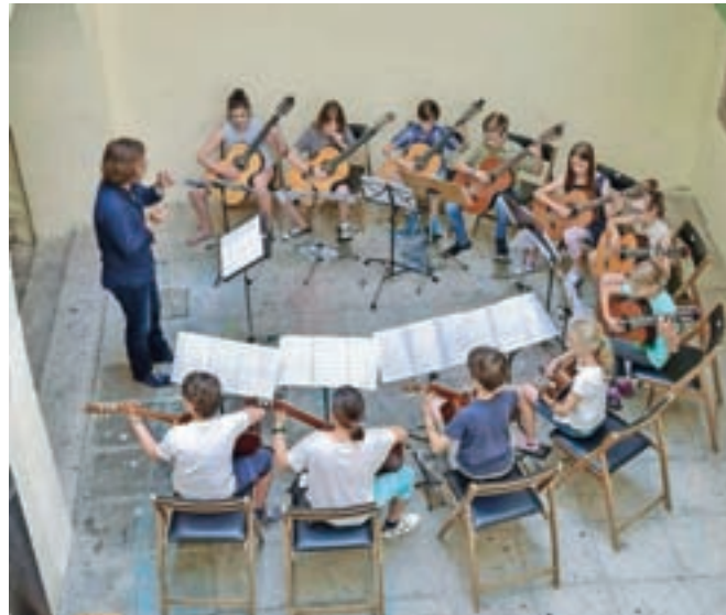
Prireditve se vrstijo že ves mesec, med njimi je bila tudi O'glasbena Loka z nastopi učencev Glasbene šole Škofja Loka