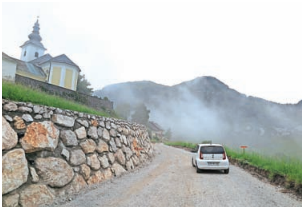
Odsek regionalne ceste pod vasjo Sorica bo predvidoma zgrajen do konca avgusta.

Na cesti pod vasjo Sorica in v Podroštu dela potekajo že nekaj mesecev, za izvedbo