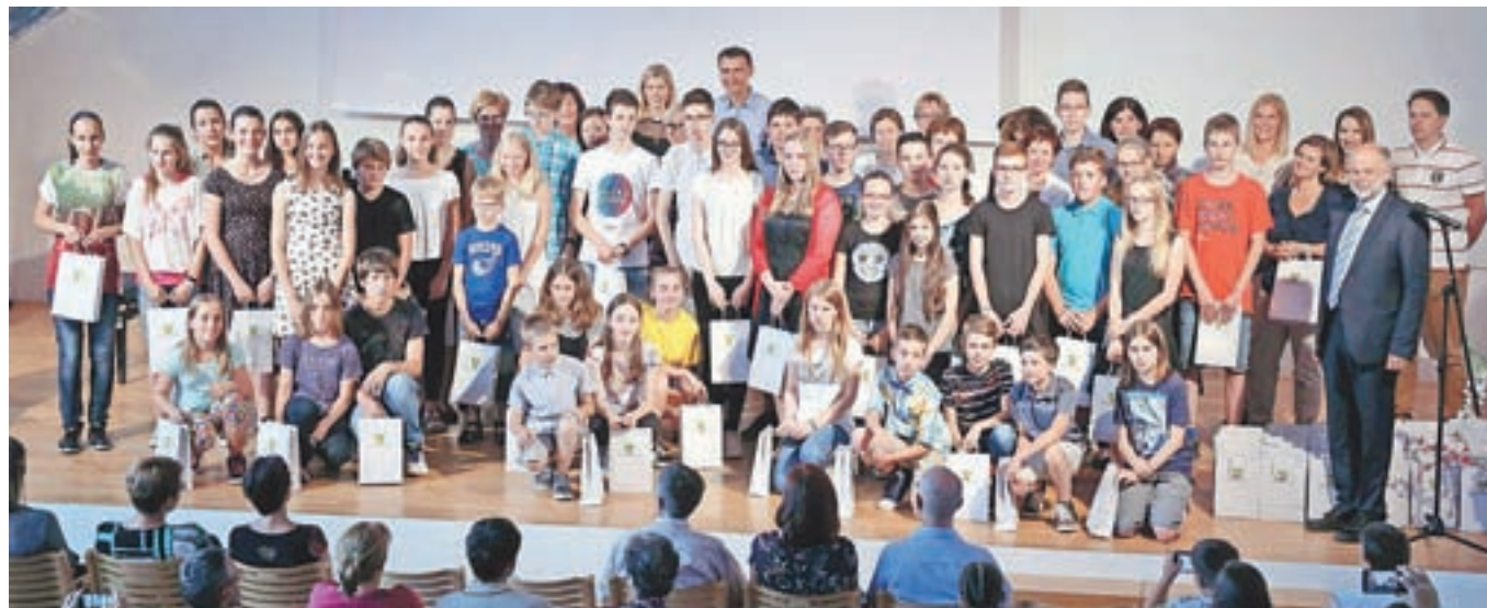
Nagrajeni za zlata priznanja iz znanja

Župan Občine Škofja Loka Miha Ješe je pred koncem šolskega leta podelil priznanja učencem škofjeloških šol, ki so se najbolj izkazali na državnih tekmovanjih v znanju in na glasbenih tekmovanjih.