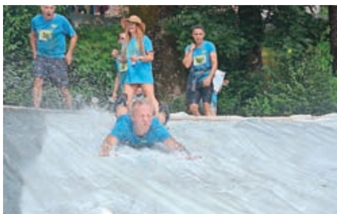
Zabaven spust po eni izmed vodnih prepek, ki so jo poimenovali Drča.