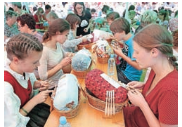
Z lanskega klekljarskega tekmovanja, ki je osrednji dogodek Čipkarskih dni v Železnikih