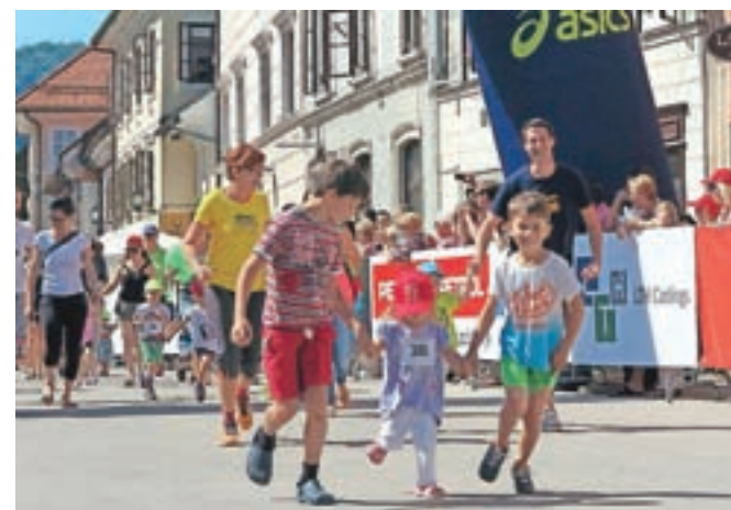
Že dopoldne so v mestu tekli najmlajši.