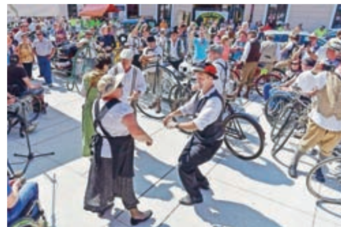
Rovtarji so naredili pravi "kralval".