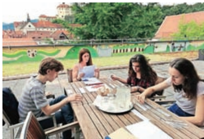
Novi literati v akciji