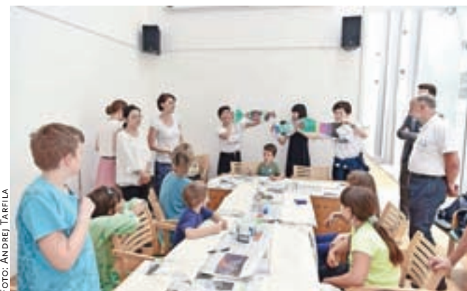
Z delavnice izdelovanja papirnatih koinoborijev