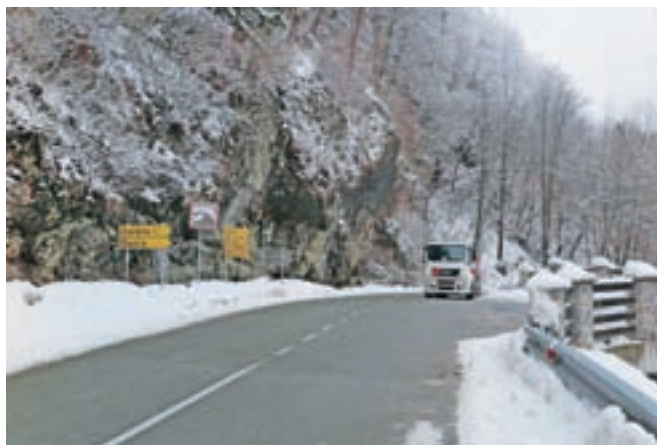
Uredili bodo tudi skalno brežino pri davškem mostu.

Železniki – Največja investicija, ki jo bo Direktorija RS za infrastrukturo letos izvajala v občini Železniki, bo dokončna ureditev državne ceste v Sorico. Poleg tega naj bi uredili skalno brežino pri davškem mostu, kar so sicer napovedovali že za lani. Sanirati nameravajo tudi skalno brežino v cestni ožini nad Zalim Logom. "Pri davškem mostu je predvidena odstranitev dela brežine, ki bo nato zaščiten z mrežami. Z odstranitvijo dela brežine bomo odpravili tudi zožitev ceste na tem mestu. Brežina pri Zalem Logu pa bo zaščiten s kamnito zložbo in z zaščitnimi mrežami nad njo. Razpis za sanacijo obeh brežin bo objavljen predvidoma marca. Če ne bo pritožb, se bo tudi izvedba začela predvidoma še v tem letu," so pojasnili. O zaščiti pobočja dvesto metrov naprej od davškega mo-