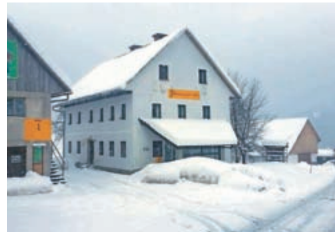
Pošta v Groharjevi hiši v Sorici je minuli teden zaprla vrata.

in poštne nakaznic, izplačila zneskov z osebnih računov pri Novi KBM, nakupa znamk, ovojnic ..., kar je, poudarjajo na Pošti, še posebej primerno za starejše in manj mobilne krajanje. Za mnenje o t. i. pismonoški pošti je še prezgodaj, pravi Pintar: "Vemo, da pismonoša opravlja poštne storitve v prilagojenem dostavnem avtomobilu, da bomo lahko naročili obisk pismonoše tudi na domu, da bo na vnaprej dogovorjeni lokaciji pismonoša vsak dan opravil postanek največ do 30 minut in da bomo lahko dostavo paketov in priporočenih pisem brezplačno naročili tudi ponovno po prvi neuspehi dostavi. Slabe lastnosti vidimo v tem, da bo stranka med čakanjem na storitev in opravljanjem storitve stala v mrazu, v vetru, dežju, snegu na cesti pred avtomobilom. Ali bomo lahko naročili vnovično dostavo v popoldanskem času? Vse to so neznanke, na katere bomo dobili odgovor skozi čas. Jasno pa je, da bolje, kot je bilo, zagotovo ne bo."