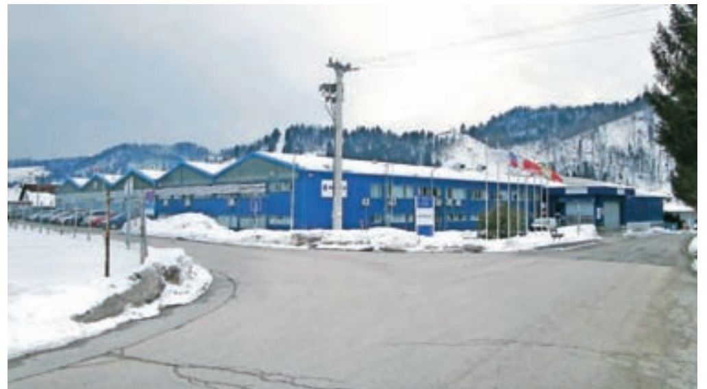
Za gradnjo ceste v industrijski coni, s katero bodo omogočili njeno širitev, so v letošnjem proračunu namenili 270 tisoč evrov.