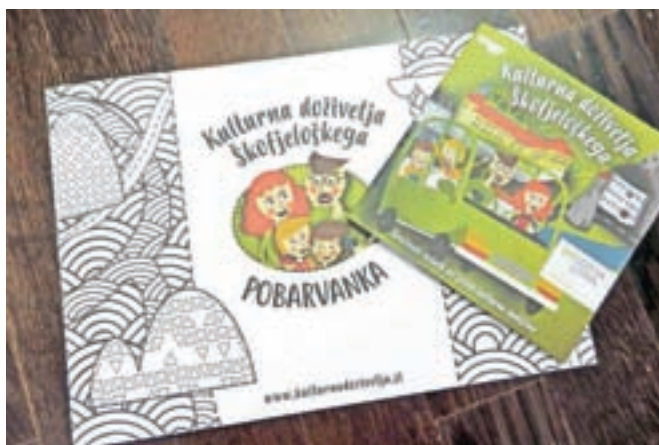
Brošura in pobarvanka, ki so ju izdali v sklopu projekta Kjer domujejo zgodbe.