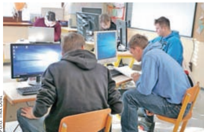
Mladi so pokazali, da obvladajo računalniško znanje.

v družbi organizatorjev vsem podelil nagrade in jim namenil nekaj spodbudnih besed. Dejal je, da današnja tehnologija zahteva vse več računalniškega znanja in te večine mladi danes veliko bolj obvladajo kot starejša generacija. Vsi tokratni tekmovalci pa so po njegovih besedah tudi zmagovalci. Povabil jih je še k ogledu zasnežene in tega dne s soncem obsijane Škofje Loke. Nekateri so si jo tudi ogledali, drugi pa so se v prostem času med tekmovanjem odzvali povabilu Zavoda za šport Škofja Loka, ki jim je omogočil kegljanje. Na sklepnem prireditvi so prisluhnili učencem četrtega in petega razreda, ki so ob tej priložnosti pripravili lutkovno-glasbeno predstavo.