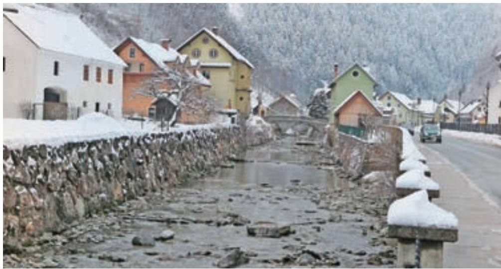
V Železnikih upajo, da bo država letos vendarle začela izvajati protipoplavne ukrepe na Selški Sori.