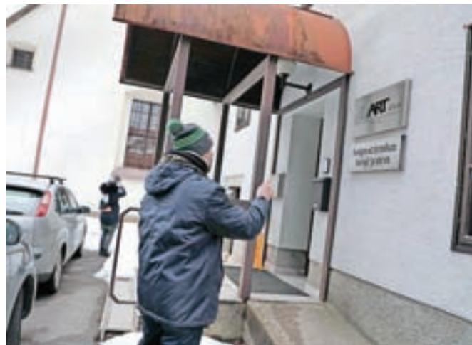
Kapucinska knjižnica hrani tudi izvirnik Škofjeloškega pasijona.

uršulink, ki so svoje čase prebivale v mestu. Nato se vzpnemo proti gradu, kjer najprej spoznamo Pot treh gradov, nato pa mogočni Loški grad. Ta v muzeju med drugim ponuja tudi ogled stalne zbirke o Škofjeloškem pasijonu, odprte prav tako lani. Znova se spustimo na Mestni trg in spoznamo njegove značilnosti, nato pa na Trg pod gradom ter od tam na Spodnji trg in h Kašči, ki so tudi prizorišča Škofjeloškega pasijona. Zadnja postaja Romualdove poti je cerkev sv. Jakoba, svoj ogled pa sklenemo pri pasijonski sobi, kamor si gremo po nagrado za uspešno rešene kvize, uganke, sestavljanke in druge naloge, ki smo jih dobivali na poti. Na njej smo