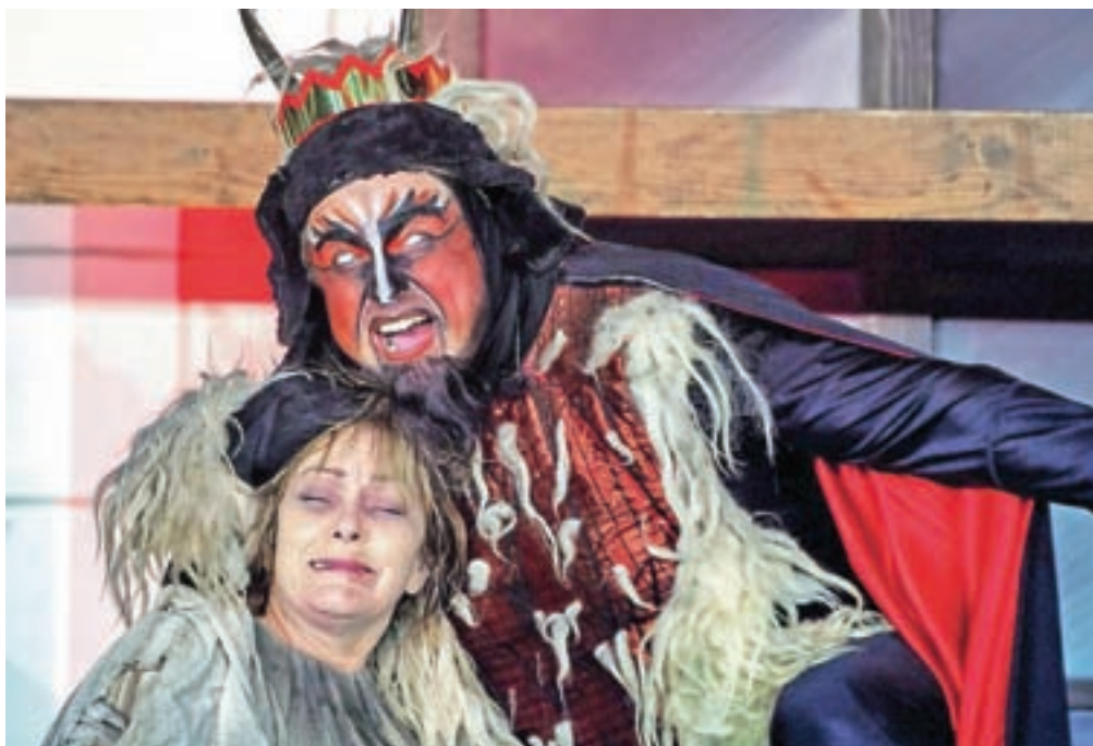
Z enim najmarkantnejših prizorov Škofjeloškega pasijona, Grešno dušo, bodo letos gostovali na Hrvaškem (prizor iz uprizoritve leta 2015)

Škofja Loka – Naslednja uprizoritev Škofjeloškega pasijona bo leta 2021. Dotlej pa v Škofji Loki na to markantno zapuščino, ki nima le lokalnega in državnega pomena, temveč od predlani kot nesovna kulturna dediščina tudi Unescovo zaščito, spominjajo vmesni dogodki. Vsako leto v postno-velikonočnem času potekajo Dnevi Škofjeloškega pasijona. Letos se bodo začeli 9. marca, ko se bodo ob 17. uri v novi pasijonski sobi na Mestnem trgu 24 pod naslovom (Z)gradimo živo pasijonsko skupnost začeli na njene stene podpisovati sodelujoči na dosedanjih uprizoritvah Škofjeloškega pasijona. Organizatorja sta poleg Občine Škofja Loka še Muzejsko društvo Škofja Loka in Kulturno-zgodovinsko društvo Lonka Stara Loka, sodelujeta tudi Glasbena šola Škofja Loka in Sokolski dom. Pasijonski dan se bo ob 19. uri nadaljeval s predstavitev publikacije Pasijonski doneski, pred-