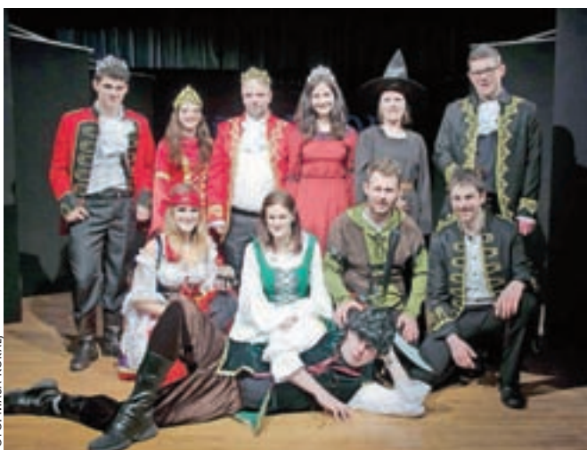
V Neč Bat Teatru so se letos lotili tudi klasične pravljice.