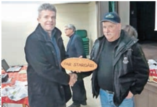
Glinene tablice s starimi hišnimi imeni so letos razdelili 117 vaščanom Dobja, Poljan, Hotovlje in Predmosta.

nje Brdo, Zakobiljek, Lom nad Volčo, Volča, Lovsko Brdo in Hlavče Njive. Letos se jim je pridružil še 117 hišnih imen, ki jih domačini poznajo oziroma uporabljajo že več kot šestdeset let. "Kar nekaj zapisov hišnih imen je bilo sicer evidentiranih v zgodovinskih virih, vendar so domačini že pozabljeni, nekaj imen pa je tudi takih, ki so med ljudmi sicer poznana, vendar so mlajšega izvora in zato niso bila predmet popisa znotraj omenjenega projekta," so pojasnili na občini. Na ta način želijo ohraniti dediščino in narečni govor, ki svoje posebnosti kaže tudi pri izražanju hišnih imen, da bi tako preprečili izginotje starih hišnih imen in razširili njihovo uporabo.