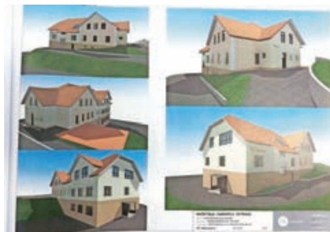
Idejna zasnova prenove podružnične šole v Javorjah

V Javorjah so sredi februarja predstavili idejno zasnovo prenove tamkajšnje podružnične šole.