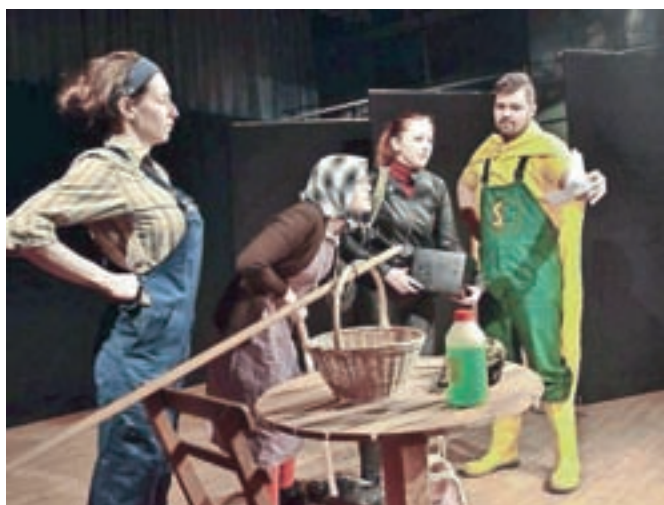
Prizor iz predstave Superkmet

učilnico za šolo in igralnico za vrtec. Obenem bodo povečali prostore kuhinje, zbornice, skupnega prostora in kjižnice. "Objektu bomo s prenovo nadedli lepo in povezano podeželsko zunanjo podobo," je še dodal župan. Na sami predstavitvi obnove šole so tudi prisotni podali nekaj dobrih predlogov, ki jih bodo upoštevali v postopku pridobitve projektne dokumentacije, je še razložil župan in dodal, da bo v primeru, da bodo gradili samo z lastnimi sredstvi, šola dograjena čez pet let, se pravi ravno takrat, ko bo v šolo vstopila ponovno močna generacija otrok, rojenih leta 2016.