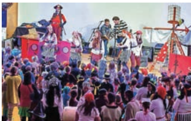
Pustne šeme so v Sokolskem domu z glasbo in plesom preganjale zimo.

izraze, pogostokrat premalo zavedamo. Prav zato naj bo slovenski kulturni praznik priložnost, tako v simbolnem kot dejanskem smislu, da zberemo pogum za ohranitev svojega jezika – in kulture.