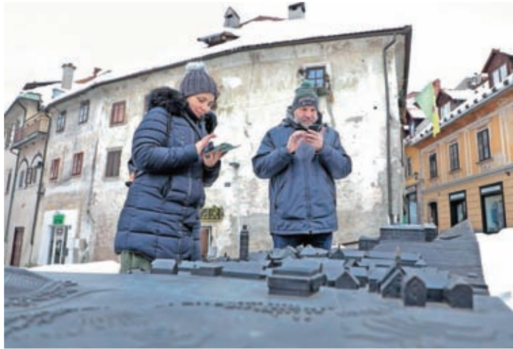
Pri maketi Škofje Loke nas čaka obilo informacij in prva uganka.

Hladen zimski dan nemara ni najbolj primeren za hojo po Romualdovi poti, a jo vendarle želimo spoznati v času, ko se Loka pripravlja, da s pasijonskimi dnevi obudi misel na Škofjeloški pasijon. Od jeseni, ko so jo odprli, jo je nekaj ljudi že obiskalo, Katja Štucin je na eno od nedavnih hladnih nedelj srečala očeta z majhnim sinom, kako sta strmela v pametni telefon in poslušala pripoved očeta Romualda. Pa se odpravimo! Pasijonsko sobo izpustimo, ker jo še zasedajo delavci, in se kar takoj odpravimo do druge točke, makete Škofje Loke na Cankarjevem trgu. Ob informacijah očeta Romualda dobimo tudi njegovo prvo nalogo: na maketi moramo poiskati Kamniti most, Kaščo in Mestni trg in vse to označiti na ekranu telefona. Bravo, vse smo pravilno uganili in dobili že prve točke v interaktivni igri! "Zdej pa le ta rdeč' puščič' sled' in greš na ta Romualdov ogled," nas oče Romuald povabi k nadaljevanju poti. In na ekranu se res zariše rdeča puščica, ki nas s Cankarjevega trga po brvi čez reko Soro popelje do cerkve sv. Ane in kapucinskega samostana. Slednjih se drži tudi kapucinska knjižnica z rokopisom Škofjeloškega pasijona in nekaj drugimi knjižnimi dragocenostmi. Nato nas vodnik usmeri proti Kapucinskemu (ali Kamnitemu) mostu, na katerem so svoj čas za vstop v mesto pobirali mostnino. In