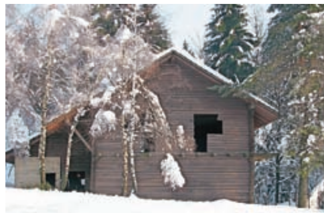
Lastništvo mladinskega doma v Žirovskem Vrhu naj bi še v tem tednu prenesli na Občino Žiri.

Na problematiko nerešenega lastništva doma je župana že sedem let nazaj opozorilo več občanov, saj je na pol dokončana brunarica ves čas samevala. Pri iskanju lastnika so se