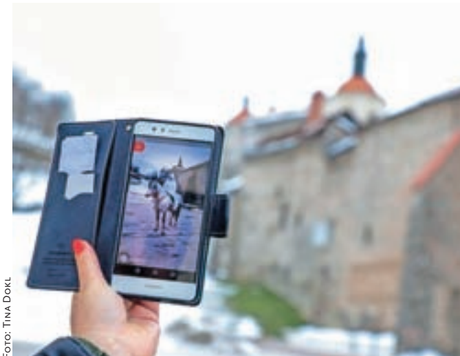
Prikličemo si "obogateno resničnost": na Trgu pod gradom denimo shrhljivega jezdeca na čelu pasijonske procesije.