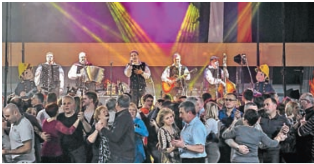
Gasilski večer je obiskovalcem ponudil več kot sedem ur narodno-zabavne glasbe.