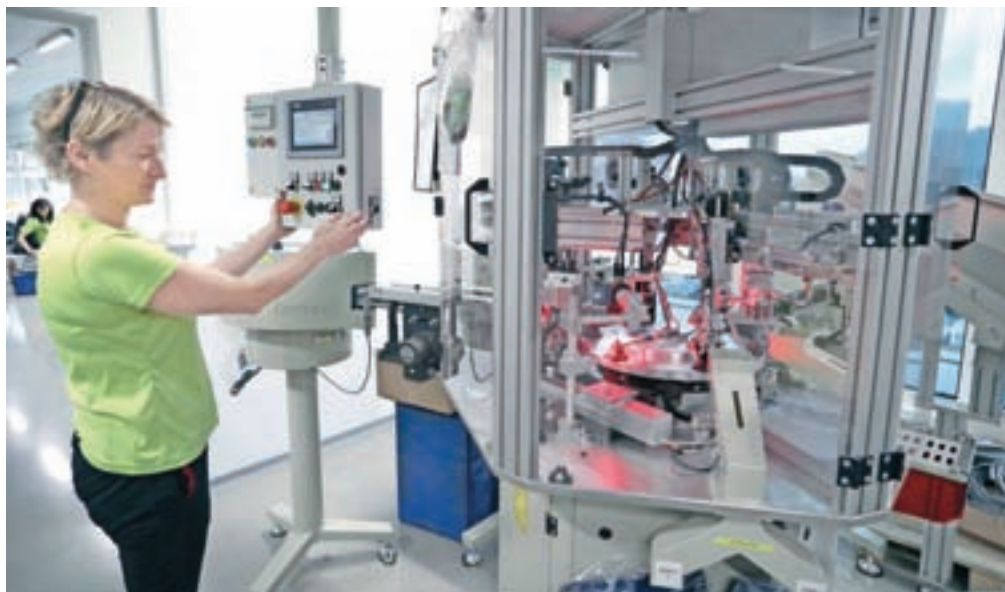
V začetku januarja je proizvodnja v podjetju Polycom stekla v novih prostorih v industrijski coni Dobje.

Več kot osemdeset odstotkov njihove proizvodnje je vezana na avtomobilsko industrijo, zato velik poudarek na-