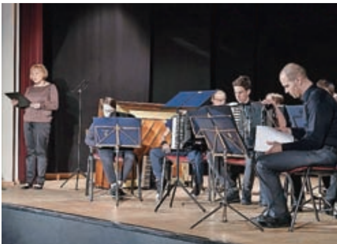
Občinstvo je z zanimanjem prisluhnilo pesmim, ki so jih recitali člani KUD France Koblar.

Železniki – Kaj je poezija? je bil naslov pa tudi osrednja nit občinske slovesnosti, ki so jo na predvečer slovenskega kulturnega praznika pripravili v Železnikih. Na prireditvi, ki je letos potekala v organizaciji Kulturno umetniškega društva France Koblar, so navzoči prisluhnili pesmim Janeza Menarta, Cirila Zlobca, Kajetana Koviča in Toneta Pavčka pa tudi njihovim razmišljanjem o poeziji. "Na proslavi smo predstavili štiri pesnike, ki so leta 1953 kot mladi in neznani pesniki objavili svoje prve pesmi v zbirki Pesmi štirih. Zbirka še danes velja za prvo sodobno slovensko pesniško zbirko in je verjetno najbolj znana pesniška zbirka povojnega