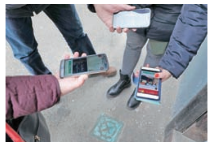
S pametnimi telefoni po Romualdovi poti