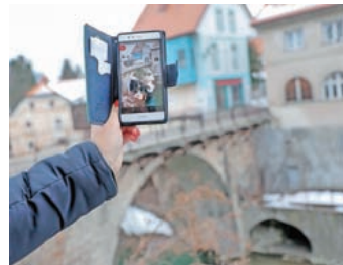
Legenda o Kamnitem mostu in škofu Leopoldu

si večkrat lahko na ekrane priklicali "obogateno resničnost". Postavili smo se k ploščici, ki na tleh označuje tematsko pot, telefonski ekran usmerili k ozadju, kakor so navajala Romualdova navodila, in že se nam je izrisal prizor iz Škofjelo-