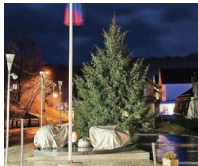
Takole je pretekli teden smreka na trgu Ivana Regna čakala, da bo zasijala v praznični razsvetljavi.

ob prižigu lučk, saj so poleg plesalk iz plesne skupine Step nastopile tudi gorenjevaške mažoretke. Otrokom so odštevanje do prižiga praznične osvetlitve polepšali s palačinkami, obiskal pa jih je tudi dedek Mraz in jih razveselil s sladkarijami za vse otroke. Njihovi starši pa so lahko kupili voščilnice, ki