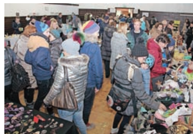
Adventni bazar je bil zelo dobro obiskan.

V Klubu žirovskih študentov (KŽŠ) so drugo soboto v decembru pripravili adventni bazar, ki mu je zvečer sledilo brucovanje.