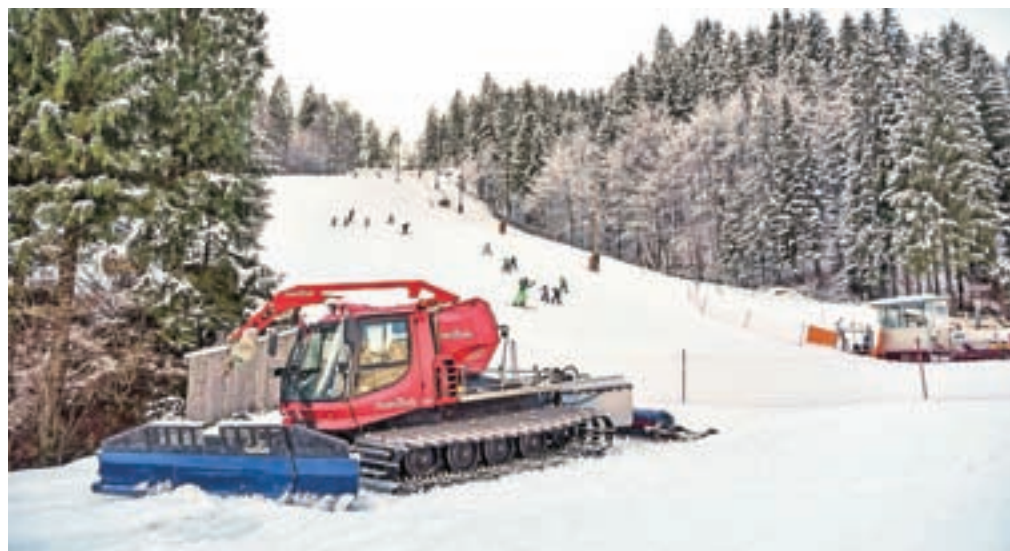
Na Rudnem pridobivajo gradbeno dovoljenje za brunarico.

Pred letošnjo sezono so v Avstriji za 7600 evrov kupili rabljen snežni top. "Star je dobrih deset let in je zmogljivejši od ostalih. Trenutno imamo skupaj pet topov, a je eden za rezervo, saj smo omejeni z elektriko, ki trenutno omogoča zasneževanje z največ štirimi topovi naenkrat," je pojasnil. V prihodnje si želijo, da bi ogrevan šotor končno zamenjala brunarica. "Smo v fazi pridobivanja gradbenega dovoljenja. Upamo, da jo letošnja sezona dobra in jo bomo lahko postavili že do naslednje zime," je še dejal Gartner.