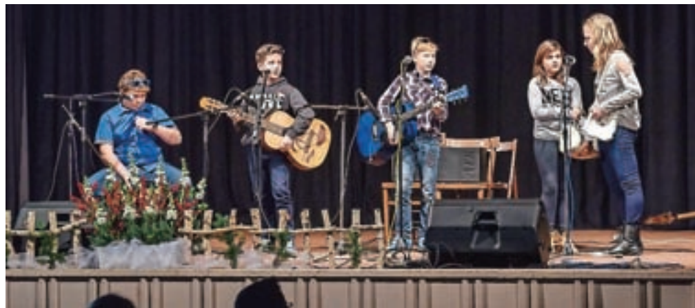
Obiskovalci so bili nad nastopi mladih iz Davče zelo navdušeni.

Kot je v pismu, ki so ga prebrali na prireditvi, zapisala njegova mati, Galu le s pomočjo različnih tehničnih pripomočkov uspe "ujeti" kakšen zvok. "Z izgubo sluha pa so okrnjene tudi druge življenjske funkcije, predvsem fina motorika, še bolj pa so okrnjene in ravnotežje, zato potrebuje dodatne posebne terapije," je pojasnila. Gal obiskuje drugi razred Zavoda za gluhe in naglušne