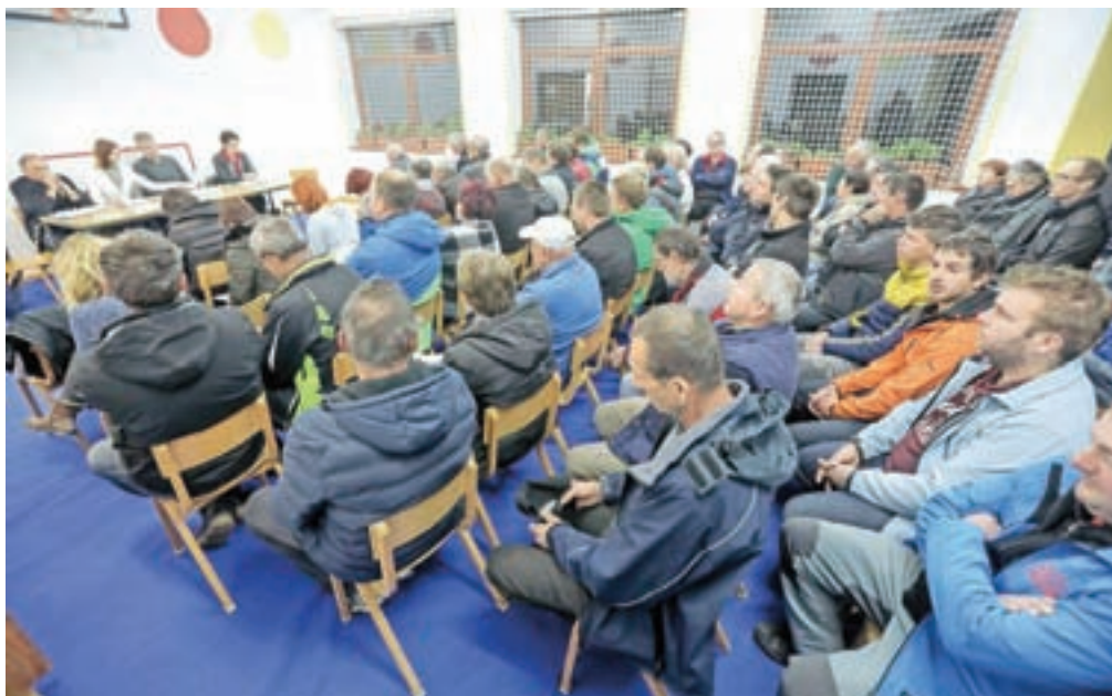
Zbora krajanov se je udeležilo okrog osemdeset domačinov.

A kot se je izkazalo skozi razpravo, prav voda iz novozgrajenega vodovoda najbolj razburja krajanje. »Podpisniki zahteve za sklic zbora kra-