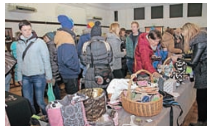
Obiskovalci so lahko izbirali med izdelki na kar petindvajsetih stojnicah.

stin. Zelo veseli pa so bili tudi odziva pri stojnici republiškega zavoda za transfuzijsko medicino, ki so jo v najem ponudili brezplačno. Strokovna sodelavka je vpisovala v register vse potencialne darovalce krvotvornih matičnih celic v starosti od 18 do 46 let. "Na seznam potencialnih darovalcev se je v Žireh na novo vpisalo okrog sto darovalcev," je bil zadovoljen Tilen Justin. V večernih urah pa se je dvorana Partizana spremenila v prizorišče brucovanja, v okviru katerega so pripravili tudi krst brucev. V svojo sredo so žirovski študentje simbolično sprejeli dvajset brucev, ki so morali prej opraviti številne zabavne naloge in iti skozi zabavno zaprisego. Nato so se lahko enakovredno pridružili skoraj šeststo študentom na koncertu skupin Gemuse, Flirtt in Big Foot Mama.