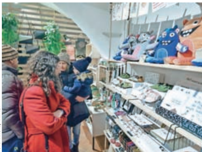
Decembra vabijo obiskovalce tudi Izložbe domišljije.