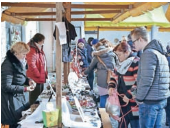
Prvi decembrski LUFt je bil Miklavžev, drugi bo ta konec tedna božični.