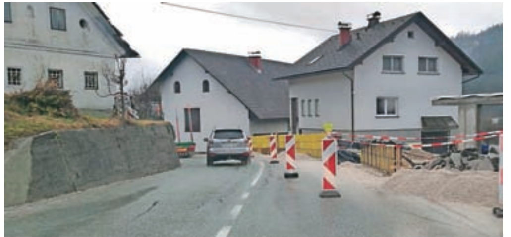
Gradnja prvega dela pločnika v Dolenji vasi mimo nekdanje Španove gostilne bo predvidoma končana še letos.

Za slabih 22 tisoč evrov so povečali sredstva za izgradnjo pločnika v Dolenji vasi, ki že poteka. Vrednost letošnjih del je 32 tisoč evrov, kar je manj, kot so načrtovali, zato so prihodnje leto predvideli nekaj več denarja (70 tisoč evrov).