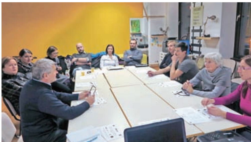
V inkubatorju in coworking centru Lokomotiva so v začetku decembra pripravili srečanje sodelovnih centrov Gorenjske.