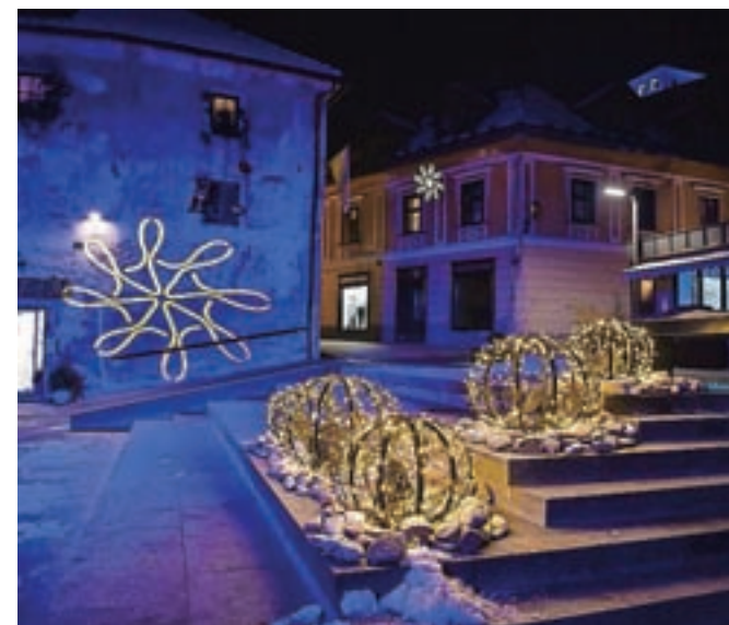
Svetlobni pozdrav Loki v snegu

Praznične luči so v Škofji Loki zažarele petega decembra, ko je otroke obiskal tudi prvi od dobrih decembrskih mož, Miklavž.