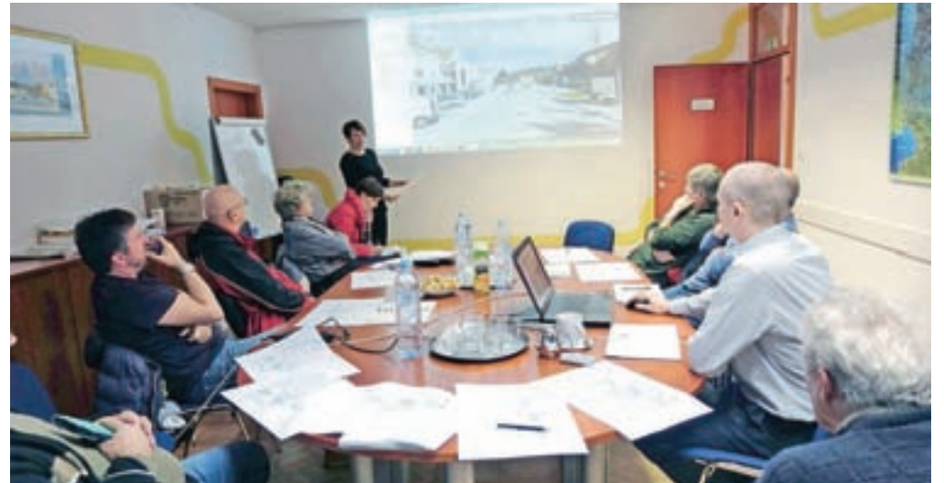
Preteklo sredo so pripravili prvo javno razpravo v sklopu izdelave Celostne prometne strategije Občine Žiri.