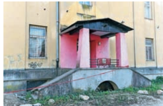
V zahodnem krilu komande nekdanje vojašnice načrtujejo medgeneracijski center.