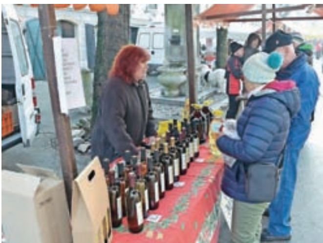
Druženje z vinarji je bilo že dvajseto po vrsti.