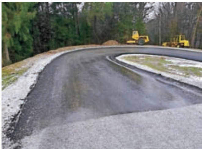
V Hotovlji so končali sanacijo po poplavih, ki so to dolino prizadele pred tremi leti.

kal na vrsto, v poplavih pa je bil popolnoma uničen. »Gre za odsek Hotovlja–Drnov-