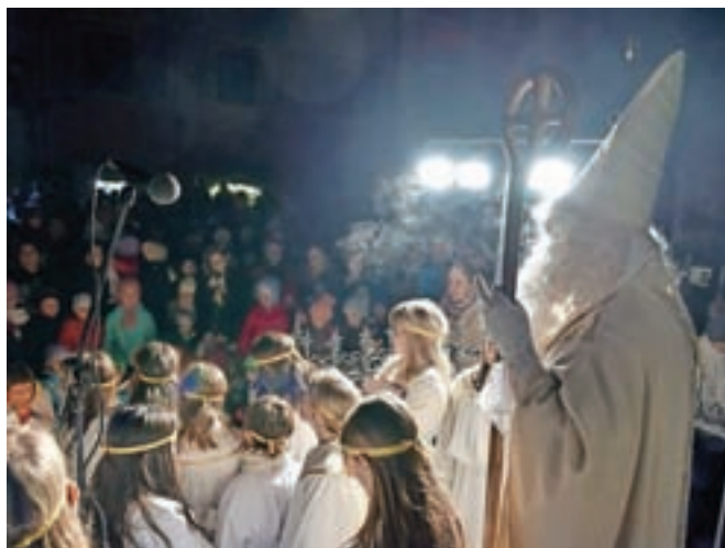
Otroke je obiskal Miklavž, prvi od treh decembrskih dobrih mož.