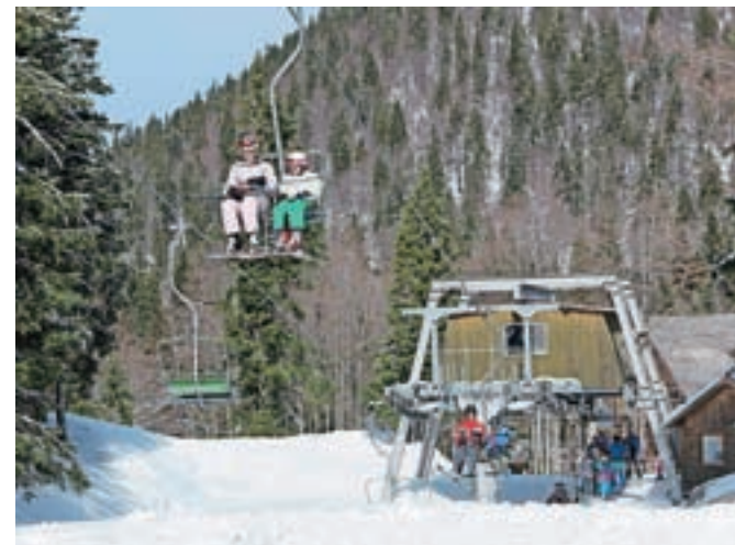
Smučišče na Soriški planini naj bi od 22. decembra obratovalo neprekinjeno.

Na Soriški planini so pred dobrim letom tudi začeli graditi lesen hotel s tridesetimi ležišči. Dela potekajo po načrtih, ta čas v notranosti objekta. Hotel, ki naj bi stal dobre pol milijona evrov, naj bi odprli prihodnje leto. Z zasedenostjo kapacitet ob prihajajočih božično-novoletnih praznikih so lahko zadovoljni. "Večinoma so vse kapacitete v okolici, vključno z njihovo Brunarico, polno zasedene od 27. decembra, do takrat se pa še najde kakšna soba," je razložila. O prihodnjih načrtih je povedala, da si želijo predvsem izboljšati letno in zimsko ponudbo za obiskovalce: "Osredotočili se bomo na razvoj drugih zimskih aktivnosti – poleg smučanja, poleti pa na ureditev pohodnih in kolesarskih poti ter ureditev Rapalske meje. Poskusili bomo pripraviti celostno poletno destinacijo. Želimo pa si tudi urejene prometne infrastrukture z vseh treh strani."