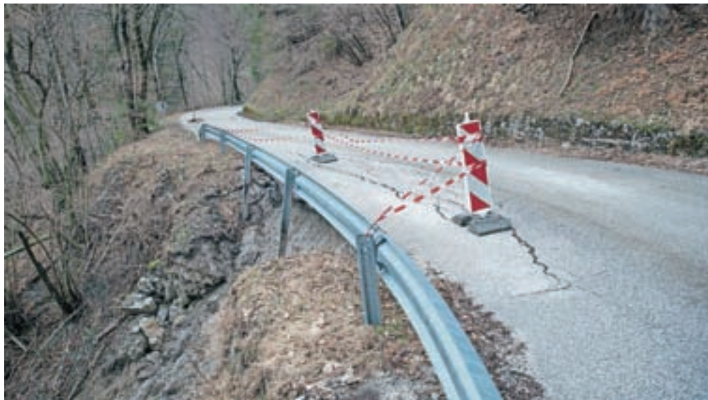
Na cesti Sorica–Petrovo Brdo bodo sanirali več usadov, zato bo predvidoma do konca oktobra zaprta.

Cesta čez Petrovo Brdo je sicer v preteklih letih večkrat služila kot uradni ob-