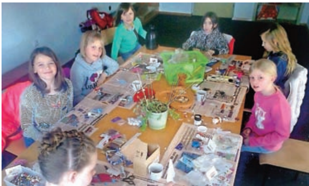
Dekleta so si sama izdelala nakit. / FOTO: ARHIV ORGANIZATORJA

Predvsem za delavnico Lego izziv je bilo veliko zanimanja, a je odpadla zaradi prepoznih prijav. Omenjena delavnica je namenjena otrokom od treh let naprej, pri čemer se otroci ob igri s kockami sprostitjo, se veselijo ter postanejo inovativni, ustvarjalni in sproščeni. Med prvomajskimi počitnicami bodo ponovili tudi delavnico Lego robotika, ki je namenjena otrokom od šestega leta dalje. Gre za na-