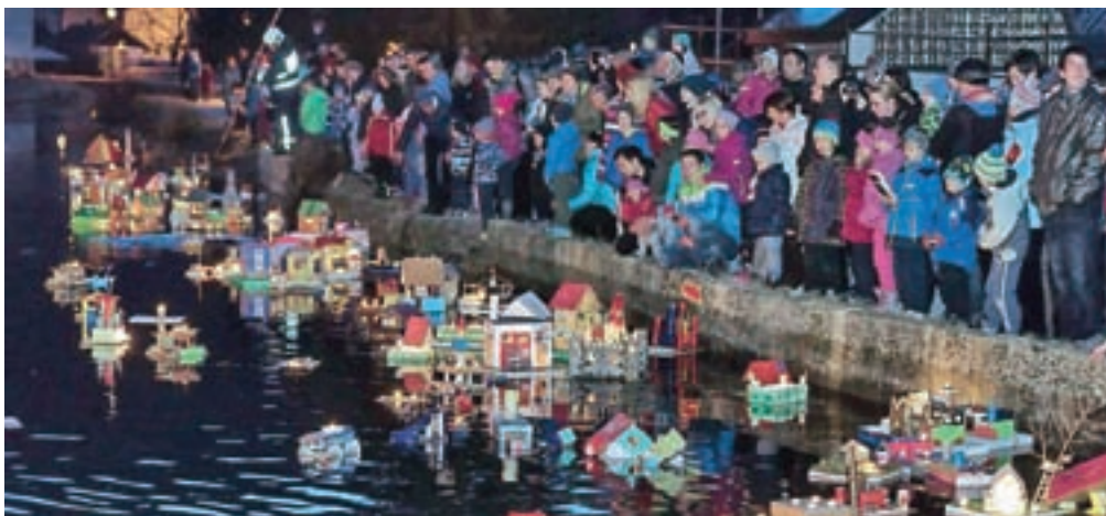
Bajer v Plnadi je razsvetlilo okoli 240 gregorčkov.

časno umiril. Prireditev je po oceni organizatorjev privabila okoli 400 obiskovalcev, tako domačinov kot prišlekov, bajer v Plnadi pa je