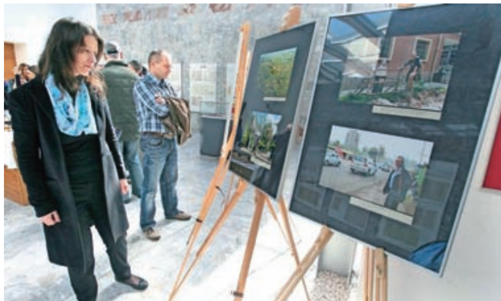
Razstava fotografij, ki so jih trije škofjeloški udeleženci posneli decembra lani v Adis Abebi, kjer je zasedal medvladni odbor Unesca.