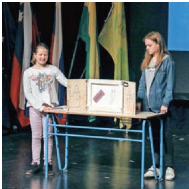
Učenci z nakelske šole sta nastopili s kamiši bajem, priročnim gledališčem.

Na podlagi 12. člena Odloka o podeljevanju priznanj Občine Škofja Loka (Uradno glasilo slovenskih občin, št. 3/2017) Komisija za mandatna vprašanja, volitve in imenovanja Občinskega sveta Občine Škofja Loka