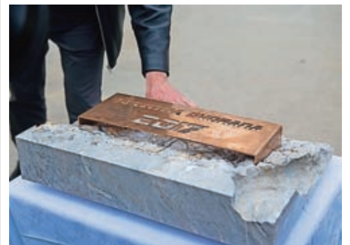
Pretekli torek so položili temeljni kamen za novo dvorano v Gorenji vasi.