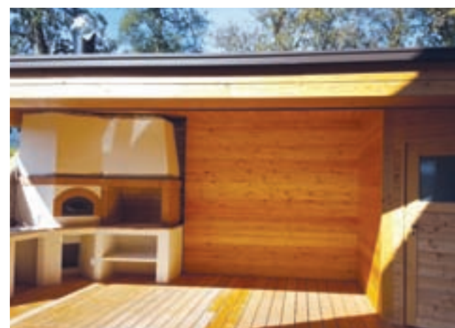
Mobilna hiša z vrtnim kaminom in savno

Skeletna gradnja zunanjih in notranjih sten je kombinirana z lesom in železom. Zunanja obloga je iz dvojne OSB-plošče debeline 12 mm, parapropustne folije in lesene fasade. Notranja obloga pa je iz OSB- in mavčne plošče debeline 12 mm. Izolirana je s kameno volno. Streha je enokapnica iz železne in lesene konstrukcije. V kopalnici so tla položena s PVC-jem (dimljen hrast), kuhinja in sobi pa sta opremljeni s parketom Jaso (hrast). Okna in vrata so iz lesa, ki ga kupec sam izbere (smreka, mace-merita in spalni prostor).