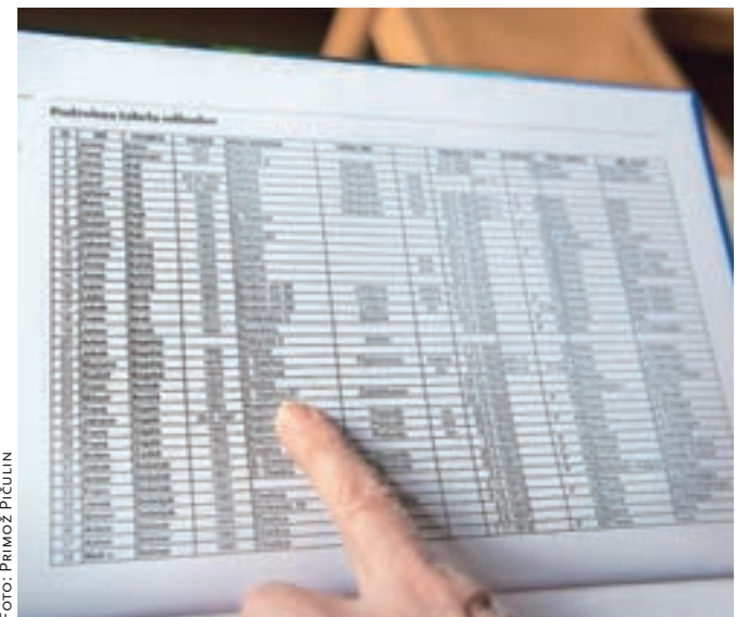
V knjigi so med drugim popisali več kot dvesto izseljencev.

vedanje, kaj dobrega nudi brezplačno vsakomur po teh hribovih in dolinah. Že v prejšnji knjigi so se posvetili društveni dejavnosti v kraju, zato so jo tokrat opisali le od