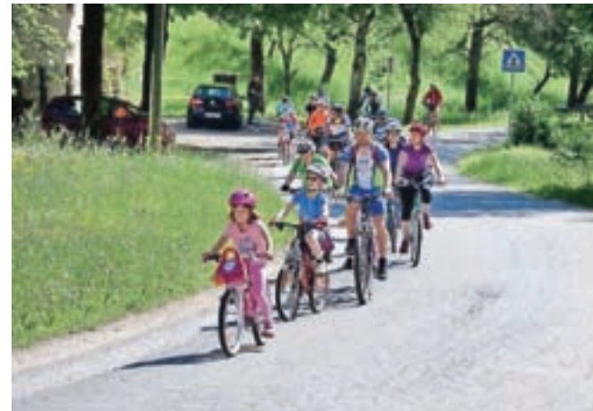
Hotaveljska grča je z zanimivimi aktivnostmi primerna za vse generacije.

Pri Športnem društvu Marmor Hotavlje tudi letos pripravljajo bogat program prireditev.