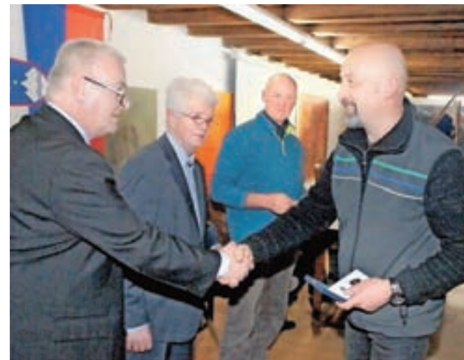
Na zboru so podelili priznanja udeležencem vojne za Slovenijo 1991.

Vse leto so skrbeli za informiranje članov, predvsem s področja dodatnega zdravstvenega zavarovanja. Uspel jim je tudi načrt povečanja članstva: lani v začetku leta je združenje štelo 103 člane, konec leta jih je bilo že 114 članov. Jereb je poudaril dobro sodelovanje