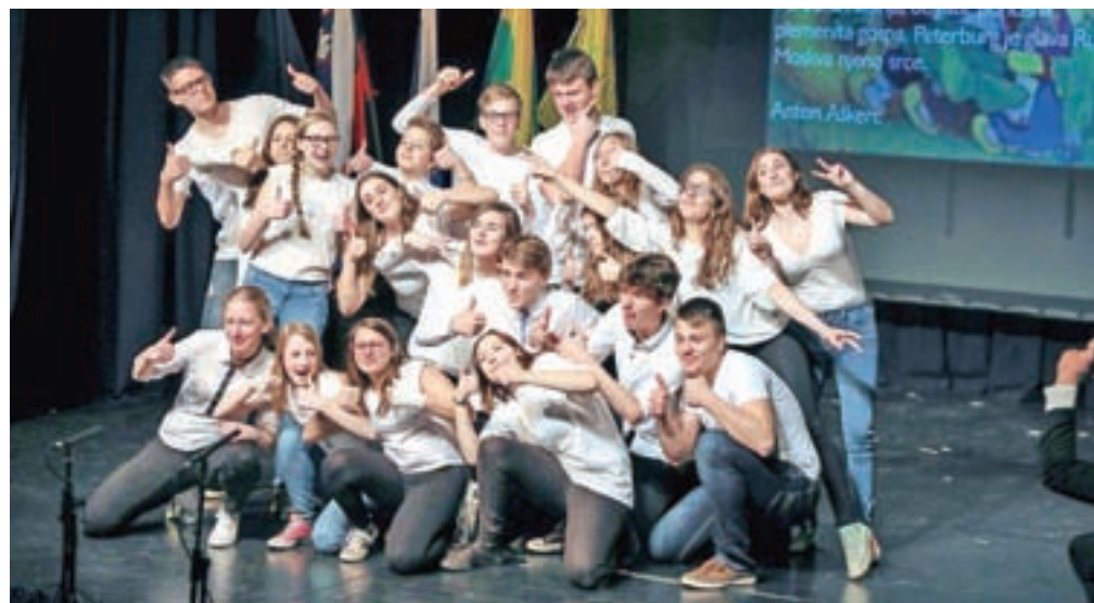
Gimnazijska impro skupina O.Sti J.Arej je uprizorila zgodbo o repi.