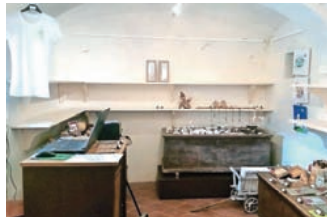
Trgovino v Šubičevi hiši bodo nadgradili.

V Šubičevi hiši so se lotili nadgradnje prodajalne z izdelki in spominki tamkajšnjih umetnikov in mojstrov rokodelcev.