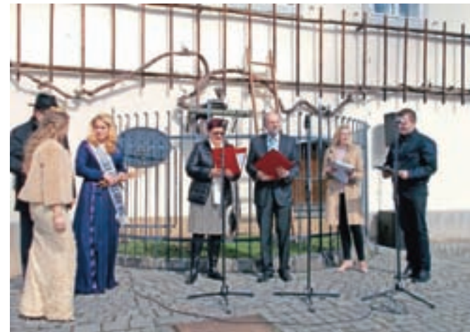
Marca so ob slovesnem rezu najstarejše trte na mariborskem Lentu njen cepič podarili tudi Občini Škofja Loka.