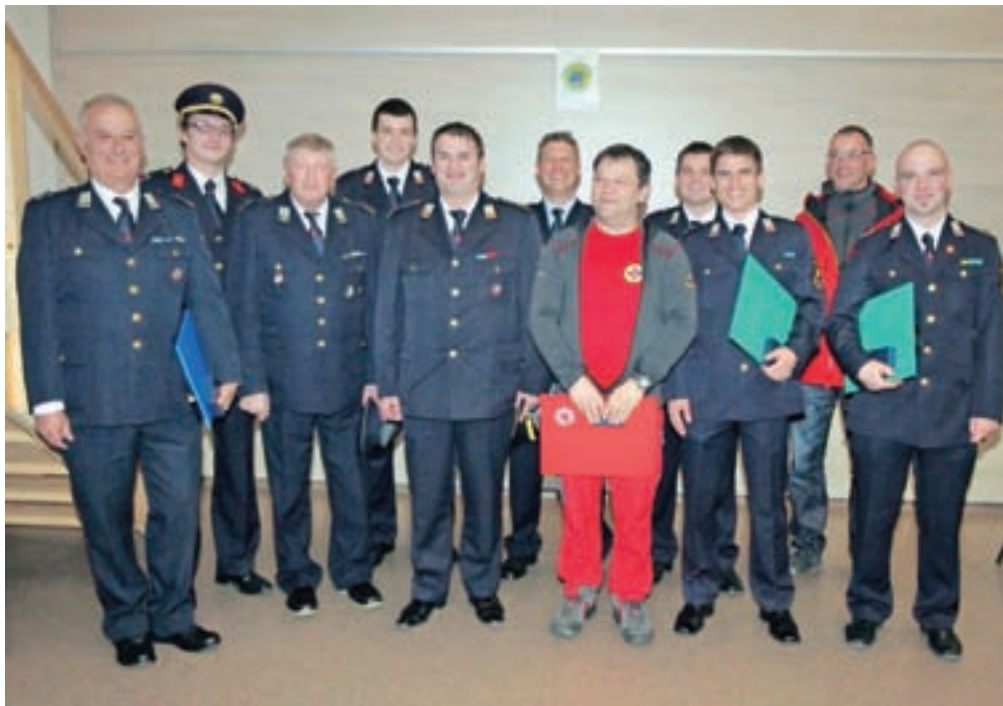
Letošnji prejemniki priznanj Civilne zaščite s škofjeloškega območja

»Sistem, ki temelji na medsebojnem sodelovanju prostovoljnih in poklicnih reše-