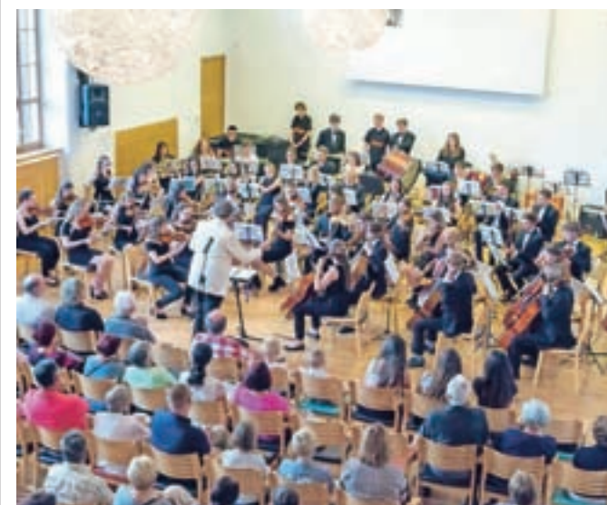
Kulturno dogajanje ob desetletnici mednarodnega sodelovanja so s koncertom sklenili mladi britanski glasbeniki iz Brightona in Hova.