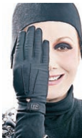
Hrvaška glasbena diva Josipa Lisac