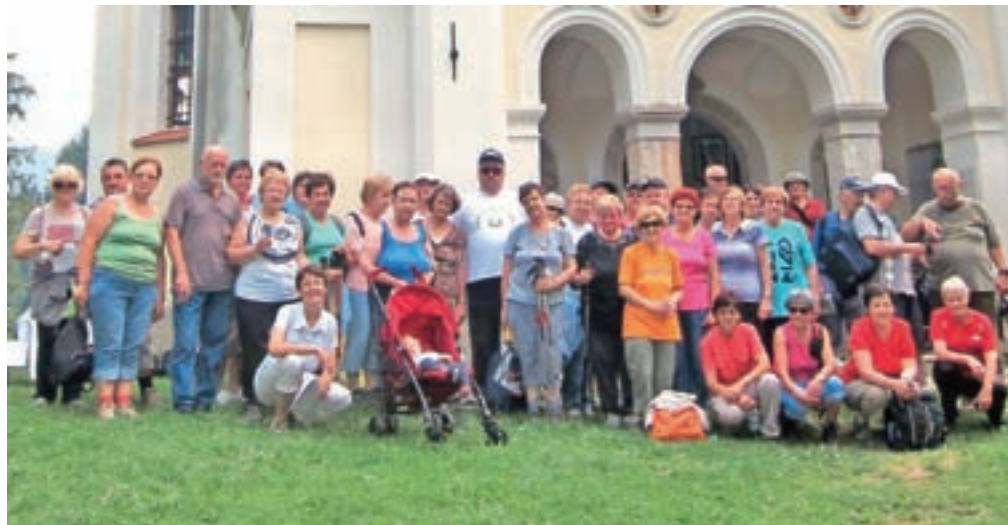
Pohodniki pri cerkvi Loretske Matere Božje