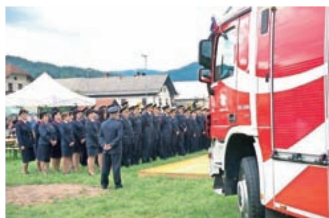
V PGD Gorenja vas so sredi julija tudi uradno prevzeli novo pridobitev, gasilsko vozilo GVC-24/60.

letih spet pripeljali v domačo garažo. A čeprav veljajo za eno izmed najbolj opremljenih gasilskih enot v občini, se že vrsto let stiskajo v dveh kletnih garažah združnega doma v Gorenji vasi, saj nimajo lastnega gasilskega doma. Starega so morali namreč zaradi dotrajanosti