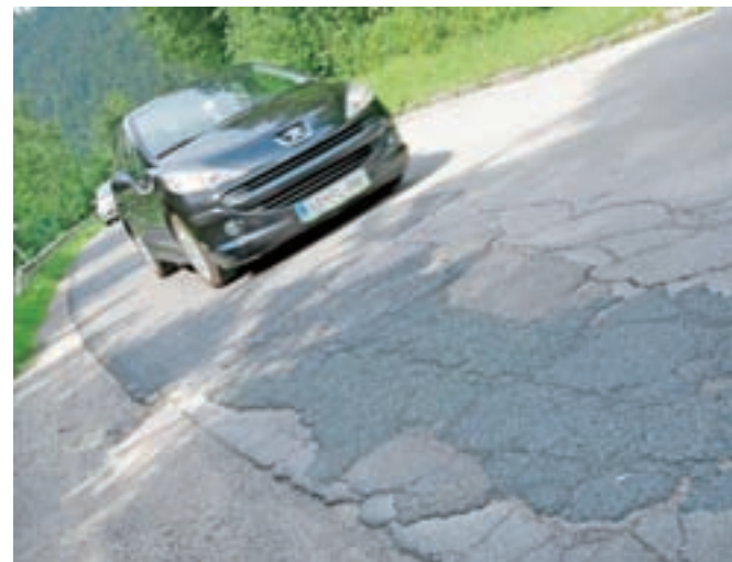
Eden izmed obnove potrebnih cestnih odsekov v žirovski občini, ki čaka na izpolnitev obljub oziroma načrtov direkcije za infrastrukturo

Obvoznico mimo Žirov, ki bo potekala ob Poljanski Sori v dolžini 4,5 kilometra, bodo gradili v treh fazah, so pojasnili pri direkciji za infrastrukturo. V prvi fazi načrt predvideva ureditev odseka od mosta pri Logatcu do novega uvoza za šolo, nadaljevali pa bodo preko industrijske cone do potoka Rakulk. V zadnji fazi so med štirimi različicami izbrali najugodnejšo, v okviru katere bodo novo obvoznico cesto priključili na obstoječo regionalno cesto proti Škofji Loki.