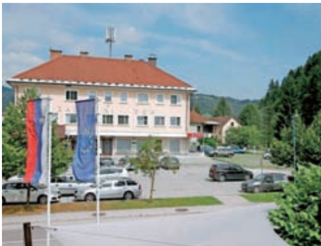
Sedanja podoba središča Žirov ...

Predstavljene rešitve po besedah župana Janeza Žaklja v največji možni meri upoštevajo ugotovitve z arhitekturnih delavnic, ki so jih izvedli pred štirimi leti na temo ureditve centra Žirov in gradnje Medgeneracijskega središča. Že takrat so ugotavljali, da gre na tem območju za precej neugodne prostorske danosti in številne omejitve, razen tega prostor niti nima mestne identitete niti pravega mestnega trga. Pri načrtovanju so upoštevali potrebe in želje Žirovcev, ki so med drugim izrazili željo po ureje-