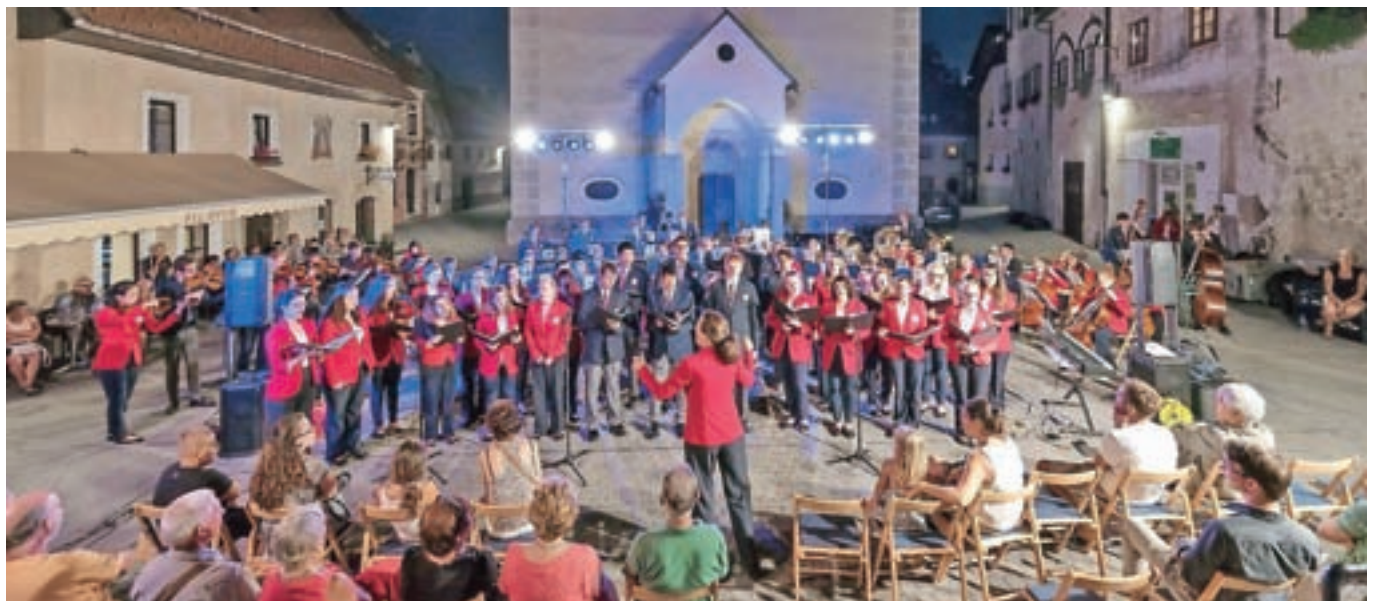
Nastop ameriških glasbenikov na Cankarjevem trgu

več kot štirideset let in izvajajo različne glasbene zvrsti. Tokratna zasedba bo na evropski turneji nastopila še v Avstriji, Nemčiji in Italiji. Poldrugo uro trajajoči koncert je privabil veliko domačinov in obiskovalcev, ta odmevni kulturni dogodek na prostem pa je tako napovedal pravi okus loškega polelja, ki bo še posebno intenzivno zaživel v drugi polovici avgusta z že tradicionalnim festivalom Pisana Loka.