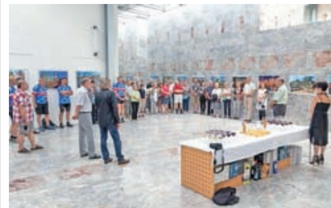
Z odprtja skupne razstave škofjeloških in taborskih fotografov