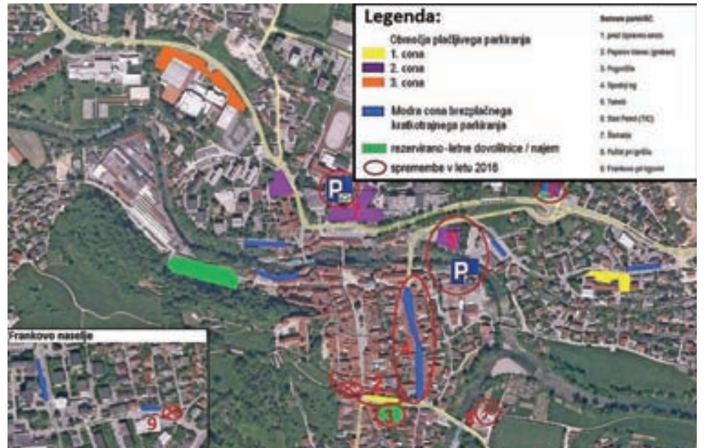
Nov parkirni režim v mestnem središču

Potem bo to območje dobilo povsem nov značaj, zato po prenovi tam ne bo več parkirišča. Pred upravno enoto bo urejeno parkirno mesto za invalida in kolesarje, za motorna vozila pa bo urejeno parkiranje na Pepetovem klancu. Novo plačljivo parkirišče bodo jeseni vzpostavili na zgornji polovici Pepetovega klanca (na Grabnu), kjer bo na voljo 16 plačljivih parkirnih mest, veljal pa bo enak parkirni režim kot je sedaj pri upravni enoti (1. cona: prvih 30 minut brezplačno parkiranje, nadaljnja ura je 1 evro). Zato bomo že to jesen plačljivo parkirišče z enakim režimom, kot je doslej veljal pred upravno enoto uredil na zgornji polovici Pepetovega klanca (na Grabnu), kjer bo na voljo 16 plačljivih parkirnih mest, veljal bo torej povsem enak parkirni režim kot je sedaj pri upravni enoti (1. cona: prvih 30 minut brezplačno parkiranje, nadaljnja ura je 1 evro). Na spodnji polovici Pepetovega klanca bo ostal v veljavi dose-