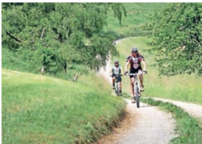
Letošnji Žirovski kolesarski krog so izvedli že petnajsto leto.