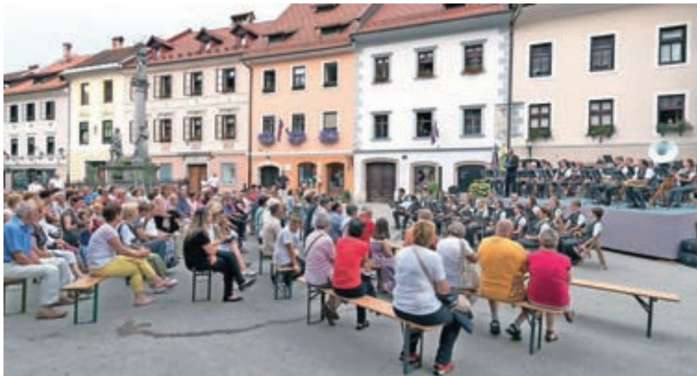
Ob dnevu državnosti v Škofji Loki