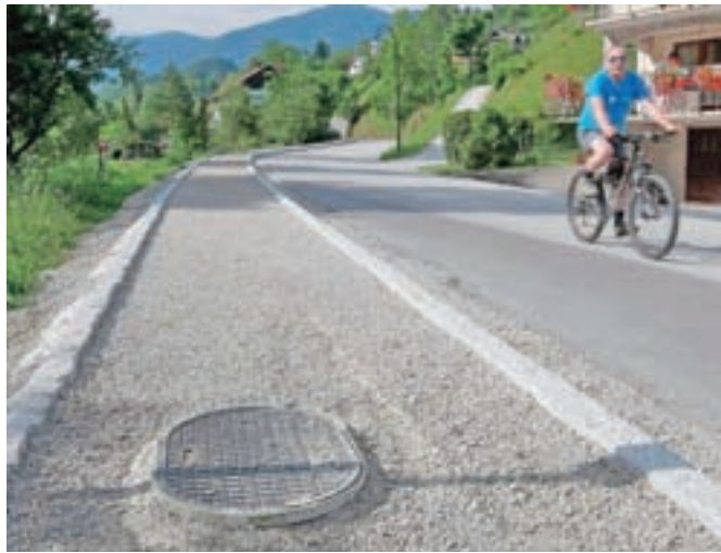
Na Hotavljah gradijo pločnike.