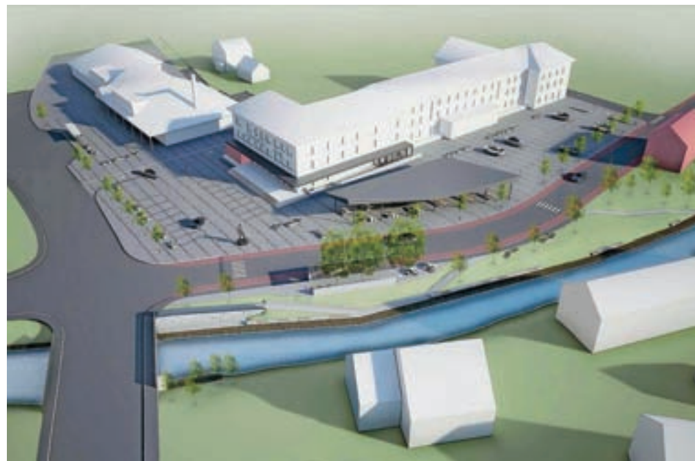
... in predvidena nova podoba.

Pri načrtovanju ureditve središča so upoštevali potrebe in želje Žirovcev.