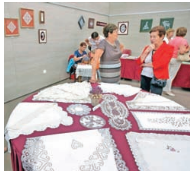
Na razstavi v kulturnem domu so bile na ogled tudi mojstrovine pokojnih klekljaric.

čim predstavila zgodovino Čipkarskih dnevov, ki je čipkarska prireditve z najdaljšo neprekinjeno tradicijo v Sloveniji. Omeniti velja tudi, da so predstavniki turističnega društva in čipkarske zadrug že pred 54 leti zasnovali program, ki je osnova prireditve še danes. Že na prvi prireditvi, tedaj sicer enodnevni, so namreč pripravili čipkarsko razstavo, klekljarsko tekmovanje, spreved, veselico in celo nogometno tekmo.