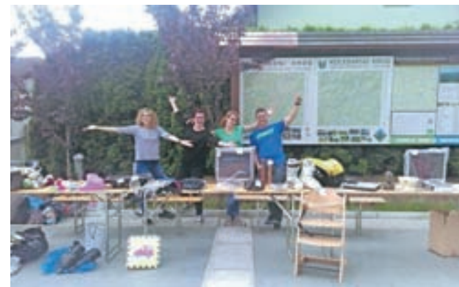
V Gorenji vasi se vsako drugo soboto v mesecu odvija boljši sejem.