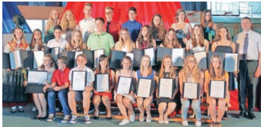
Osnovno šolo Železniki je letos zapustilo za cel razred odličnjakov.

vami,« je župan nagovoril odličnjake in jim zaželel veliko uspeha tudi v prihodnje.