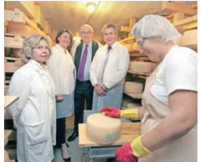
Evropskemu komisarju Philu Hoganu so v Gorenji vasi predstavili kmetijo Pustotnik, ki se ukvarja s proizvodnjo sirov in drugih mlečnih izdelkov.

Komisarju Hoganu se je v Gorenji vasi pridružila tudi evropska komisarka za promet Violeta Bulc in skupaj sta predstavila tudi nove pristope pri spodbujanju traj-