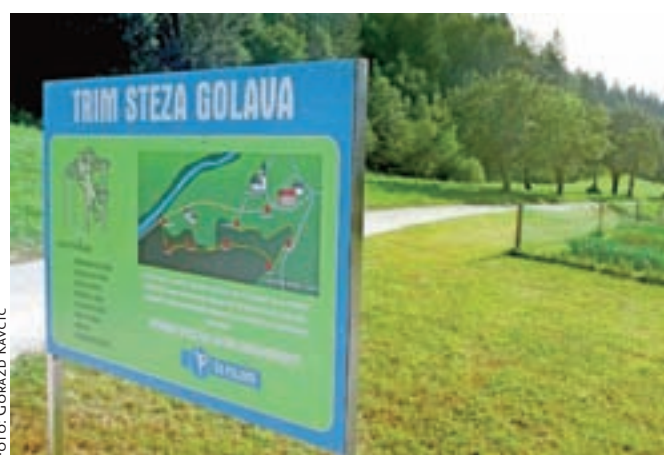
Na Golavi so uredili trim stezo z osmimi postajami.

Trim steza, poudarjajo v društvu, ponuja zdravo zabavo za vsakogar. Na trim stezi tečemo, skačemo, se vzpenjamo, dvigujemo bremena, se urimo v gibčnosti in spretnosti, pridobivamo ravnotežje ... Še zlasti potrebne in koristne so v današnjem času vaje, ki nas pripravijo za ustrezno ravnanje v nepredvidljivih situacijah, saj krepijo in ohranjajo naše psihofizične in motorične sposobnosti, so razložili. Na vseh gimnastičnih orodjih mora vadeči premagovati silo teže lastnega telesa, zato je to tudi najbolj naraven način pridobivanja moči. "Trim steze so oblikovane tako, da jih lahko uporabljamo brez predhodnega znanja, nadzora ali vodenja, čeprav se je koristno o vajah, njihovi izvedbi in priporočilih posvetovati s strokovnjaki," še svetujejo v Športnem društvu Poljane.