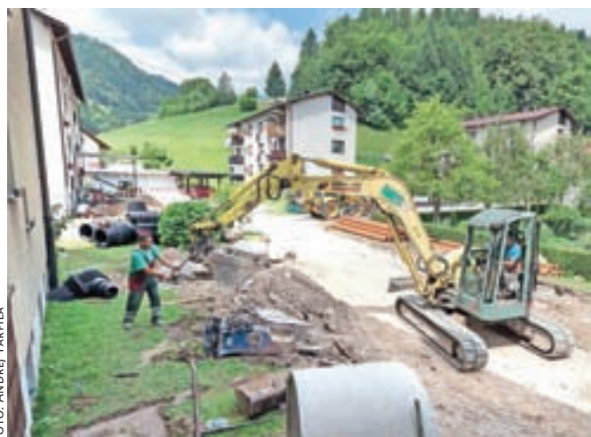
Na Kresu ta čas obnavljajo vodovod in kanalizacijo.