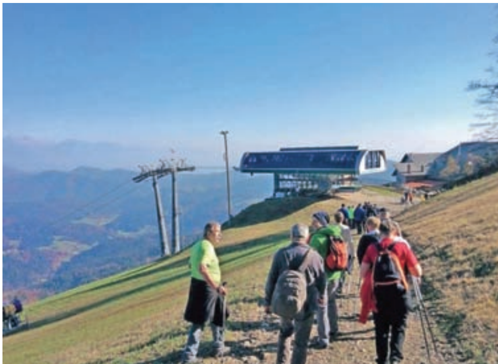
Utrinek z dosedanjih pohodov po Starem vrhu

Naslednji letošnji organiziran pohod bo 7. avgusta ob dnevu oglarjev, in sicer po pohodniški poti Med gorami. Omenjena pot je nekoliko zahtevnejša, opozarjajo v TD Stari vrh, prehoditi pa jo je mogoče v štirih do šestih urah. Izhodišče je na parkirišču Grebljica na Starem vrhu, od koder pot vodi mimo prizorišča Dneva oglarjev na gozdno pot, kjer sledi rahel spust proti Čete-