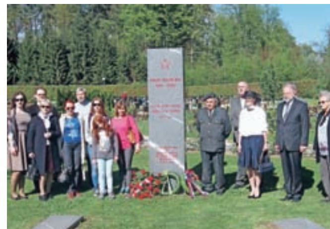
Pred dnevom upora poklon osvoboditeljem