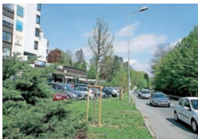
Na novo zasajen lipov drevored ob Kidričevi cesti

smreke ob otroškem igrišču v Frankovem naselju, enako tudi nevarne in poškodovane smreke ob vrtcu Pedenjped, odstranili pa bomo tudi starejši borovec, ki zavira rast mlajše bukke v Frankovem naselju ob otroškem igrišču. Novo zasaditev pa predvidevamo na območju Podna (na severni strani proti Prifarškemu potoku, kjer so bili predhodno odstranjeni iglavci) in na območju otroškega igrišča v Frankovem naselju, v srednjeročnem načrtu pa je tudi zasaditev novega drevoreda na Pepetovem klancu. Trudimo se, da je vsako leto pregledanih čim več dreves in da pravilno ter strokovno ukrepamo. Vseskozi pa smo odprti tudi za pobude občanov, ki jih pristojni občinski službi lahko posredujejo na elektronski naslov: obcina@skofjaloka.si ali na telefon (04) 51 12 354."