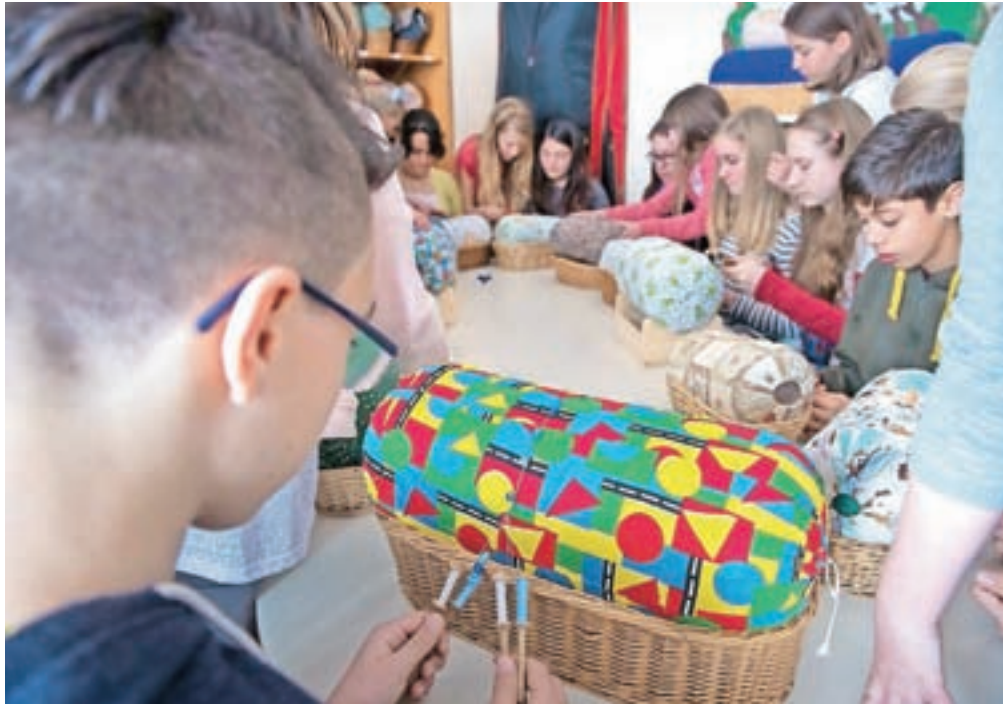
Učenci, ki so jih v žirovski šoli gostili v okviru projekta Erasmus+, so spoznali tudi osnove klekljanja.

Za tuje učence in učitelje so sicer v žirovski šoli pripravili pester program, v okviru katerega so jim predstavili svojo šolo in svoj kraj, popeljali pa so jih tudi na ogled prestolnice, Postojnske jame ter Blejskega gradu in otoka, na katerega so se peljali z leseno pletno. Ves program so namreč zastavili tako, da so vedno našli tudi povezavo z