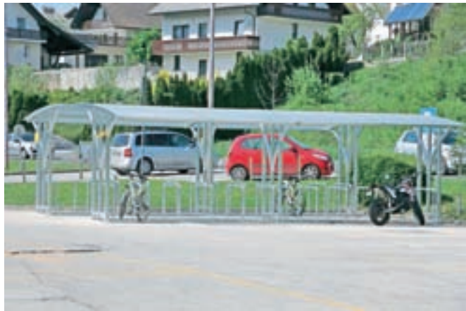
V kolesarnici bodo kolesa dijakov in drugih na suhem in varnem.