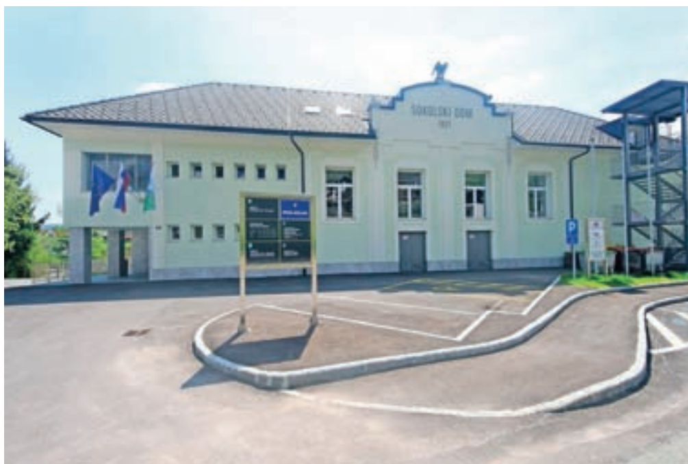
Odprtje prenovljenega Sokolskega doma bodo zaznamovali s celodnevni kulturnim dogodkom.