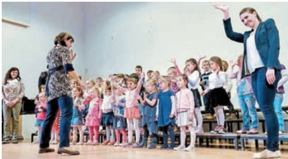
Pevski zbor Lubnik na koncertni večer vedno povabi tudi najmlajše.