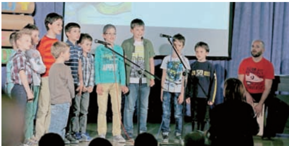
Zbor dečkov je zapel Smolarjevo Jaz ne grem v šolo.