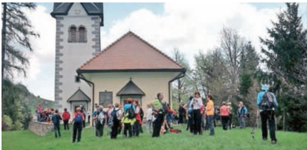
Pohoda ob odprtju pohodniške poti okrog občine se je udeležilo sto dvajset pohodnikov.

da je za celoten krog potrebnih dobrih trideset ur hoje," je razložil župan. Tako kot pri kolesarskem krogu bodo tudi pohodniki za vzpodbudo za zdrav način življenja ob koncu prehojene poti prejeli praktično nagrado. Letos bo to pohodna majica. Ob odprtju pohodniške poti so udeleženci pohoda prehodili prvi del poti, ki pelje iz Poljan na Gabrško goro. Ob povratku so si ogledali cerkev sv. Volbenka, druženje pa končali na Visokem, kjer se je takrat odvijala letošnja Salamijada.