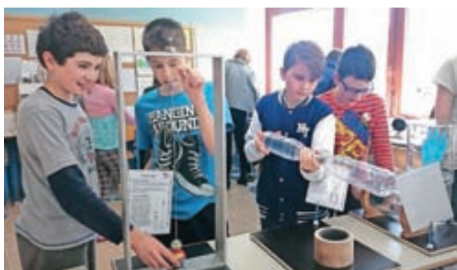
Šolarji z OŠ Ivana Groharja so eksperimentalirali na več kot petdesetih mobilnih eksperimentih.