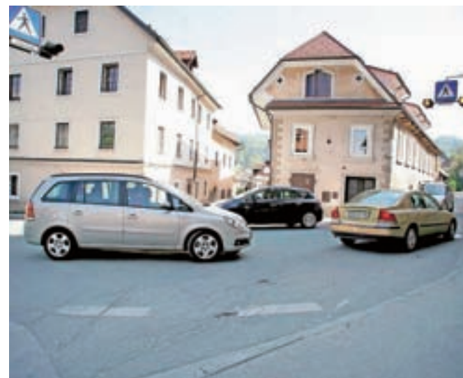
Promet po cesti od starega Petrola do Zminca bo urejal nov prometni režim.