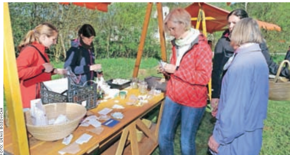
Na Kržišnikovem vrtu so četrto leto zapored pripravili izmenjavo semen in sadik.