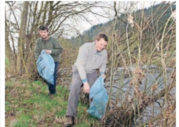
Pri čistilni akciji so se osredotočili predvsem na čiščenje brežin vodotokov skozi Žiri.

Alpina v preteklosti odlagališče odpadkov. "Hudourniški potok zdaj to spira in nosi proti Sori. Sčasoma bo to postalo še večji problem," opozarja Mahnič. Z obžalovanjem tudi ugotavlja, da se v naravi znova pojavljajo črna odlagališča, ki so jih odkrili na dveh lokacijah ob Sori. "Pred časom so prepovedali odlaganje odpadkov v Pustotniku in gradbeni odpadki se zdaj spet znajdejo v naravi." Zato so tovrstne čistilne akcije še vedno zelo dobrodošle, čeprav Mahnič upa, da se bodo razmere na tem področju popravile do te mere, da v prihodnje ne bodo več potrebne.