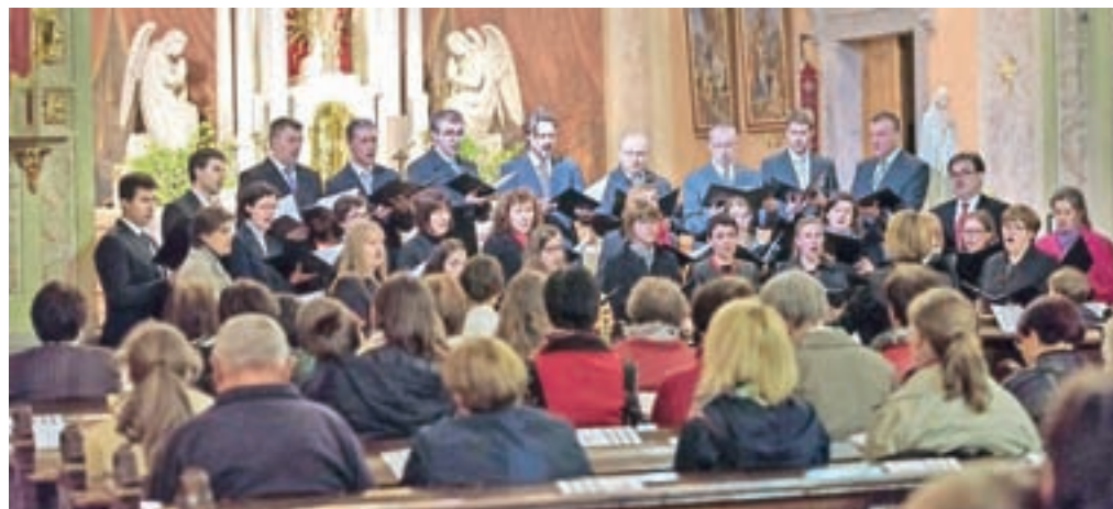
Mešani pevski zbor župnije Železniki je na jubilejnim koncertu izvajal skladbe s častitljivo letnico in versko vsebino.