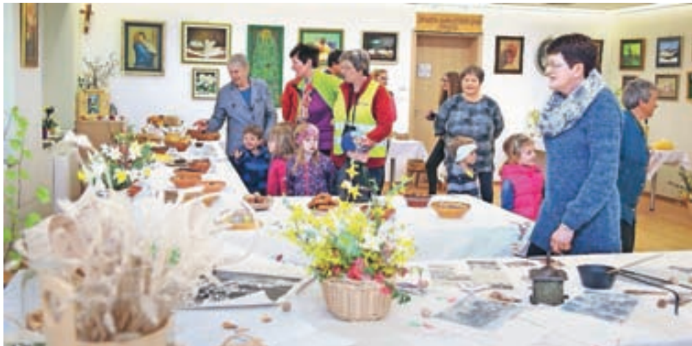
Ob obletnici društva so članice društva podeželskih žena Blegoš pripravile tudi razstavo Skozi čas.