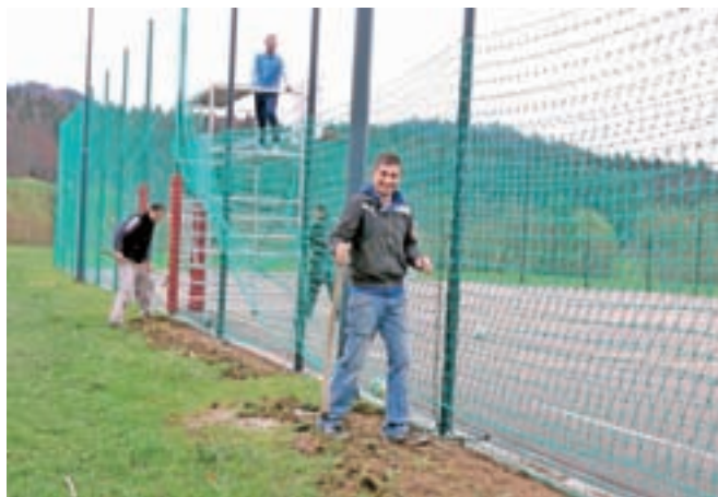
V Dolenji vasi so se letos osredotočili na urejanje okolice novega igrišča.

Železniki – Občina Železniki je skupaj s krajevnimi skupnostmi, vaškimi odbori in društvi v začetku aprila organizirala spomladansko akcijo čiščenja in urejanja okolja. Prostovoljci so v Železnikih in desetih okoliških krajih po podatkih Loške komunale skupaj zbrali 22 kubičnih metrov odpadkov. Od tega je bilo 1080 kilogramov mešanih komunalnih odpadkov, preostalo pa embalaža in kovine. "Količina odpadkov se zmanjšuje. Pred leti, še zlasti po poplavah, je bilo odpadkov v naravi več, sedaj pa jih je zaradi ekološke ozaveščenosti občanov in tradicionalnih čistilnih akcij vse manj," ugotavlja župan Anton Luznar. Tudi na območju Krajevne skupnosti (KS) Železniki po