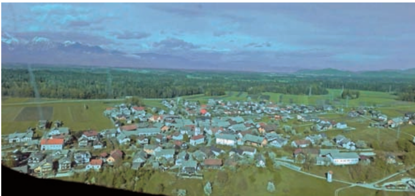
Občani letos doživljajo kar nekaj sprememb pri odmeri nadomestil za uporabo stavbnih zemljišč.

"Tako se pri izračunu NUSZ po novem upoštevajo podatki o površinah, pridobljenih iz uradne evidence, torej zemljiškega katastra, katastra stavb ali iz registra nepremičnin, ki jih za vse občine v državi enotno vodi Geodetska uprava RS. Za zazidana stavbna zemljišča (stanovanja in poslovni prostori) se površina določi v kvadratnih metrih, ki je: čista tlorisna površina stanovanja v večstanovanjskih objektih (celotna površina vseh zaprtih