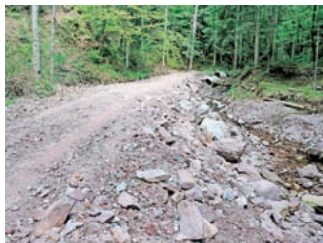
Država je zagotovila dodaten denar za obnovo gozdne ceste v Javornikovi grapi.