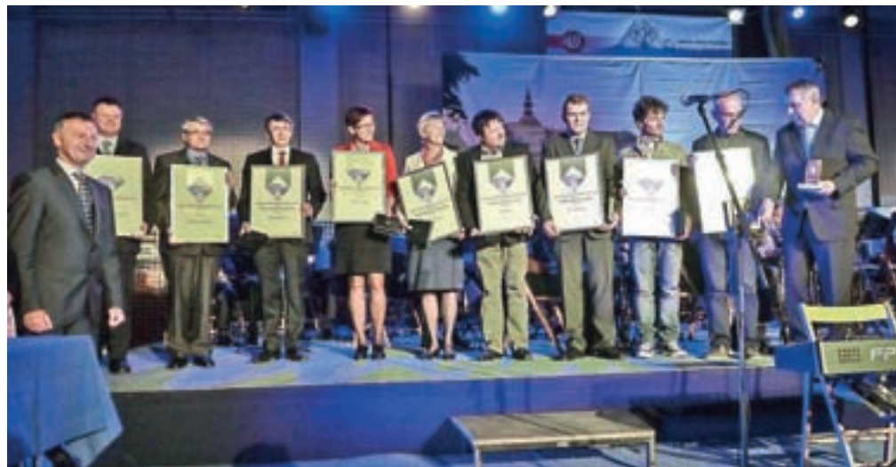
Dobitniki priznanj Območne obrtno-podjetniške zbornice Škofja Loka