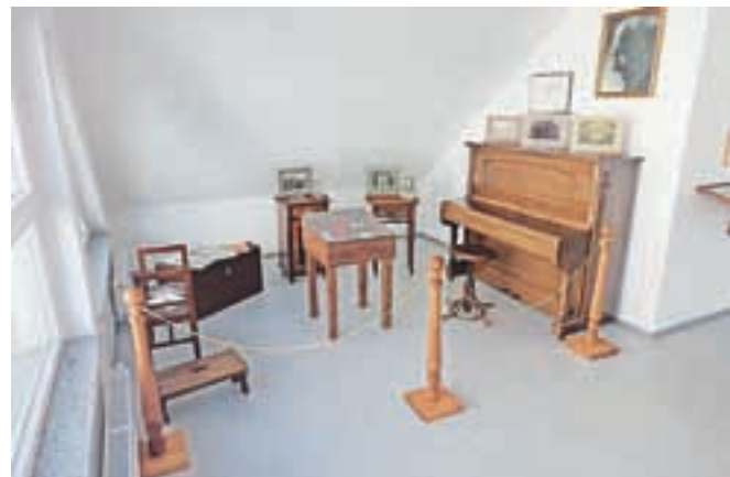
Med osebnimi predmeti je razstavljen tudi Jobstov klavir iz leta 1936.