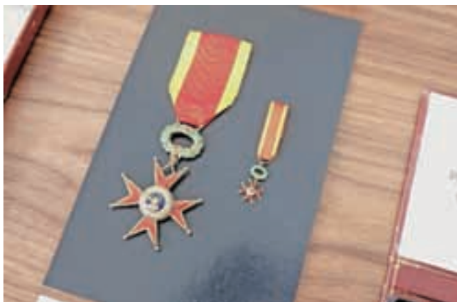
Red viteza Gregorija