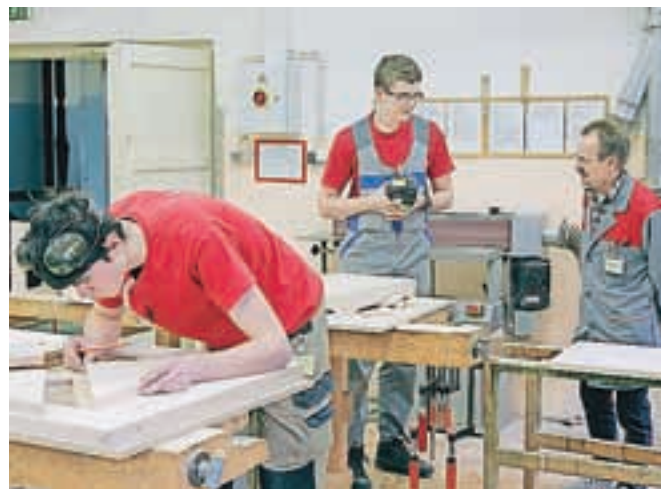
V Srednji šoli za lesarstvo so v januarju gostili Olimpijado poklicev v lesarstvu.

zagotovil, da se mu tekmovanje ni zdelo preveč zahtevno, saj ima kot dijak četrtega letnika že veliko izkušenj z obdelovanjem lesa, poznalo pa se je tudi, da je bilo za njim veliko vaje. "Sodnike sem verjetno prepričal s svojo natančnostjo," je ugibal. Veseli ga, da se je uspel dokazati na tem področju, na katerem bi v prihodnje rad nadaljeval šolanje. Verjame, da se mu bo udeležba na Evroskillsu štela tudi kot pomembna referenca pri kasnejšem iskanju zaposlitve. V sklopu tekmovanja so v šoli pripravili tudi dan odprtih vrat, na katerega so povabili osnovnošolce in njihove starše. Pripravili so predstavitev šole in njenih programov, učenci pa so si lahko ogledali še, kako poteka pouk, in sicer pri enem strokovnem predmetu in pri angleščini. Sočasno se je odvijal še sejem podjetij, na katerem se je predstavilo osem podjetij.