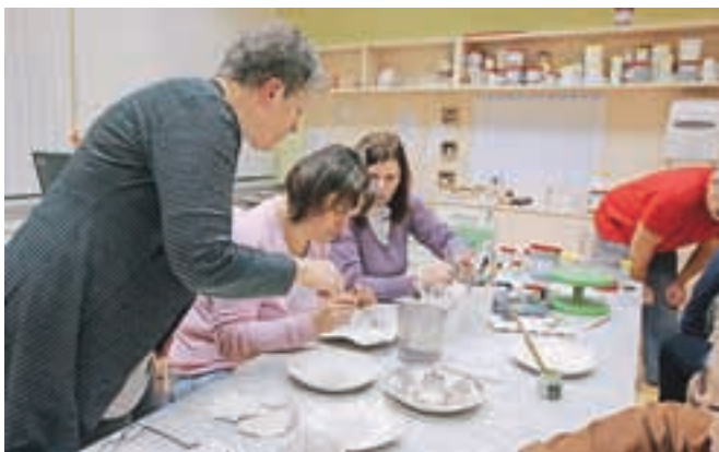
Udeleženci delavnic pri poslikavi in glaziranju glinenih izdelkov