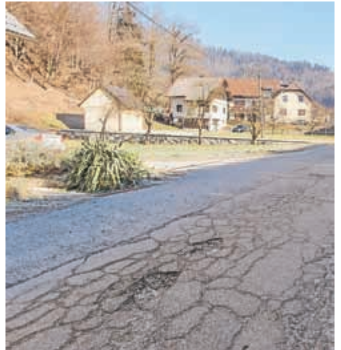
Največ investicijskih sredstev so v letošnjem proračunu namenili za obnovo in vzdrževanje cest.

Nadaljnje urejanje dvorca Visoko bo vredno 283 tisoč evrov, 205 tisoč evrov pa so zagotovili za dograditev krajših kanalizacijskih odsekov na območju Dolenje Dobre in Hotovlje ter hišnih priključkov na območju celotne občine. Za ureditev knjižnice v Gorenji vasi so namenili 63 tisoč evrov, za avtobusno postajo na Sovodnju 58 tisoč evrov in za pločnike na Hotavljah 50 tisoč evrov. Že v prvi polovici leta na občini pričakujejo tudi gradbeni dovoljenji za dve največji novopredvideni investiciji v prihodnjih letih, to sta gradnja telovadnice v Gorenji vasi in vodovoda v Lučinah. "Za obe investiciji imamo pripravljeno