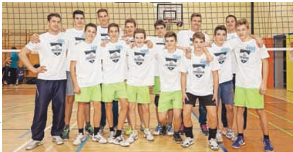
Škofjeloški odbojkarji na novi poti