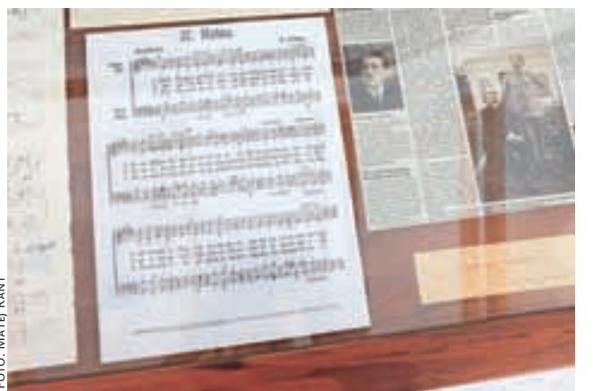
Jobstova prva natisnjena skladba z naslovom Mašna