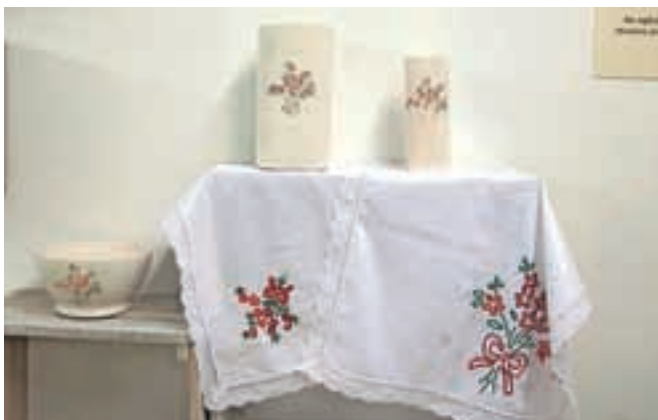
Z razstave v rokodelskem centru DUO