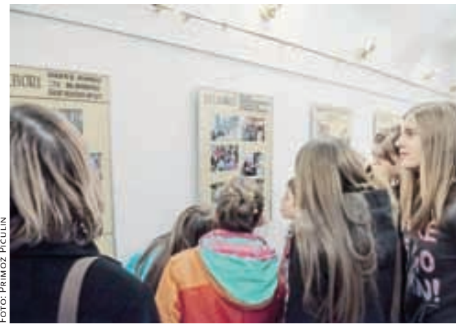
Razstava o delu sekcij je zanimiva tudi za mlade.