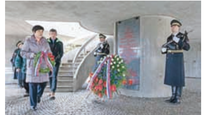
H kostnici pod spomenikom je položila venec tudi delegacija krajevne skupnosti Dražgoše.