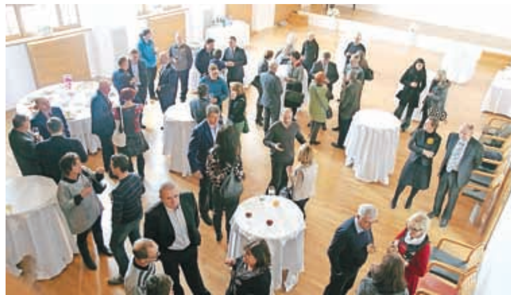
Predstavniki gospodarstva, javnih zavodov, medijev, društev, krajevnih skupnosti ... na županovem sprejemu

Občina je uspešna tudi na področju trajnostne mobilnosti in varnosti, aktivna je v ekološkem pogledu in v smislu energetske varčnosti. Lani so energetske sanirali vrsto javnih zgradb, za varčevanje z energijo in za manjši ogljični odtis pa se trudijo s spremljanjem porabe energentov. Vodje javnih zavodov, ki so vključeni v energetske menedžment, je župan na sprejemu obdaril z digitalnim prikazovalnikom temperature.