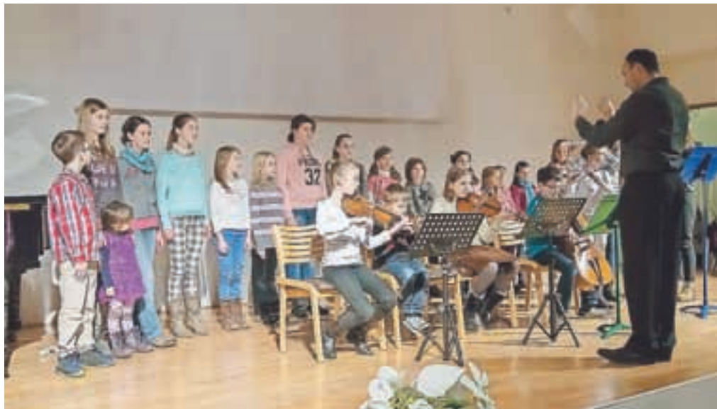
Na prireditvi je nastopil tudi otroški pevski zbor Iskrice.

sednika in enega od štirinajstih ustanovnih članov Vincencija Demšarja pa so na prireditvi razglasili za častnega člana društva.