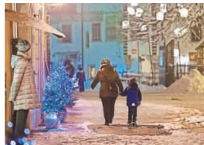
Beli december ni bil bel, šele januarски sneg je Loko obarval belo.