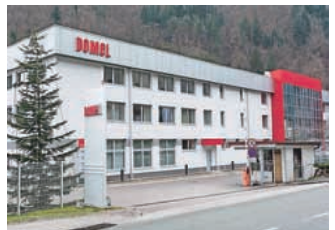
Domel je v prenovu poslovne stavbe vložil 1,1 milijona evrov.