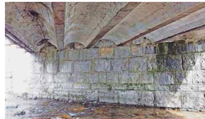
V Poljanah bodo celovito obnovili tudi most čez Ločivnico.