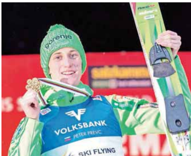
... in zlato medaljo za naslov svetovnega prvaka v poletih, ki jo je osvojil na Kulmu.