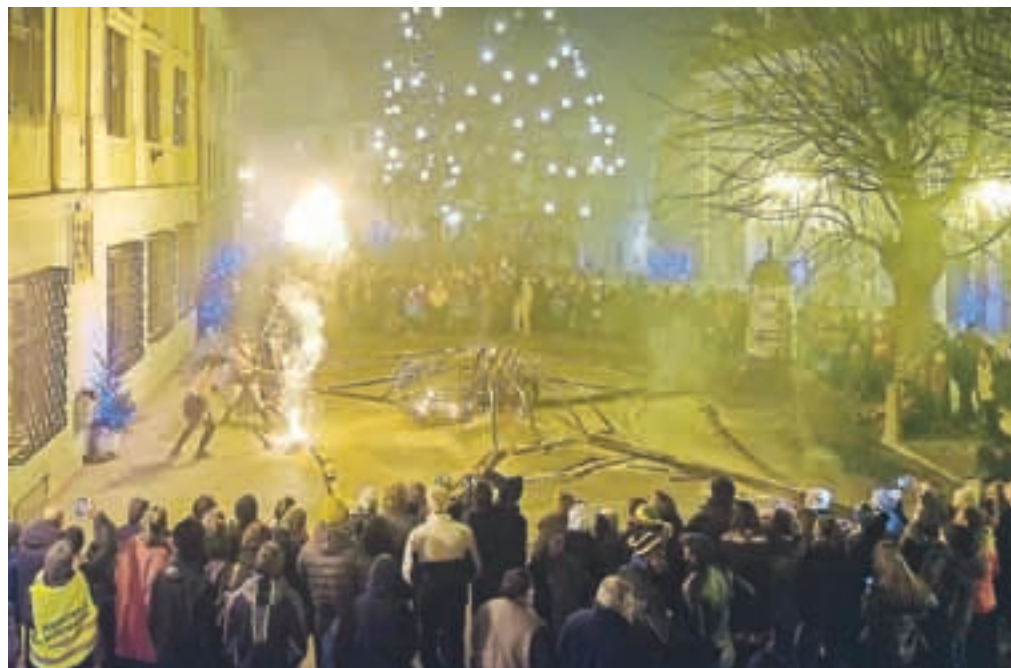
Ognjena predstava ob božičnem LUFTu