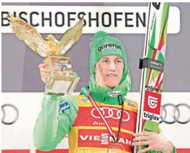
Peter Prevc v Bischofshofnu z zlatim orlom za skupno zmago na novoletni turneji ...

Po skupni zmagi na novoletni skakalni turneji je postal še svetovni prvak v poletih.