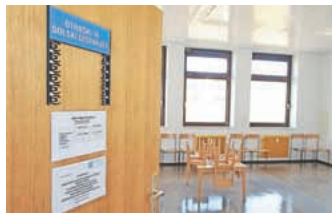
Preventivne preglede otrok bo pogodbeni pediater lahko opravljal v obstoječih prostorih pediatrične ambulante v Gorenji vasi.

podelitev koncesije za izvajanje pediatrične dejavnosti v mreži zdravstvene službe na območju občin Gorenja vas - Poljane in Žiri. Tega