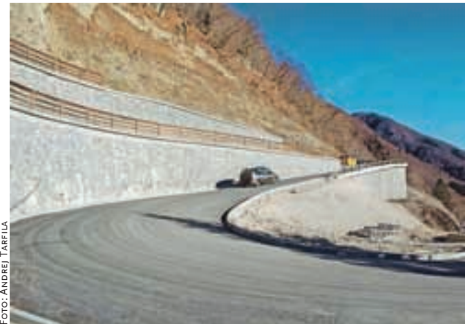
Zahtevna rekonstrukcija 600-metrskega odseka se bo končala spomladi, ko bodo položili še zaključni sloj asfalta.

Na direkciji za infrastrukturo pa že pripravljajo dokumentacijo za objavo razpisa za izvedbo del na naslednjem 610-metrskem odseku ceste, ki naj bi stala med 2 in 2,5 milijona evrov, za kar so po njihovih zagotovilih v proračunu sredstva že zagotovljena. Na direkciji predvidevajo, da bi z deli, če