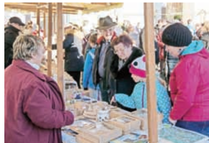
Prvi Štefanov sejem v Selcih je bil zelo dobro obiskan.