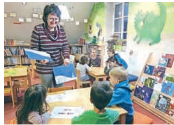
V okviru januarske ustvarjalne delavnice so otroci izdelovali ptičja gnezda in risali zimsko idilo.