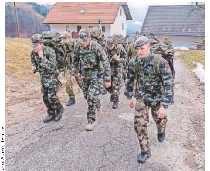
Med letošnjimi pohodniki v Dražgoše so bili tudi vojaki.