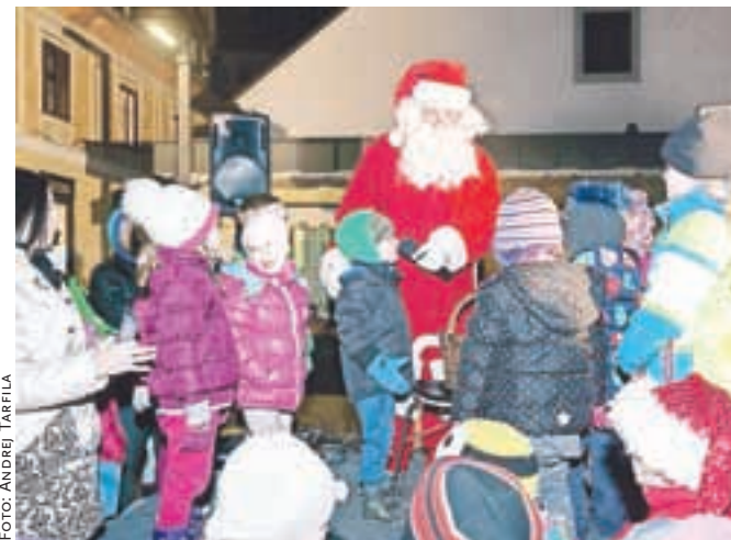
Otroke so obiskali vsi trije dobri možje, med njimi Božiček.