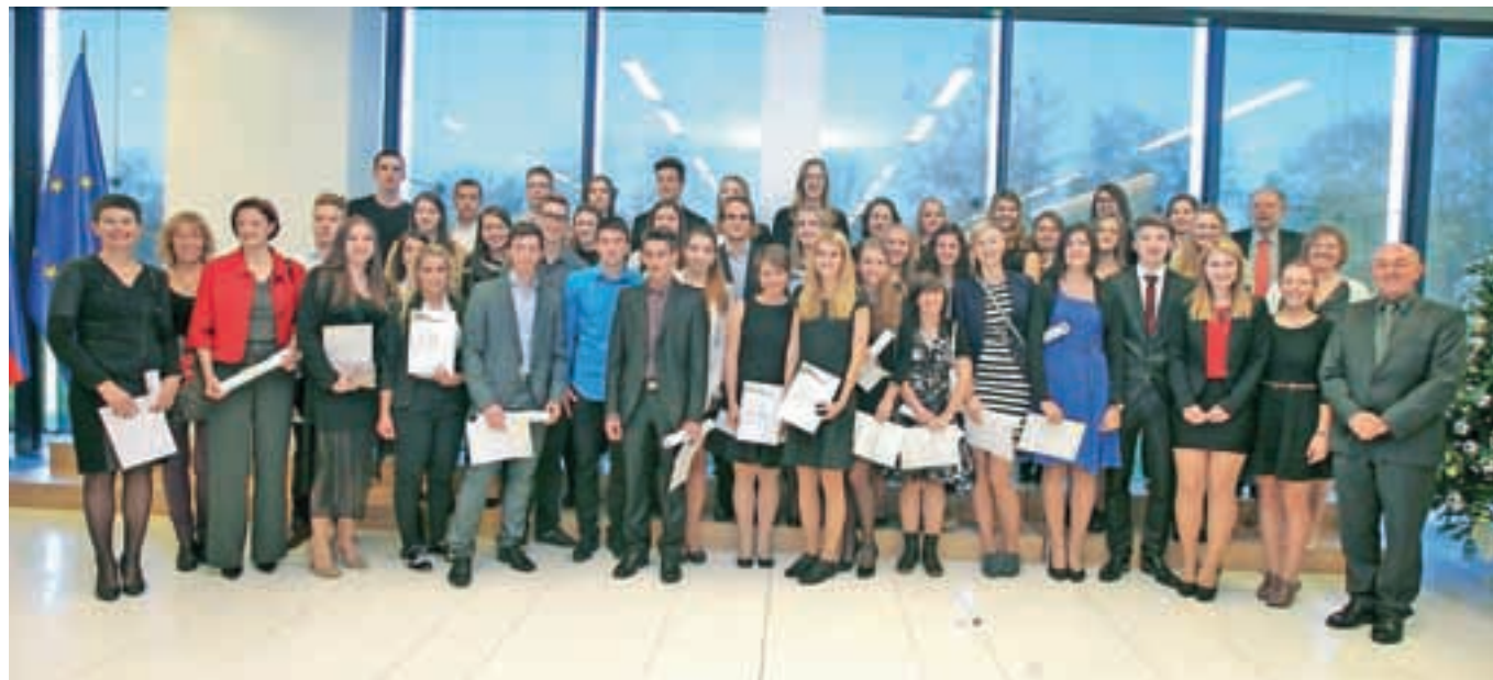
Petdeset loških »zlatnikov«