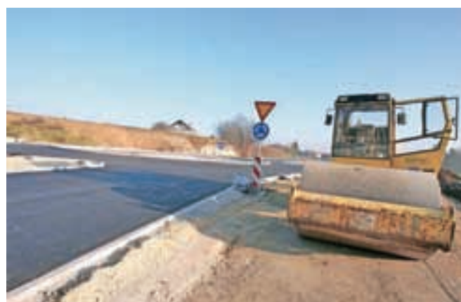
Sredi decembra so opravili večino gradbenih del na novem krožišču.