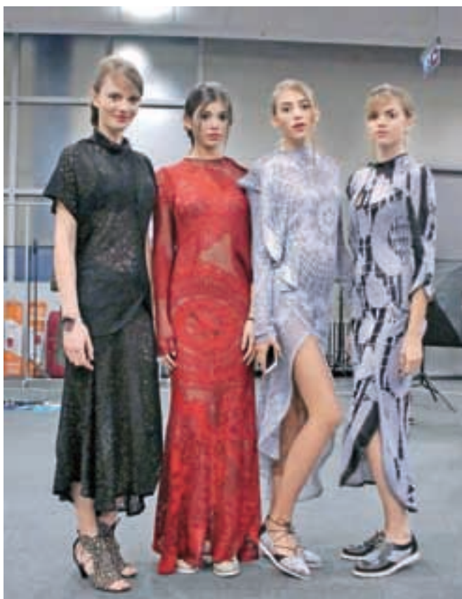
Žirovska čipka krasi tudi novo kolekcijo Pletilnega studia Draž.