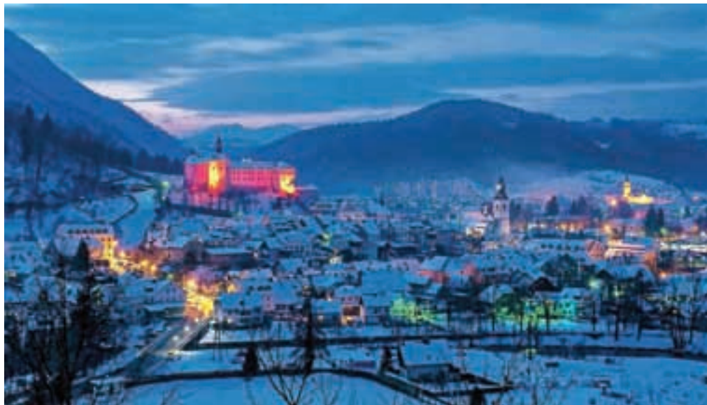
Čarobna Loka v pričakovanju praznikov