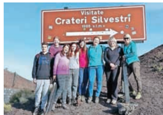
Pet učencev osnovne šole Žiri je bilo novembra v okviru projekta Erasmus+ na izmenjavi na Siciliji.