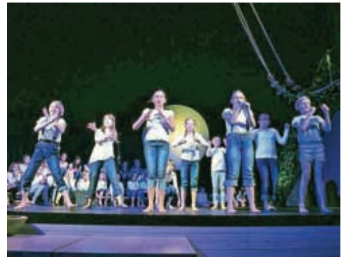
Program ob občinskem prazniku so pomagali oblikovati učenci Osnovne šole Poljane.

V prihodnjih letih, je še dejal župan, občino čaka težko obdobje, saj jim država reže sredstva, prav tako ni odprtih evropskih razpisov. »Zato se bomo morali krepko potruditi, da bomo imeli tudi v prihodnje kaj pokazati, a toliko kot zdaj ne bomo mogoče.« Medtem ko so doslej z občinskimi sredstvi v glavnem financirali evropske projekte, bodo v prihodnjih letih več sredstev namenili za občinsko infra-