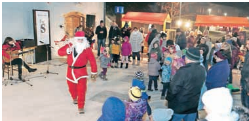
Decembrsko dogajanje v Poljanah je popestril Polansk advent.