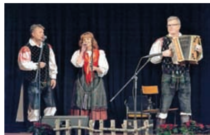
Žaberlovim bo namenjen tudi del izkupička koncerta Sončki dobrote. Osrednji gost je bil ansambel Vrisk.