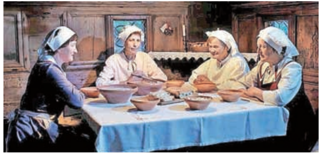
Društvo Sotočje je gostovalo v TV-oddaji Dobro jutro, na sliki prizor iz Nacetove hiše.

stnega Štandreža pri Gorici do Celja in naslednjič od Celja do Škofje Loke. Kapucin pater Romuald iz Štandreža, avtor Škofjeloškega pasijona, je namreč šel v noviciat h kapucinom v Celje, potem pa prišel v Škofjo Loko, kjer je pred tristo leti napisal in uprizoril Pasijon. Pripravljajo proslave ob materinskem dnevu, kjer poleg njihove gledališke sekcije in zborov kot gostje nastopajo člani folklorne skupine iz Osnovne šole Mesto in vsakokratni posebni gost s kratkim predavanjem. Zraven so tudi na zgodovinskem festivalu Historial: sklado, vojaki, beračem, ga-