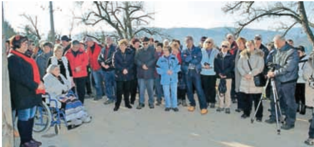
Pri Brdarju v Vinharjah so pripravili tradicionalno srečanje v spomin na poljansko vstajo decembra leta 1941.