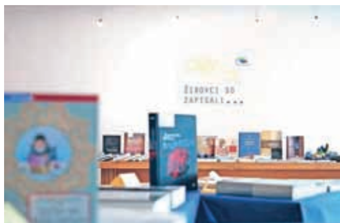
V galeriji DPD Svoboda so pripravili razstavo knjižnih del, katerih avtorji so Žirovci.

ter vključujejo tudi več različnih avtorjev," je razložil Klemenčič. Tako kot so pred desetimi leti, ob praznovanju petdesetletnice, pripravili razstavo likovnih del vseh žirovskih ustvarjalcev, so se to-