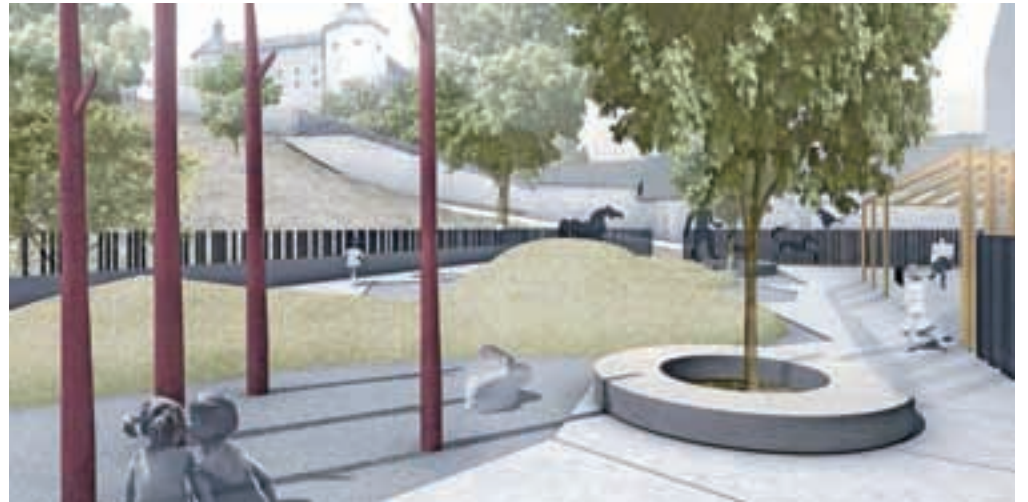
Idejna rešitev otroškega igrišča se naslanja na zgodbo o zamorcu iz loškega grba.