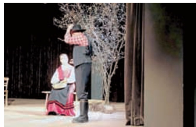
Poljanske šolarje so v Žireh navdušili z uprizoritvijo Županove Micke.

Učenci višjih razredov so se v Žiri podali dan kasneje. Najprej so se vsi zbrali v dvorani Delavsko-prosvetnega društva Svoboda Žiri, kjer so si ogledali predstavo Županova Micka. Nato pa so učenci od 4. do 7. razreda spoznali arhitekturo žirovske cerkve, si v Stari šoli ogledali Muzej Žiri ter razstavo knjig v galeriji Delavsko-prosvetnega društva Svoboda, na koncu pa še čipkarsko razstavo. Učencem 8. in 9. razreda so v tovarni Alpina predstavili proizvodnjo smučarskih, tekaških in modnih čevljev.