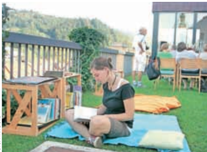
Bralnica je letos privabila tako mlade kot mlade po srcu.