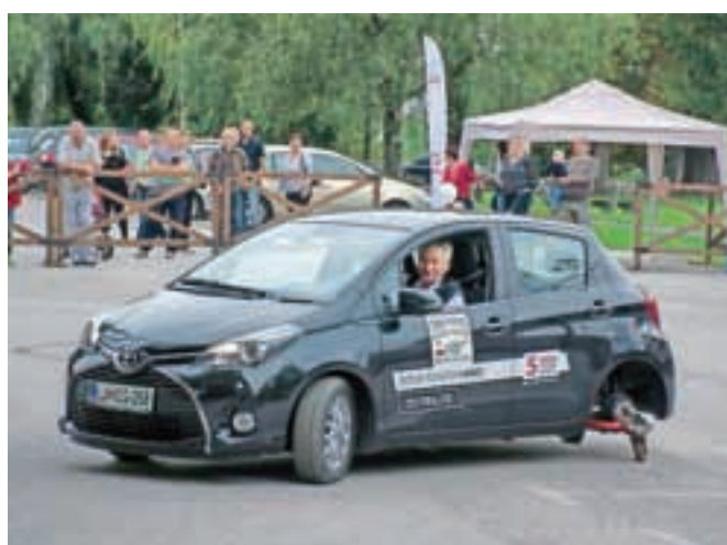
Na poligonu varne vožnje