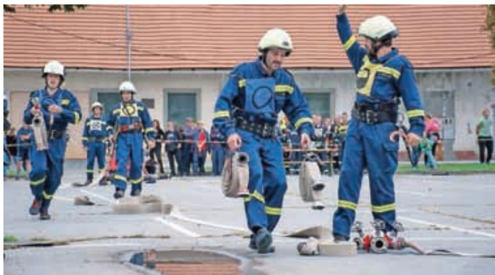
Na tekmovanju so gasilci vseh starosti pokazali svoje spretnosti.