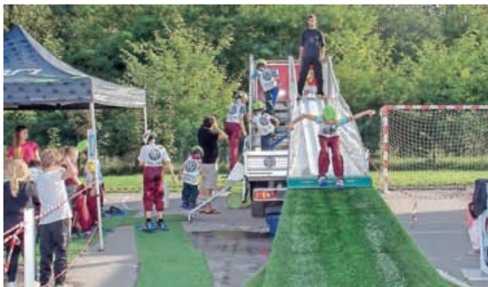
Skakalci so se preizkusili na Mali Planici.

športu srečujejo s pravili in vrednotami, za uživanje v igri pa se morajo naučiti tudi določenih socialnih spretnosti, kot so sodelovanje, tekmovalnost, pripadnost ekipi in komunikacija," pravijo v Lokalni akcijski skupini za preprečevanje zasvojenosti.