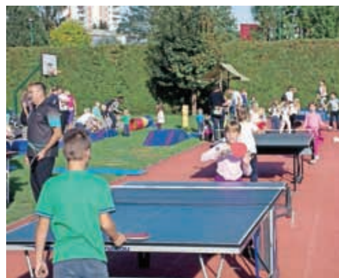
Med številnimi športi so predstavili tudi namizni tenis. / FOTO: ANDREJ TARFILA