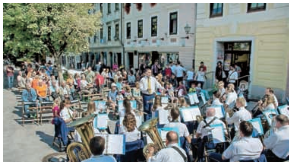
Pihalne godbe so že v sončnem sobotnem dopoldnevu zasedle Mestni trg.

Škofja Loka – Na tradicionalnem, že sedmem mednarodnem festivalu pihalnih orkestrrov, imenovanem Loka jo piha, so v začetku septembra tudi letos sodelovali orkestri z različnih koncev Slovenije, Hrvaške in Italije. Godbi Glazba Ston s Hrvaškega in Godbeno društvo Prosek iz Italije sta se predstavili na Mestnem trgu, od domačih godb pa sta se povabila organizatorja, Mestnega pihalnega orkestra, odzvala Godba na pihala Sveti Anton iz Kopra in Pihalni orkester Kovinoplastika Lož iz Starega trga pri Ložu. Gostili so tudi mažoretke iz Mažoretnega in twirling kluba Kranj, kar je vse skupaj še dodatno popestrilo. Tako je festival potekal v