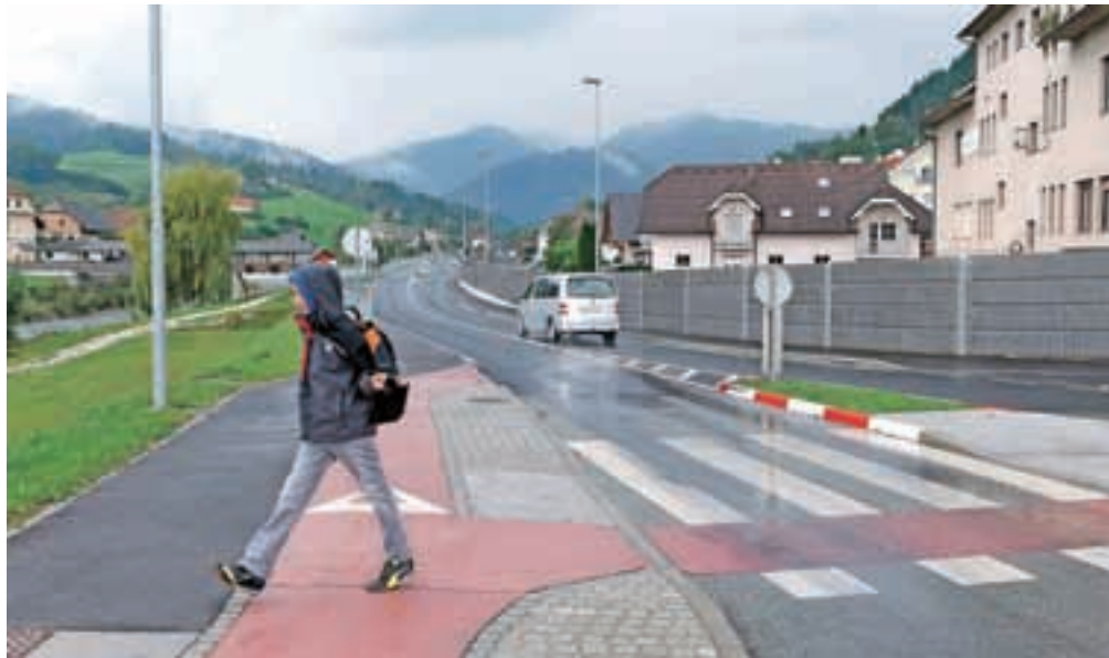
Sredi septembra so tudi uradno odprli gorenjevaško obvoznico.

Gorenja vas – Z novozgrajeno obvozno cesto so zagotovili boljšo prometno varnost vseh udeležencev v prometu, izboljšali kakovost bivanja prebivalcev Gorenje vasi ter prispevali k boljši povezanosti regionalnih in medobčinskih središč. Projekt gorenjevaške obvoznice je bil vreden 5,5 milijona evrov, od tega je dobra dva milijona evrov prispeval evropski sklad za regionalni razvoj. To je eden izmed štirih projektov, ki so jih letos s pomočjo evropskih sredstev zaključili na četrti razvojni osi in so bili skupaj vredni 78,4 milijona evrov, je ob odprtju dejal minister za infrastrukturo Peter Gašperšič in dodal, da so s tem odpravili ozka grla, skrajšali potovalne čase in omogočili boljši dostop za gospodarstvo. Župan občine Gorenja vas - Poljane Milan Čadež je z zadovoljstvom poudaril, da je bila obvoznica zgrajena v rekordnem času, saj je od priprave državnega prostorskega načrta skupnega pomena do predaje ceste namenu minilo zgolj šest let. Poleg 618 metrov dolge ob-