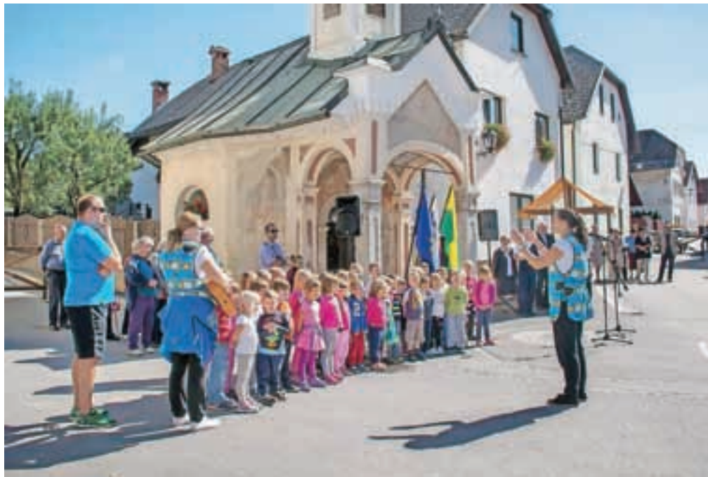
Obnovljeno središče Stare Loke je urbanistično in prometno posodobljeno in bo prijaznejše ranljivejšim udeležencem v prometu, tudi otrokom.

"Ureditev središča Stare Loke je dokaz, da se z dobro voljo in zdravim razumom kljub pomanjkanju finančnih sredstev da premikati projekte in narediti več z