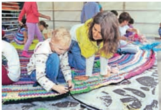
Udeleženci dogodka so pomagali soustvarjati spiralno preprogo.