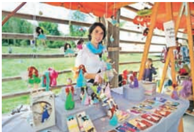
Na 35 stojnicah so ponujali čudovite unikatne izdelke iz volne.