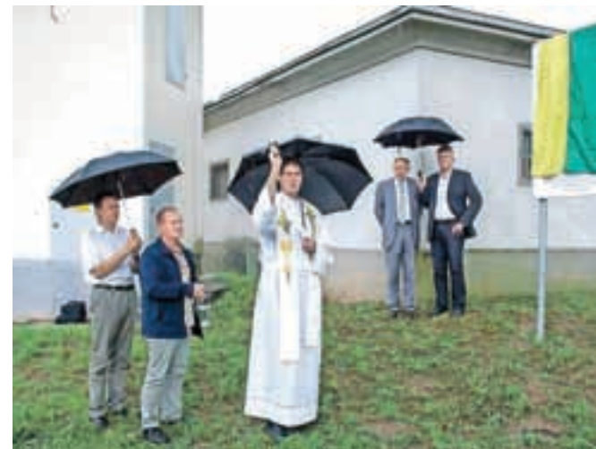
Slovesno odprtje in blagoslov primarnega vodovoda Visoko - Škofja Loka v Virškem

vodovod zelo dotrajan in tako niso mogli izdajati soglasij za nove priključke. Končanje del na vodovodnem sistemu so zaznamo-