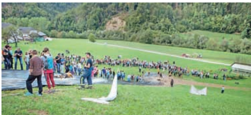
Blatfejst je tudi letos ponudil sodelovanje, zabavo in druženje.

movalcev zahtevale najrazličnejše sposobnosti. Nekatere so temeljile na moči, druge na spretnosti, vsem pa je bilo skupno to, da so bile ob pomoči sotekmovalcev premagljive za vsakogar, poudarjajo organizatorji. Blatfejst namreč opisujejo s tremi glavnimi besedami: šport, druženje in zabava. Vse to združijo v premagovanju ovir, kjer glavno vlogo igra ekipno sodelovanje, rezultat oziroma čas, v katerem posameznik premaga progo, pa ni pomemben. Tekmujejo namreč zgolj s sabo in svojimi sposobnostmi, poudarjajo organizatorji in dodajajo, da jih udeleženci za premagovanje njihovih ovir nedvomno potrebujejo več, kot jih od njih zahteva vsakdanje življenje.