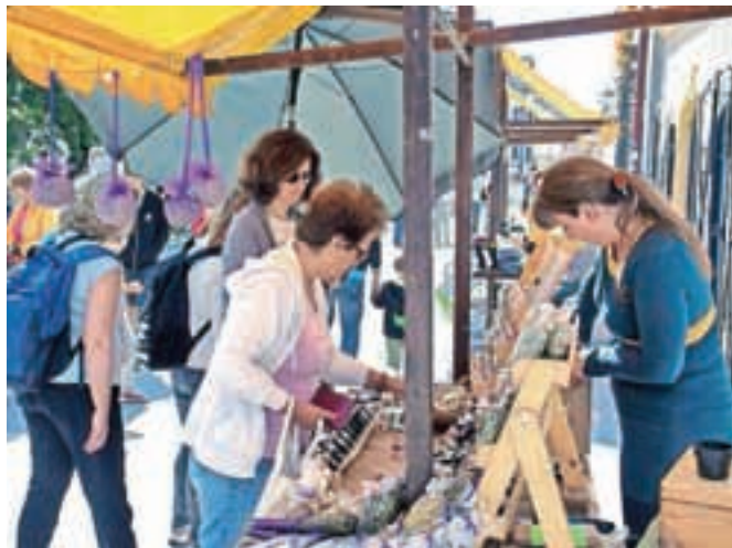
Na LUFTu srečamo ponudnike unikatnih izdelkov iz vse Slovenije.

Škofja Loka – Druga septembrska sobota je bila spet namenjena loškemu umetniškemu festivalu LUFT. Po poletnih počitnicah so Cankarjev trg znova napolnile stojnice s ponudbo unikatnih izdelkov ustvarjalcev iz vse Slovenije. Ob tem ni manjkalo tudi drugih spremljevalnih dogodkov od otroške likovno-ustvarjalne delavnice s Polono in športnega delavnice s ŠD Partizan do glasbe in komedije ter odprtega kina Luna. LUFTu je tokrat delala družbo tudi godba, pravzaprav mednarodni koncert pihalnih orkestrrov Loka jo piha, Grajsko gostijo s ponudbo raznovrstne hrane pa Ločani in drugi obiskovalci LUFTa poznajo že od prej. Do konca leta lahko prijatelji LUFTa pričakujejo še kakšnega!