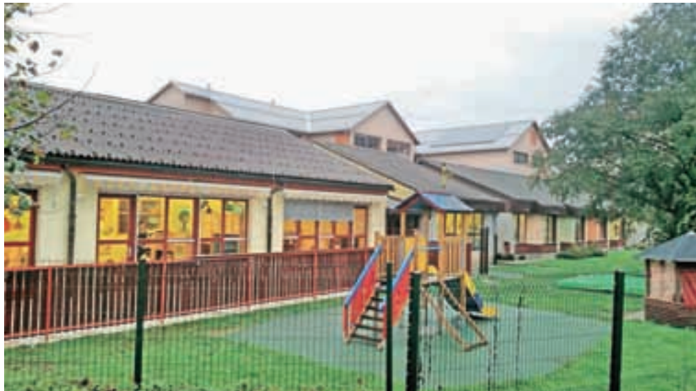
V prihodnjem letu naj bi poskrbeli za celovito sanacijo strehe na vrtcu.