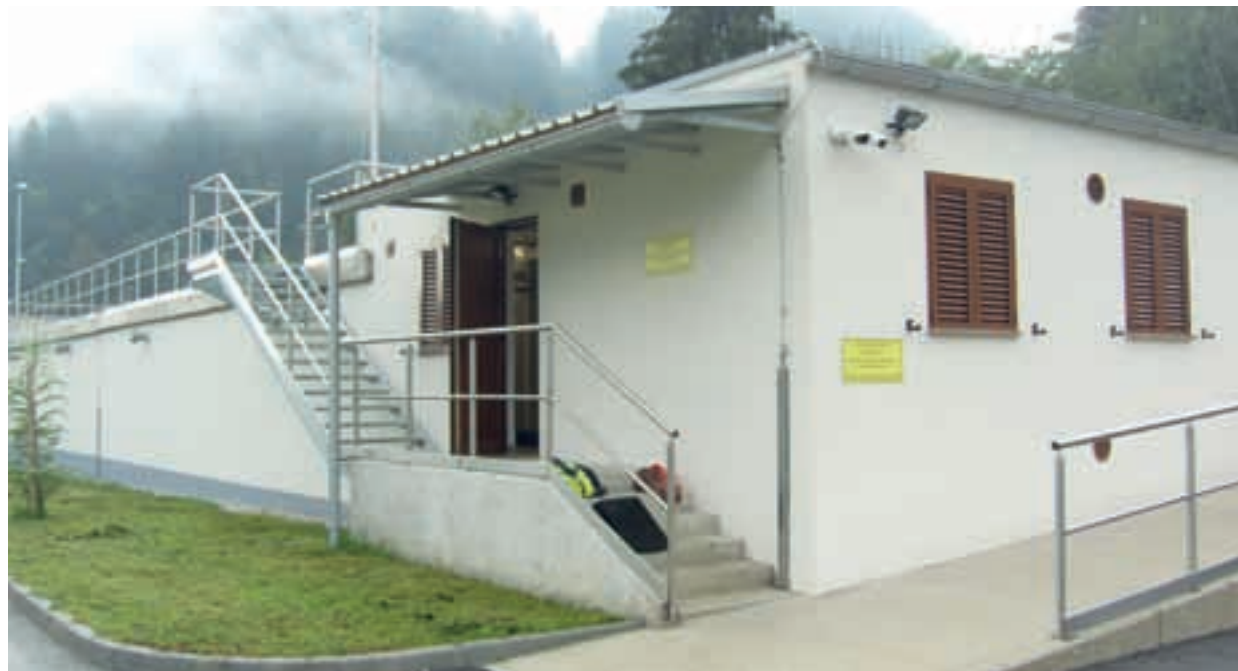
Čistilna naprava Železniki

Čistilna naprava zdaj prevzema in obdeluje tudi vsebino iz greznic objektov v občini, ki niso priključeni na javno kanalizacijsko omrežje, prevzema in dehidrira odvečno biološko blato iz malih komunalnih čistilnih naprav v občini in iz čistilne naprave Železniki. Vse omenjeno občutno prispeva k dvigu kakovosti življenja občanov, kar pomeni tudi ugoden vpliv na zdravje.