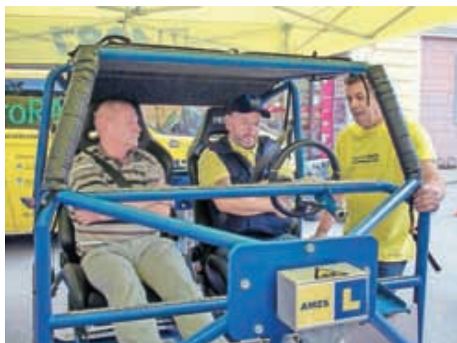
V "kletki" varni tudi med prevračanjem?