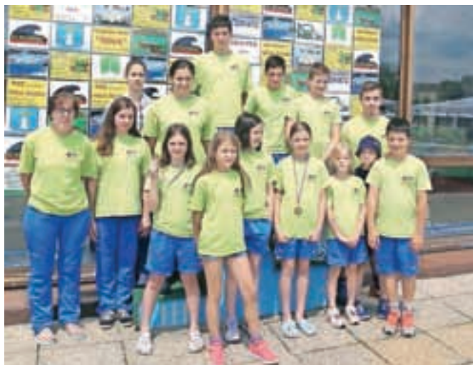
Člani Plavalnega kluba Ratitovec Železniki na tekmi v Varaždinu

"V klubu imamo eno tekmovalno skupino, v kateri je deset tekmovalcev, osem iz občine Železniki in dva iz Škofje Loke, plavalno šolo z desetimi plavalci, nekateri hodijo tudi že na tekme, izvajamo pa še tečaje plavanja in vodeno rekreativno plavanje, s katerim bomo začeli oktobra. Potekalo bo dvakrat teden-