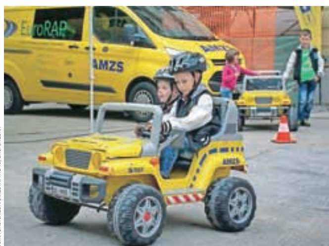
OBČINA ŠKOFJA LOKA, MESTNI TRG 15, ŠKOFJA LOKA