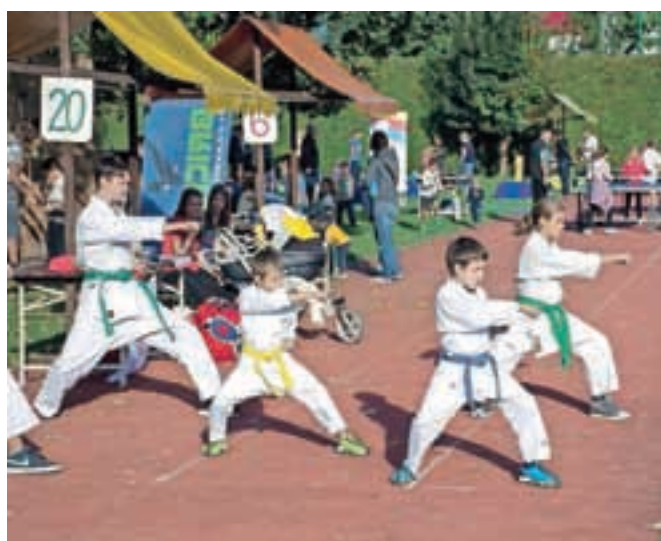
Mladi mojstri borilnih veščin