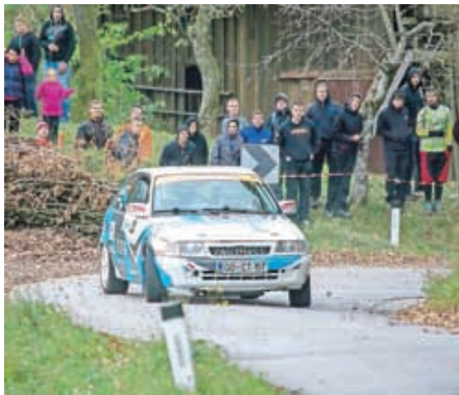
Lani je bilo ob progi pet tisoč gledalcev, letos jih pričakujejo še več.