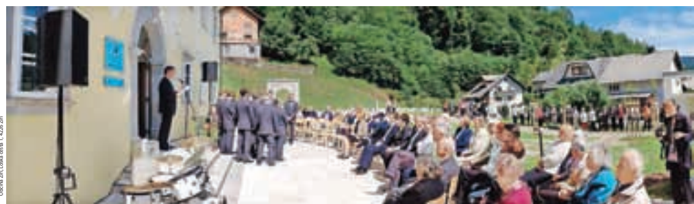
Sedemdesetletnico konca druge svetovne vojne so v Žireh zaznamovali s spominskim dogodkom pri Muzeju v Starih Žireh.