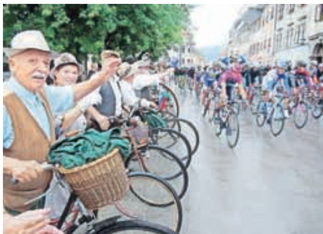
Kolesarje na dirki Po Sloveniji so s starta druge etape v Škofji Loki pospremili tudi Rovtari.

Škofja Loka – Od 18. do 21. junija je potekala kolesarska dirka Po Sloveniji, največja etapna dirka pri nas. Nastopile so tudi tri WorldTour ekipe: Sky, Katjuša in Lampre - Merida s slovenskim junakom letošnjega Gira Janom Polancem. Kolesarje ste lahko videli tudi v Škofji Loki. Na Mestnem trgu je bil start druge etape s ciljem v Kočevju. Dirko je dobil slovenski kolesar, član Adrie Mobila, nekdanji smučarski skakalec Primož Roglič.