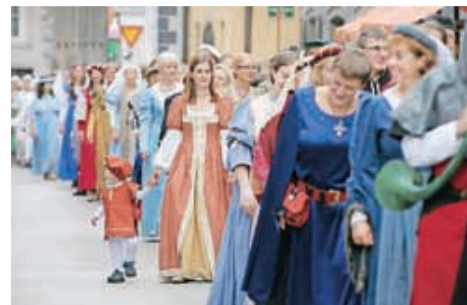
Imenitniki in meščani na promenadi skozi mesto