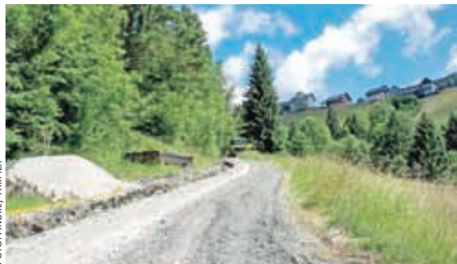
Cesto skozi Soriški potok bodo asfaltirali ta teden.