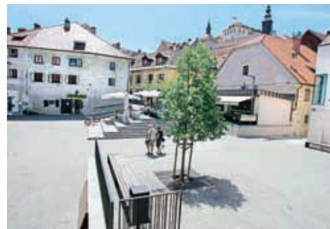
Cankarjev trg v Škofji Loki je bil nominiran za Plečnikovo odličje