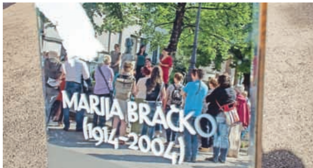
Ob odprtju Aleje znamenitih Ločank