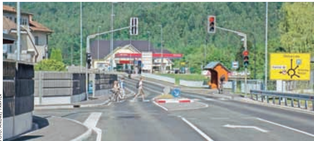
Promet proti Žirem so v Gorenji vasi pred dnevi preusmerili na novozgrajeno obvoznico.

Ves čas gradnje obvoznice so po županovih besedah zelo dobro sodelovali z direktorijo za infrastrukturo in skupaj reševali vse težave, ki so se porajale ob tem. Kar nekaj let so prihranili, je še poudaril župan, ker so se leta 2009 sami lotili pripra-