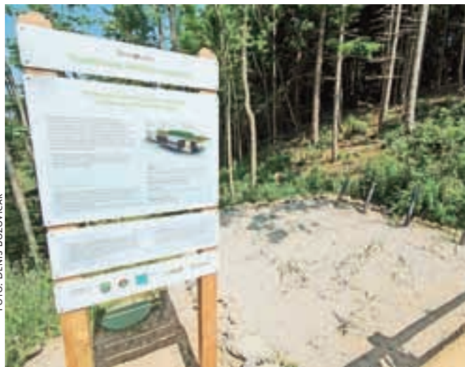
Ob koči so uredili tudi rastlinsko čistilno napravo.

Ob novi koči stoji tudi rastlinska čistilna naprava, namenjena čiščenju odpadne vode iz kočice. Sredstva za postavitev rastlinske čistilne naprave sta prispevala Občina Žiri in sklad Si.voda, zavod za zdrave in čiste vode. Razteza se na površini zgolj 16 kvadratnih metrov, saj je zaradi prostorskih omejitev zgrajena vertikalno, voda v njej pa se pretaka gravitacijsko,