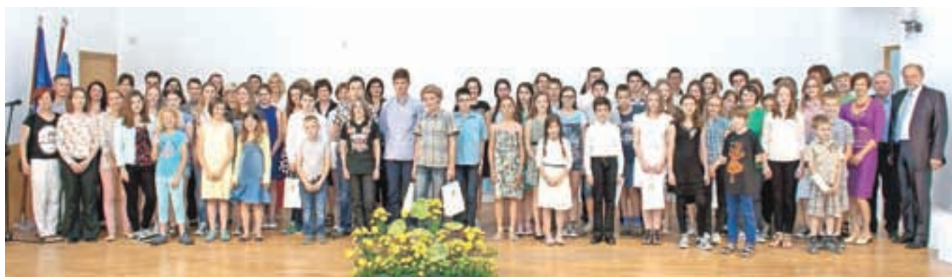
Učenci loških osnovnih šol in glasbene šole so prejeli vrsto priznanj za uspehe.