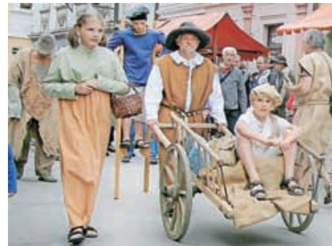
V dogajanje se s svojimi cizami in košarami vključijo tudi navadni ljudje.

padel v reko, kjer sta oba utonila. Zgodba je vzeta iz zbirke loških pripovedk Kamniti most, ki jih je zbral