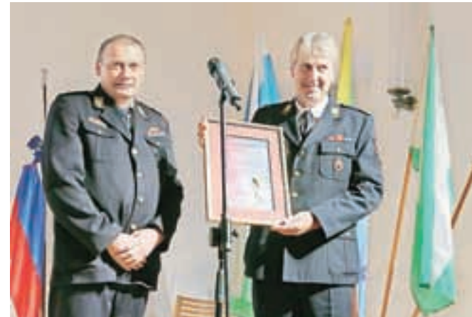
Ob jubileju je Gasilska zveza Škofja Loka prejela priznanje Gasilske zveze Slovenije.