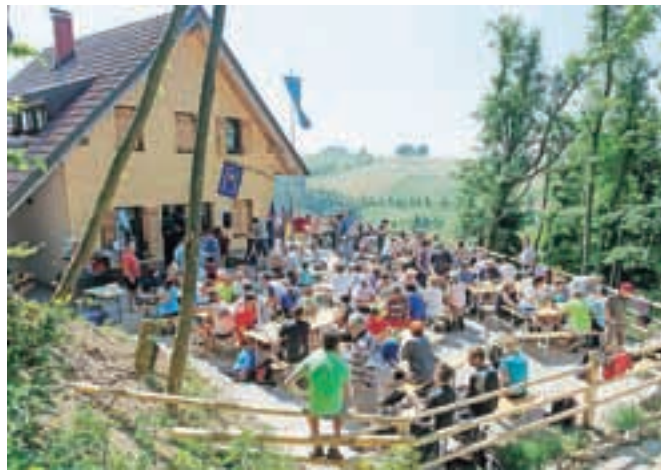
Ob odprtju nove planinske kočice se je na Mrzlem vrhu zbrala množica ljudi.

so pojasnili pri omenjenem skladu. Pri čiščenju odpadnih voda uporablja samoobnovitvene sposobnosti narave. Glavni delež čiščenja se tako dogaja ob preto-