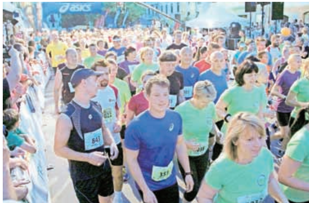
Nepregledna množica tekačev na startu nočnega Teku štirih mostov

Torej imate še skoraj leto dni časa za trening, da iz prve roke doživite čar nočnega teka v tisočletnem mestu. Kot zagotavljajo tekači, je biti del te množice nekaj nepozabnega. Škofja Loka je bila 13. junija pravo tekaško mesto. Dopoldan so tekli vrtčevski otroci, bilo jih je več kot štiristo, popoldan je okrog petsto šolarjev teklo na šolskih tehnikah za Pokal štirih županov. Najbolj uspešna šola je bila OŠ Ivana Groharja, ki je dobila tudi ček za petsto evrov, najštevilnejši pa učenci OŠ Cvetka Golarja.