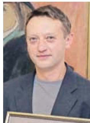
... MPZ Alpina Žiri ...