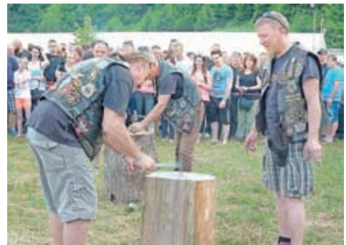
Motoriste in druge obiskovalce vedno navdušijo zanimive igre, tudi zabijanje žebeljev z votlim kladivom.

Pripeljali so se namreč tudi iz Latvije, veliko jih je bilo iz Francije, Belgije, Španije in Anglije ter držav nekdanje Jugoslavije in naših sosednjih držav. Organizatorji pa so jim pripravili zanimiv spremljevalni program, saj tudi letos niso manjkale priljubljene igre, med katerimi je nekaj posebnega pljuvanje govejih oces, zanimivo pa je tudi vlečenje vrvi, zabijanje žebeljev, manjkala pa nista niti glasba niti tradicionalni striptiz.