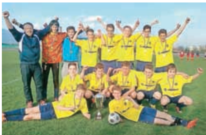
Nogometaši mladinske ekipe NK Žiri so se veselili naslova gorenjskih pokalnih prvakov.