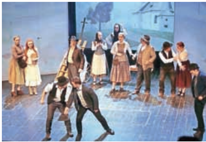
Prizor iz muzikala Cvetje v jeseni