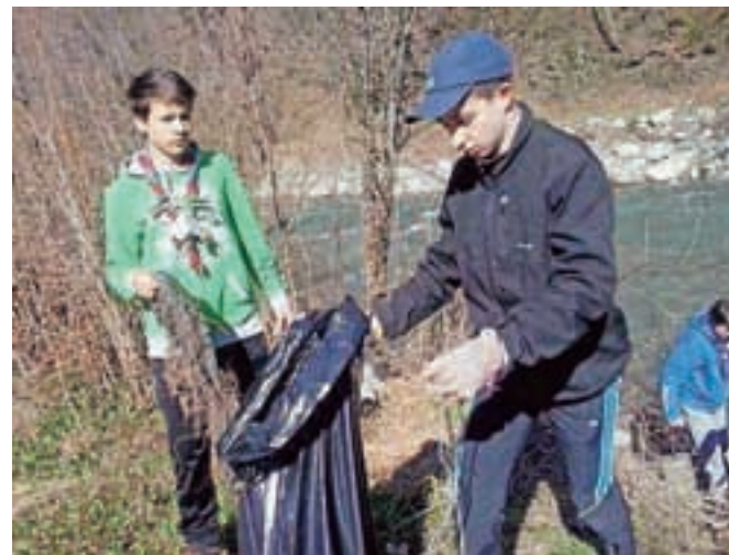
Skavti so odpadke pobirali ob Selški Sori na zgornjem delu Jesenovca.