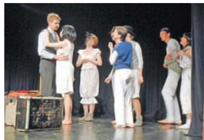
Jeseniški gimnazijci so se predstavili s Cankarjevim Pohujšanjem v dolini Šentflorjanski.