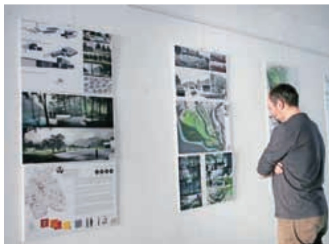
Naključni navdušenec sodobne krajinske arhitekture na razstavi v Sokolskem domu

stavi vidnejših realiziranih projektov s področja krajinske arhitekture zadnjih petih let. Poleg izvedenih projektov se na bienalu tradicionalno predstavljajo tudi krajinsko arhitekturne šole z izdelki svojih študentov. Oddelek za krajinsko arhitekturo se je predstavil z desetimi študentskimi projekti, ki so s kakovostjo in inovativnostjo prepričali žirijo, da je med več kot sto sodelujočimi šolami z vsega sveta oddelek uvrstila v ožji izbor trinajstih najboljših.