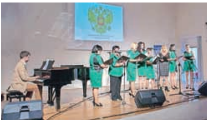
Večer ruskih romanc na odru Sokolskega doma

Škofja Loka – Ljubitelji ruskih pesmi so aprila spet prišli na svoj račun, saj so v Sokolskem domu lahko prisluhnili gala koncertu zmagovalcev mednarodnega festivala ruskih romanc. Koncert pod naslovom Blagoslovi me, moj talisman, je potekal v okviru VII. Mednarodnega cikla koncertov 2015, in sicer v sodelovanju z Ruskim centrom znanosti in kulture v Ljubljani in Društvom Slovenija Rusija.