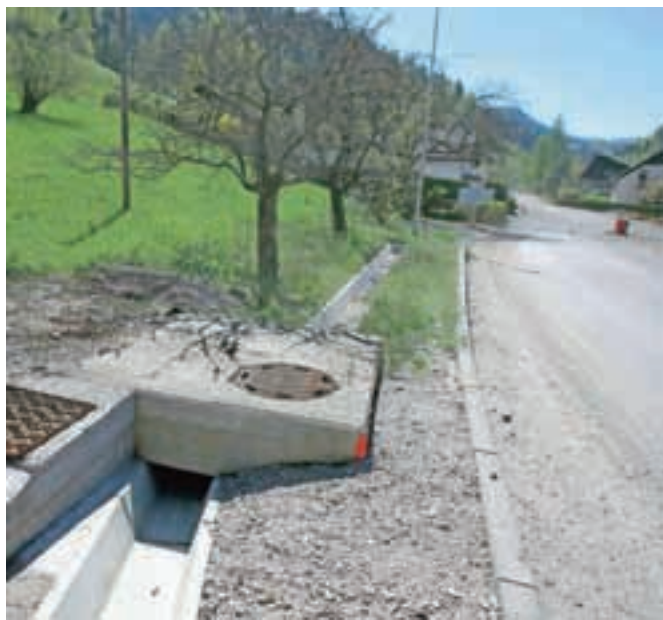
Urejajo lokalne ceste na trasah, kjer so gradili komunalno infrastrukturo. Na sliki: Puštal.

"Problemi na državnih cestah so tudi lokalni, zato je potreben čimprejšnji preboj," razmišlja Strah. Tako so od leta 2012 na Kidričevi