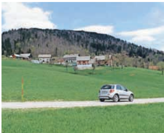
Na plazu v Lazah so lani zaznali precej večje premike kot v preteklih letih.