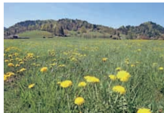
Na območju Livade Žovšč, kjer sedaj raste trava, naj bi v prihodnje zraslo večje stanovanjsko naselje.