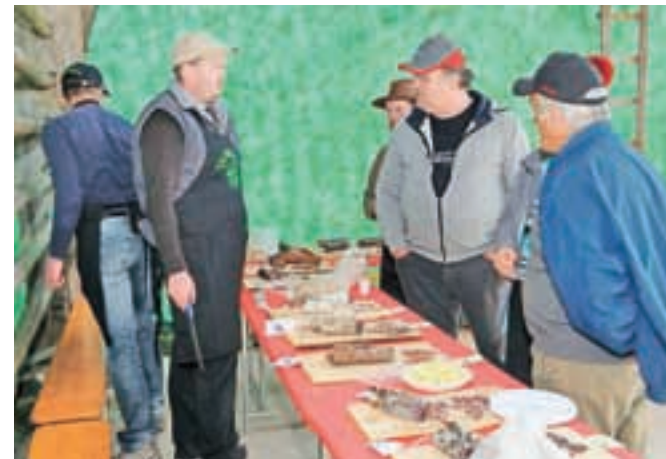
Pri Tavčarjevem dvorcu so v začetku aprila pripravili prvo salamijado na tem območju.

Salamijado so popestrili s tržnim dnem, v okviru katerega so na 14 stojnicah ponujali domače izdelke in pridelke. Med drugim so svojo ponudbo predstavili lokalni mesarji, kupiti pa je bilo mogoče tudi mesarsko opremo.