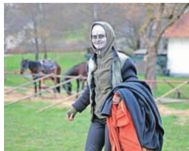
Še malo prej zastrašujoča smrt ...

kratno delo. Za lažje povezovanje in delo z igralskimi skupinami v vseh štirih občinah na Škofjeloškem in samo uprizoritev pasijonov sem bil izbran tudi za predsednika Zveze kulturnih organizacij Škofja Loka. Ponošen sem, ker sem že pri prejšnjih pasijonskih uprizoritvah omogočil ogled pasijona senzorno oviranim osebam. Danes lahko mirno rečem, da se vsa leta nisem polno angažiral za pasijon samo na delovnem mestu, ampak tudi v svojem prostem času." Po letošnji uspešni uprizoritvi pasijona izraža veliko željo, da se v času do nove uprizoritve Škofjeloškega pasijona v letu 2021 v Škofji Loki združi skupina sodelavcev, ki bo