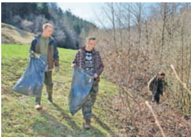
Člani Ribiške družine Žiri so tudi letos pripravili čistilno akcijo Očistimo naše lepe Žiri.

ti iz leta v leto zmanjšuje. "Večina smeti, ob tem tudi nekaj večjih kosovnih odpadkov, je bila posledica lanskih poplav." Ribiči so se skupaj s še nekaj prostovoljci lotili čiščenja porečja reke Sore od Pustotnika do Trebije, člani MoPZ Alpina Žiri pa od Pustotnika do Sovre. Lovci so čistili okoli Breznice, planinci pa pohodne poti od Ledinice proti Mrzlemu vrhu in Breznici. "Na koncu smo se zbrali pri ribogojni-