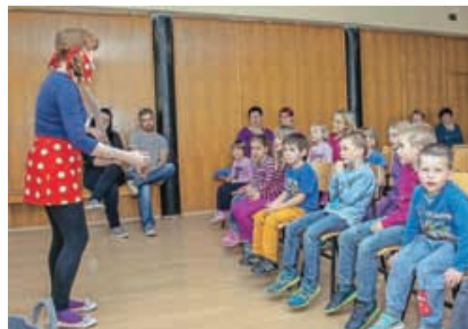
S predstavo Pika, pika, piskrček so sredi aprila sklenili letošnjo sezono otroških dejavnosti.

Na dober odziv so naleteli tudi dejavnosti za odrasle, ki so jih uvedli lanskega oktobra, izpeljali pa so potopisna predavanja, predstavitev knjig, predavanja in delavnice ročnih del ... "V naši mini galeriji smo gostili nekaj razstav. Pripravljati si jih želimo tudi v prihodnje, zato občane, ki bi želeli razstaviti svoja dela, vabimo k sodelovanju," pravi Šmidova in dodaja, da razmišljajo tudi o uvedbi likovnih delavnic za odrasle. Izvedba dogodkov za odrasle jim je sicer omogočila predlanska širitev knjižnice, s katero so pridobili tudi večnamenski prostor. Obiskovalci so s prostori knjižnice po besedah Šmidove zelo za-