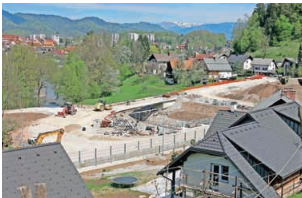
Gradnja poljanske obvoznice poteka brez večje medijske pozornosti.