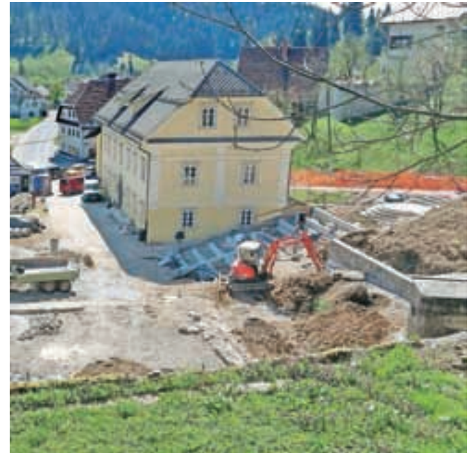
Do konca maja bodo končali še ureditev okolice Žirovske pristave.

Objekt Žirovske pristave, pojasnjujejo pri občini, je dokumentiran že v franciscejskem katastru iz leta 1823. Je sestavni del spomeniškega projekta »Žirovska pristava«, ki je po mnenju ljubljanskega regionalnega zavoda za varstvo naravne in kulturne dediščine zgodovinsko, arhitekturno in prostorsko najpomembnejša žirovska stavbna dediščina. Lastnica objekta je Občina Žiri, ki je leta 2005 celoten kompleks razglasila za kulturni spomenik lokalnega pomena. Od leta 1972 dalje je bil del prostorov namenjen postavitvi muzejske zbirke Muzejskega društva Žiri, ki je bila na ogled vse do začetka obnove objekta, ki se je ob pomoči evropskih sredstev in sred-