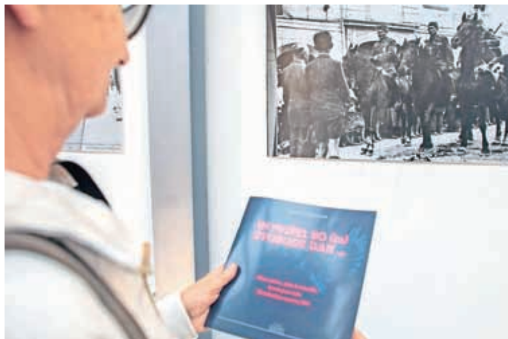
Bilo je radostno, ko je naposled prišel svobode dan.

Te fotografije niso le dokumentarne, iz njih lahko razbiramo tudi našo zgodovino