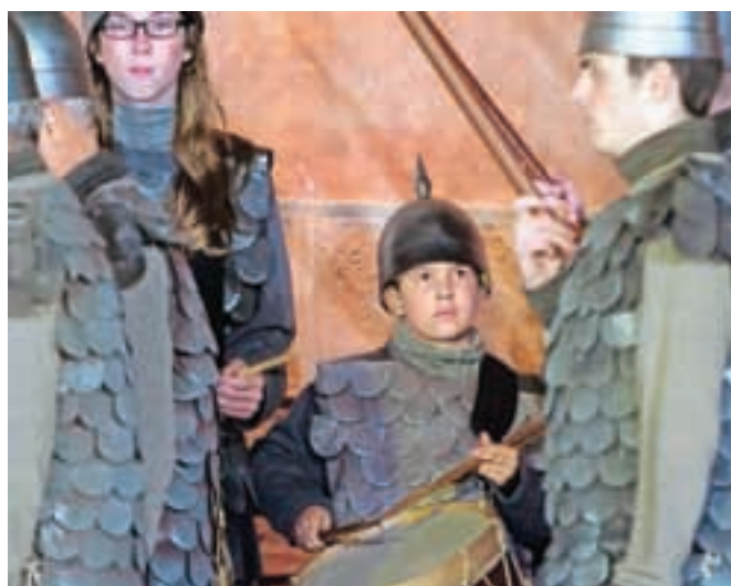
Pasijonci, veliki in mali