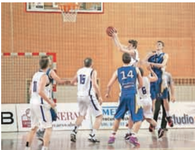
Loški košarkarji so si že krog pred koncem prvenstva v domači dvorani priborili prvo ligo.