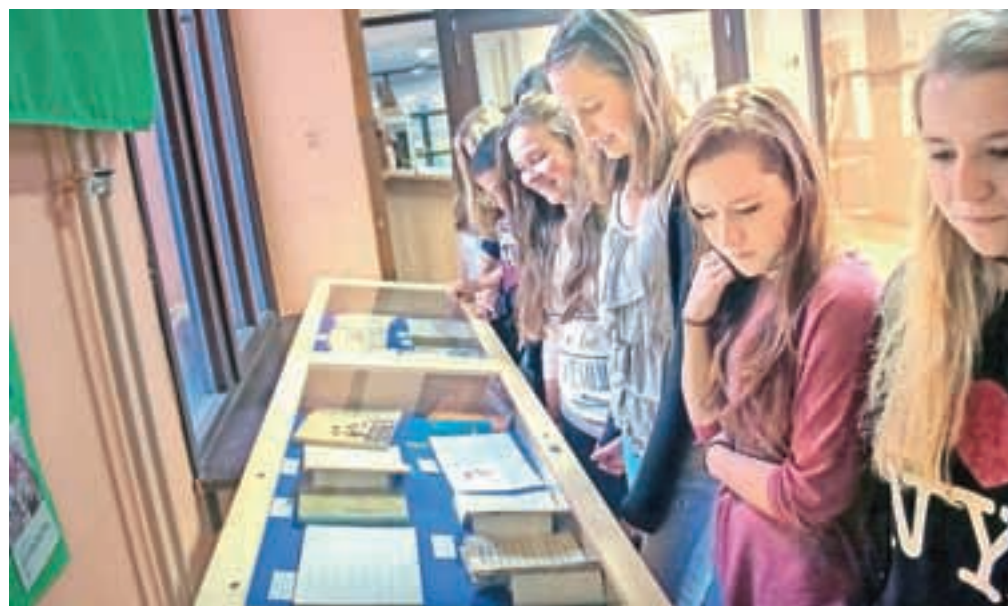
V prostorih šole je ta čas na ogled razstava starih učbenikov.