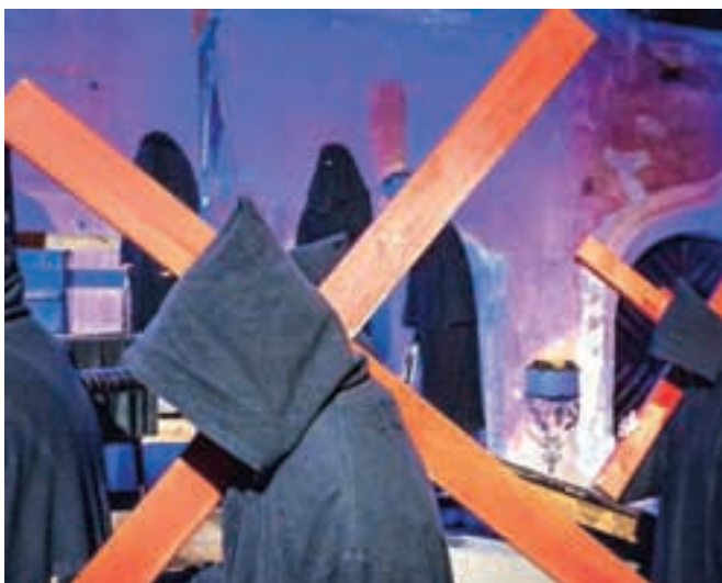
Križ, simbol Kristusovega trpljenja