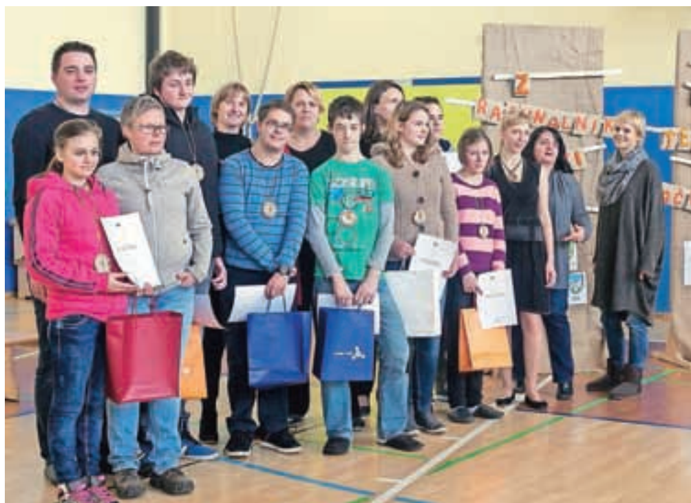
Najboljše tekmovalke in tekmovalci so prejeli zaslužena priznanja.

razvedrilnim programom v sproščnem vzdušju z glasbo in plesom učenk in učencev šole gostiteljice. Za smeh so poskrbeli trije psički iz društva Ambasadorji nasmeha, na prireditvi pa je sodelovala tudi Sonja Kononenko iz Lutkovnega gledališča Ljubljana.