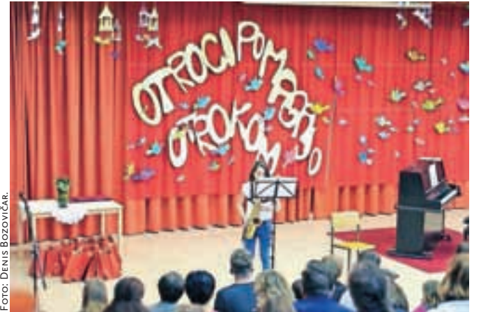
Na Osnovni šoli Gorenja vas so poskrbeli za slovesen zaključek natečaja Otroci pomagajo otrokom.

Natečaj vsako leto pripravijo z namenom, da bi se otroci zavedali, da lahko s svojimi majhnimi deli veliko pripomorejo pri reševanju ži-