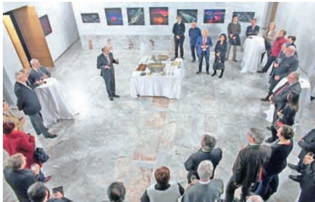
Premiere se je udeležilo tudi več cerkvenih dostojanstvenikov, diplomatov, predstavnikov pobratenih mest in drugih, ki jih je župan ta dan gostil na sprejemu.