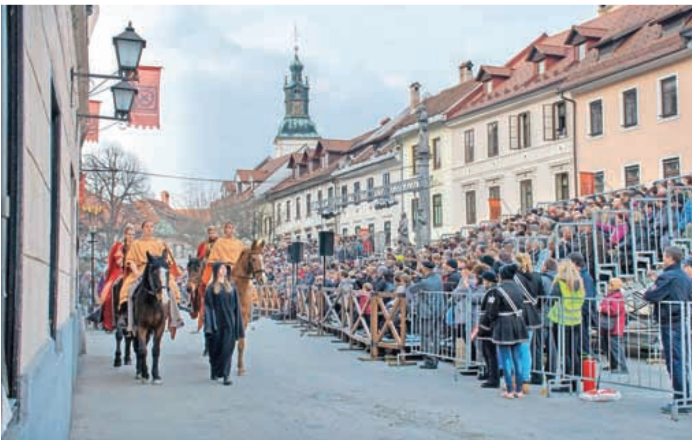
V Škofjeloškem pasijonu nastopa tudi osemdeset konjenikov.