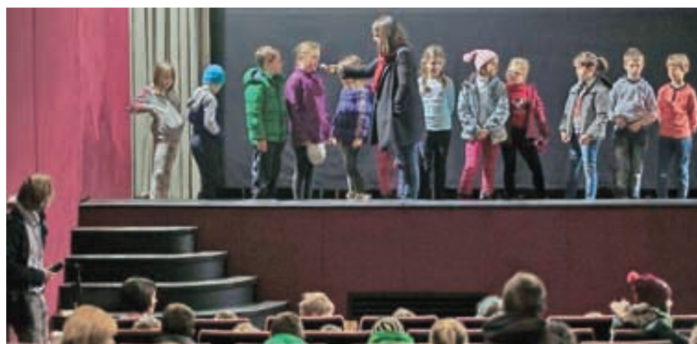
Za nagrado ogled filma v kinu Sora in pogovor o njem