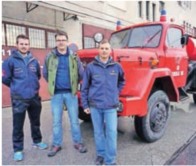
V PGD Gorenja vas so ponosni na svoj "zaklad", prvo cisterno njihovega društva, ki so jo po 26 letih spet pripeljali v Gorenjo vas.

Nakup so zato želeli za nekaj časa "zamrzniti". A petim članom njihovo nekdanje tovorno vozilo ni dalo miru, saj so se bali, da bo vse skupaj padlo v vodo.