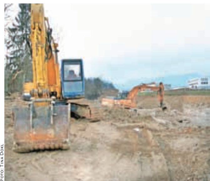
Gradnja dovozne ceste v industrijsko cono lepo napreduje.

"Trenutno potekajo predela in zemeljska dela (izkopi), predvidena pa je še zatravitev brežin. Vrednost teh pogodbenih in izvedenih del je