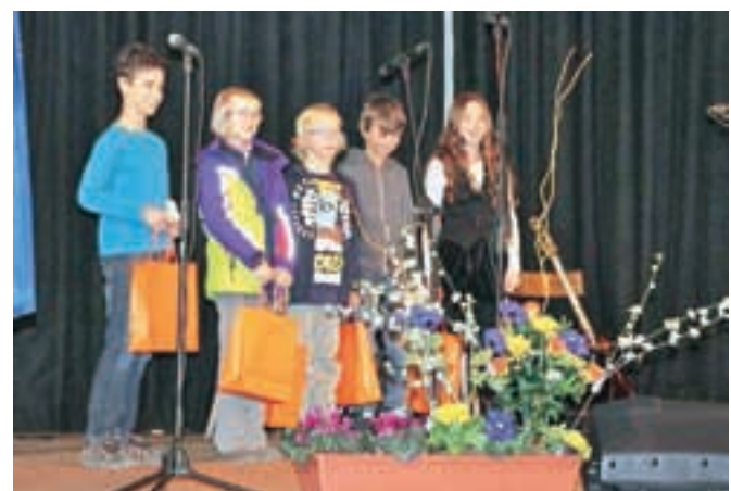
Na prireditvi so nagradili učence, ki so napisali najbolj izvirne spise na temo Joj, šola gori.