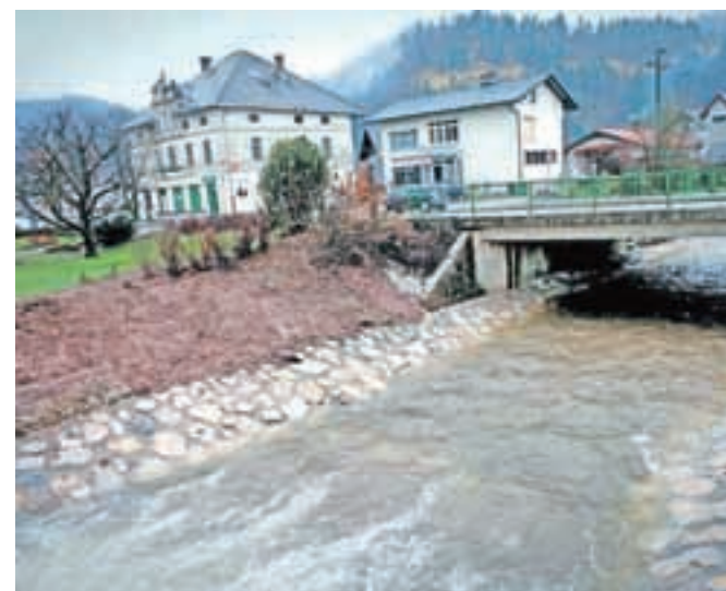
V januarju in februarju so že izvedli nekatera dela v reki Račevi okrog mostu v središču Žirov, s čimer so izboljšali poplavno in erozijsko zaščito.

Stabilizirali so brežine, interventno uredili obrežna zavarovanja in pragove ter odstranili naplavine. Dela so bila vredna 160 tisoč evrov. Do konca maja pa naj bi v okviru akcijskega načrta izvedli še sanacije petih vodotokov, kar bo po ocenah skupaj vredno prek pol milijona evrov. V Martinski grapi bodo uredili obstoječo infrastrukturo, da bi ublažili posledice hudourniške erozije. Na levem pritoku Sore pri Kopišarju in v Zabrežniku nad domačijo Tolar bodo izvedli ukrepe za zadrževanje plavin v zaledju hudournika in preprečitev zasipavanja struge skozi naselje. Za stabilizacijo brežin, ureditev obrežnih zavarovanj in pragov ter odstranitev naplavin bodo poskrbeli še na potoku Rakulk od mostu pri Binetu do konca naselja in v Plastuhovi grapi od iztoka v Račev do zadnjega naselja. Ob tem pa se pri občini nadeja-