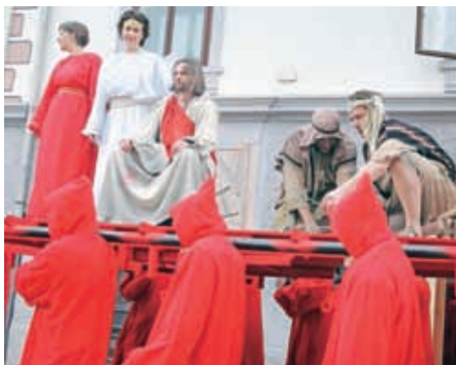
Pasijonski prizori se po prizoriščih pomikajo na odrih, ki jih prenašajo nosači.