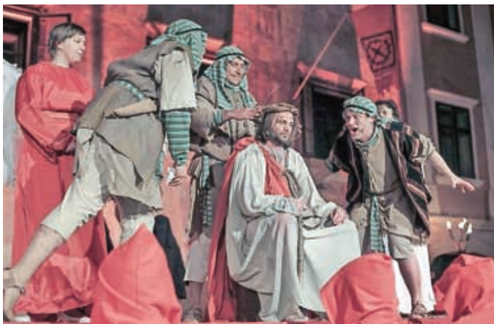
Predstave letošnjega Škofjeloškega pasijona so se začele 21. marca.