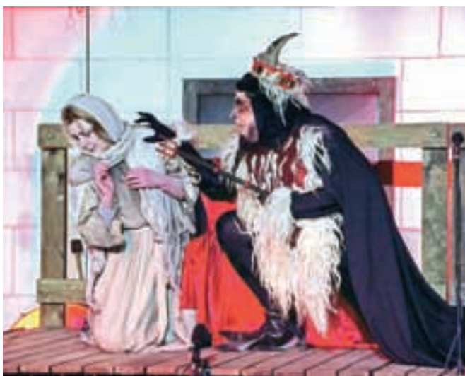
Eden najbolj dramatičnih prizorov z Luciferjem in grešno dušo