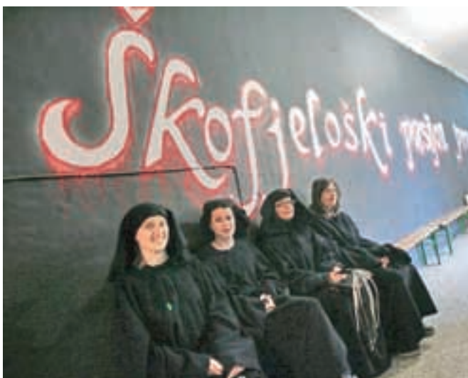
Igralci in statisti se na predstavo pripravljajo v "pasijonskem zavetišču", nekdanji vojašnici.