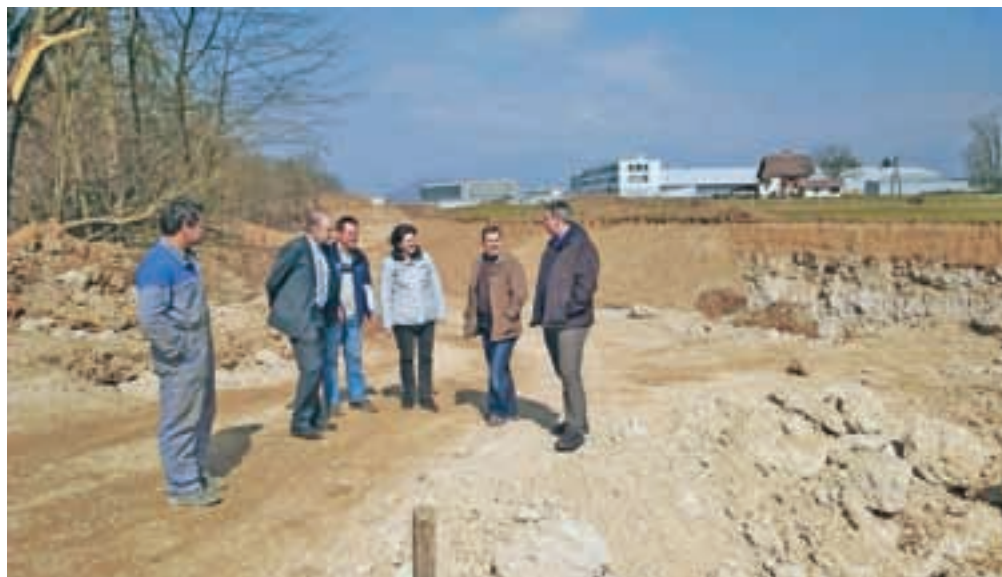
Pri ogledu gradbišča