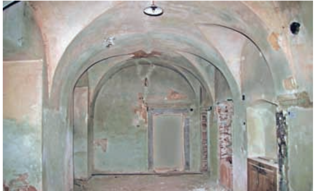
Poslikave v kuhinji so manj bogate kot v poročni sobi, a kljub temu prava paša za oči.