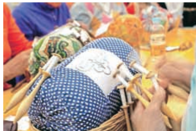
Utrinek z lanskimi klekljarskimi dnevi v Žireh

stem literarnem natečaju, ki nosi naslov Skodelica kave. Literarna dela je na naslov društva Cvetke mogoče poslati do 2. aprila. Letos so prvič razpisali še mednarodni rokodelski natečaj Skodelica kave, v okviru katerega do 20. aprila zbirajo unikatne skodelice za kavo iz keramike, gline ali drugih materialov. Verjamejo, da bo razstava, na kateri bodo predstavili vse prispele izdelke, nekaj posebnega. Pod kavno skodelico pa sodi tudi prtiček, zato so že tretjič razpisali še klekljarski natečaj Prtiček pod skodelico kave. Ob tem pa bodo pripravili tudi dve osnovni klekljarski razstavi. Članice društva Cvetke že od lanske jeseni klekljajo motive iz narave, ki jih bodo predstavile na razstavi Štirje letni časi. Skupaj z mladimi iz čipkarske šole v Žireh pa so iz pozabe obudili žirovske pravljice in jim s pomočjo klekljarskih vdahnilo novo življenje. Tudi le-