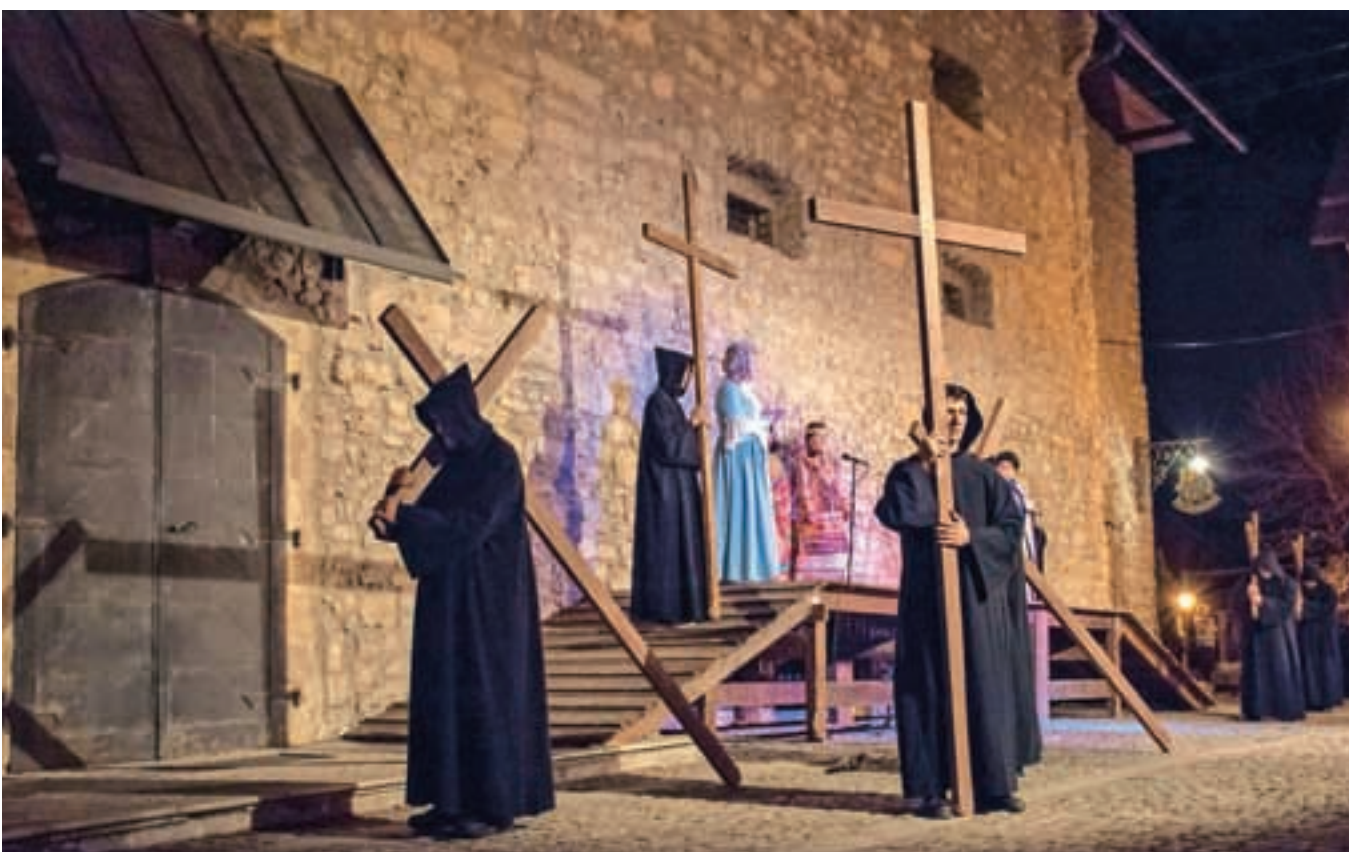
S kutami zakriti skrivnostni križenosci na prizorišču pri Kašči