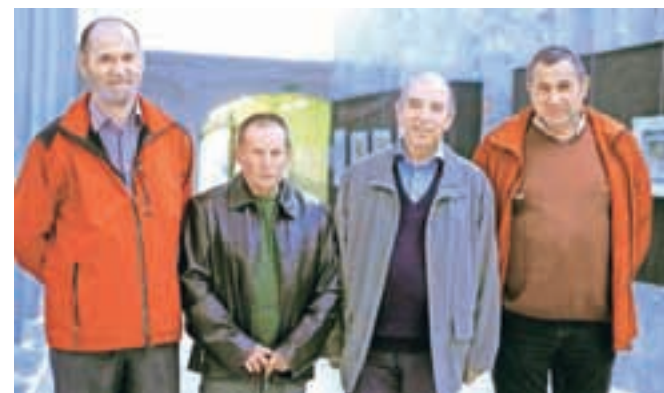
Rekorderji med krvodajalci na Škofjeloškem