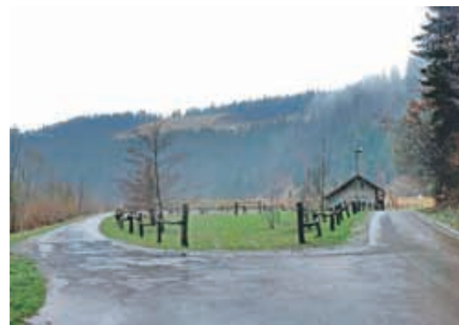
Občinskim svetnikom so na zadnji seji predstavili idejno zasnovo ureditve območja Pustotnika.