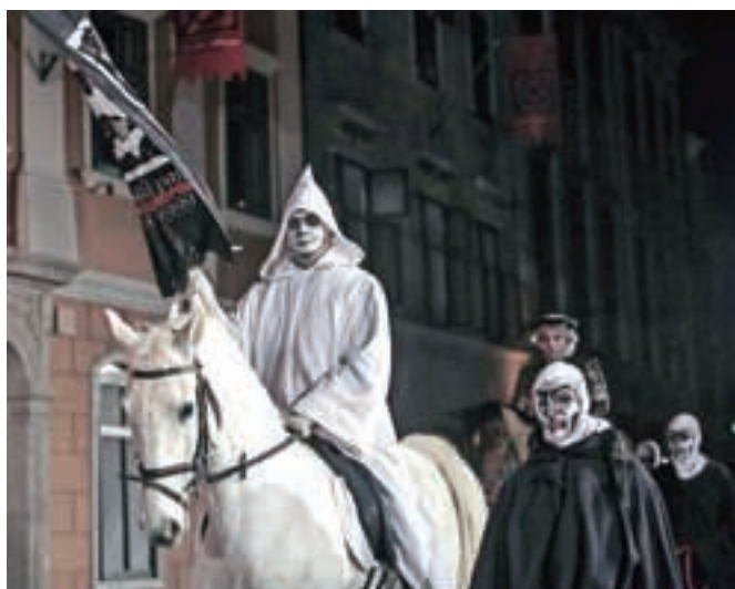
Smrt na konju, ki jaha na čelu pasijonske procesije, nas opominja na našo minljivost ...