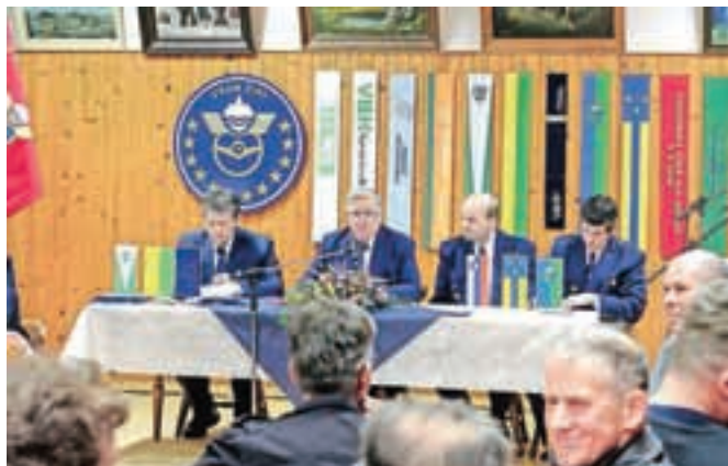
Občni zbor članov ZŠAM Žiri