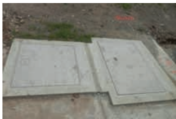
Primarna kanalizacija vključuje omrežje kanalov in pripadajoče objekte, kot so na primer črpališča.