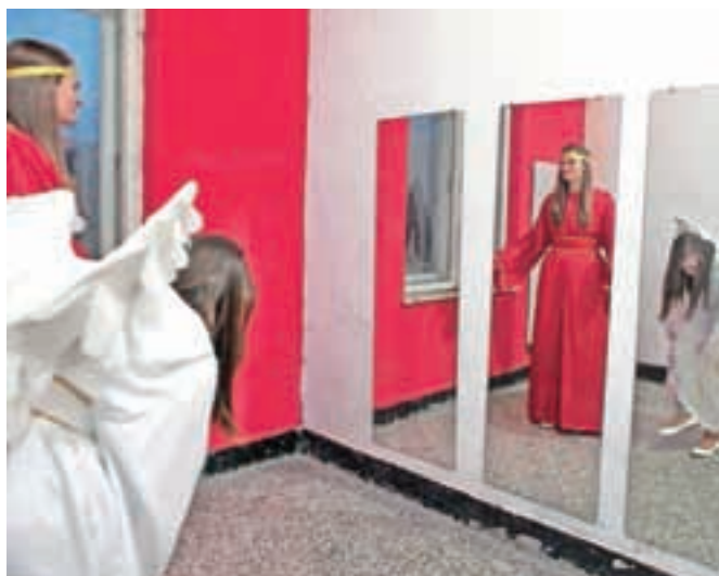
Ko se na svoje vloge pripravljajo angeli.