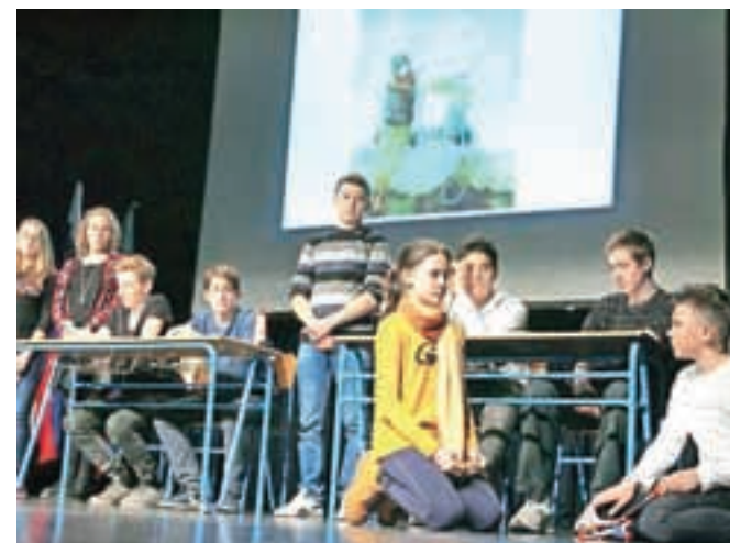
Ena od točk letošnje Rusijade