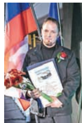
Priznanje Občine je prejelo Planinsko društvo Gorenja vas.