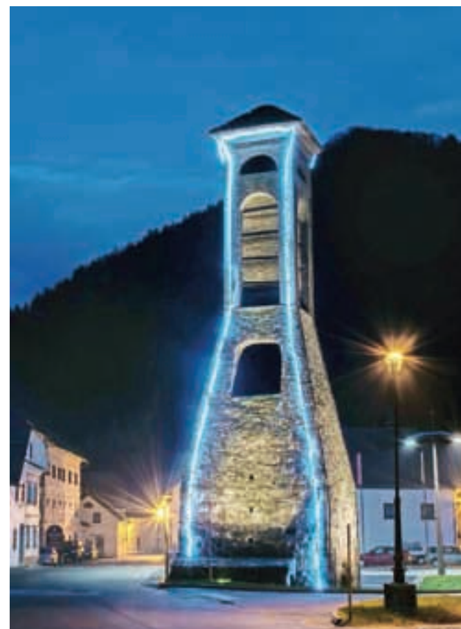
Plavž v Železnikih žari v praznični podobi.

Plavž že dolgo ne žari več zaradi svoje osnovne funkcije, taljenja rude. Danes ta spomenik kulturne dediščine značilno označuje kraj, ki je ime dobil po železovi rudi. Zažari pa še v decembrskih dneh, ko ga osvetlijo v pričakovanju božično-novoletnih praznikov.