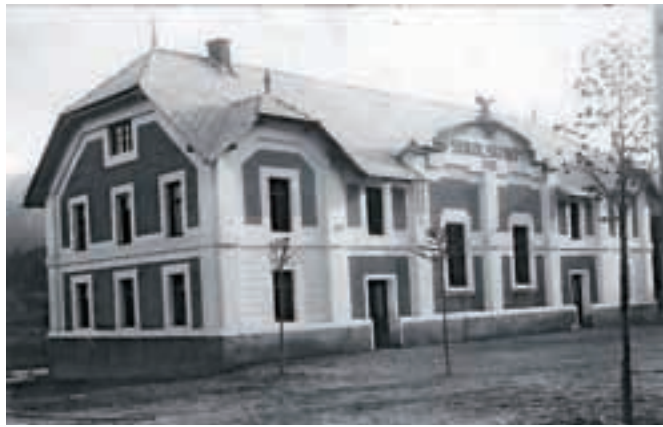
Sokolski dom leta 1921

Po končani energetski sanaciji nekdanjega Doma občine, ki so ga preimenovali v Sokolski dom, zdaj želijo čim prej usposobiti veliko dvorano.