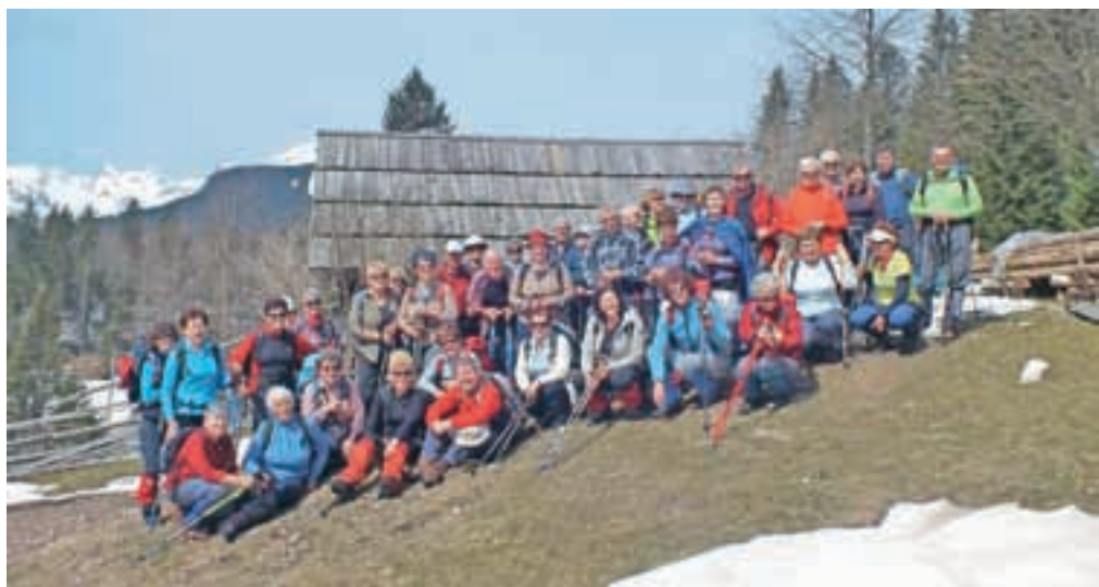
Loški upokojenci so navdušeni planinci in radi hodijo na pohode.

Letos so imeli člani planinske sekcije zadnji pohod na Lubnik, saj so prav s pohodom na Lubnik začeli pred dvajsetimi leti. Jubilej sekcije so proslavili s pohodom in srečanjem pri Skledniku v Žireh.