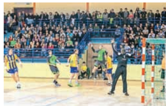
Pred polnimi tribunami so se loški rokometaske na zadnji letošnji tekmi pomerili z ekipo prvakov iz Celje.