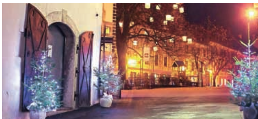
Staro mestno jedro so okrasili z rastočimi smrečicami, ki zvečer osvetljene z lučkami zažarijo v prazničnih barvah.