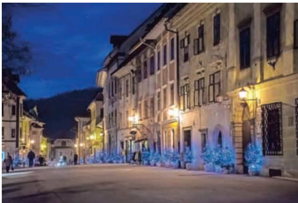
Posebno praznično je mesto zvečer, ko se prižgejo luči...

Na natečaju za pripravo prazničnih prireditev je bilo letos spet izbrano Turistično društvo Škofja Loka, ki skupaj z drugimi organizatorji meščanom in obiskovalcem ponuja niz dogodkov. Čeprav so praznike napovedali že Miklavžev sejem, Loški umetniški festival LUFT in srečanje z vinarji zadnje novembrske sobote, pa so decembrske prireditve zares začeli 12. decembra s koncertom skupine Čedahuči.