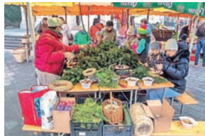
Na "plac" pred cerkvijo je zadnjo soboto v novembru spet vabil Andrejev sejem.