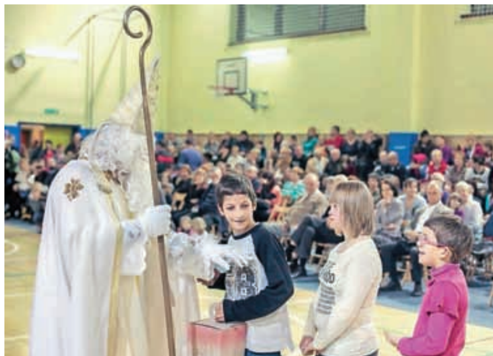
Učenci Osnovne šole Jela Janežiča so se spet razveselili Miklavževga obiska, ki ga jim vsako leto zagotovijo prijatelji iz Rotary kluba Škofja Loka.