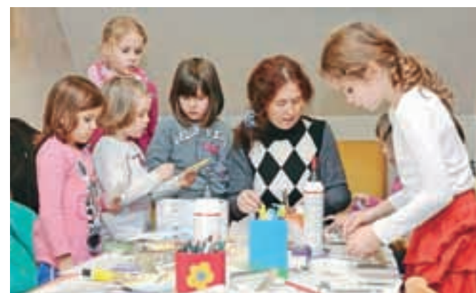
Otroci so na decembrskih delavnicah v knjižnici izdelali okraske za novoletno smrečico.