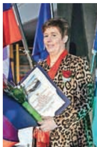
Priznanje Občine je prejelo Društvo podeželskih žena Blegoš.