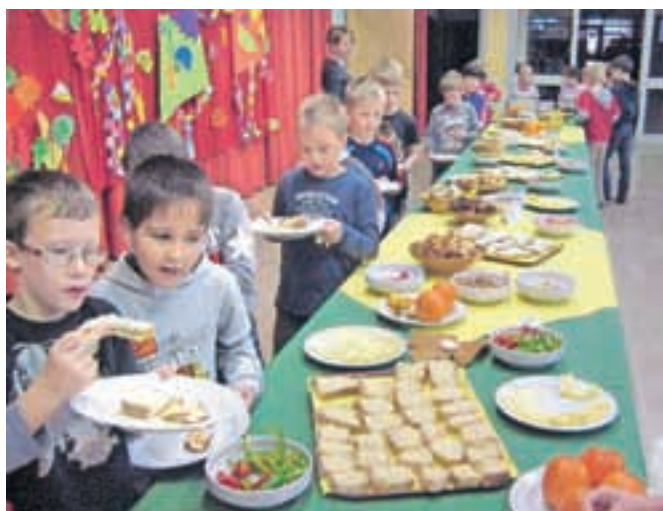
Otroci v gorenjevaški šoli so z užitek posegali po hrani, ki so jo zanje pripravili okoliški kmetje.

vajo, da bi lokalni pridelovalci našli pot v njihovo kuhinjo in jedilnico. "Zato razmišljamo o tem, da bi naročanje hrane pri lokalnih kmetih urejale recimo razvojne agencije. Če bi kmet že vnaprej vedel, da bo moral zagotoviti toliko in toliko jabolč, bi lažje vnaprej načrtoval," je opozoril Selak in dodal, da bi se tako obenem lažje dogovorili za sprejemljivo ceno. S tem se je strinjal tudi župan, ki nalogo občine vidi predvsem pri usklajevanju z različnimi ponudniki. "Le tako bodo naši otroci lahko uživali hrano, ki je jasnega izvora." Zato je bil še toliko bolj vesel ministrovih besed, ko je obljubil poenostavitev postopkov pri javnih naročilih. "Želim si konkretnih premikov, da bi lokalno pridelana hrana našla mesto v naših šolah. Zaenkrat je to še vedno omejeno samo na en dan v letu," je še z obžalovanjem ugotavljal župan.