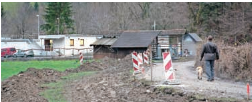
Obnova vodovoda v Železnikih se je začela na Studenem.

Vzporedno z vodovodom delamo tudi kanalizacijo Racovnik. Na tem območju bo zasebnik menjal tudi cevi za hidroelektrarno, položili bomo cevi za optiko, telekomunikacije, električne kable in javno razsvetlavo. Z načrti smo seznanili tudi Toplarno Železniki, da se bo lahko odločila o možnosti vgradnje vročevoda. Do konca decembra bodo pripravljene projekti. Januarja