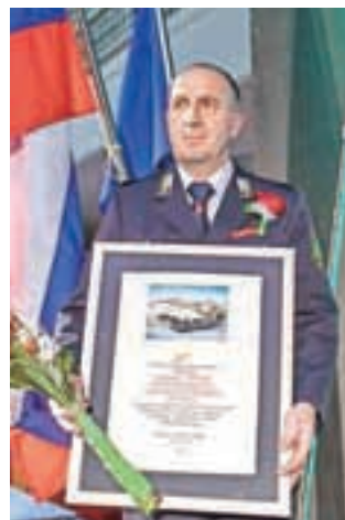
PGD Poljane je prejelo plaketo občine.