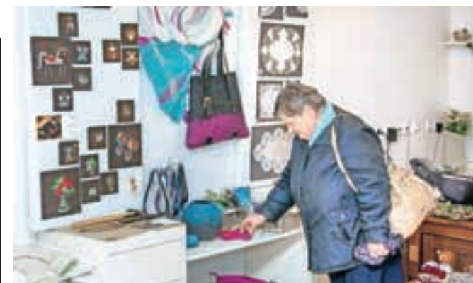
Škofjeloški rokodelci v centru DUO že ves december razstavljajo in prodajajo svoje izdelke, kakšnega pa lahko zadenete tudi z nakupom srečke.