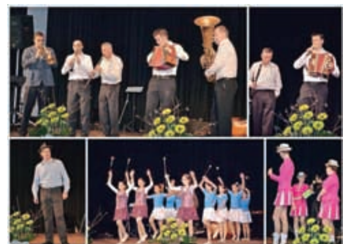
"Venček" nastopajočih na Sončkih dobrote