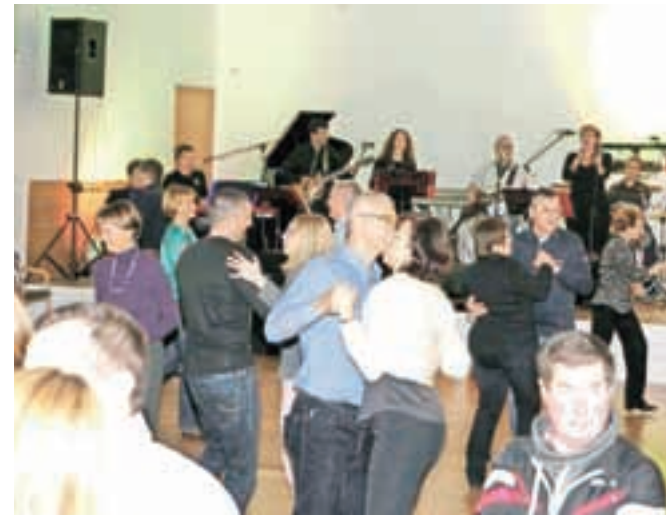
Prireditev Loka pleše naj bi po drugi ponovitvi postala tradicionalna, saj se Ločani radi družimo in tudi zaplešemo.