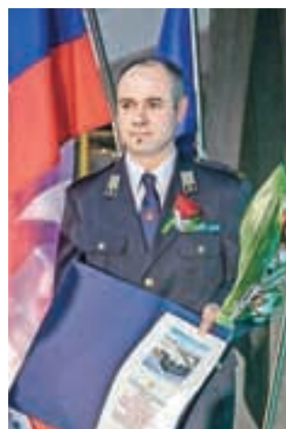
Priznanje Občine je prejelo PGD Sovodenj.