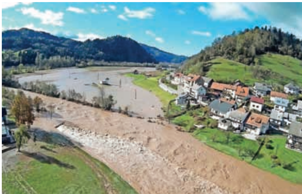
V oktobrskih poplavah zalito kopališče v Puštalu

Škofja Loka – Občinska Komisija za ocenjevanje škode ob naravnih in drugih nesrečah je na podlagi prejetih vlog oškodovancev končala z ocenjevanjem škode na stavreh (kmetijskih zemljiščih, objektih in infrastrukturi), ki je nastala zaradi posledic jesenskih poplav v občini Škofja Loka. Skupna škoda, ki jo je skladno z metodologijo Uprave RS za zaščito in reševanje (URSZR) ocenila pristojna občinska komisija, znaša: 1.571.865 evrov. "Ocenjena škoda po posameznih področjih in kategorijah oškodovancev pa je naslednja: na kmetijskih zemljiščih: 75.630 evrov, uničeni objekti (uničena garaža s skladiščem v Puštalu) 21.749 evrov, delno poškodovani stanovanjski in kmetijski objekti: 178.807 evrov, škoda na občinski cestni infrastrukturi in vodovodu pa 1.295.677 evrov. Dejanska škoda, ki jo je utrpela občina Škofja Loka in vključuje tudi stroške ustreznih sanacij, pa bo predvidoma znašala pet milijonov evrov," je povedal poveljnik Civilne zaščite v občini Nikolaj Kržišnik, ki dodaja, da bo občina interventne stroške poravnala iz proračunske postavke občinske rezerve, obenem pa se bo prijavila tudi na vse razpise, ki jih bodo za sanacijo