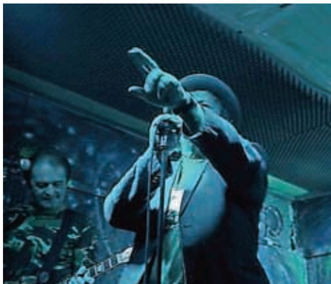
Pankrti se bodo na Ostrigin oder zavihteli v soboto, 27. decembra

co Ekstremno športnega kluba Mungo. Na zadnji letošnji petek dijaki pod vodstvom KŠŠ-ja pripravljajo dijaško zabavo Žuramus, maraton pa se bo na zares veličasten način zaključil v