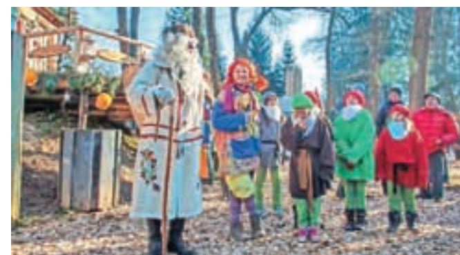
V sosesčini je oživela Pravljična dežela Gorajte, ki otroke vsako popoldne popelje v svet najlepših pravljic. Pride tudi Dedek Mraz.