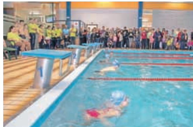
Domači plavalci so s prikazom tehnik plavanja pokazali svoje veščine.