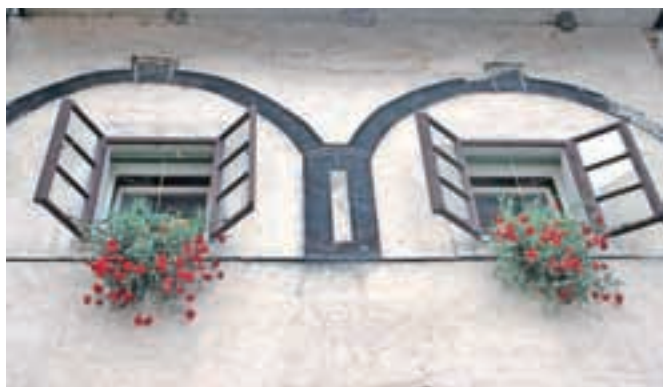
Nageljni na oknih župnišča