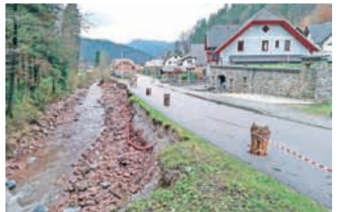
Za sanacijo po poplavah bodo v Žireh potrebovali okrog dva milijona evrov.