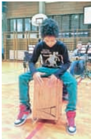
Nova glasbila so učenci tako preizkusili.