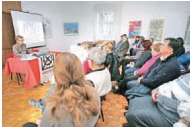
Udeleženci delavnice pasijonskih spominkov