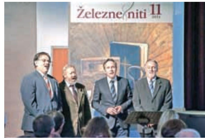
Železne niti so s pesmijo pospremili pevci kvarteta Obzorje.