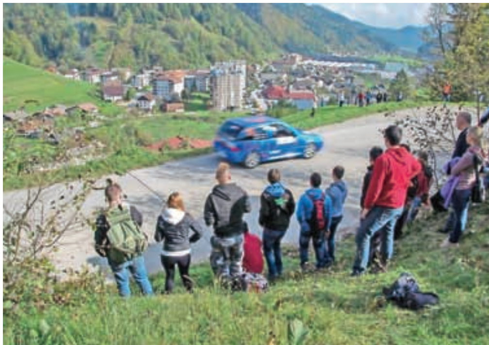
Številni gledalci so uživali ob atraktivnih vožnjah tekmovalcev.