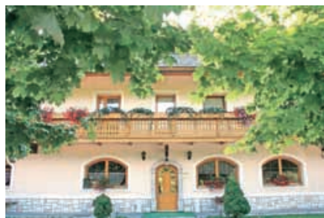
Gostišče Kveder v cvetju in zelenju