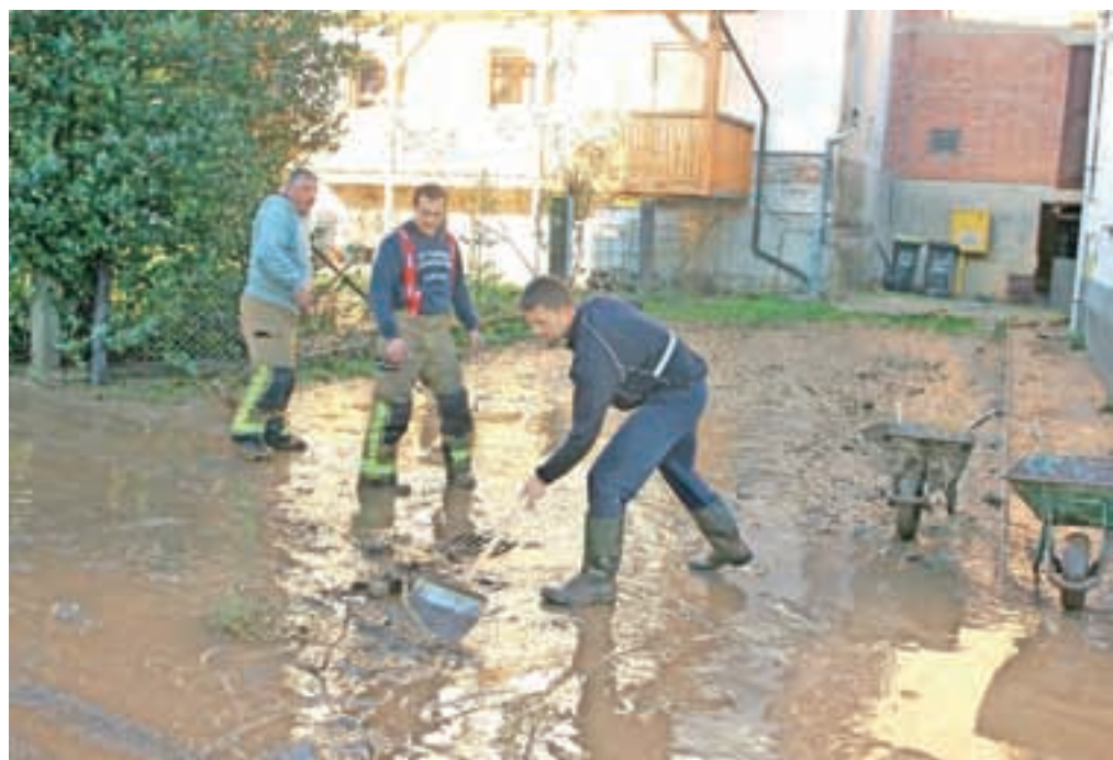
Občani so ob oktobrskih poplavah skupaj z gasilci pospravljali razdejanje.