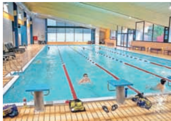
... in znotraj. Na sliki: plavalci PK Ratitovec Železniki med vsakodnevnim treningom

znaki, poskrbljeno je tudi za intervencijske površine.