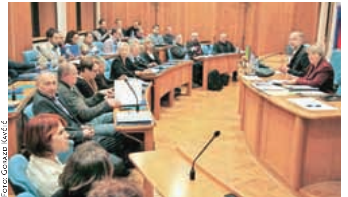
Občinski svet se je sestel že na dveh sejah.