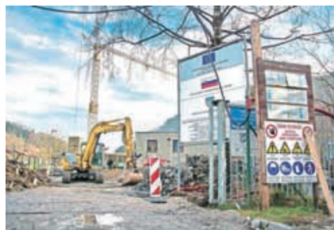
Dela na čistilni napravi v Studenem se končujejo.