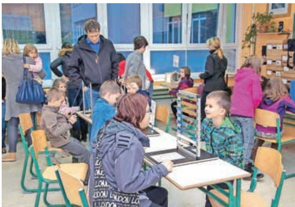
Hiška eksperimentov, dan sproščene znanosti, tudi v Železnikih

član skupine Sandoz, in Telekom Slovenije, je začela pred enim mesecem v Lendavi. Na obisku pri otrocih na OŠ Železniki pa je omogočila, da so lahko