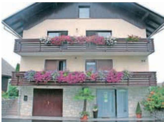
Kmetija družine Cof