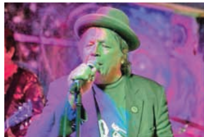
Pankrti se v originalni postavi vračajo s turnejo po slovenskih samoniklih prizoriščih.

»Sam vidim tri ključne elemente, ki so hkrati temelji projekta. Pomemben je povezovalni element, saj projekt poteka v soorganizaciji treh organizacij, ki se jim pridružujejo tudi ostali škofjeloški mladinski in kulturni akterji. Še pomembnejši se mi zdi participativni element, saj je projekt zastavljen tako, da zainteresirana javnost ne bo samo v vlogi kulturnih odjemalcev, ampak bo aktivno soustvarjala program. Potrebno pa je poudariti tudi, da s projektom