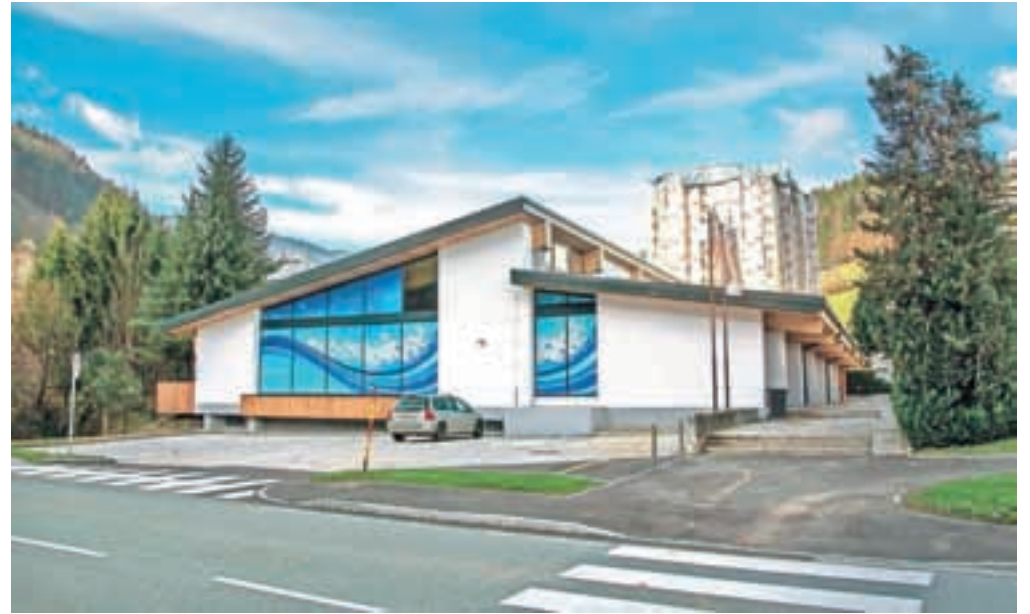
Obnovljeni bazen je lep od zunaj ...

Od 3. novembra, ko se je po krompirjevih počitnicah spet začela šola, v bazenu spet plavajo. Košir še dodaja, da so stavbo tudi statično sanirali, poleg tega pa uredili tudi uvoz k bazenu z regionalne ceste, da je v skladu z zahtevano zakonodajo. To pomeni, da je ožji kot prej, zarisan so tudi talne oznake in postavljeni prometni