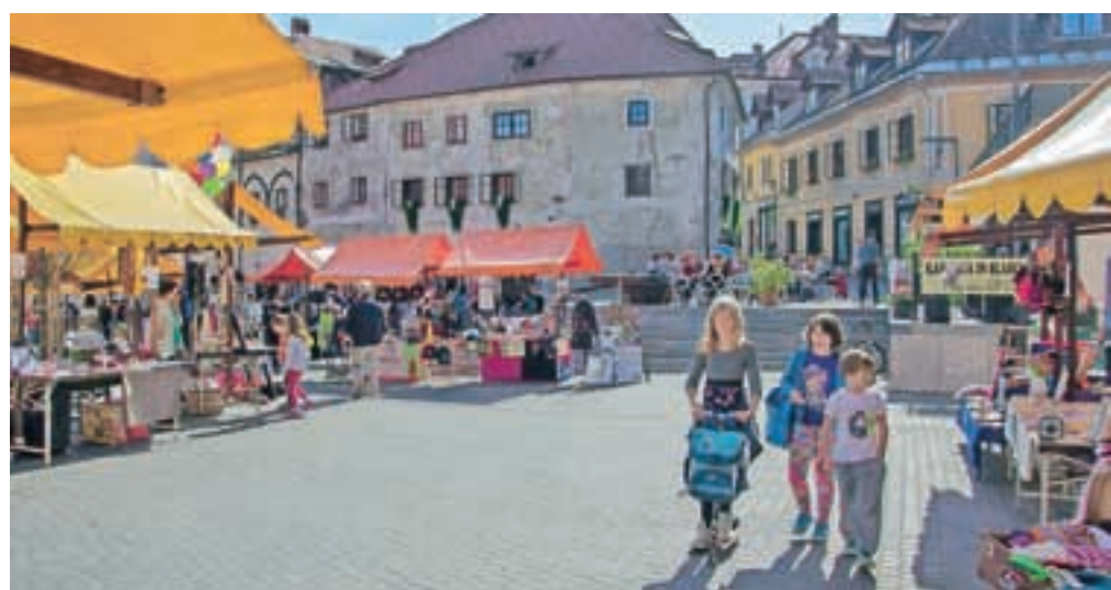
LUFT se je dodobra udomačil na Cankarjevem trgu.

V soboto, 20. decembra, pa bo predbožični LUFT, tokrat od 17. do 22. ure. Še zadnjič v tem letu se bodo na tržnici predstavili ustvarjalci s svojimi unikatnimi izdelki. Spet bo tudi grajska gostija na Loškem gradu. Vmes bo prišel Božiček, zvečer pa glasbena popestritev.