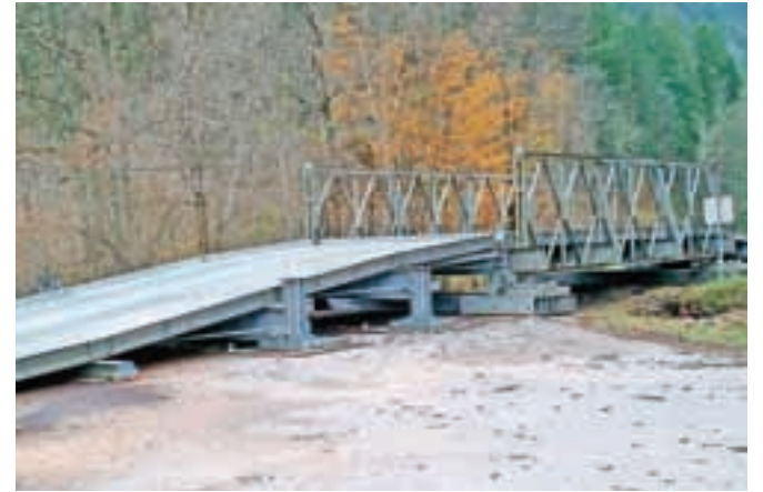
V začetku decembra bodo začeli gradnjo novega mostu na cesti proti Vrhniku, kjer se ta čas promet še odvija po sestavljivem mostu.

Ta čas so se že lotili sanacije plazu na cesti na Breznico, za kar bodo odšteli okrog sto tisoč evrov, prav tako se dogovarjajo za obnovo odseka v Plastuhovi grapi. Pripravljen je tudi projekt za gradnjo novega mostu na cesti proti Vrhniku, kjer so s pomočjo Slovenske vojske začasno postavili sestavljivi most. V kratkem bodo izbrali izvajalca, dela pa naj bi se začela v začetku decembra, ko bodo odstranili montažni most. »V času gradnje bomo namreč poskrbeli za obvoz,« je pojasnil župan in dodal, da so Slovenski vojski izredno hvaležni, da je že v treh dneh omogočila ponovno vzpostavitev prometa na tej cesti, ki je prometno zelo obremenjena.