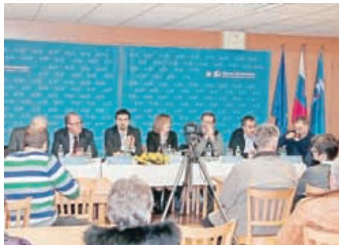
S Srečanja blizu ljudem v Železnikih