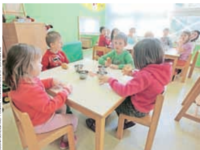
OBČINA GORENJA VAS - POLJANE, POLJANSKA CESTA 87, GORENJA VAS