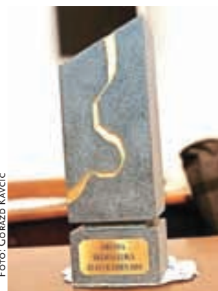
Skulptura zlati kamen bo v Škofji Loki odslej na vidnem mestu.

Ljubljana – Sredi marca so v Ljubljani na tradicionalnih dnevih občin in srečanju županov, ki jih organizirata podjetji Planet GV in SBR, v okviru projekta Zlati kamen že tretjič podelili nagrado za najbolj prodorno slovensko občino. V finalni izbor se je po mnenju strokovnega sveta letos uvrstilo šest občin, nosilk dobrih praks, ki so s svojim delom, razvojnimi prijemi in projekti dober zgled ostalim. Zmagovalka je bila letos Občina Škofja Loka, ki je bila že doslej dvakrat med finalistkami, drugo in tretje mesto pa sta zasedli Ajdovščina in Odranci. Pri Občini Škofja Loka je prepričal pristop, ki je dosledno strateški, uravnotežen,