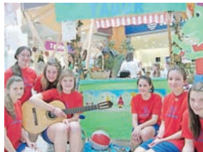
Žirovski šolarji so si zamislili Lintvernov tabor.

Žirovski šolarji so na turistični tržnici 28. festivala Turizmu pomaga lastna glava predstavili Lintvernov tabor.