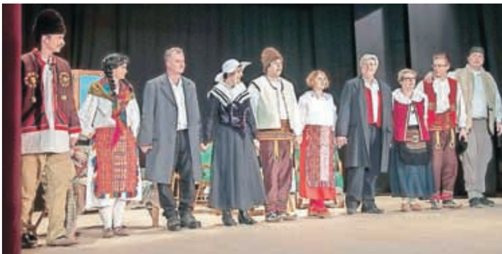
Igralska ekipa KUD-a France Koblar se je še enkrat znova izkazala, konec tedna pa bo Nevidni človek spet na sporedu domačega odra.