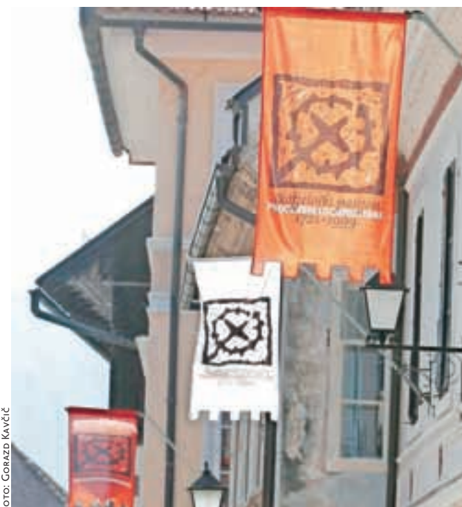
Pasijonske zastave so naznanile začetek pasijonskih dni.