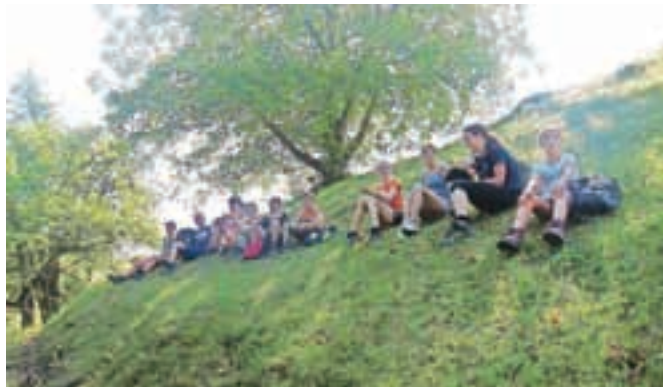
Počitek gasilske mladine po pohodu

PGD Gosteče je lani izvajalo program za aktivno preživljanje prostega časa mladine. Čistilna akcija, pohod, športne igre in božično-novoletne delavnice.