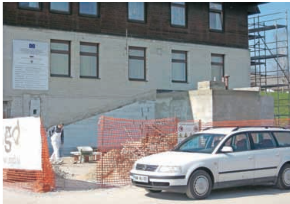
V zdravstvenem domu izvajajo projekt energetske sanacije.

tega bodo dobili povrnjenih približno tretjino sredstev za energetska sanacijo, v okviru katere so na novo uredili fasado. Lotili so se še energetske sanacije zdravstvenega doma, pri čemer so že izvedli nekatera rušitvena dela in pripravili prostor za gradnjo dvigala, s katerim bodo nadomestili zunanje stopnice. Naložba bo vredna okrog štiristo tisoč evrov, od tega bodo polovico odšteli za energetska sanacijo, v okviru katere bodo obnovili fasado in vgradili toplotne črpalke.