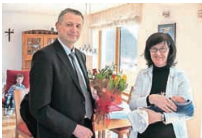
Županov šopek za mamico trojčkov