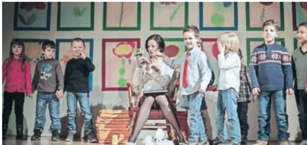
Otroci iz škofjeloških vrtcev na prireditvi Iz majhnega zraste veliko

"Rdeča nit prireditve je bil lik ženske skozi vsa življenjska obdobja, od majhne deklice iz njenega prvega, najbolj brezskrbnega obdobja, prek vseh dekliških preizkušenj, prek materinstva in najbolj inti-