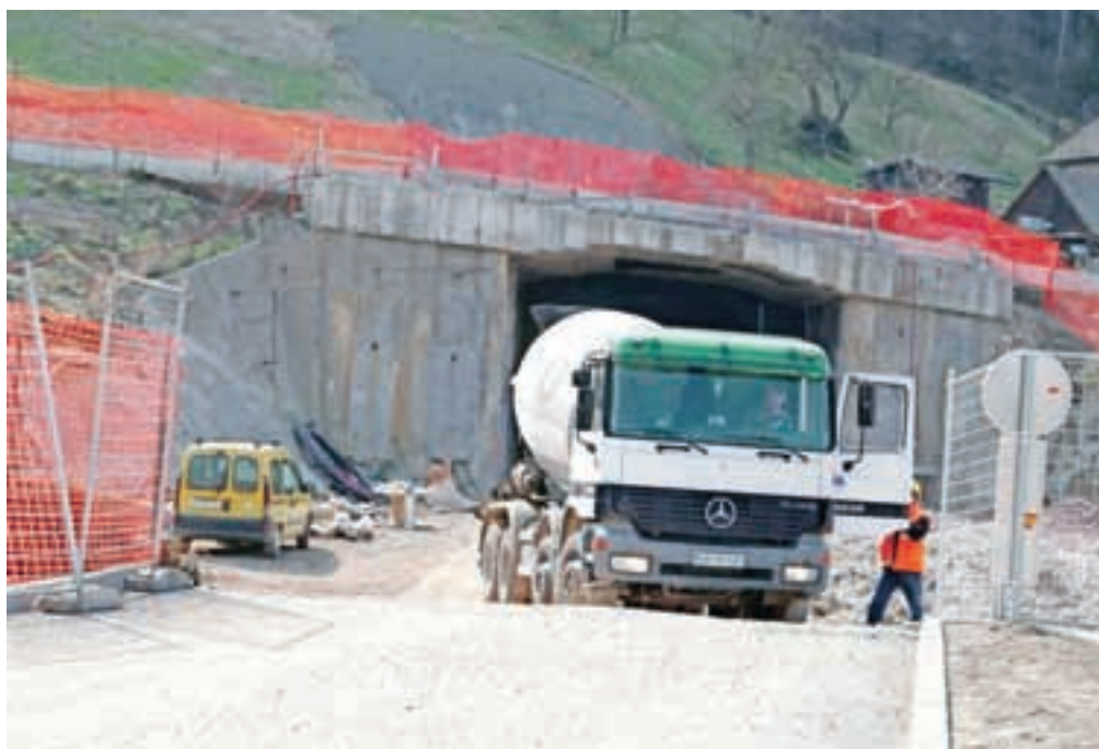
Gradnja škofjeloške obvoznice od februarja naprej pospešeno poteka.

Prvi od ukrepov je istočasno izvajanje gradbenih del na severnem in tudi južnem portalu predora Sten, zatem uvedba 24-urnega delavnika v predoru, ki je zaradi narave dela in uporabe specifične opreme v predoru tudi najbolj primeren, saj se zaradi zamud ob ustavitvi in ob ponovnem vsakodnevem zagonu predorske mehanizacije močno podaljša končni rok izvedbe predora. Predvidoma bodo gradbena dela potekala v 24-urnem delavniku od štiri mesece na južnem portalu in nato še dva meseca na severnem portalu predora. Izvajalec