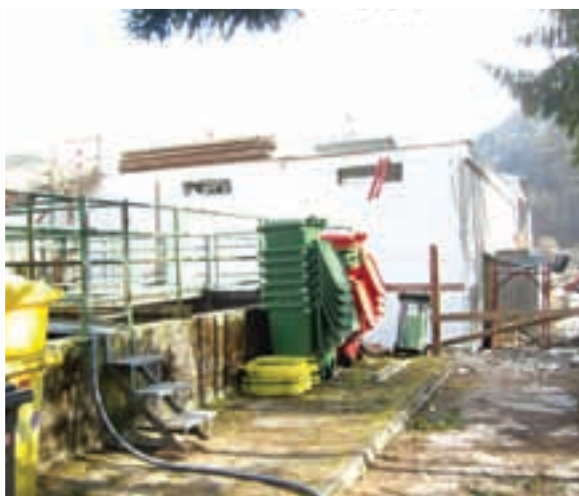
Zaključek I. faze gradnje Čistilne naprave Železniki in začetak poskusnega obratovanja bosta predstavljena na novinarski konferenci.

Gradbena dela I. faze so zaključena. Dokončana je armirano betonska konstrukcija, zgrajena sta dva SBR reaktorja (ang. Sequence Batch Reactor, kar pomeni Saržni Biološki Reaktor), bazen za očiščene vode, bazen odvečnega blata, prostor za dehidracijo, prostor za kompresor in bazen očiščene vode z UV dezinfekcijo. Postavljena je tudi nova transformatorska postaja. Na vseh teh objektih se v tem času izvajajo strojno inštalaterska in preostala gradbena dela. S tem se v skladu z načrti zaključujejo gradbena dela I. faze.