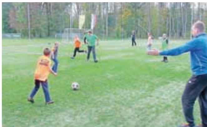
Otroci so pri gibanju porabili veliko energije, a nič za to!