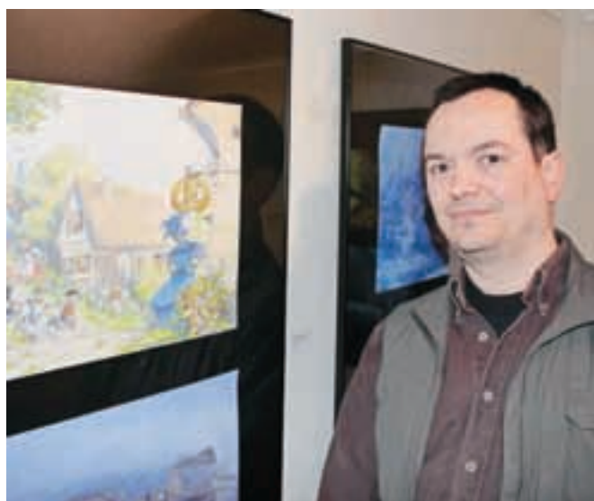
Pekarna Mišmaš je zagotovo ena najbolj branih in gledanih slikanic tandema Gorazd Vahen–Svetlana Makarovič.

Svetlana Makarovič. Z njo je sodeloval pri sedmih slikanicah. »Super sva sodelovala, ob njej sem se tudi naučil, da je tisto, ker iskreno čutim, ko ilustriram, tudi edino pravo razmišljanje,« je o svojem delu dejal Vahen in dodal: »Najti moram pravo razmerje med ilustracijami za dušo in tistimi za zaslužek, dobro pa je ob sebi imeti tudi razumevajoče družinske člane.«