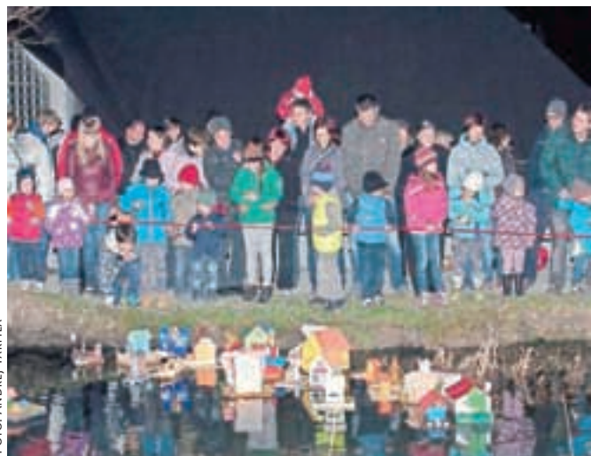
Pri Plnadi v Železnikih so na gregorjevo vrgli luč v vodo.

Železniki – Tudi v Železnikih, kjer je doma kovaška tradicija, je navada, da na gregorjevo spustijo po vodi osvetljene makete hišk in s tem simbolično naznanijo daljšanje dneva. Gregorjevo je dobilo ime po svetniku Gregorju Velikem (okoli 540–604), ki prinaša luč ter pozdravlja sonce in pomlad. Na 12. marec naj bi bilo že toplo in dovolj svetlo, da kovači pri svojem delu niso potrebovali več svetilk, v pozdrav pomladi pa so v potok metali goreče predmete, na kar nas spominja še danes živa šega spuščanja razsvetljenih ladjic in hišk. Na predvečer sv. Gregorja je Turistično društvo Železniki povabilo k Plnadi, kjer so spustili v vodo gregorčke, lične izdelke železnikarskih šolarjev.