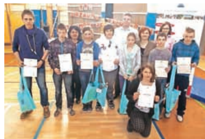
Mladi računalničarji so se tudi tokrat izkazali in prejeli zaslužena priznanja.