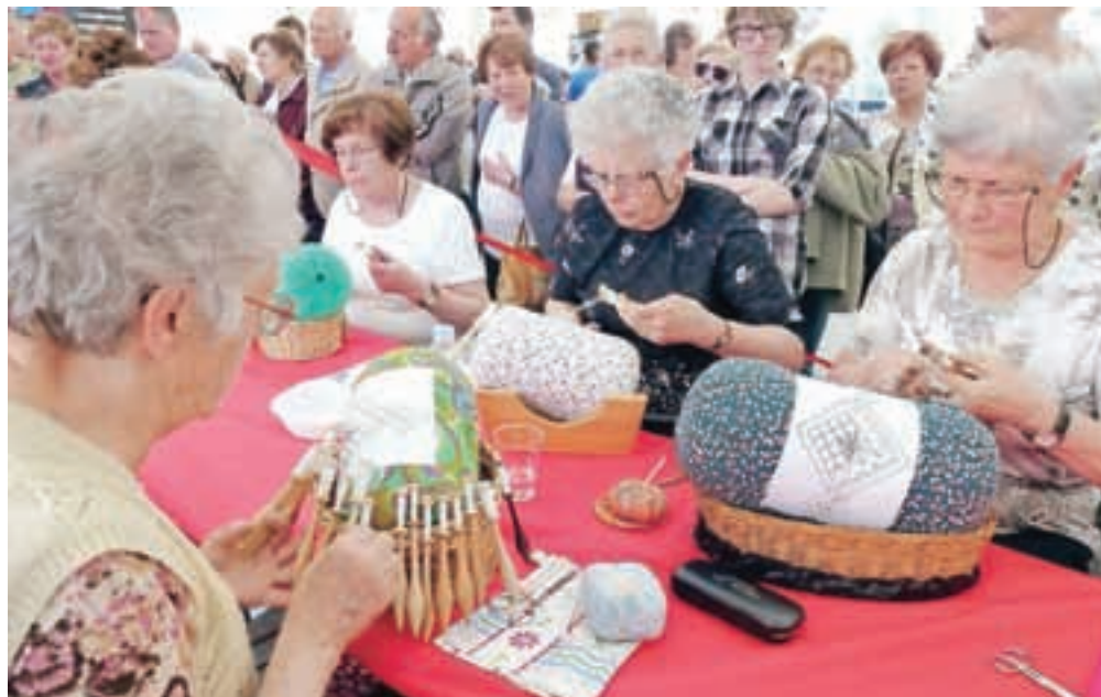
Z lanskega tekmovanja klekljaric