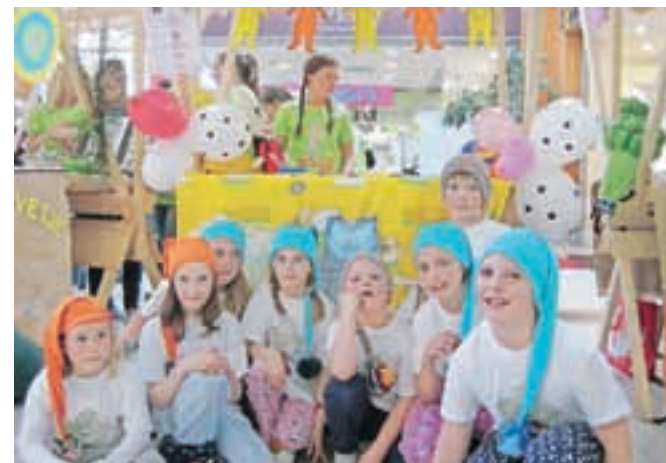
Učenci podružnične šole Javorje vabijo na »pižama žur«.

Naravo, so razmišljali učenci, namreč že imajo, in to na dosegu roke. Torej rabi-jo le še zabavo, kar so povežali z enim od največjih in najtežje pričakovanih dogodkov na njihovi šoli, to je zabavo v pižamah. Skupaj z Javorčkom so si tako zamislili športne igre in dejavnosti ob raziskovanju narave. Učenci podružnične šole Sovodenj pa so pripravili zabavo v naravi, v okviru katere so se za dan in pol spremenili v zvedave škrate. Letos so namreč naredili načrt za podaljšan čas bivanja v naravi na dan in pol. Že utečenemu pohodu ob nekdanji rapalski meji so tokrat dodali še popoldanske in večerne aktivnosti v okolici planinske kočice na Ermanovcu, nočitev v koči in dopoldanske dejavnosti. Idej za zabavne aktivnosti v naravi jim vsekakor ne zmanjka.