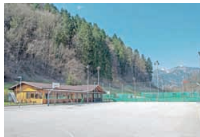
Športni park Rovn