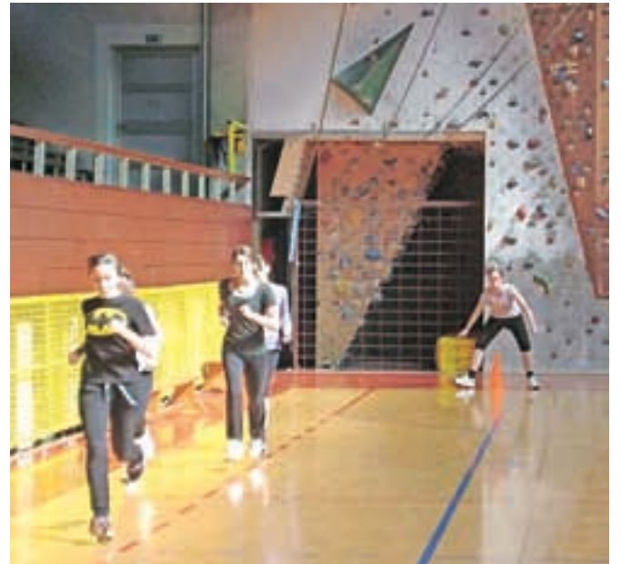
Šport je med žirovskimi šolarji zelo priljubljen.