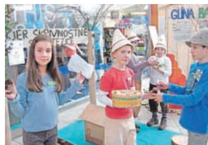
Sovodenjski osnovnošolci so se spremenili v zvedave škrate.