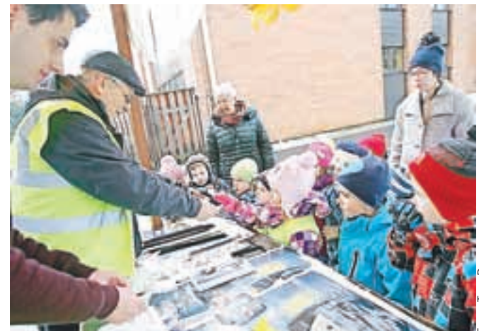
Otroci so pozorno prisluhnili preventivnim napotkom.

Škofja Loka – V Škofji Loki so tokrat na območju Podlubnika v okviru nacionalne akcije Bodi previden – PEŠEC pripravili terensko akcijo, namenjeno najbolj ranljivim udeležencem v prometu. To so otroci, mladostniki in starejši ljudje, ki so jih ob tej priložnosti želeli ozavestiti za pravilno ravnanje na cesti, zlasti za pravilno prehajanje nevarne državne ceste v Podlubniku. Preventivna akcija je bila del sprejetega programa Sveta za preventivo in vzgojo v cestnem prometu Škofja Loka za leto 2014 in je usklajena s policijo in škofjeloškimi šolami potekala ob sodelovanju še nekaterih drugih organizacij. Na stojnicah so delili preventivno gradivo in odsevne trakove.