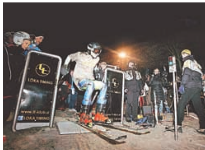
Prireditev ob druženju mladih smučarjev se je na hribu pod Loškimi gradom začela z atraktivnim petkovim nočnim paralelnim slalomom.