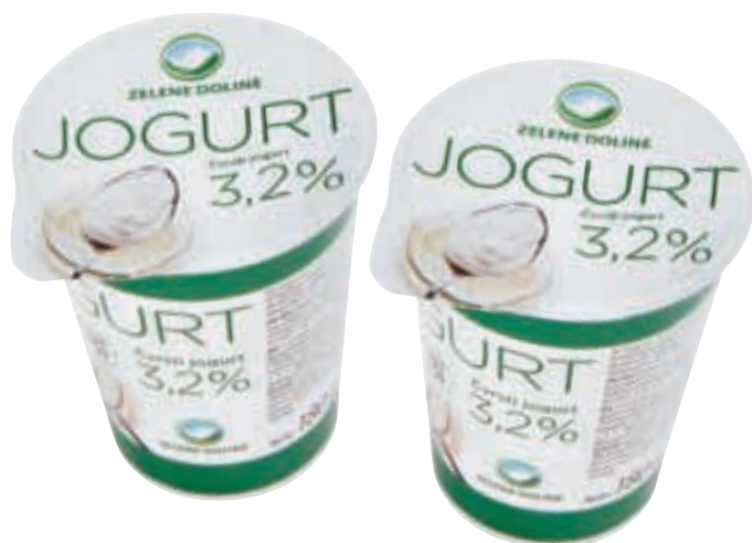
Navadni jogurt 3.2% m.m., Zelene doline, 180 g