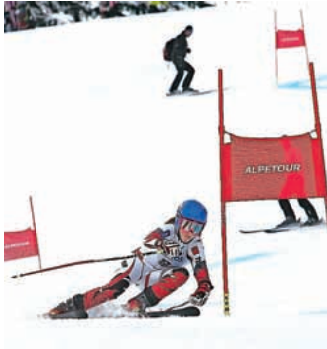
Na zahtevnih terenih Starega vrha so se pomerili mladi smučarji in smučarke iz kar štiriintridesetih držav, nekateri med njimi so tudi bodoči šampioni.

Na drugo mesto se je s 156 točkami uvrstila ekipa Nem-