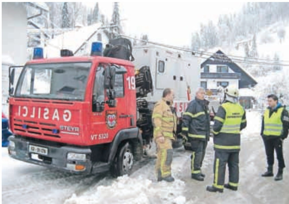
Dobava zmogljivih agregatov za zagotavljanje preskrbe z električno energijo je bila ena glavnih skrbi v prvih dneh ujme.