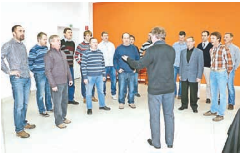
Pevci moškega pevskega zboru Alpina tudi, kadar niso na koncertnem odru, radi zapojejo. Pobi se skup zbirajo je bila tokrat ravno prvašnja.

»Začeli smo pred novim letom s tradicionalnim devetim novoletno božičnim koncertom v rovih utrdb Rupnikove linije na Žirovskem vrhu, ki smo ga ubrali z veselimi pesmimi in s tem naznanili jubilejno leto. Nadaljevali bomo s koncertom 3. maja, ko bomo v okviru klekljarskih dnevov nastopili skupaj z zborom iz francoskega mesta Framming-Merlebach. Konec avgusta bo na vrsti promenadni koncert na prostem, sodelovali pa bomo z dramsko skupino DPD Svoboda, sredi septembra pa je na nas vrsta za organizacijo srečanja pevskih zborov iz mest z usnjarsko tradicijo. Za osrednji koncert 23. oktobra pripravljamo bogat pevski program, saj bomo peli tako ljudske pesmi kot zahtevne zborovske skladbe, na koncu pa še nekaj zabavnih. Praznično leto se bo zaključilo tam, kjer se