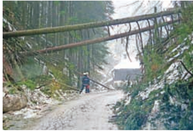
Na Sovodnju je poškodovana več kot polovica dreves.