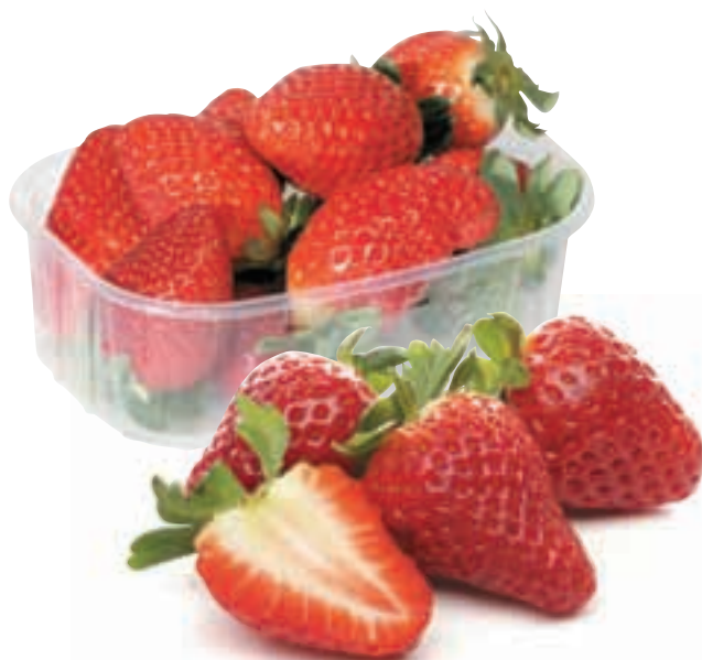
Jagode pakirano, 250 g