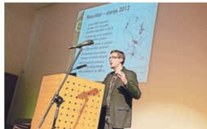
Mladi z Biotehniške fakultete so predstavili diplomske in magistrske naloge.

Škofja Loka – Biotehniška fakulteta iz Ljubljane in Občina Škofja Loka sta februarja pripravili Jesenkovo popoldne, s katerim se spominjata prof. dr. Frana Jesenka (1875–1932), v Škofji Loki rojenega in po vsej Evropi uveljavljenega botanika, ljubitelja narave, planinca in smučarja, soustanovitelja Triglavskega narodnega parka in enega od pionirjev slovenskega smučarskega športa. Biotehniška fakulteta vsako leto podeljuje Jesenkova priznanja za izjemne dosežke na področju biotehniških ved. Že tretje leto pa v Škofji Loki pripravljajo Jesenkovo popoldne, namenjeno promociji naravoslovnih znanosti, kjer imajo osrednjo vlogo diplomanti. Predstavijo namreč izbor diplomskih in magistrskih del z vseh oddelkov in študijev Biotehniške fakultete.