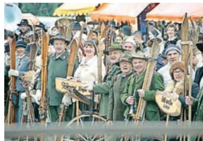
Starodobni smučarji s svojo slikovito opravo

po starem, kar sicer tudi počnejo vsako leto maja. Progo, na kateri je bil namesto snežne beline rjavkast sneg, navožen z Mestnega trga in drugih loških ulic in ki so jo dva dni in dve noči pripravljali skupaj s Smučarskim klubom Alpetourom, organizatorjem Pokala Loka, je med tekmovanjem močil dež. Toda ne Rovtarji ne starodobni smučarji iz drugih osmih klubov (med njimi tudi avstrijskega) se niso dali. Pogumno so zaplužili v smučino in obiskovalcem pokazali svojo starodobno smučarsko tehniko in opremo, ki sodi zraven. Resda je bilo na startu samo enainštirideset tekmovalec (domači Rovtarji so se