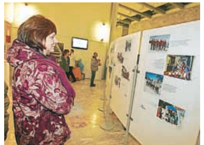
V Sokolskem domu so ob letošnjem 39. pokalu Loka pripravili priložnostno razstavo z naslovom Utrinki iz zgodovine loškega smučanja.