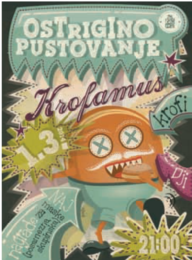
Žuramusovci prirejajo tudi Ostrigino pustovanje

"Oboje. Začeli smo z istoimenskim dogodkom, vzporedno pa se je formirala tudi ekipa, ki za zdaj pripravlja dogodke predvsem za srednješolce. Tako bomo v letošnjem letu v Ostrigi pripravili še en Žuramus, zaupana