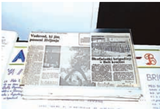
O škofjeloških brigadirjih je v sedemdesetih letih pisal tudi Gorenjski glas.