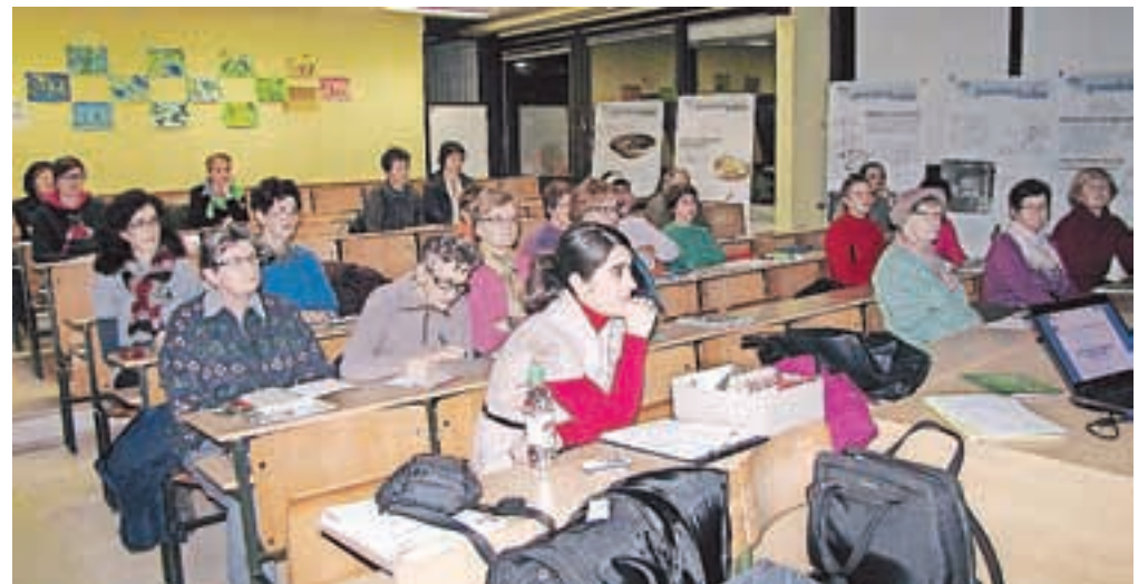
V Žireh so slušatelji z zanimanjem prisluhnili predavanju o semenih in kalčkih.

so na srečanju namenili vzgoji kalčkov, ki je enostavna in za manjše količine, ki jih uporabljamo doma, tako da ne potrebujemo posebne opreme. Kalčki so izjemno hranilni in vsebujejo posebne zdravilne snovi. Pri izbiri semen naj bodo gojitelji pozorni na to, da niso obdelana s kemikalijami. Najbolje je uporabiti ekološka semena, namenjena kaljenju, ki jih dobite v semenarnah, vrtnih centrih ali trgovinah z zdravo prehrano.