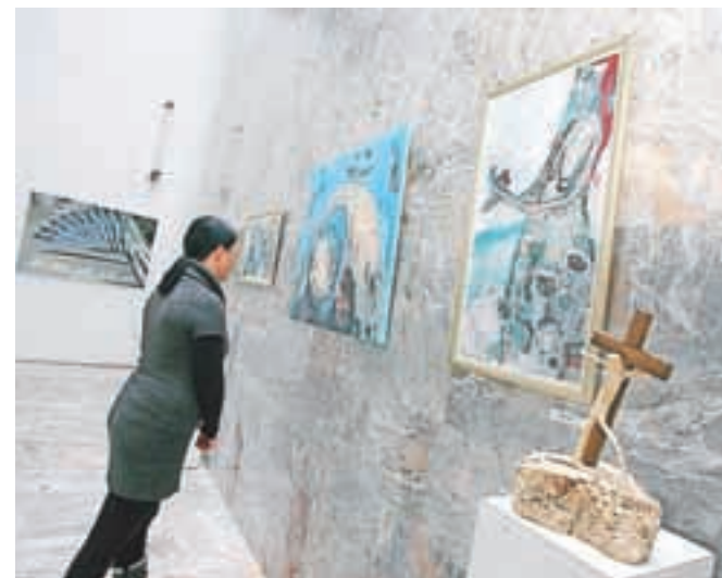
V Sokolskem domu so razstavili likovna dela puštalski likovni ustvarjalci.