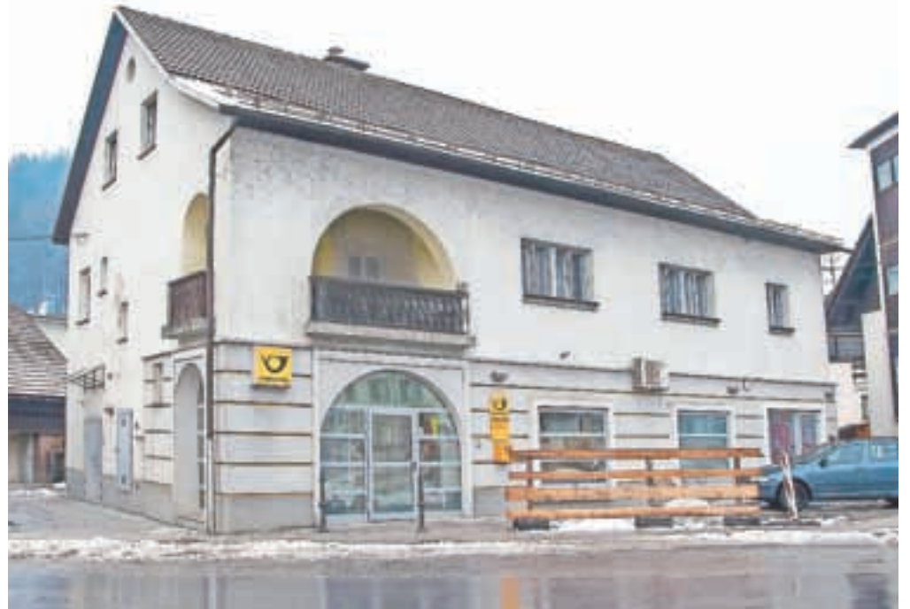
Pošta v Selcih

Kolikšno težo ima pri poslovnih odločitvah Pošte Slovenije mnenje lokalnega prebivalstva in kaj se bo po njej zgodilo s poslovalnico v Selcih, smo vprašali direktorico kranjske enote Barbaro Galičič Drakslar. Pojasnila je, da je projekt optimizacije poštne omrežja ter s tem načrtovano preoblikovanje stalnih pošt v pogodbeno v skladu z napovedmi razvoja poštne in širšega poslovnega okolja ter v skladu z zastavljenimi dolgoročnimi strateškimi razvojnimi smernicami Pošte Slovenije. Slednja naj bi v prihodnjih letih preoblikovala okoli 150 pošt. »Preoblikovanje stalnih pošt v pogodbeno narekuje upadanje števila določenih poštne storitev zaradi