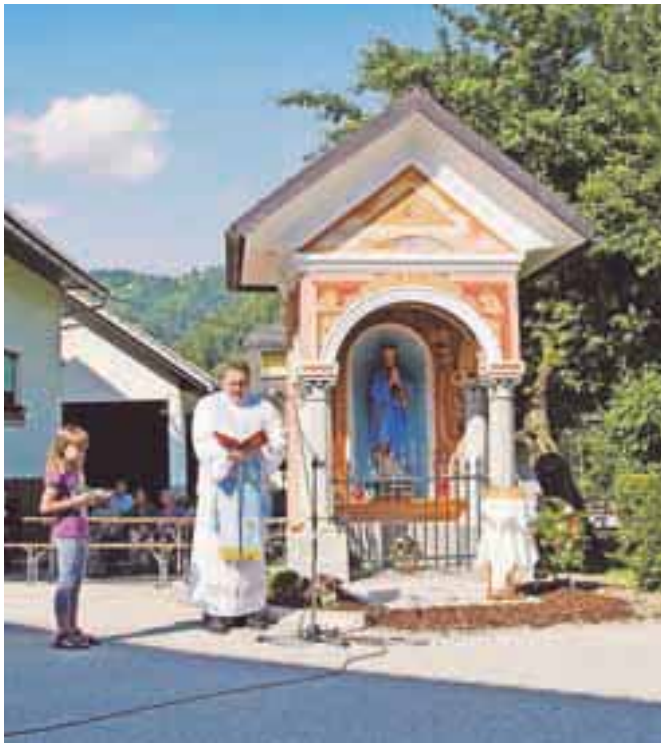
Blagoslov obnovljene kapelice na Praprotnem