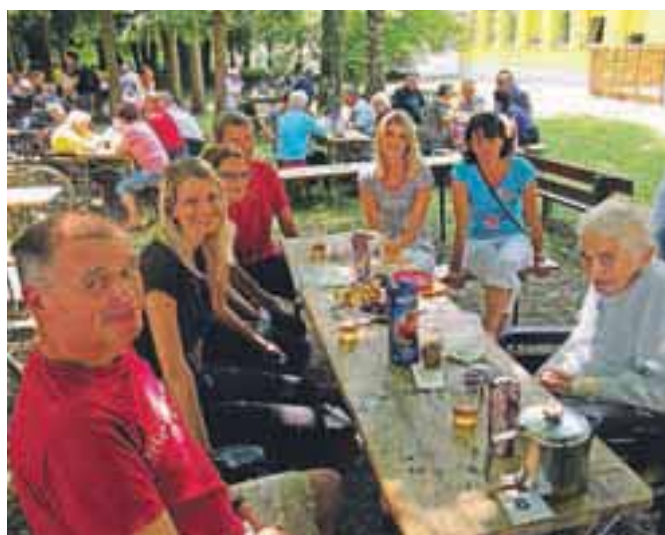
Druženje več generacij