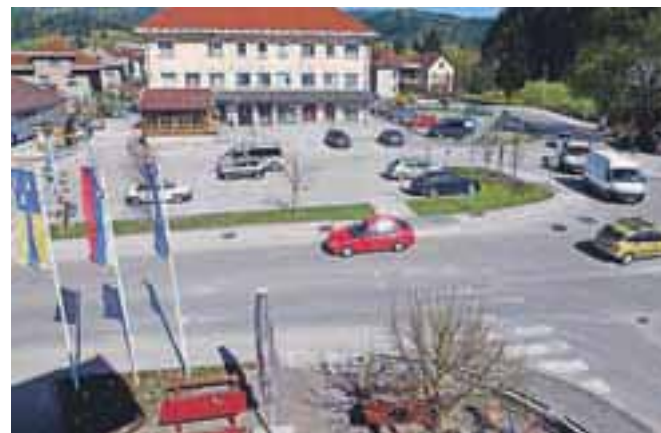
Center Žirov bo občina skušala urediti s pomočjo skupnega projekta z ureditvijo Stare šole.

Pred meseci predstavljeni koraki za ureditev centra Žirov bodo na občini v prihodnjih mesecih morda le lahko uresničili. Občinski svetniki so podprli izhodišča, ki so jih pripravili mentorji in študenti Fakultete za arhitekturo Univerze v Ljubljani, prvi koraki pa so prej izvedljivi tudi zato, ker ne zahtevajo veliko denarja. Na občini pripravljajo za izvedbo projekt zunanje ureditve Stare šole (Muzej Žiri), kjer bi lahko del denarja (in s tem projekta) namenili tudi za center Žirov. B. B.