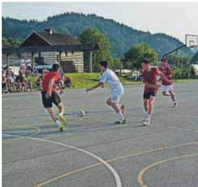
Nogometaši so se v hudi vročini na celodnevem turnirju dobro preznobili.