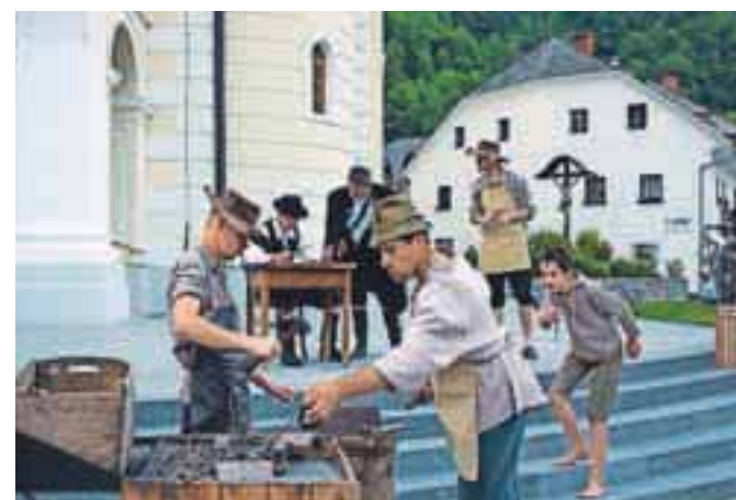
Igra pripoveduje o ustanovitvi župnije v Železnikih in življenju fužinarjev. / FOTO: ANDREJ TARFILA

V igri nastopa 13 igralcev, skupaj s statisti pa je nastopajočih okoli 30. Kot je pojasnil režiser Robert Kuhar, so se zbrali šele pred dvema mesecema, zato so vaje zelo intenzivne in potekajo skoraj vsak dan. Večina igralcev je istih kot v igri o življenju žebjarjev in tovornikov, s katero so navduševali leta 2007. »Vključil sem tudi mlajše igralce, nekaj jih bo na odru prvič in upam, da gledalci ne bodo prekritični, če bodo naredili kakšno napako,« je dejal. Dodal je še, da je že ob nastajanju igre