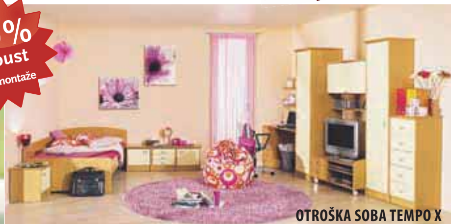
OTROŠKA SOBA TEMPO X