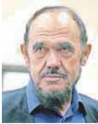
Miro Kačar bo postal častni občan.

Dogajanje ob občinskem prazniku bo vrhunec doseglo v nedeljo ob 20. uri s slavnostno akademijo v športni dvorani v Železnikih, na kateri bodo podelili osem občinskih pri-