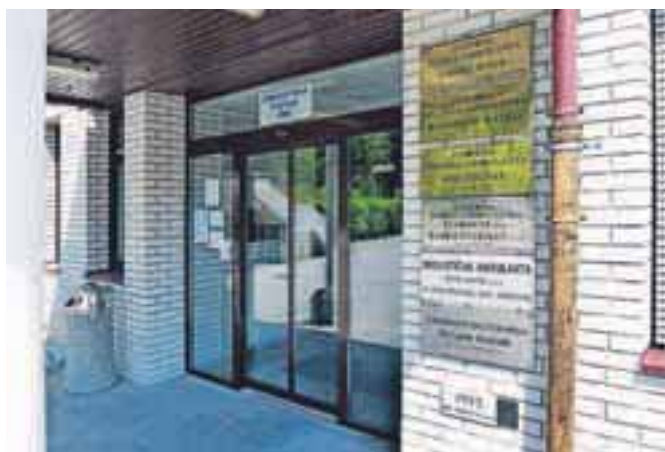
Žirovci so nadpovprečno nezadovoljni s kakovostjo zdravstvenih storitev.

Skoraj polovica Žirovcev je bila zadovoljnih ali zelo zadovoljnih z zadnjim obiskom pri zdravniku, tretjina bi zdravnika priporočila prijateljem in znancem, 36 odstotkov nima razloga, da bi