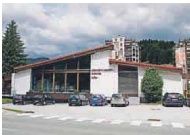
Ponudb zasebnih investorjev za nadzidavo bazena za zdaj še ni.

Gradbeni odbor je sicer pripravil predlog obnove bazena s tremi variantami. V prvi bi poleg energetske sanacije obnovili in nadgradili bazenski kompleks, kar je okvirno ocenjeno na 1,5 milijona evrov. V drugi varianti bi statično sanirali objekt ter