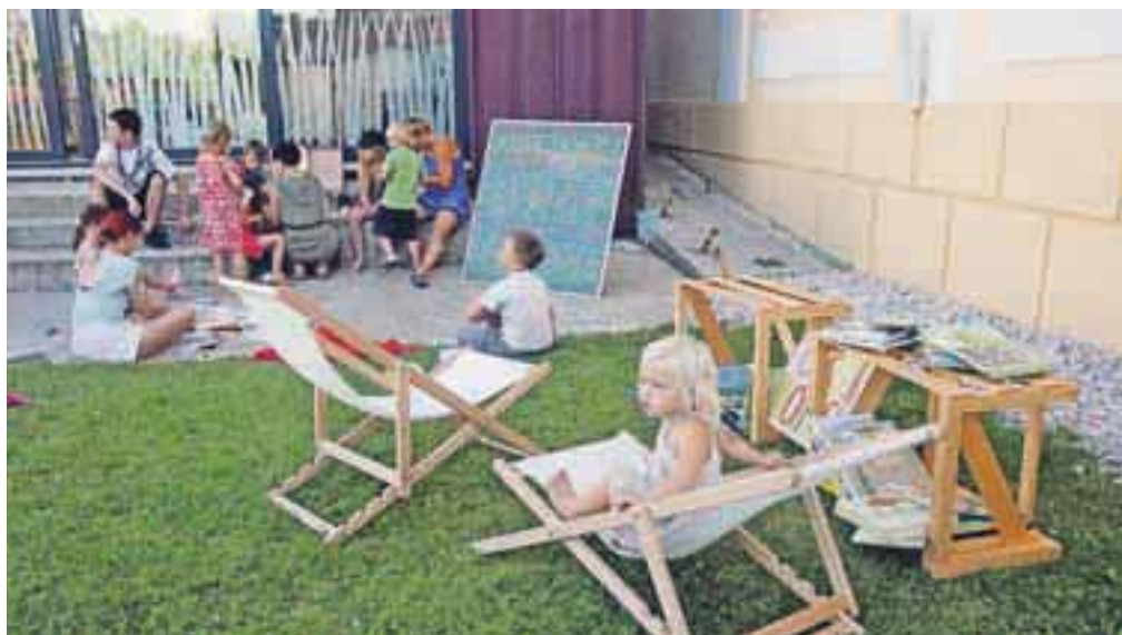
Bralnico radi obiskujejo tudi otroci.