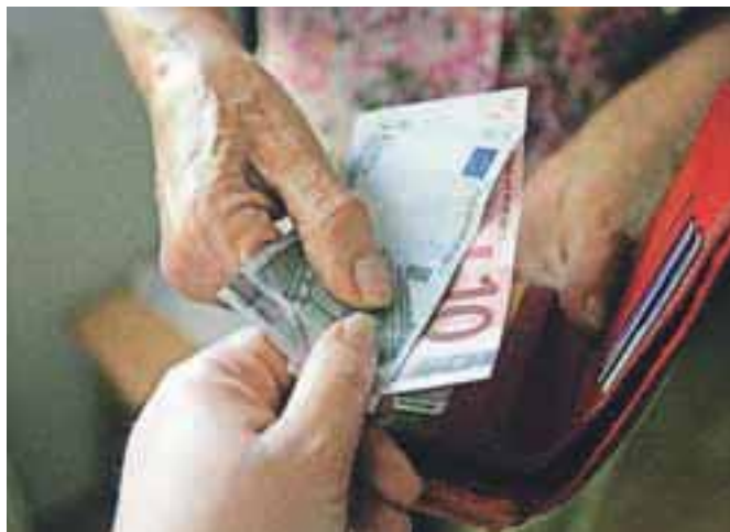
Vse več je ekonomskega nasilja nad starejšimi.

A nasilje nad starejšimi obstaja, kar dokazujejo podatki Centra za socialno delo Škofja Loka. Letos so namreč obravnavali že devet primerov nasilja nad starejšimi osebami. Podatki so konkretni in pretresljivi. V enem primeru je invaliden sin nasilen do mame. Mama se je na centru za socialno delo zglasila sama in spregovorila o dolgotrajnem psihičnem in tudi fizičnem nasilju s strani sina. Pomoč je bila usmerjena v to, da se nasilje ustavi, na dom je hodil tudi javni delavec. Na zdajnjem medinstitucionalnem timu, na katerega so poleg predstavnika policije povabili tudi osebnega zdravnika, so se dogovorili, da za sina uredijo namestitve v ustreznem socialnovarstvenem zavodu. Drugi primer: na centru pomagajo starejšima zakoncema, nad katerima izvaja nasilje sin. Prepo-veduje jima stike z domačimi, omejuje ju pri nakupu osnovnih dobrin. Starša se ga bojita. Tretji primer: na centru je za pomoč zaprosila starejša ženska, nad katero nasilje izvaja mož. Četrti