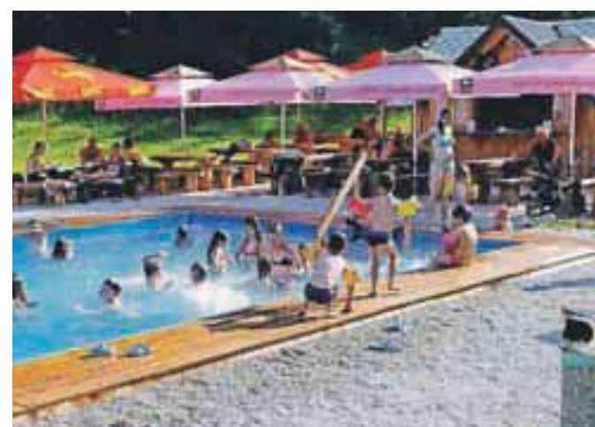
Bazen v Kopačnici je v vročih dneh prava osvežitev za mlado in staro. In tudi pocieni.