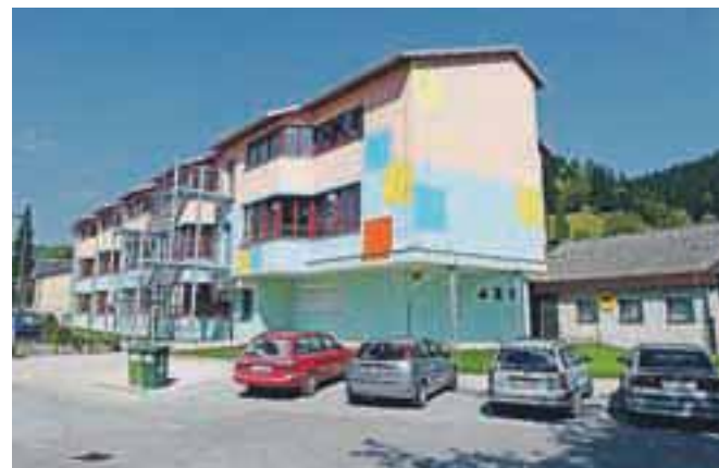
Osnovna šola Žiri je razen cenejšega ogrevanja pridobila tudi nova okna in fasado.