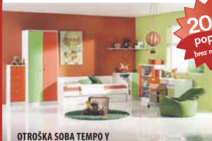
OTROŠKA SOBA TEMPO Y