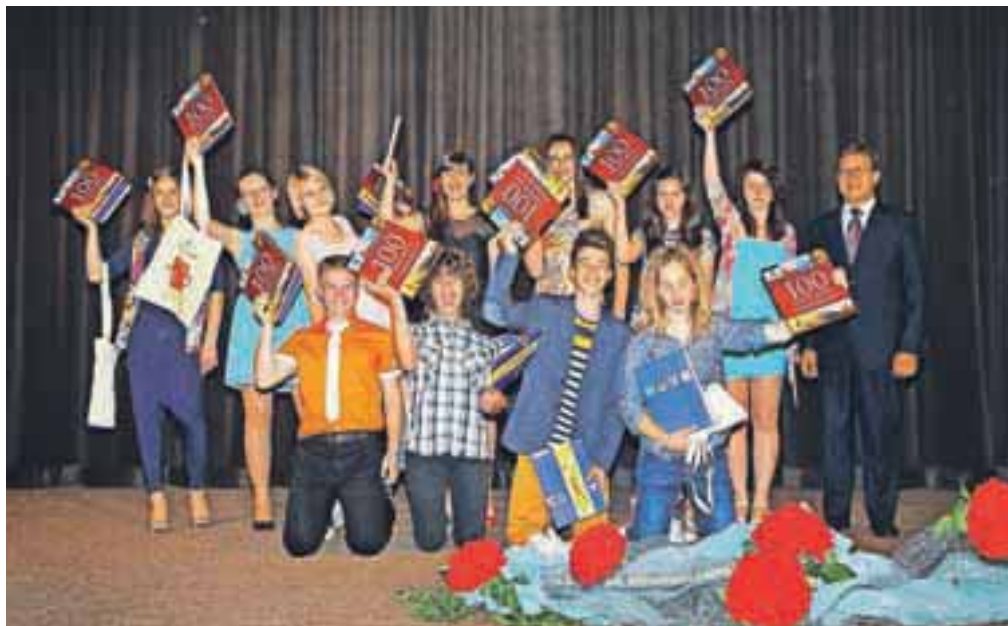
Enajsterica žirovskih najboljših učencev, ki so z učenim uspehom in drugimi dosežki prejeli tudi županovo nagrado.

»Morda se še spominjate prvega dne, ko ste prestopili šolski prag v spremstvu staršev. Tudi danes je podobno, le šolska vrata vas vodijo v življenje,« je nagovor začel župan Janez Žakelj. Na srce jim je položil misel, da naj se ne učijo za šolo, ampak za sebe. »Jeseni se vam odpirajo druga vrata, pisati se bo začela nova zgodba. Sprejmite nove izzive, izkoristite tu pridobljeno znanje in dodajte novo. V življenju boste uspeli, če boste pošteni in iskreni do sebe in ljudi okoli vas,« je še povedal župan in jim dejal še, da naj bodo strpni do drugih in drugačnih. Enajsterici devetošolcev, ki so izstopali po šolskih in drugih uspehih, je župan